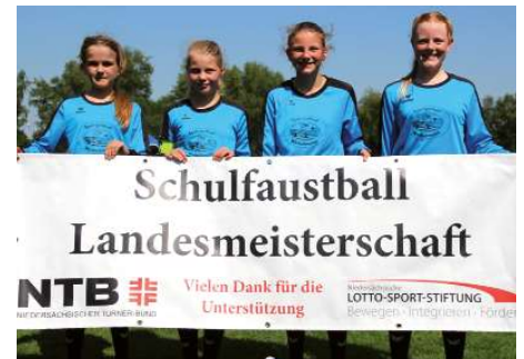
Gymnasium Rahden 3