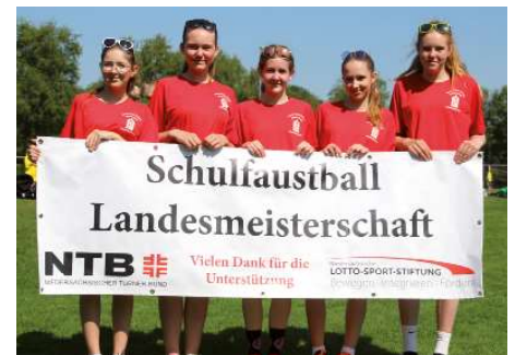
Porta-Coeli-Schule Himmelpforten 1