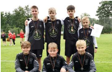
TV Brettorf - 2. Platz.