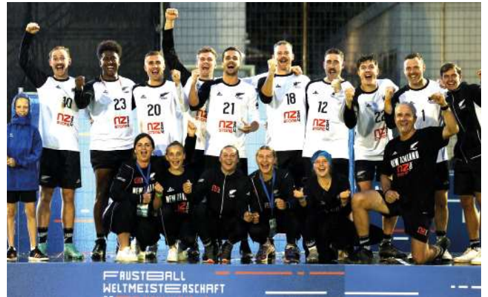
11. Platz - Neuessland.