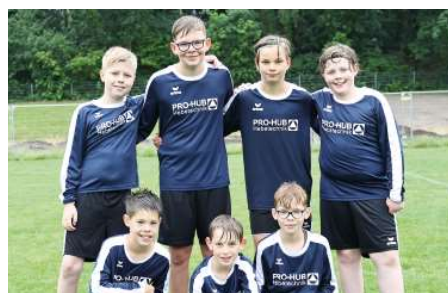
MTV Diepenau - 7. Platz.