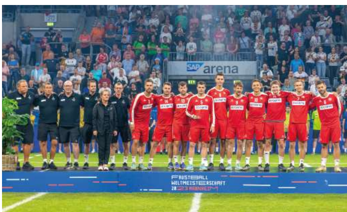
4. Platz - Schweiz.