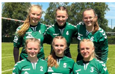
TSV Bardowick - 4. Platz.