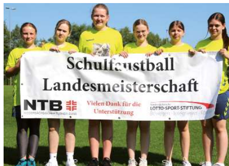
Heinrich-Behnken-Schule Selsingen 1