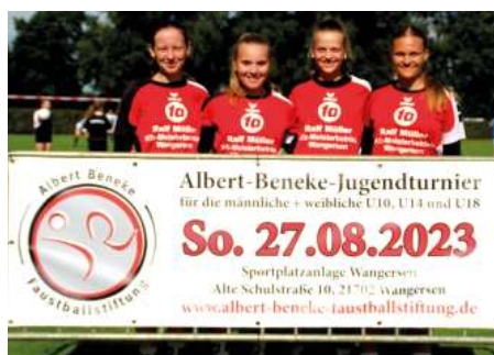
MTV Wangersen 2