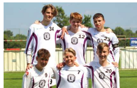
TuS Empelde - 8. Platz.