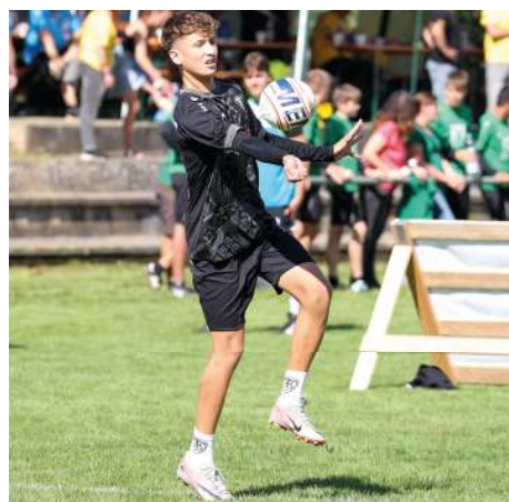
Brettorf bei der Ballannahme.

Die niedersächsischen Faustballer sind bei der Deutschen U18-Meisterschaft in Waibstadt ohne Medaille geblieben. Der TV Brettorf musste dabei mit dem undankbaren vierten Platz die Heimreise aus Baden antreten. Im Viertelfinale hatte der TVB den zweiten NTB-Vertreter, den TuS Empelde, ausgeschaltet, der Platz fünf belegte. Brettorf war mit einer verhältnismäßig jungen Mannschaft ins Turnier gestartet, die im Saisonverlauf kaum Chance hatte, sich in dieser Besetzung einzuspielen.