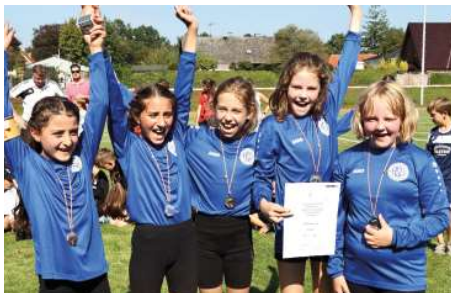
Ahlhorner SV - 2. Platz.