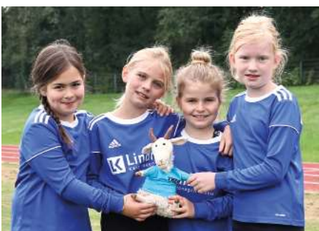
MTV Diepenau - 7. Platz.