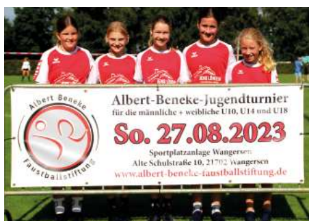
MTV Wangersen 2