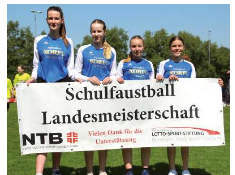
Gymnasium Rahden 3