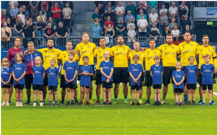
10. Platz - Namibia.