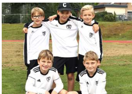
TV Brettorf - 4. Platz.