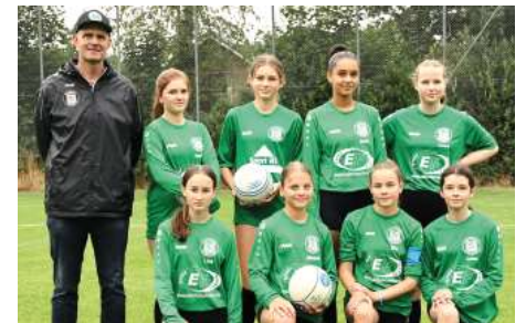
TSV Bardowick - 8. Platz.