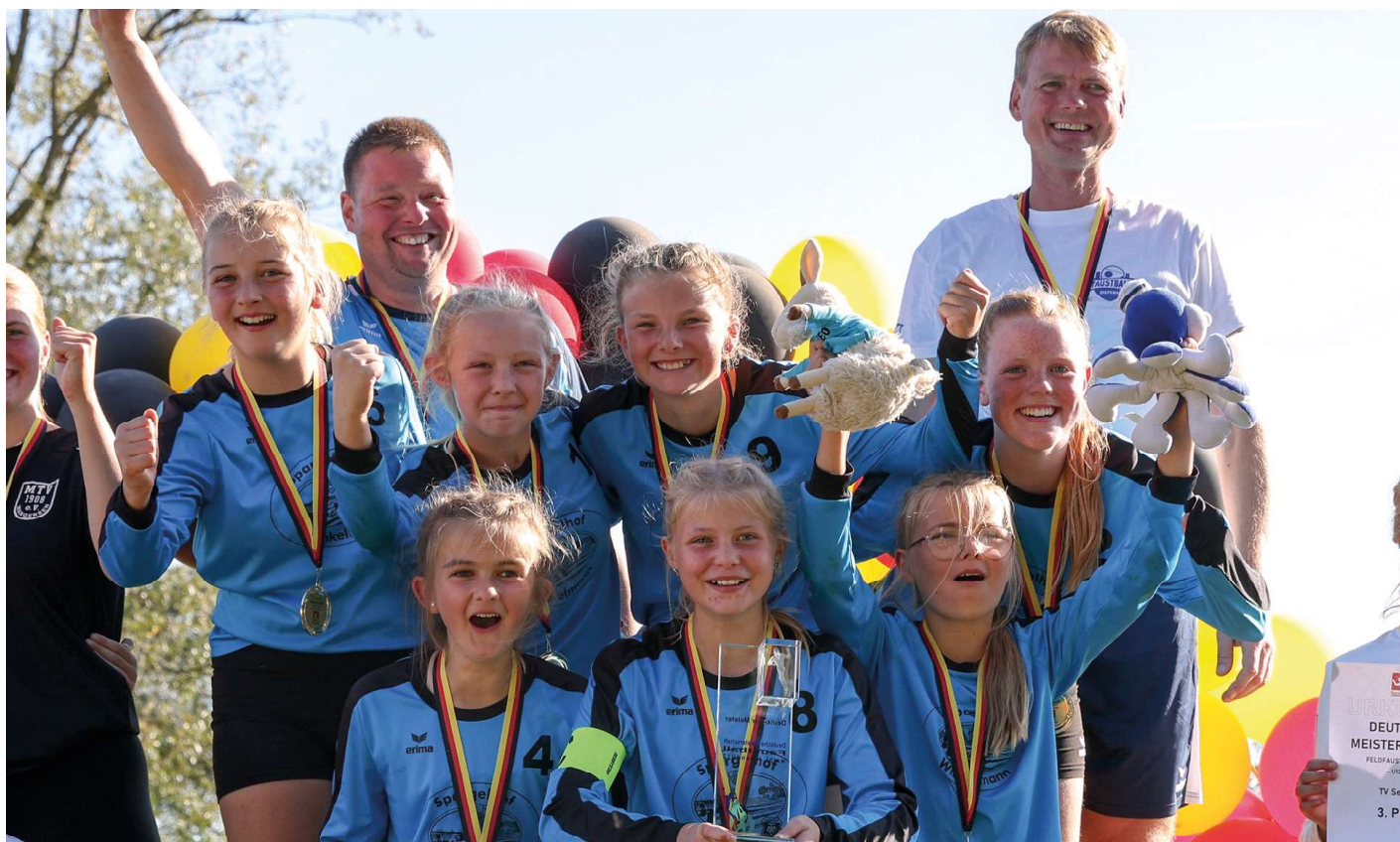
Deutscher Meister: Faustballerinnen aus Diepenau gewinnen Gold.