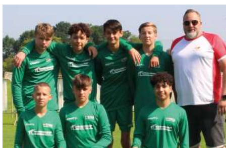
SV Erichshagen - 7. Platz.