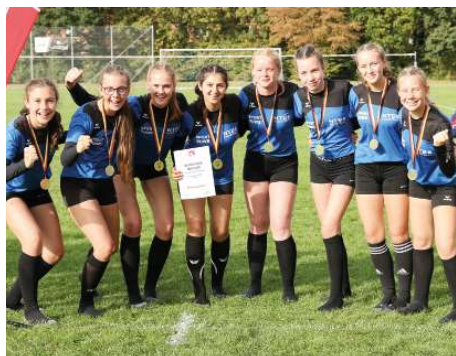
Gold für die U14-Mädchen und die U14- Jungen.