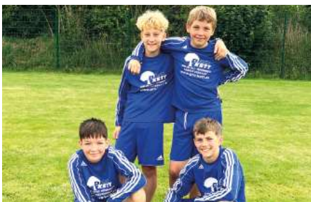
Ahlhorner SV - 3. Platz.