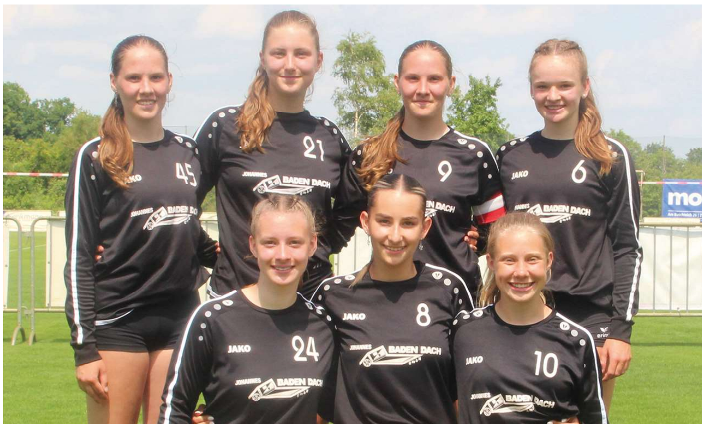
TV Jahn Schneverdingen - 1. Platz.