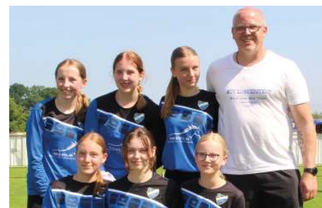
MTV Lübbstedt - 8. Platz.