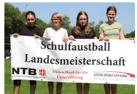
Graf von Zeppelin Schule Ahlhorn 2