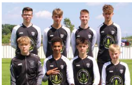
TV Brettorf - 2. Platz.