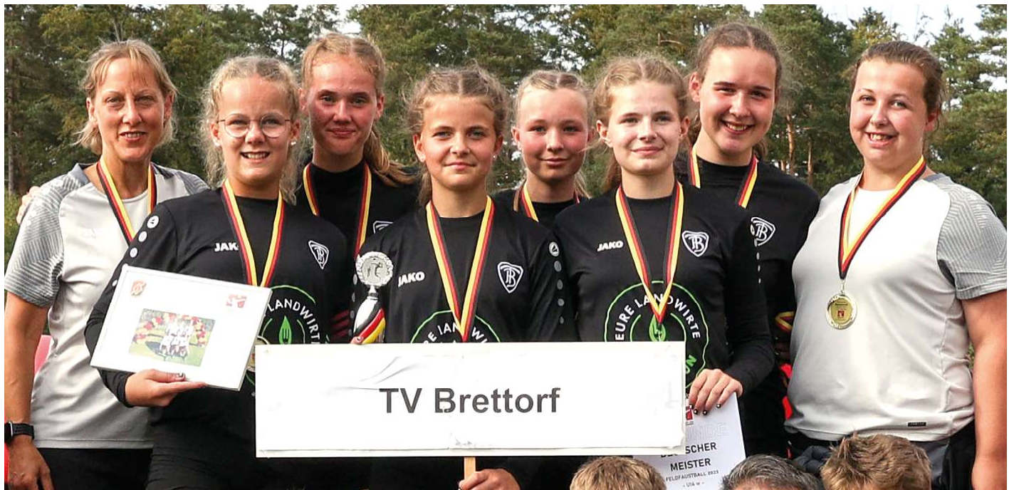
Brettorfer U14-Mädchen gewinnen die Goldmedaillen.