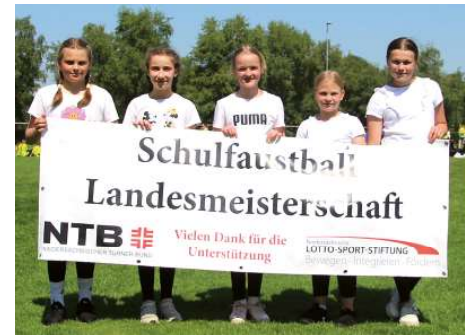
Graf von Zeppelin Schule Ahlhorn 1