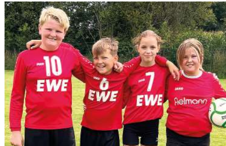
MTV Wangersen - 5. Platz.