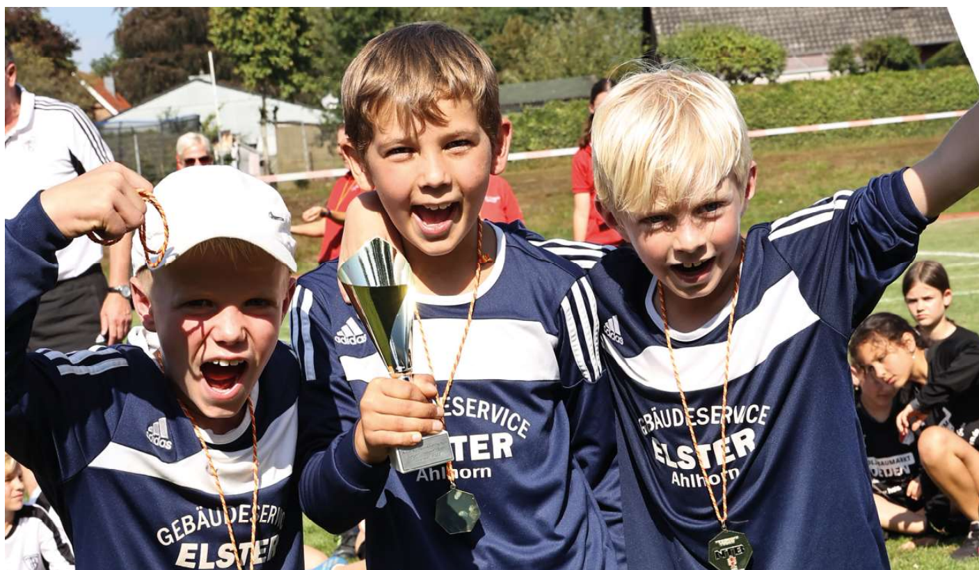
Ahlhorner SV - 1. Platz.