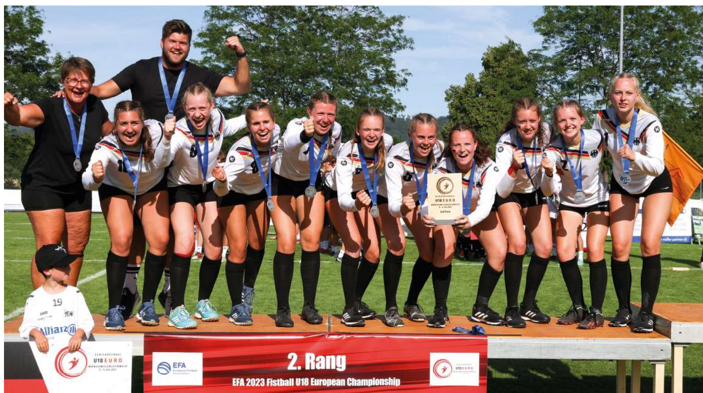
Deutschlands U18-Faustballerinnen jubeln über den Gewinn der Silbermedaillen.