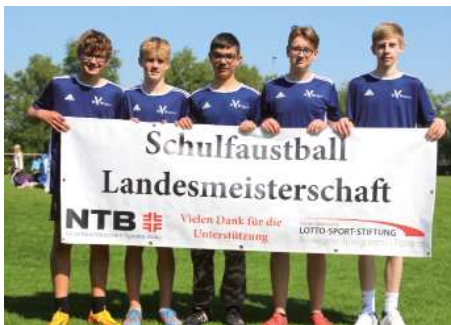
St. Viti Gymnasium Zeven