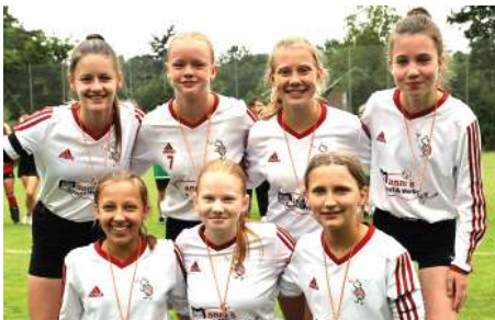
TV Jahn Schneverdingen - 2. Platz.