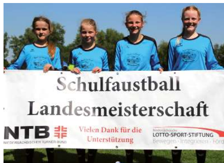
Gymnasium Rahden 3