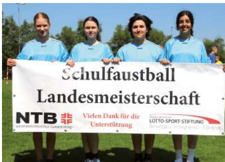
Gymnasium Rahden 1