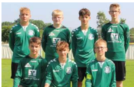
TSV Bardowick - 5. Platz.