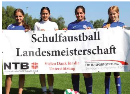
Graf von Zeppelin Schule Ahlhorn 3