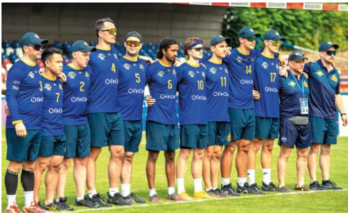
14. Platz - Australien.