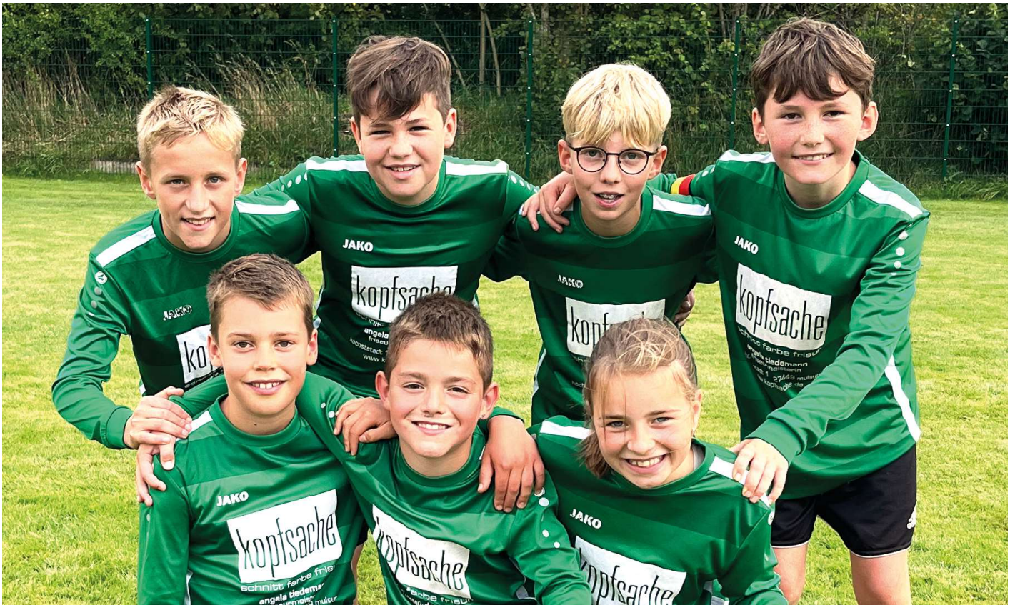
TSV Essel - 1. Platz.