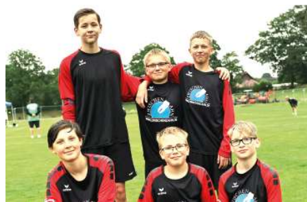
SV Moslesfehn - 6. Platz.