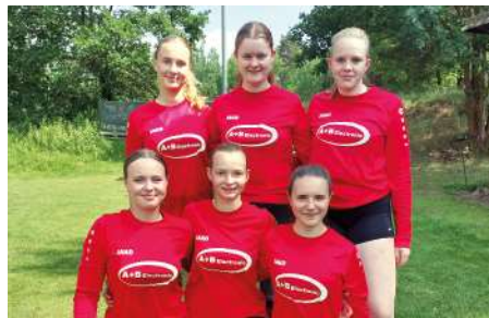
TV Huntlosen - 5. Platz.