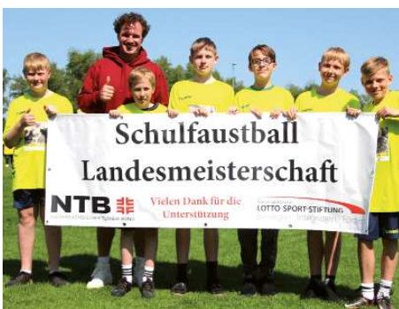
Heinrich-Behnken-Schule Selsingen 4