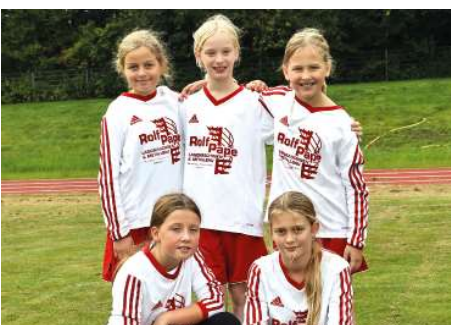
TSV Abbenseth - 4. Platz.