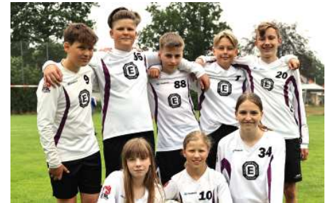
TuS Empelde - 8. Platz.