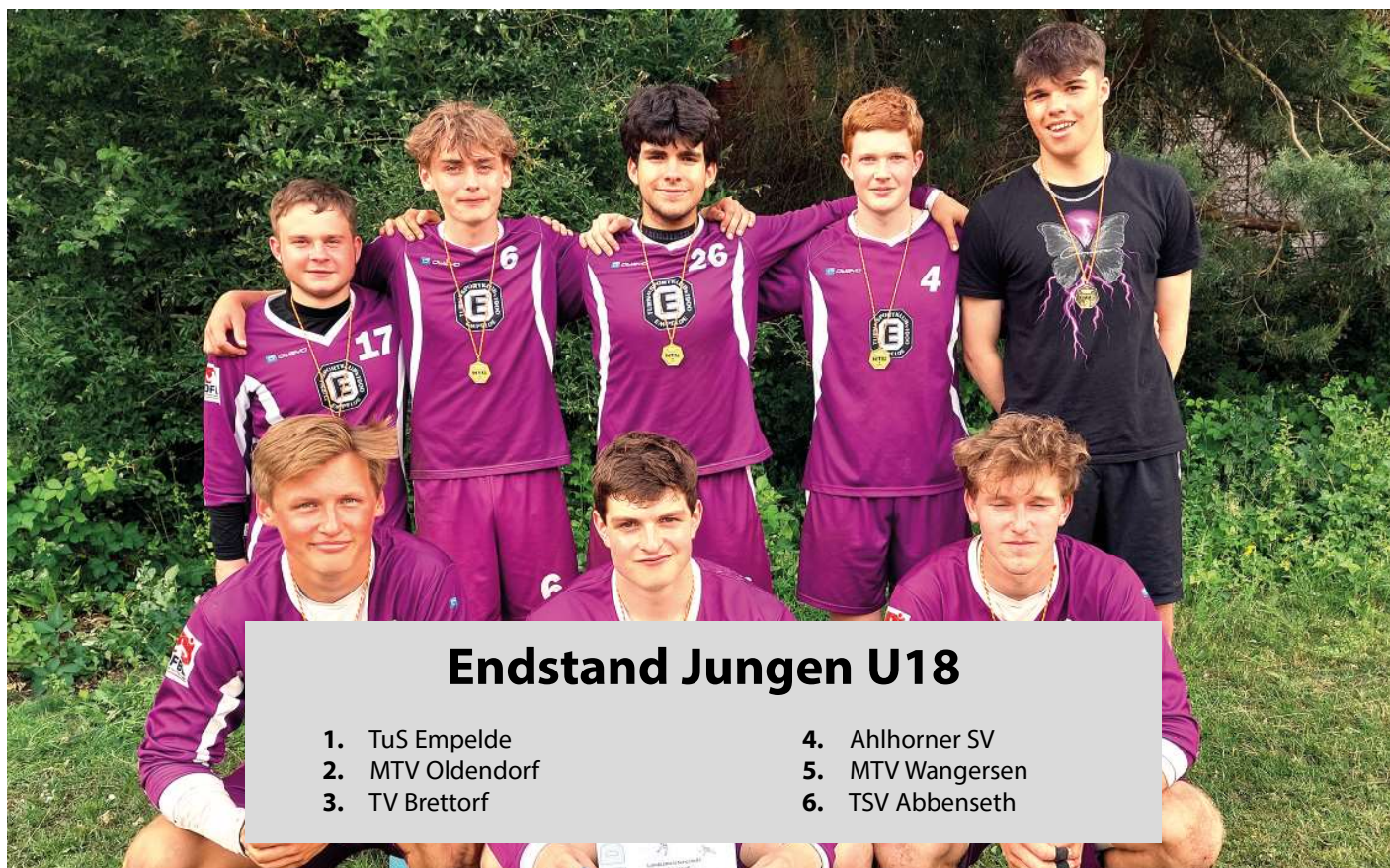
TuS Empelde - 1. Platz.