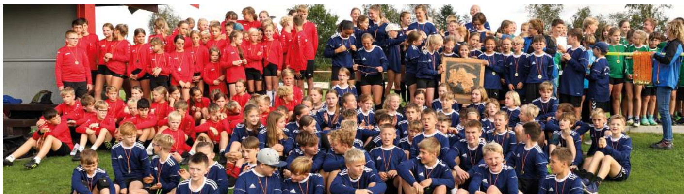
Große Siegerehrung: die teilnehmenden Auswahlteams ließen sich zum Abschluss feiern.