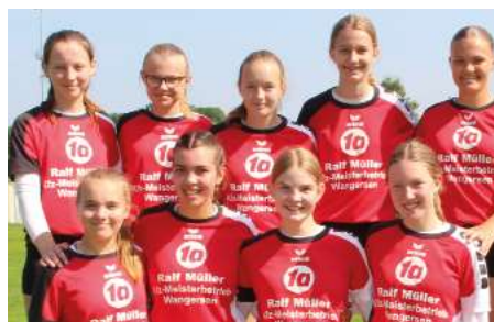
MTV Wangersen - 5. Platz.