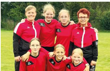
SV Moslesfehn - 3. Platz.