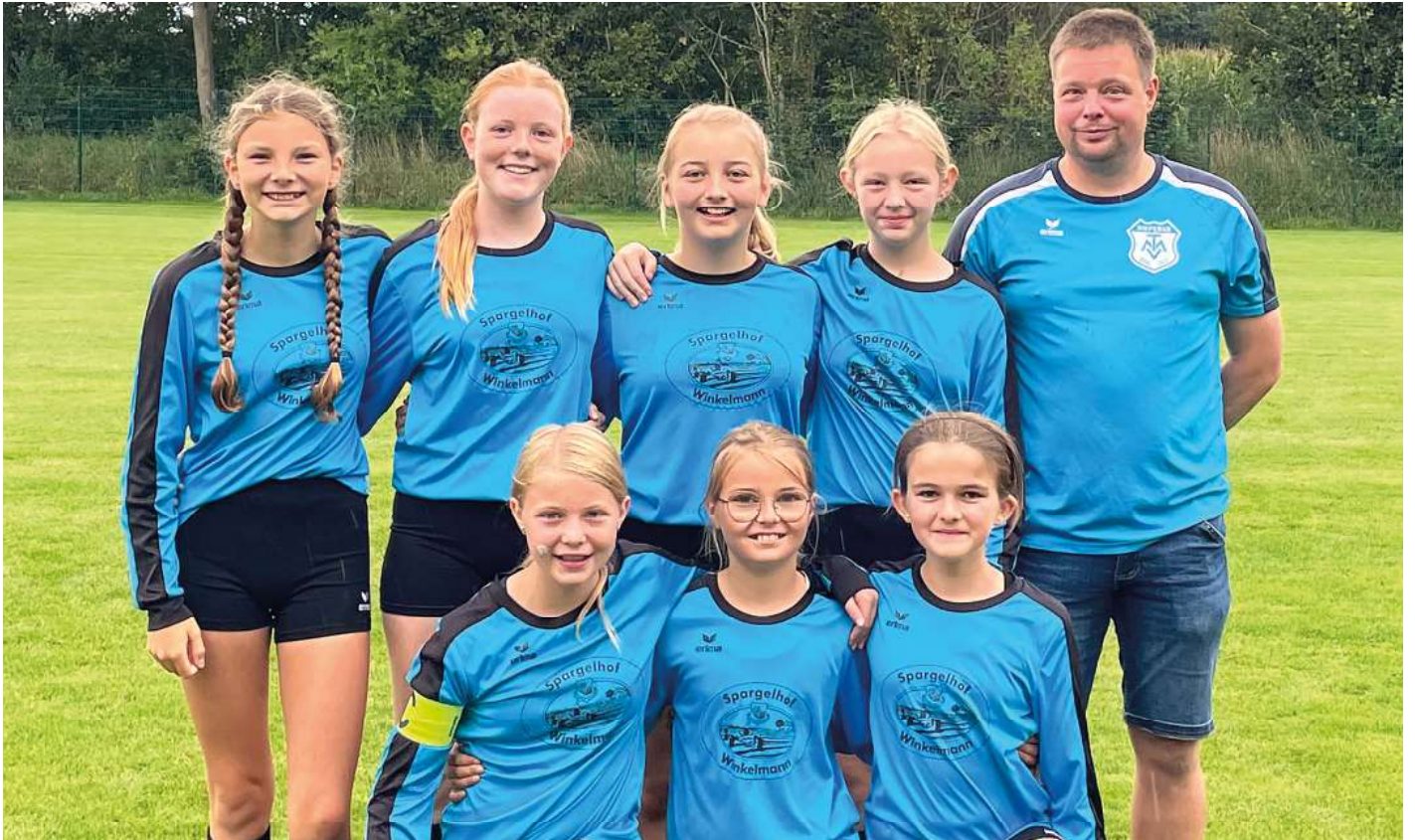
MTV Diepenau - 1. Platz.