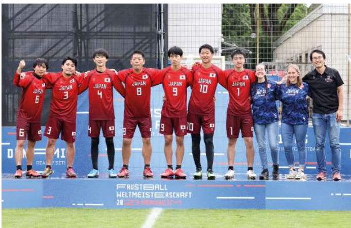
16. Platz - Japan.