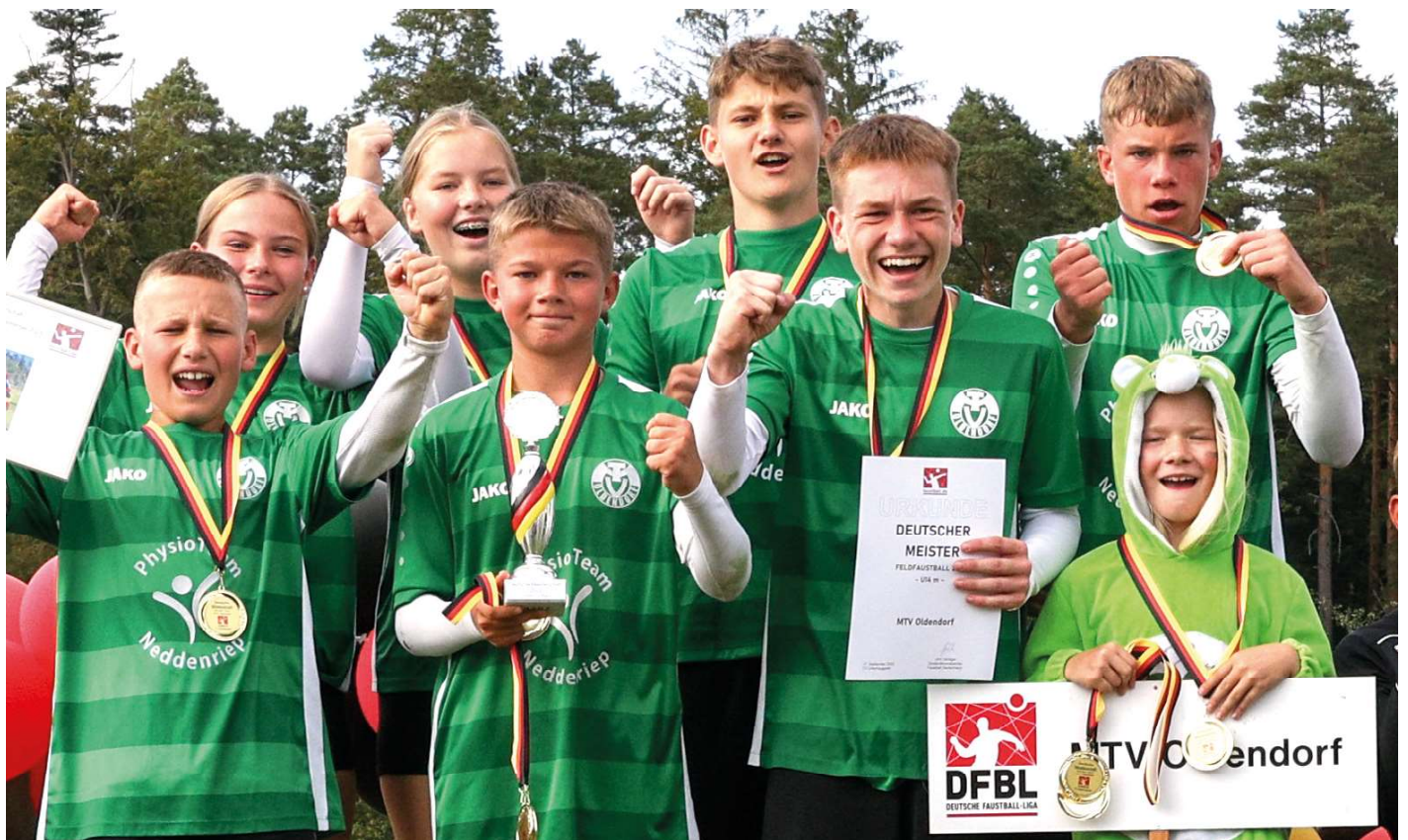
Die Oldendorfer U14-Jungen feiern den Gewinn der Goldmedaillen.