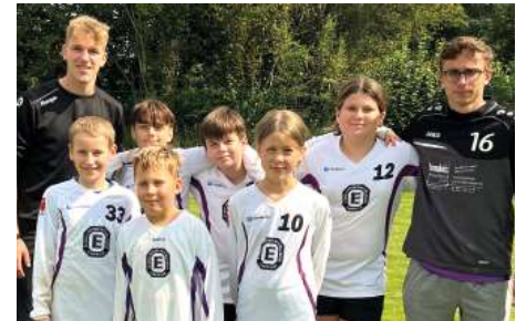
TuS Empelde - 8. Platz.