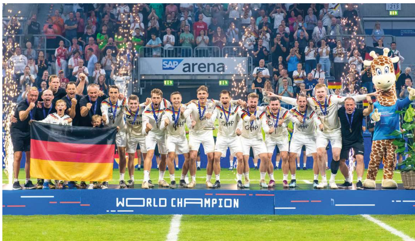
Auch bei der Heim-WM in Mannheim konnten die Männer den Titel verteidigen.