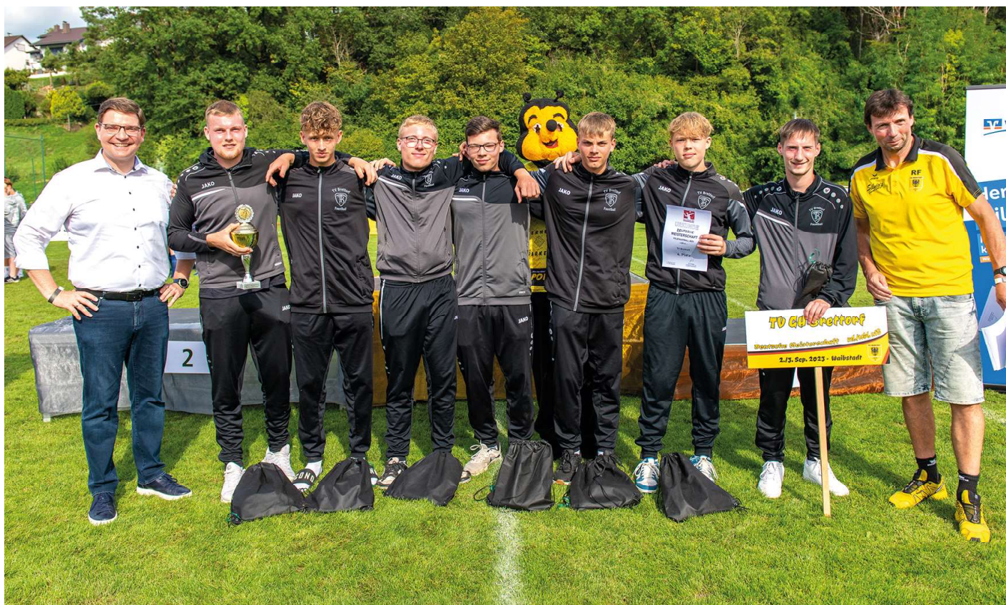
Platz vier für die Brettorfer Jungen.