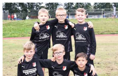
MTSV Selsingen - 3. Platz.