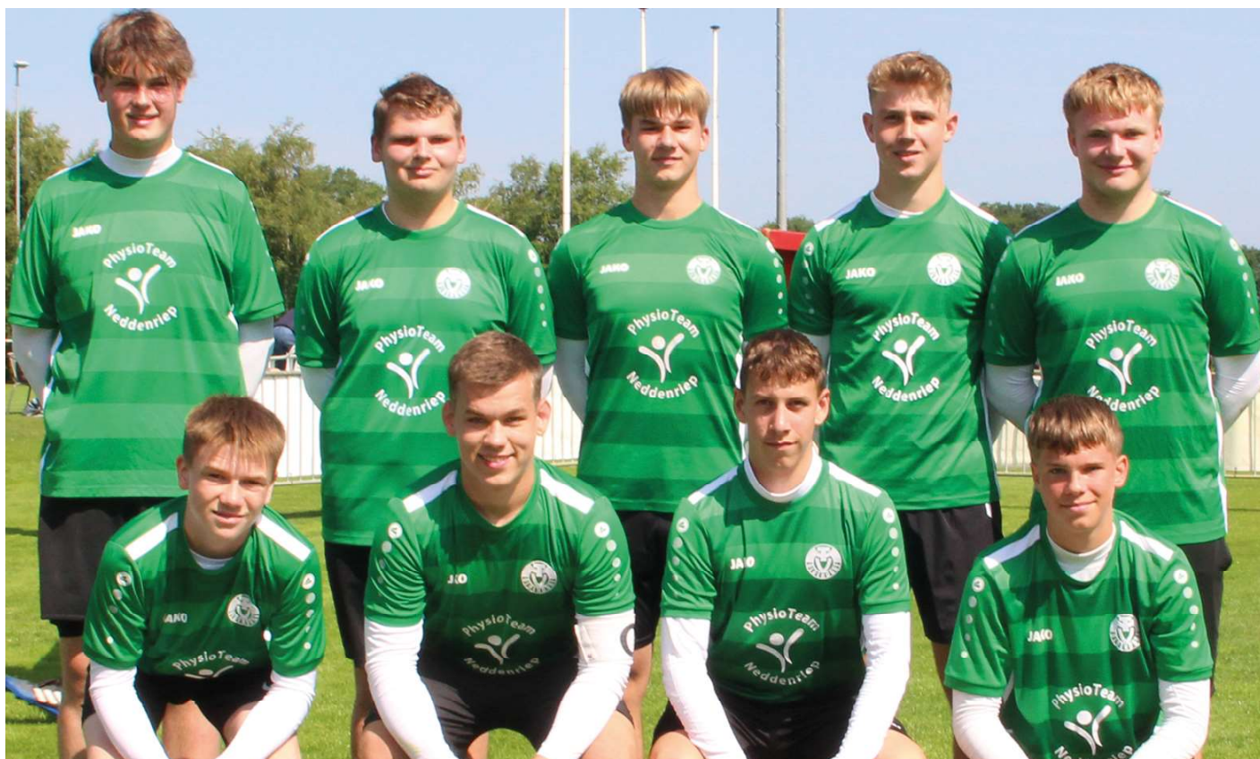
MTV Oldendorf - 1. Platz.