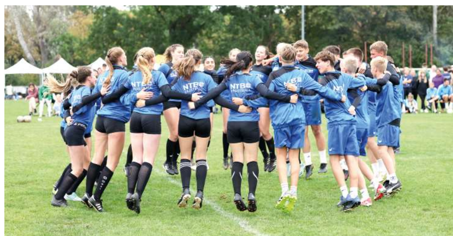
Gemeinsam jubelt es sich am besten: die NTB-Auswahlteams im Siegerkreis