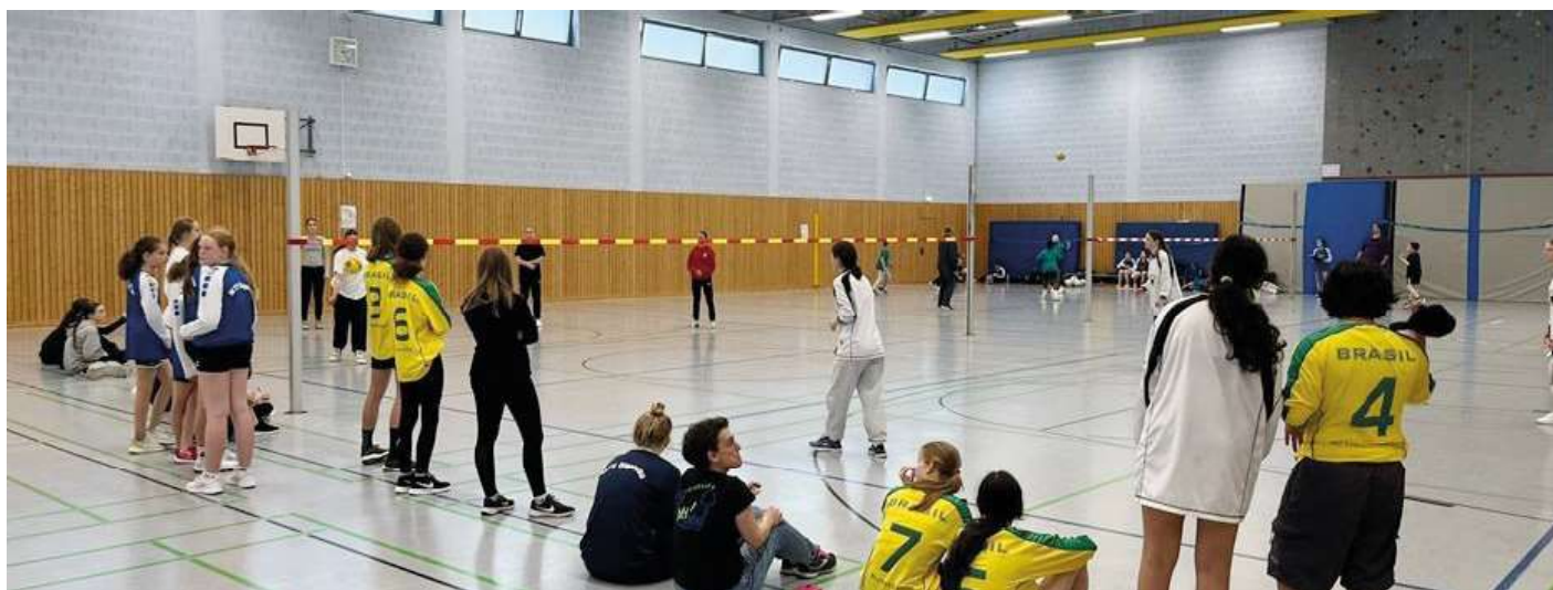
52 Schulfaustballmannschaften aus dem Bezirk Hannover spielten auf zwölf Feldern am Donnerstag in Empelde.