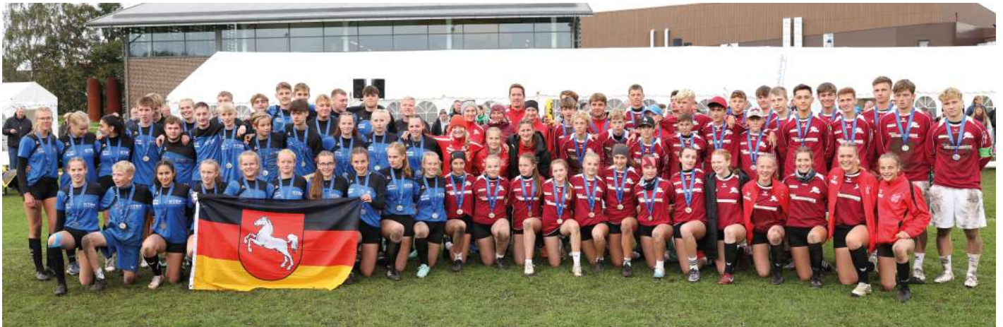
Sieger aus Deutschland und Österreich: die erfolgreichen Delegationen aus Niedersachsen und Oberösterreich beim gemeinsamen Siegerbild.