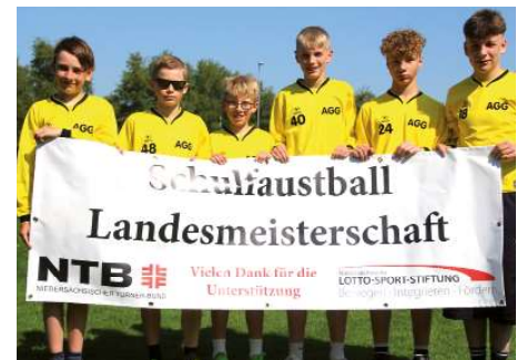
Aue-Geest-Gymnasium Harsefeld 4