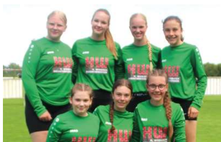
TSV Essel - 3. Platz.