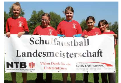
Porta-Coeli-Schule Himmelpforten 2