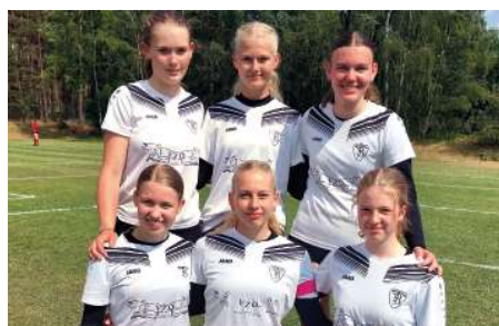
TV Brettorf - 7. Platz.