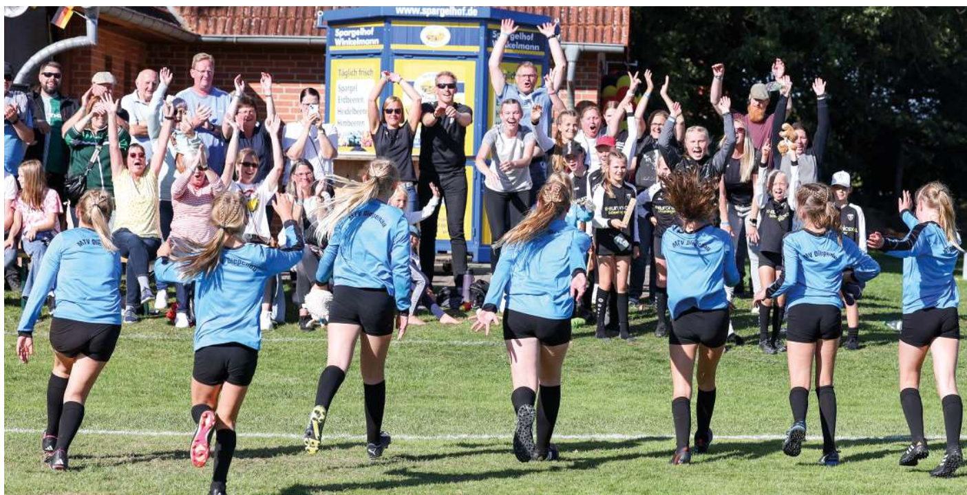
Jubeln wie die Großen: Die U12-Mädchen des MTV Diepenau lassen sich nach dem Gewinn des DM-Titels von den Fans feiern. Fotos usp