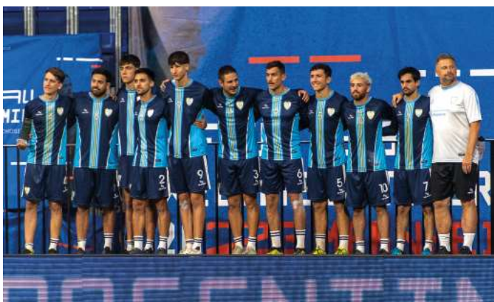
6. Platz - Argentinien.