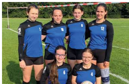
Wardenburger TV - 6. Platz.