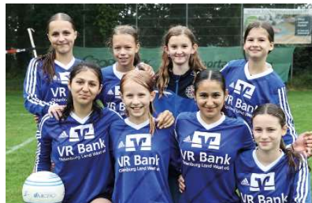
Ahlhorner SV - 5. Platz.