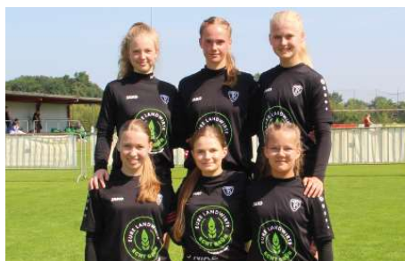
TV Brettorf - 2. Platz.