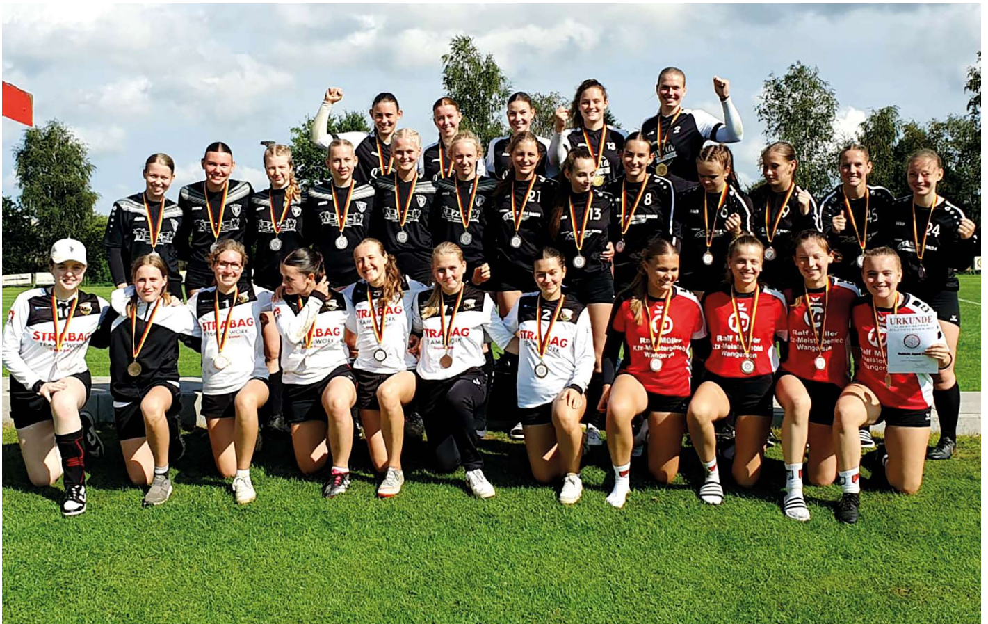
Siegerehrung der U18-Mädchen.

* Der TSV Abbenseth musste leider kurzfristig absagen.