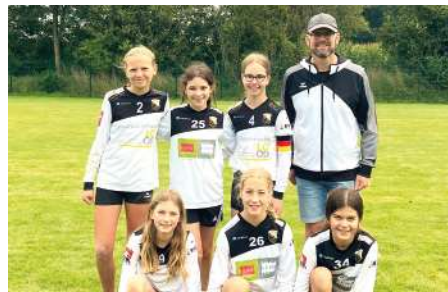
TSV Borgfeld - 5. Platz.