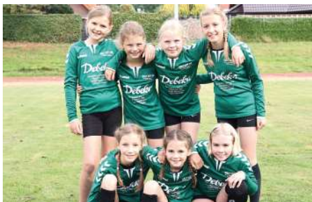
TSV Bardowick - 3. Platz.