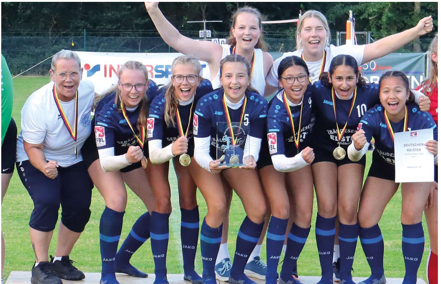
Ahlhorns U16-Mädchen gewinnen die Goldmedaillen.