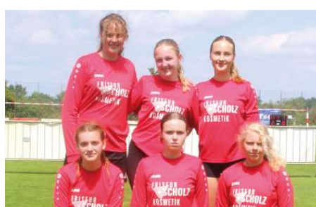
TV Huntlosen - 7. Platz.