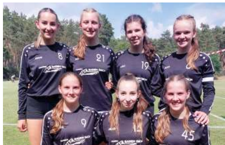
TV Jahn Schneverdingen - 2. Platz.