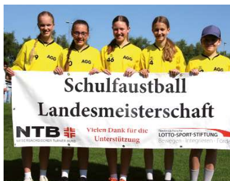
Aue-Geest-Gymnasium Harsefeld 3