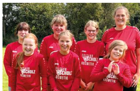
TV Huntlosen - 7. Platz.