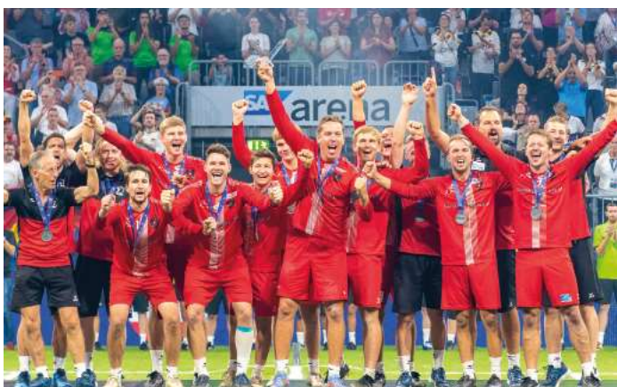
2. Platz - Österreich.