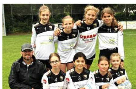
TSV Borgfeld - 7. Platz.