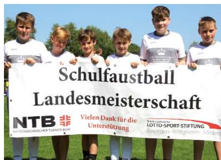
IGS Am Kreideberg Lüneburg 1