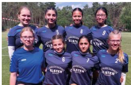
Ahlhorner SV - 3. Platz.