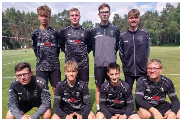
TV Brettorf - 3. Platz.