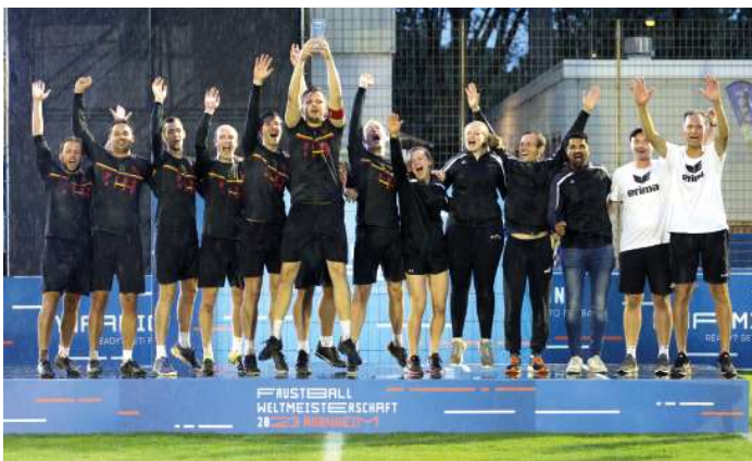
12. Platz - Belgien.