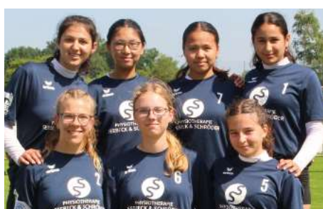
Ahlhorner SV - 4. Platz.