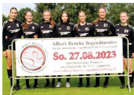
TV Jahn Schneverdingen