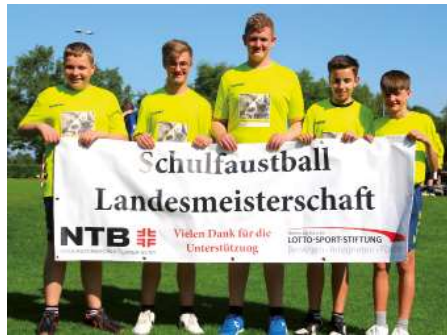
Heinrich-Behnken-Schule Selsingen 2