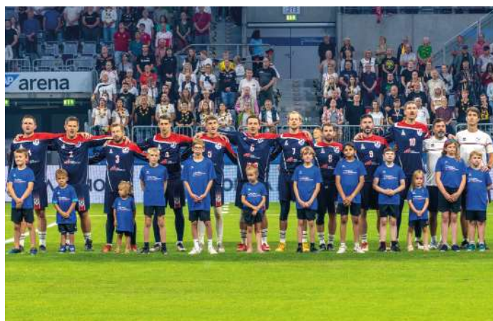
9. Platz - USA.