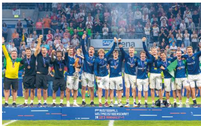
3. Platz - Brasilien.