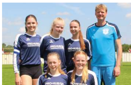
MTV Diepenau - 6. Platz.