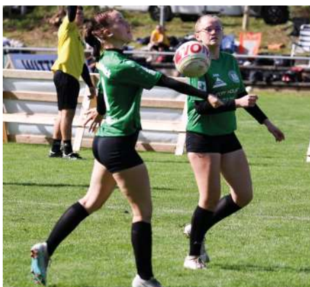
Bardowick beim Spielaufbau.

daille die Heimreise antreten musste. Bardowick hatte, nach der Auftaktniederlage gegen den ASV, auch gegen Kellinghusen (6:11, 7:11) und Vaihingen/Enz (6:11, 5:11) verloren, mit einem Sieg gegen Pfungstadt (11:4, 11:5) die Gruppenphase mit Platz vier abgeschlossen. Mit Siegen gegen den TV Bretten (9:11, 11:8, 11:4) und die SG Karlsdorf/Käfertal (11:9, 11:7) bewiesen die TSV-Spielerinnen aber noch einmal ihr Können und holten am Sonntag mit Platz sieben das Maximum heraus. (ssp)