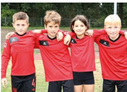
SV Moslesfehn - 7. Platz.