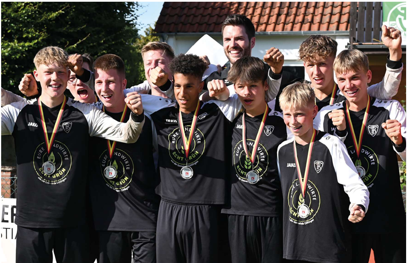
Die erfolgreichen Brettortfer Jungen mit den Silbermedaillen.