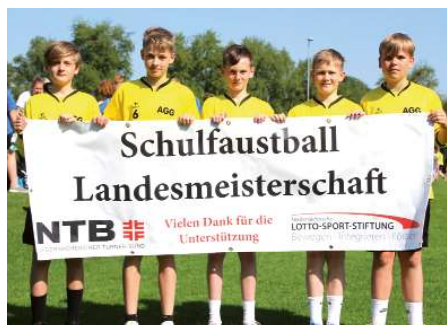
Aue-Geest-Gymnasium Harsefeld 2