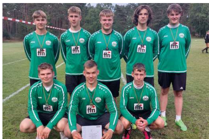
MTV Oldendorf - 2. Platz.