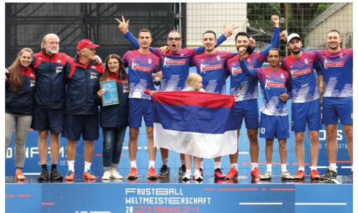
15. Platz - Serbien.