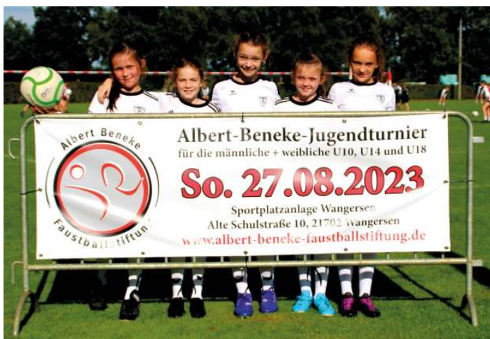
TV Brettorf 2