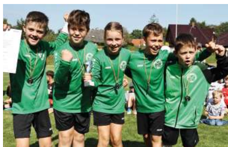
TSV Essel 1 - 2. Platz.