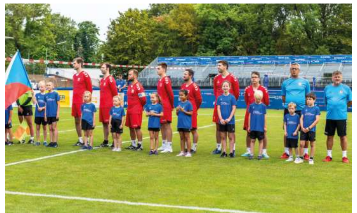
13. Platz - Tschechien.