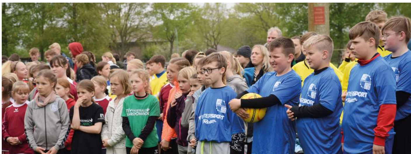
64 Mannschaften spielten in 16 Spielklassen die Sieger aus.