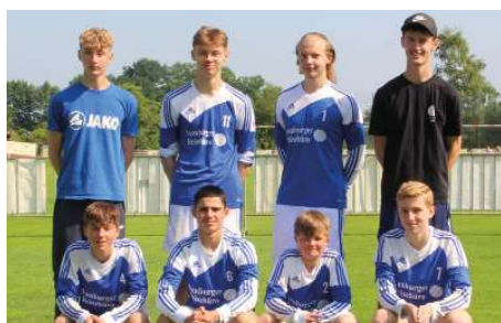
Ahlhorner SV - 4. Platz.