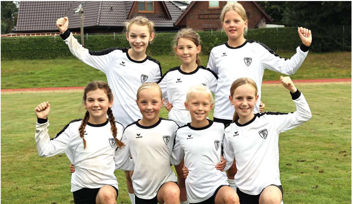
TV Brettorf - 1. Platz.