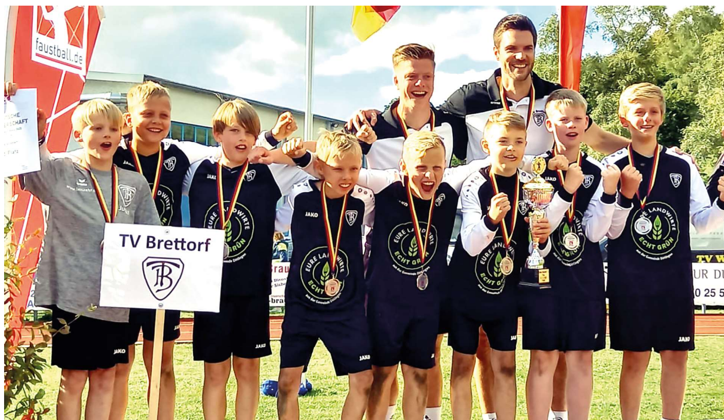
Die Brettorfer Jungen jubeln mit den Silbermedaillen.