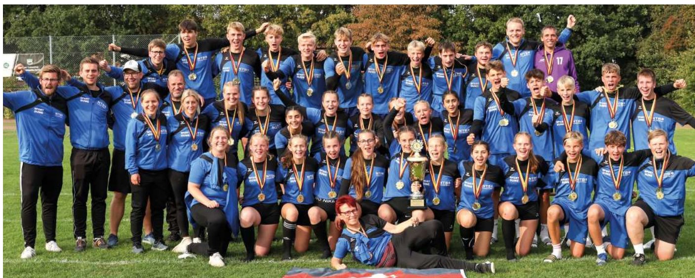
So jubelt der Sieger beim Deutschland-Pokal: Die Delegation des Niedersächsischen Turner-Bundes gewann in Empelde den Titel.