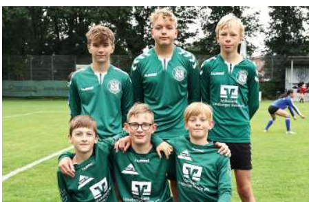
TSV Bardowick - 4. Platz.