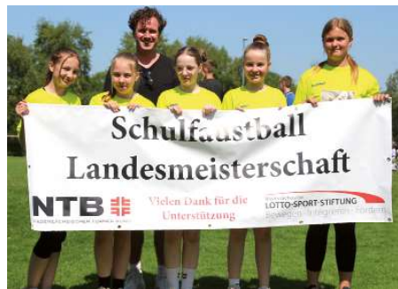
Heinrich-Behnken-Schule Selsingen 3