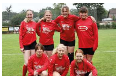
TV Huntlosen - 6. Platz.