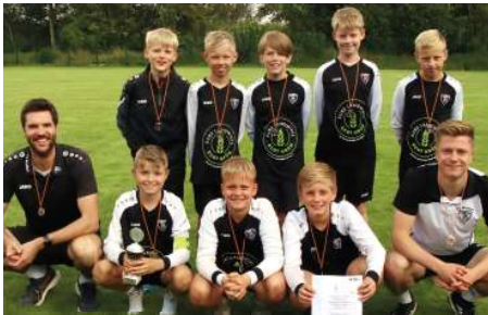
TV Brettorf - 2. Platz.