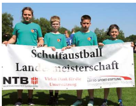
R.-Bembenbeck-Gesamtschule Burgdorf 1