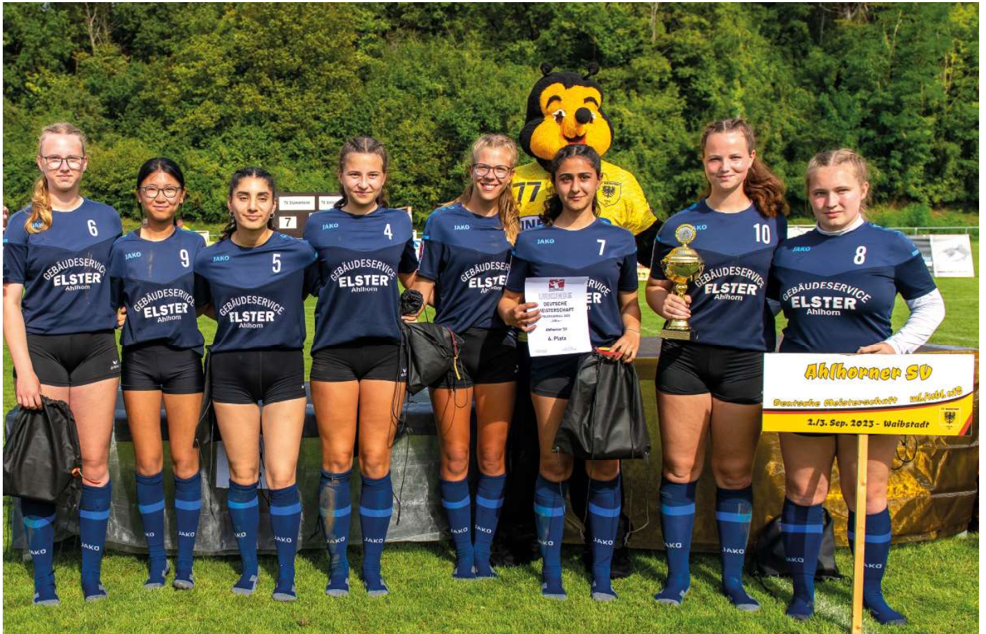
Ahlhorns Faustballerinnen erreichen den vierten Platz.