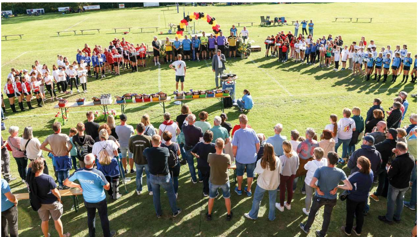
Gebührender Rahmen: Vor großer Kulisse fand die Siegerehrung bei der DM der weiblichen U12 in Diepenau statt.