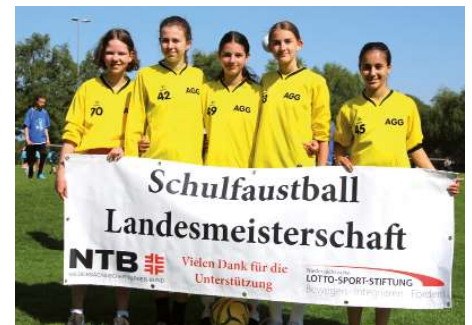
Aue-Geest-Gymnasium Harsefeld 6