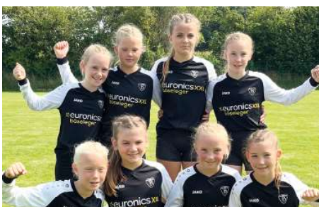
TV Brettorf - 4. Platz.