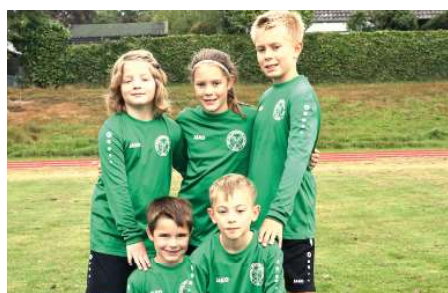
TSV Essel 2 - 6. Platz.