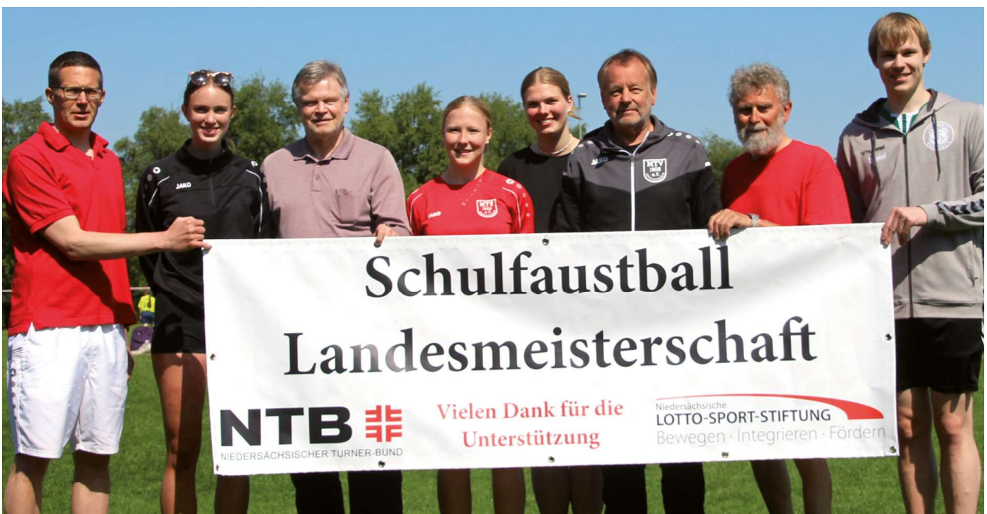
Das Orga-Team der Landesmeisterschaft.