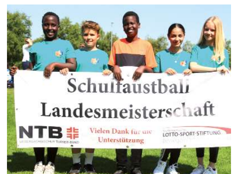
R.-Bembenbeck-Gesamtschule Burgdorf 2