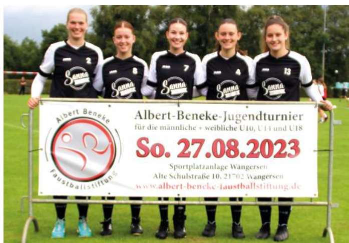
MTV Wangersen 1