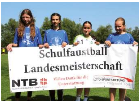
Realschule Wildeshausen 1