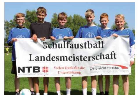
Realschule Wildeshausen 2