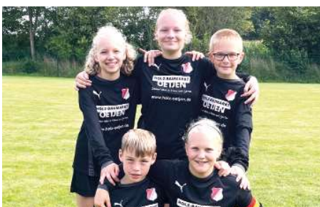
MTSV Selsingen - 4. Platz.