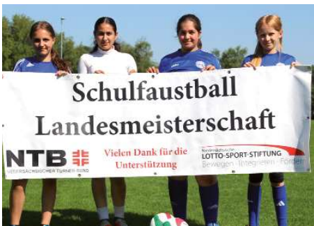
Graf von Zeppelin Schule Ahlhorn 3