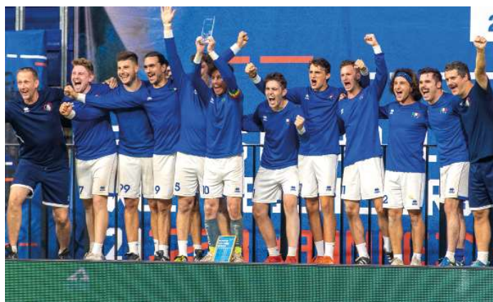
7. Platz - Italien.