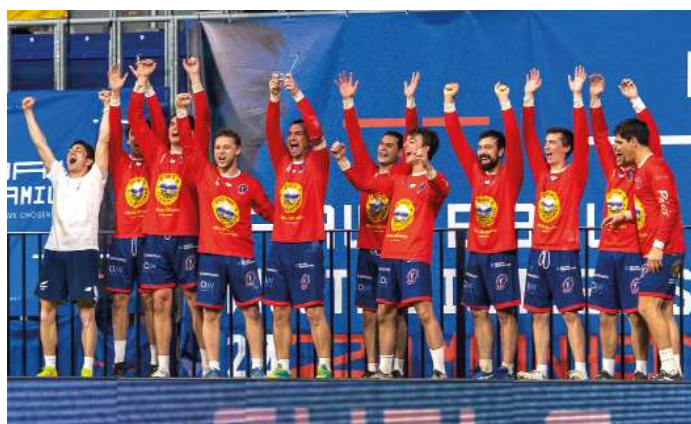
5. Platz - Chile.