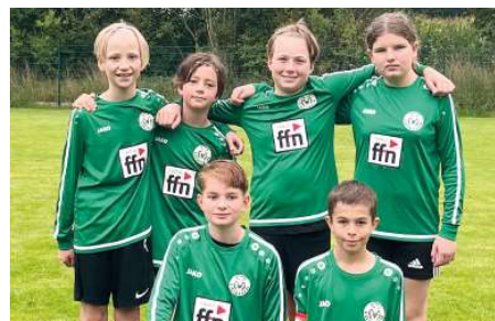
MTV Oldendorf - 6. Platz.