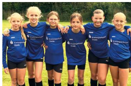
SV Düdenbüttel - 6. Platz.