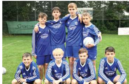
Ahlhorner SV - 5. Platz.