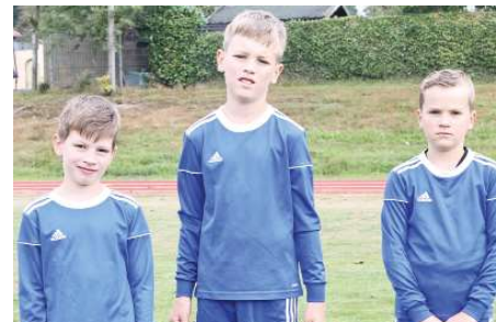
Wardenburger TV - 8. Platz.