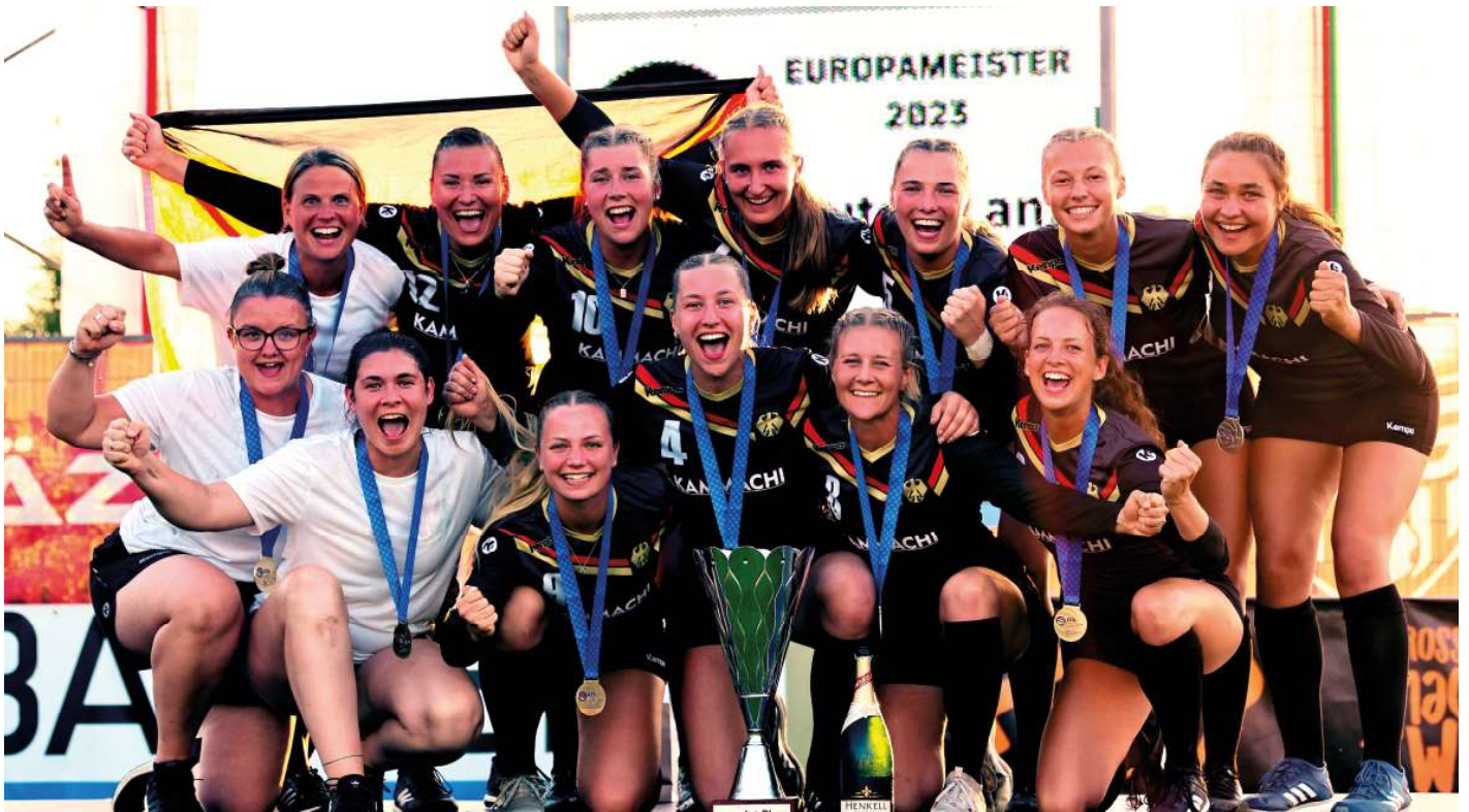
Die Frauen-Nationalmannschaft verteidigt den Europameistertitel im österreichischen Grieskirchen.