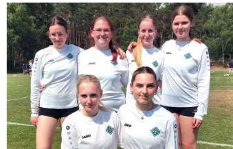
TuS Bothfeld 04 - 8. Platz.