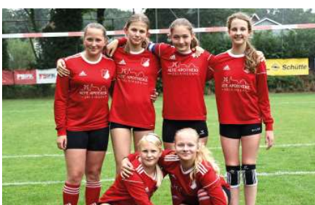
MTSV Selsingen - 4. Platz.