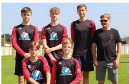
SV Moslesfehn - 6. Platz.