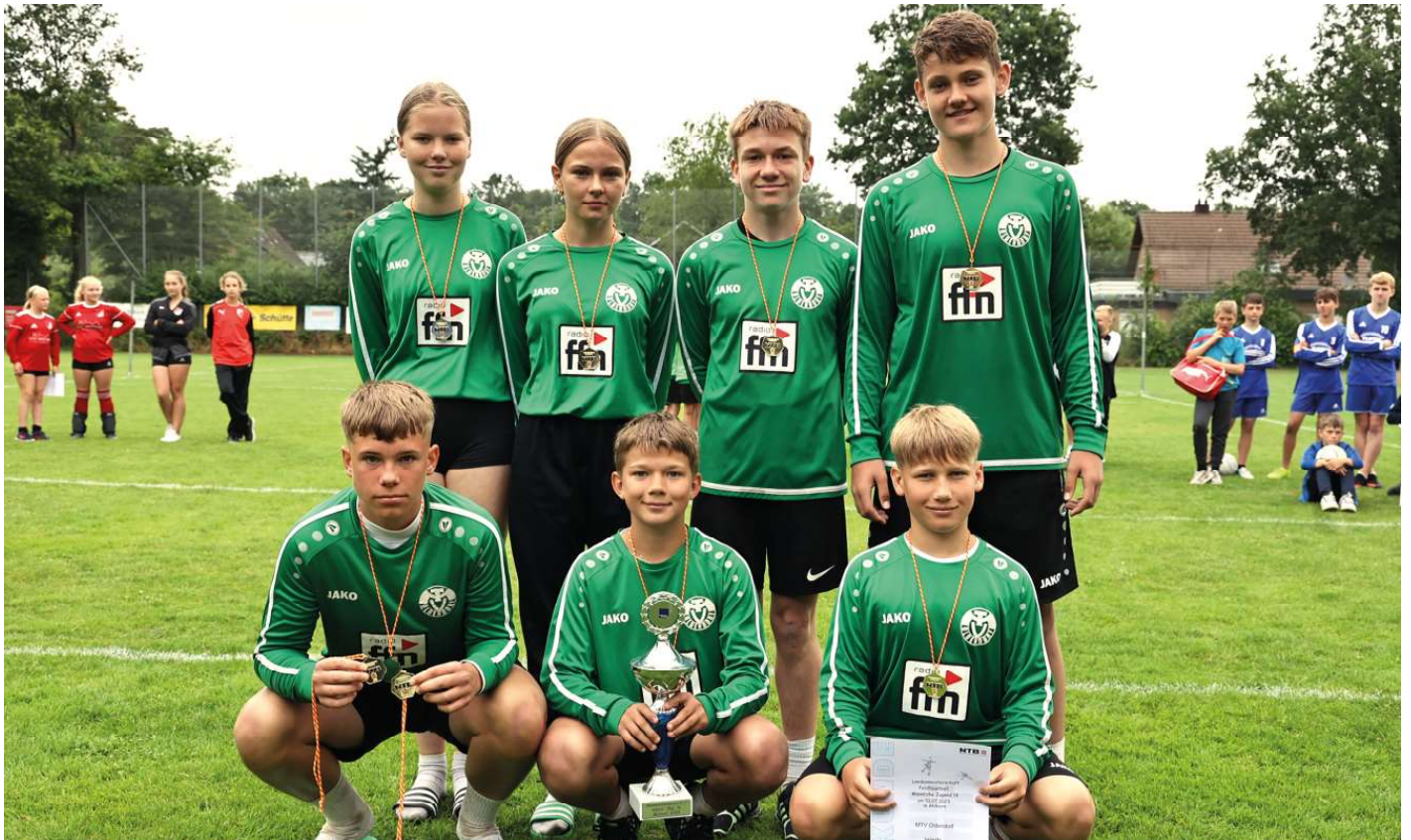
MTV Oldendorf - 1. Platz.