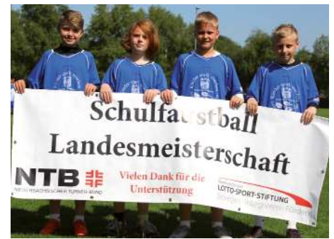
Realschule Wildeshausen 3