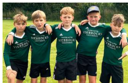
SV Ruschwedel - 7. Platz.