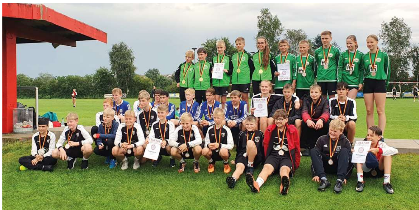
Siegerehrung der U14-Jungen.