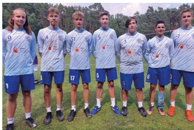
Ahlhorner SV - 4. Platz.