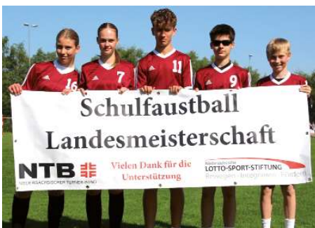
Gymnasium Wildeshausen 1