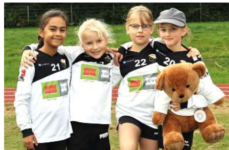
TSV Borgfeld - 5. Platz.