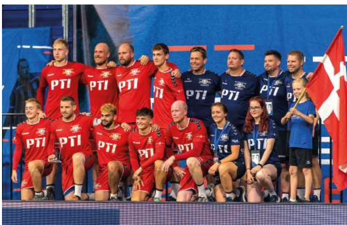
8. Platz - Dänemark.