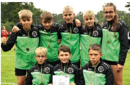
TSV Essel - 3. Platz.