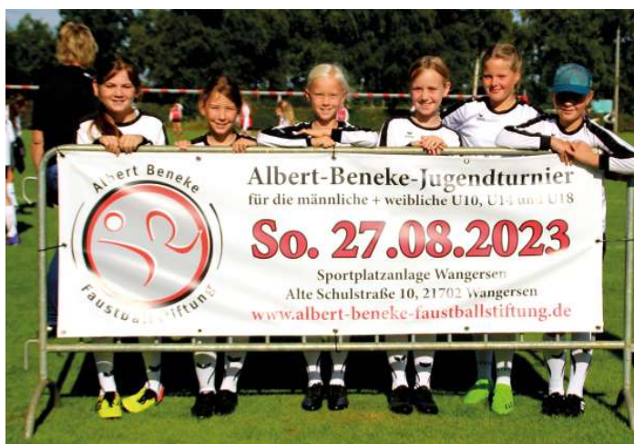
TV Brettorf 1