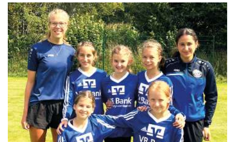
Ahlhorner SV - 8. Platz.