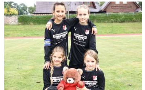
MTSV Selsingen - 8. Platz.