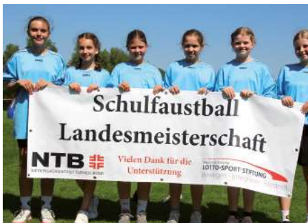
Gymnasium Rahden 2