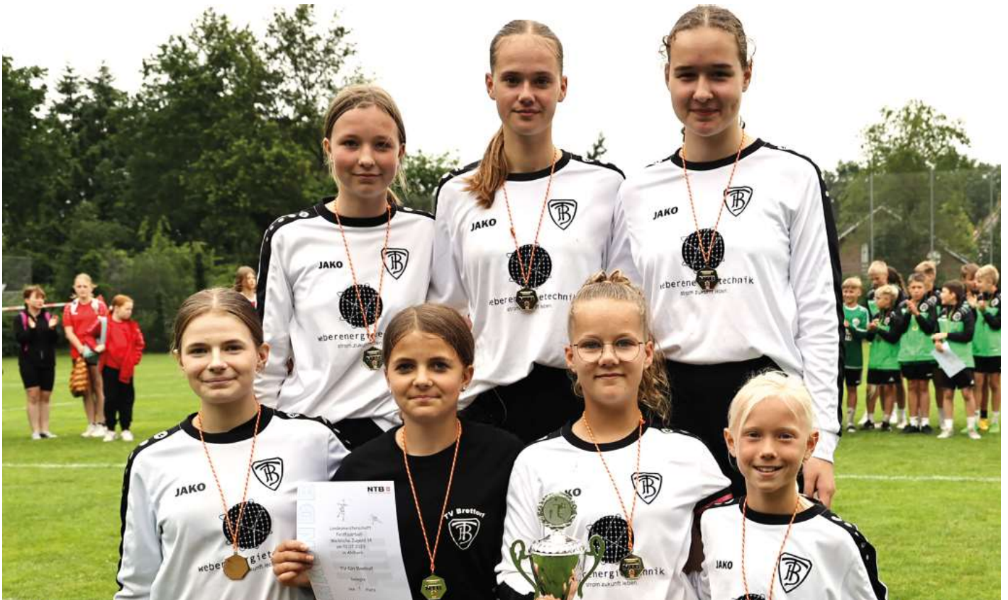
TV Brettorf- 1. Platz.