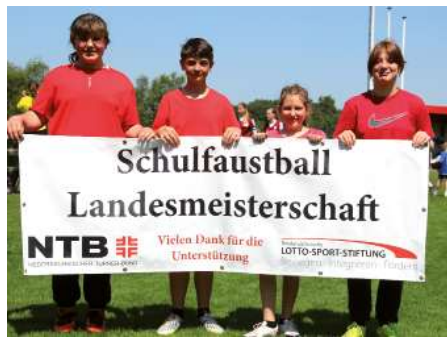
Graf von Zeppelin Schule Ahlhorn 4