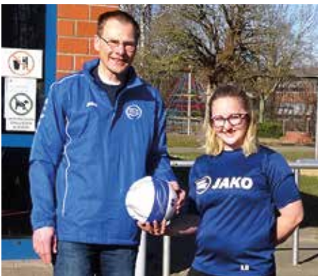
Übergabe der zwölf neuen Faustbälle an das Gymnasium Rahden.

Nachdem in den vergangenen Jahren immer mehr Faustbälle aus dem Bestand vom Gymnasium Rahden aufgrund von normalem Verschleiß ausfielen, konnte zum Beispiel im Dezember 2021 die Unterrichtseinheit Faustball nur mit Hilfe von zusätzlichen Faustbällen vom MTV Nordel stattfinden.