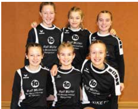
MTV Wangersen - 4. Platz.