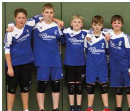
Ahlhorner SV - 5. Platz.