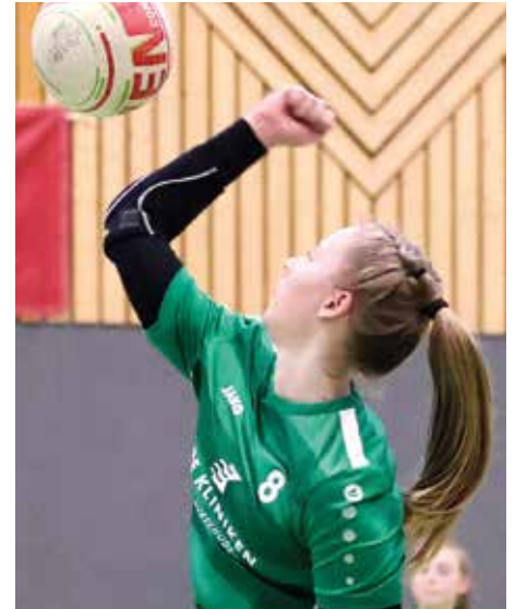
... beim Angriff.