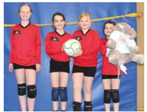
SV Moslesfehn - 6. Platz.