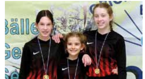
TuS Essenrode 1