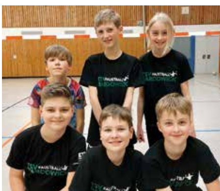
TSV Bardowick - 5. Platz.