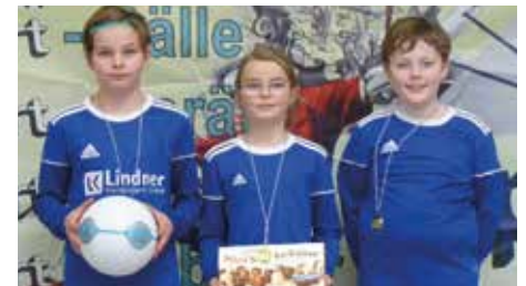
MTV Diepenau 3