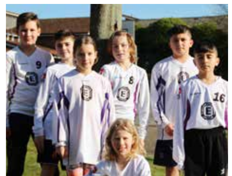
TuS Empelde - 7. Platz.