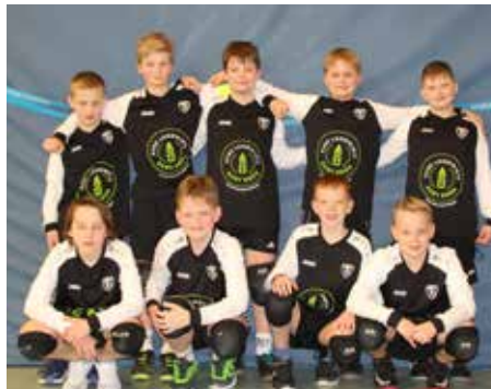
TV Brettorf - 5. Platz.