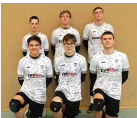
TV Brettorf - 3. Platz.