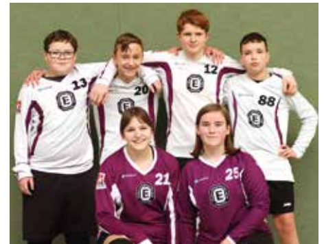
TuS Empelde - 6. Platz.