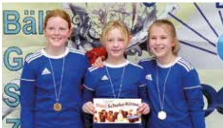
MTV Diepenau 1