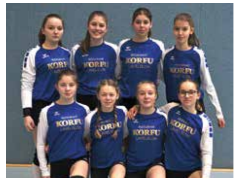
MTV Diepenau - 7. Platz.