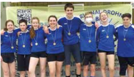
SCE Gliesmarode 2 - 4