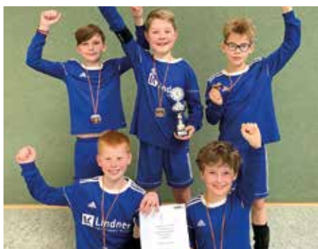
MTV Diepenau - 2. Platz.