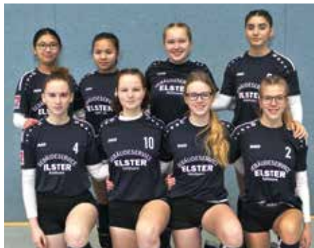
Ahlhorner SV - 4. Platz.