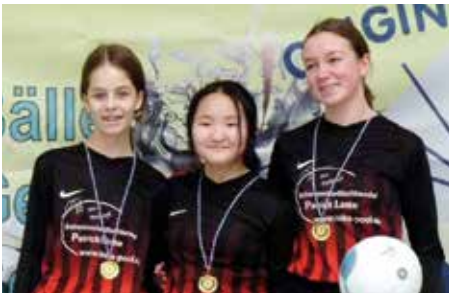
TuS Essenrode 2