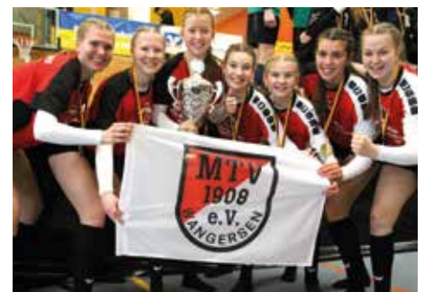
Mädchen U16 - MTV Wangersen