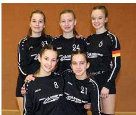
TV Jahn Schneverdingen - 3. Platz.