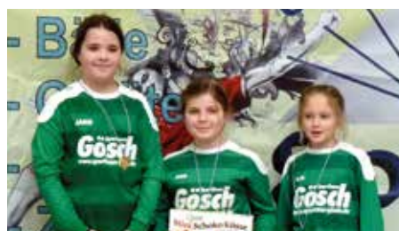
TuS 04 Bothfeld