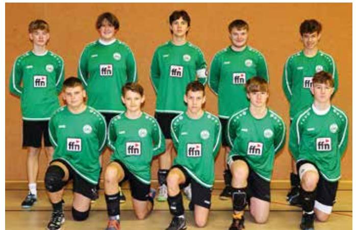
MTV Oldendorf - 4. Platz.