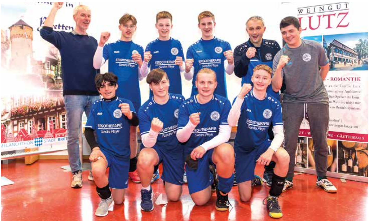
Die U16-Jungen des Ahlhorner SV verpassten die Bronzemedaille nur knapp.