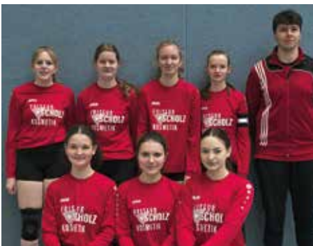
TV Huntlosen - 3. Platz.