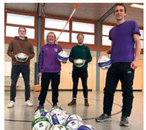
20 Bälle für die Grundschule Mühlenberg.

Außerdem danken wir dem Sparkassen Sportfonds Hannover, durch den eine Finanzierung der Spielgeräte erst möglich geworden ist.