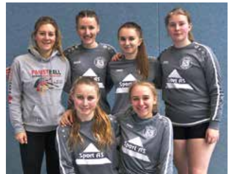
TSV Bardowick - 6. Platz.