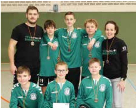
TSV Bardowick - 2. Platz.