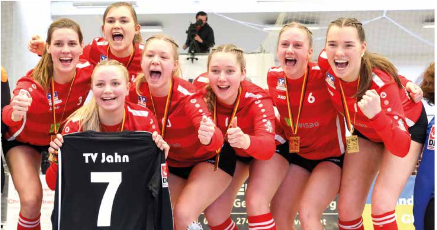
Jubeln nach dem DM-Titel auf dem Feld nun auch in der Halle: die Faustballerinnen des TV Jahn Schneverdingen.