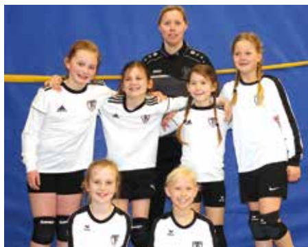
TV Brettorf - 4. Platz.