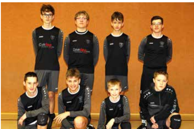
TV Brettorf - 3. Platz.