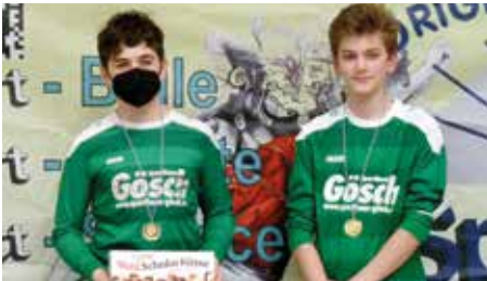
TuS 04 Bothfeld 1