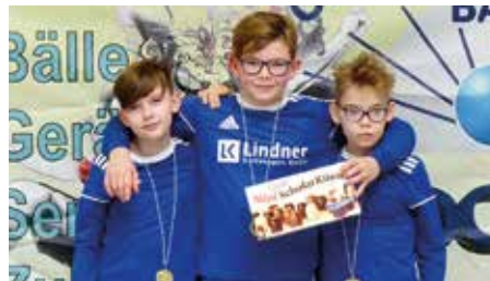
MTV Diepenau 2