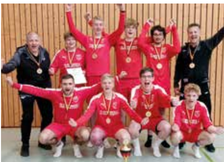
Jungen U18 - MTV Wangersen