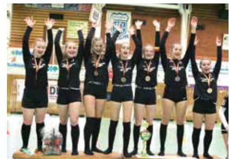
Mädchen U14 - TV Jahn Schneverdingen

Herzlichen Glückwunsch allen DM-Teilnehmern