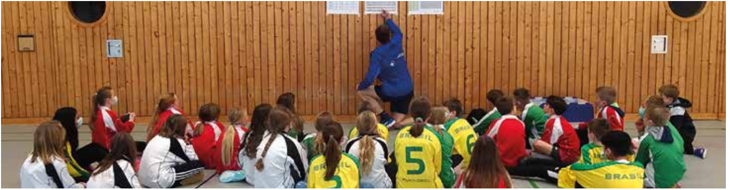
Die spannende Auswertung unmittelbar vor der Siegerehrung.