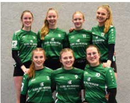
TSV Essel - 2. Platz.