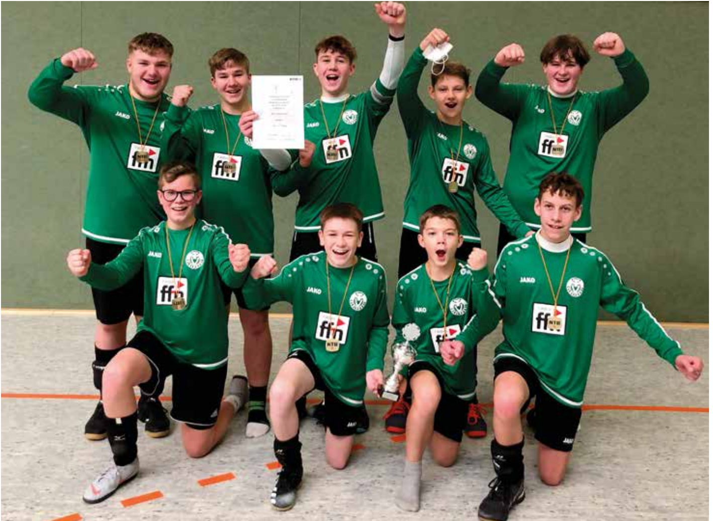
MTV Oldendorf - 1. Platz.