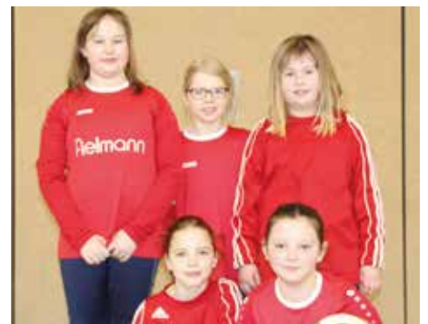
MTV Wangersen 1 - 7. Platz.