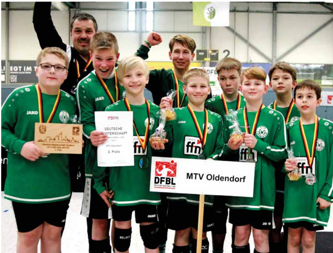
Toller Erfolg in Leipzig: Die männliche U12 des MTV Oldendorf feiert die DM-Silbermedaille.