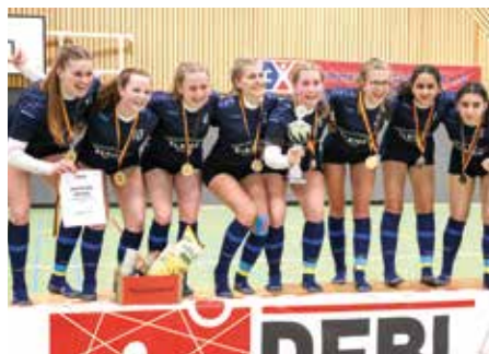
Mädchen U18 - Ahlhorner SV