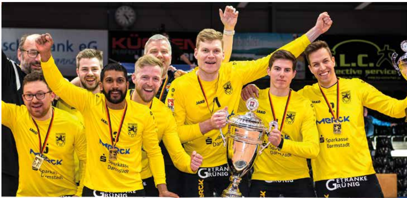
Blieben auf nationaler Ebene weiter eine Macht: die Seriensieger vom TSV Pfungstadt.