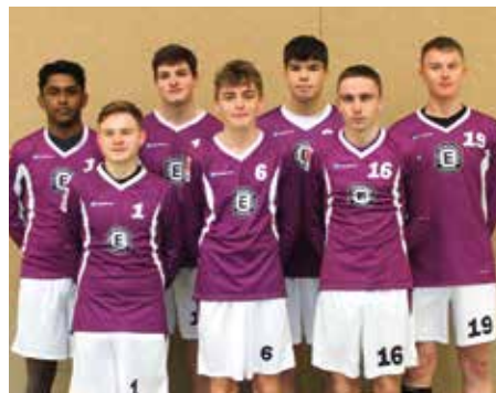
TuS Empelde - 4. Platz.