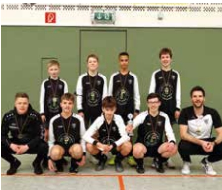
TV Brettorf - 3. Platz.