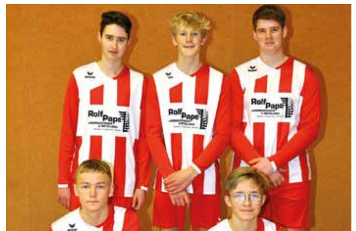
TSV Abbenseth - 5. Platz.