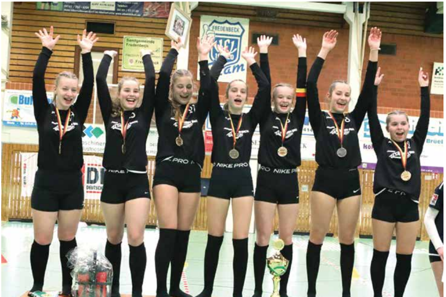
Damit hat kaum einer gerechnet: Schneverdingen gewinnt die Deutsche Meisterschaft.