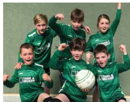
TSV Essel - 6. Platz.