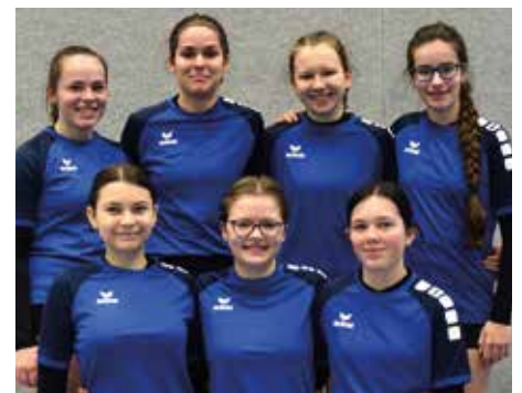
Wardenburger TV - 6. Platz.