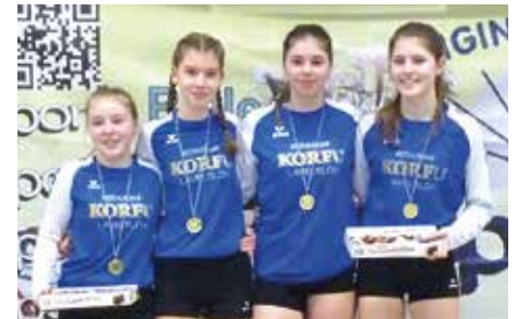
MTV Diepenau 5 + 6