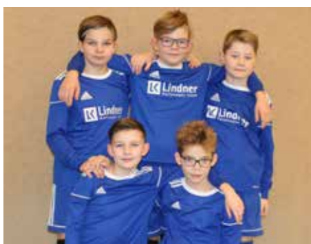
MTV Diepenau - 3. Platz.