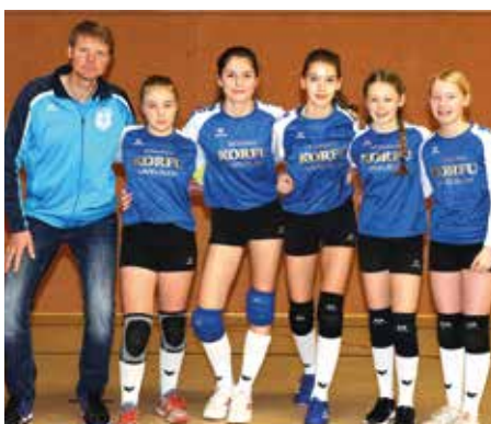
MTV Diepenau - 5. Platz.