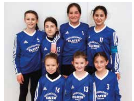
Ahlhorner SV - 6. Platz.