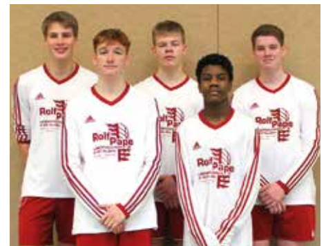
TSV Abbenseth - 6. Platz.