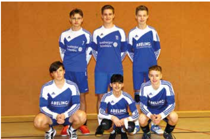
Ahlhorner SV - 2. Platz.