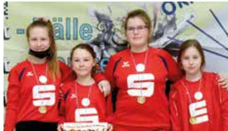
MSV Buna Schkopau 1