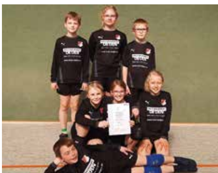
MTSV Selsingen - 4. Platz.