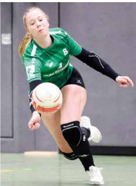
... bei der Ballannahme.