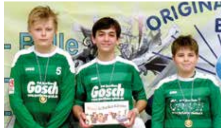
TuS 04 Bothfeld 2