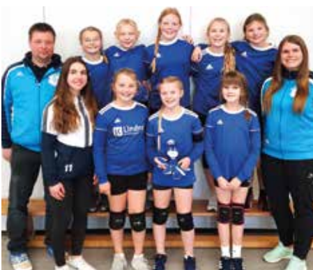
MTV Diepenau - 3. Platz.