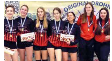
TuS Essenrode 3 - 5