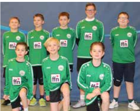
MTV Oldendorf - 2. Platz.