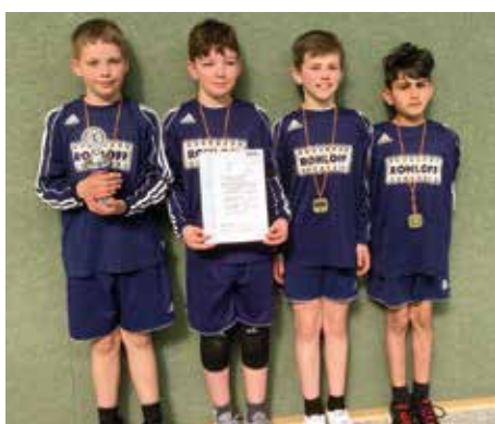
Ahlhorner SV - 3. Platz.