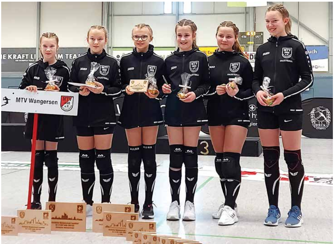
Der MTV Wangersen mussten sich im Spiel um Platz drei dem ESV Schwerin geschlagen geben.