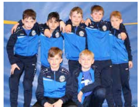
Ahlhorner SV - 6. Platz.