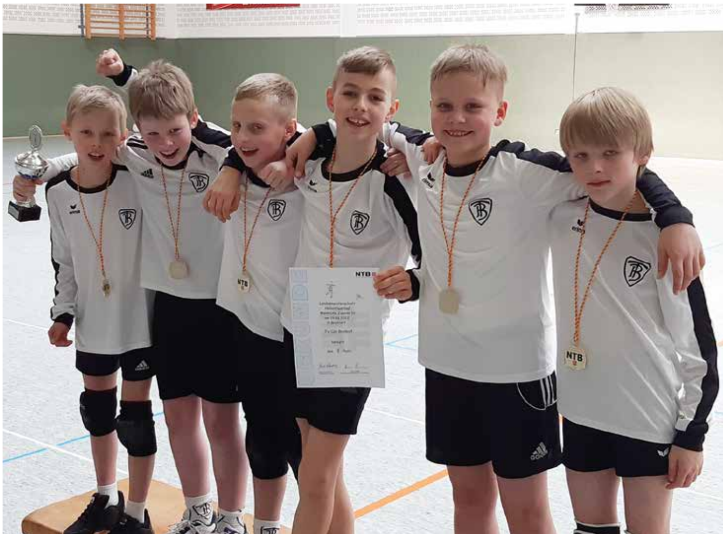
TV Brettorf - 1. Platz.