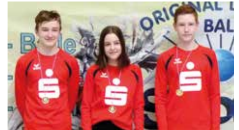
MSV Buna Schkopau 2