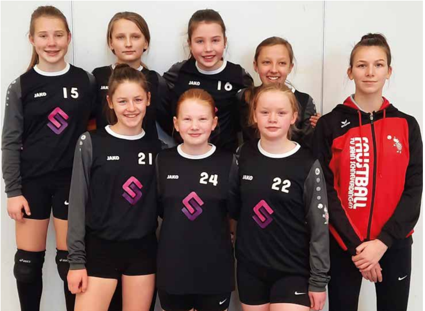
TV Jahn Schneverdingen - 1. Platz.