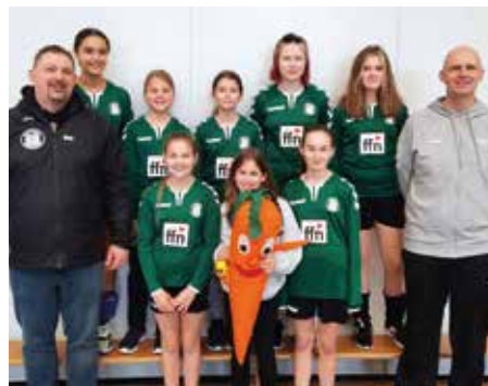
TSV Bardowick - 4. Platz.