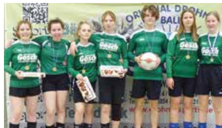
TuS 04 Bothfeld 4 - 6