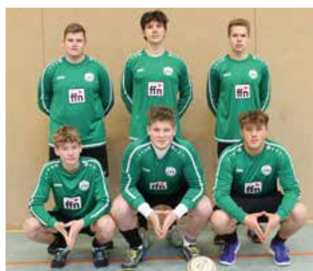
MTV Oldendorf - 5. Platz.