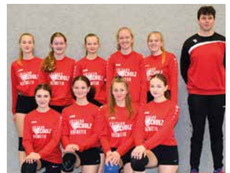
TV Huntlosen - 7. Platz.