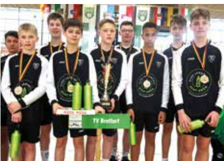
Jungen U14 - TV Brettorf

Herzlichen Glückwunsch allen DM-Teilnehmern