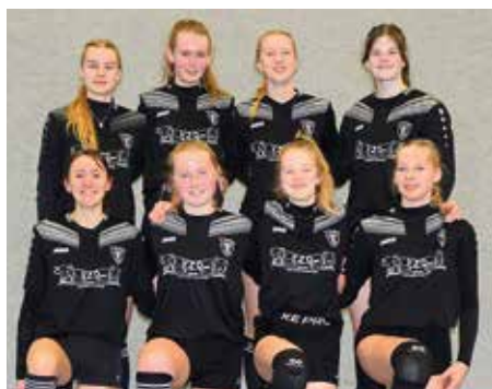
TV Brettorf - 5. Platz.