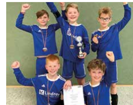
MTV Diepenau - 2. Platz.