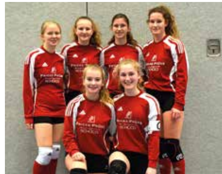
MTSV Selsingen - 4. Platz.