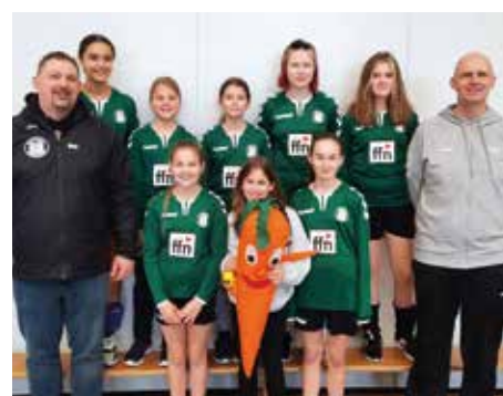
TSV Bardowick - 4. Platz.