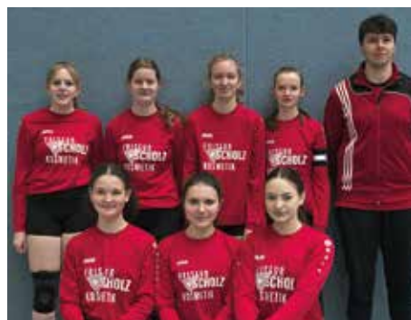
TV Huntlosen - 3. Platz.