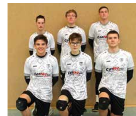
TV Brettorf - 3. Platz.