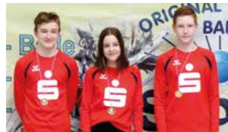
MSV Buna Schkopau 2