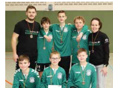
TSV Bardowick - 2. Platz.