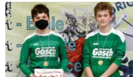
TuS 04 Bothfeld 1