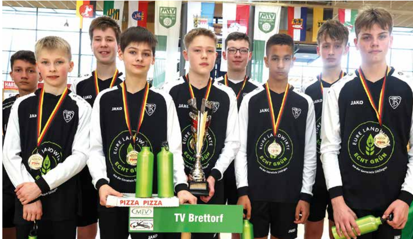
Erfolg für die Brettorfer Jungs: Deutscher Meister der männlichen U14.