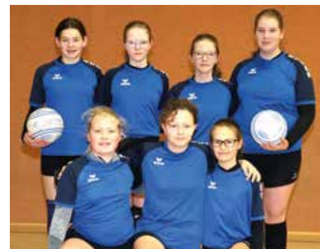
Wardenburger TV - 6. Platz.