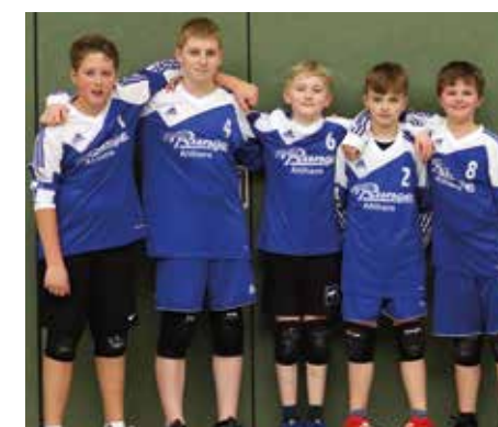
Ahlhorner SV - 5. Platz.