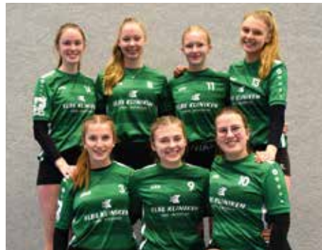
TSV Essel - 2. Platz.