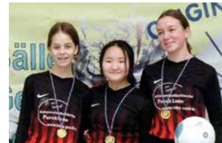
TuS Essenrode 2