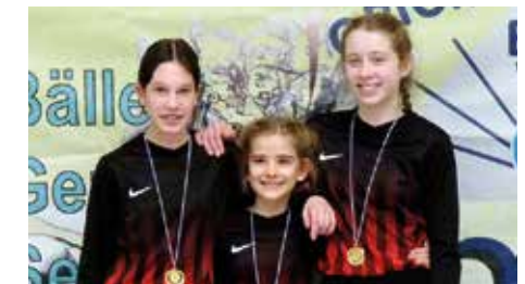
TuS Essenrode 1