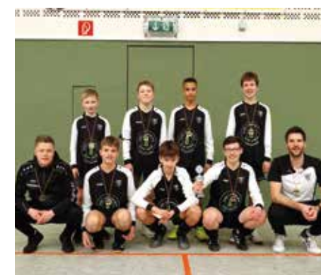
TV Brettorf - 3. Platz.