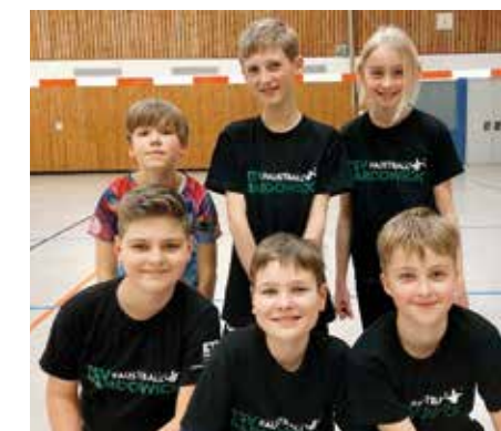
TSV Bardowick - 5. Platz.