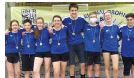
SCE Gliesmarode 2 - 4