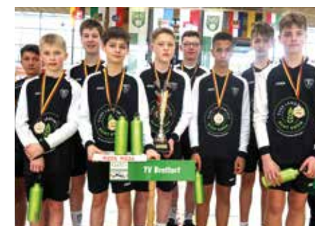
Jungen U14 - TV Brettorf