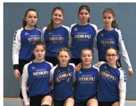
MTV Diepenau - 7. Platz.