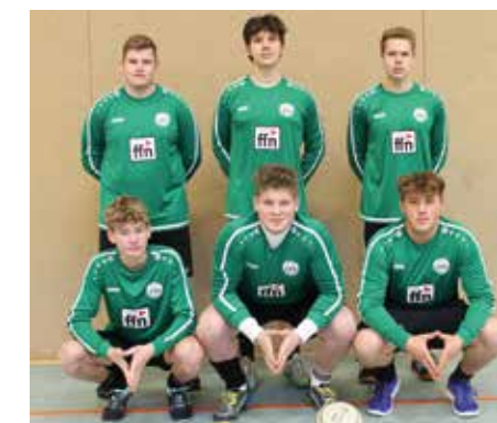
MTV Oldendorf - 5. Platz.