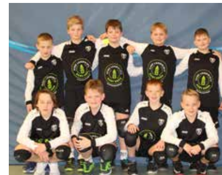
TV Brettorf - 5. Platz.