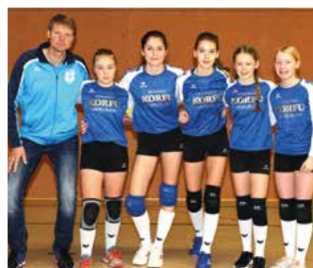
MTV Diepenau - 5. Platz.