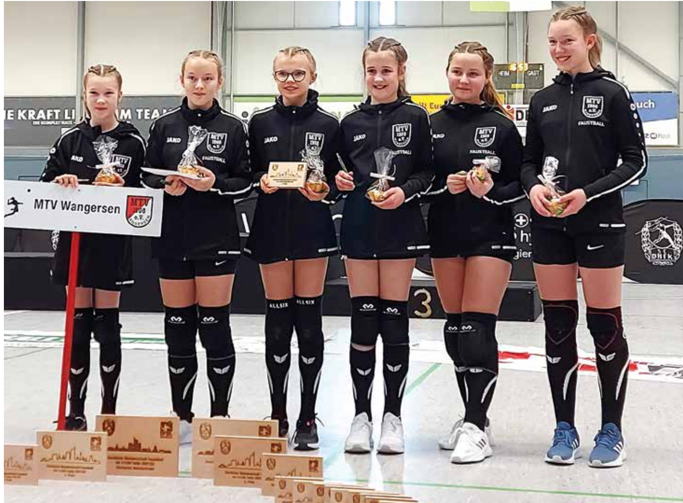
Der MTV Wangersen mussten sich im Spiel um Platz drei dem ESV Schwerin geschlagen geben.