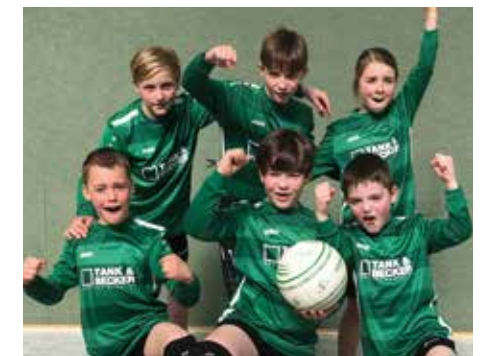
TSV Essel - 6. Platz.