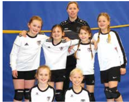
TV Brettorf - 4. Platz.