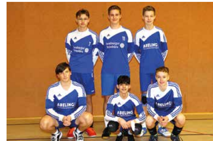
Ahlhorner SV - 2. Platz.