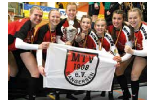
Mädchen U16 - MTV Wangersen