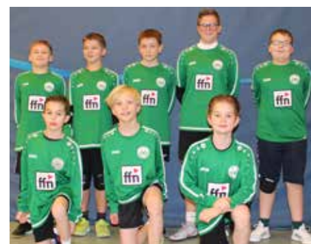
MTV Oldendorf - 2. Platz.