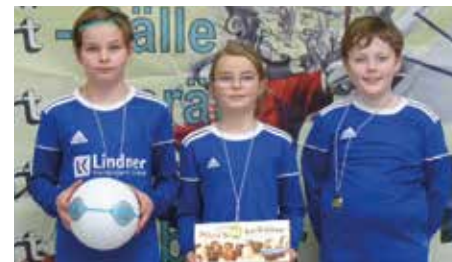
MTV Diepenau 3