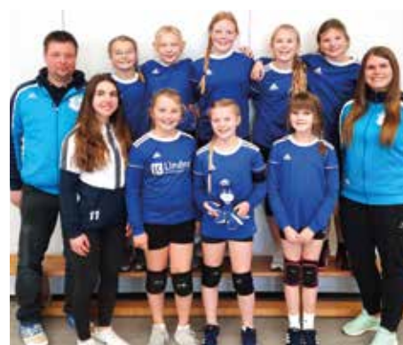
MTV Diepenau - 3. Platz.