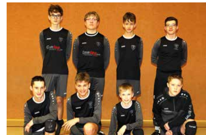
TV Brettorf - 3. Platz.