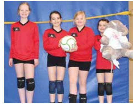
SV Moslesfehn - 6. Platz.