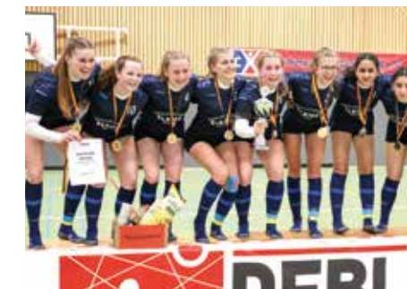
Mädchen U18 - Ahlhorner SV