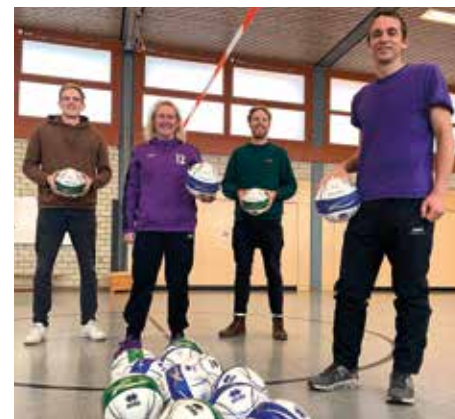
20 Bälle für die Grundschule Mühlenberg.

Außerdem danken wir dem Sparkassen Sportfonds Hannover, durch den eine Finanzierung der Spielgeräte erst möglich geworden ist.