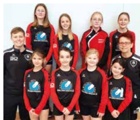
SV Moslesfehn - 5. Platz.