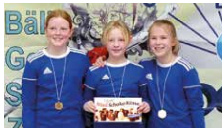
MTV Diepenau 1