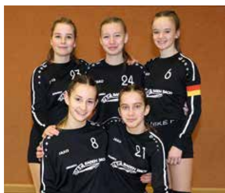
TV Jahn Schneverdingen - 3. Platz.