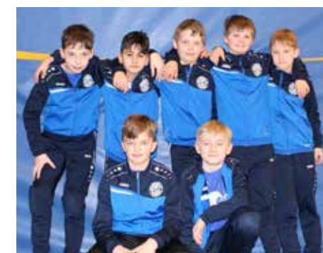
Ahlhorner SV - 6. Platz.