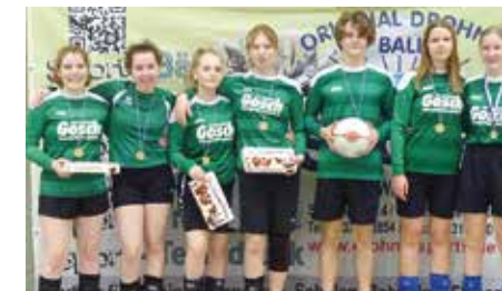
TuS 04 Bothfeld 4 - 6