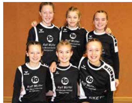
MTV Wangersen - 4. Platz.