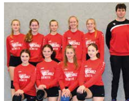
TV Huntlosen - 7. Platz.