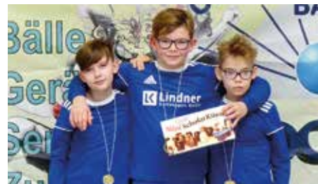
MTV Diepenau 2