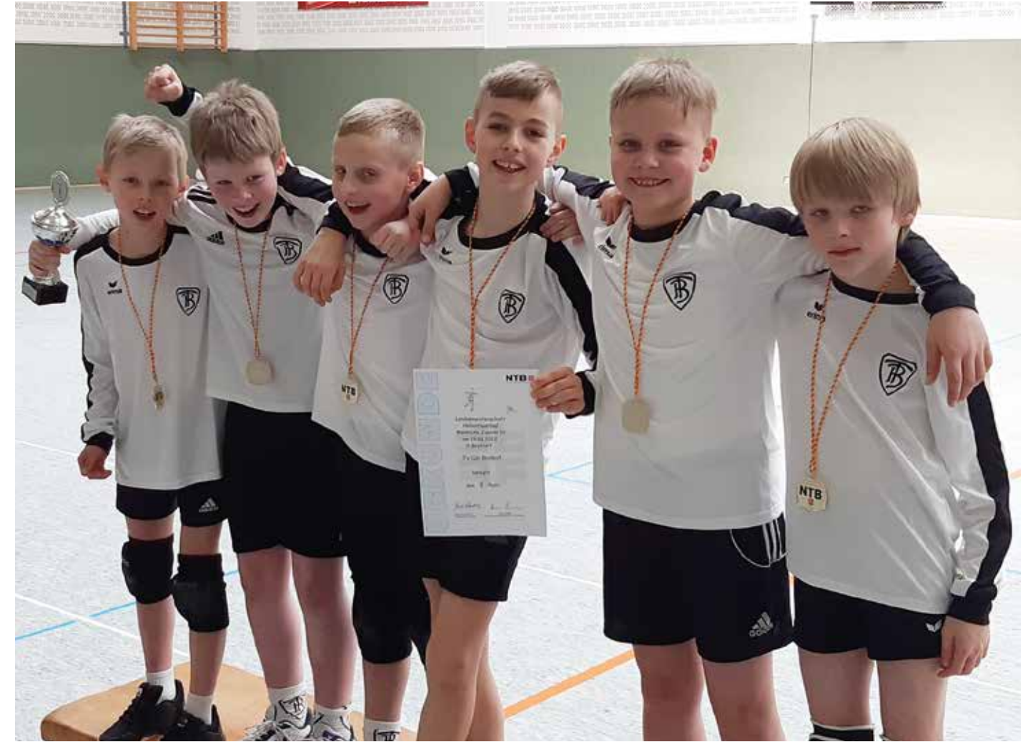
TV Brettorf - 1. Platz.