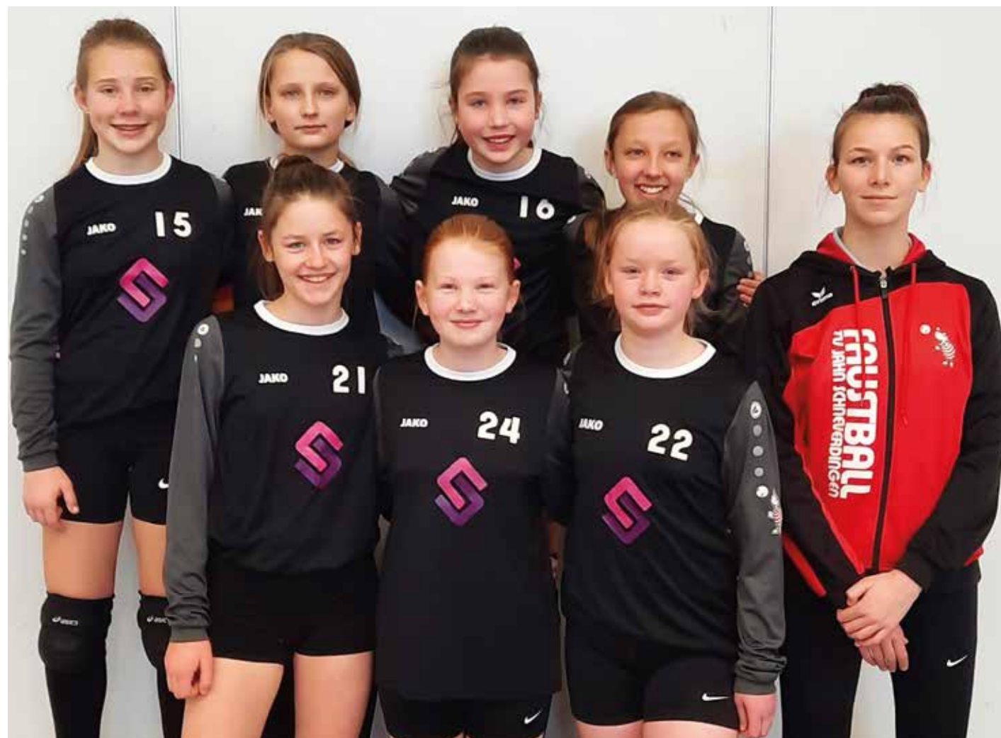
TV Jahn Schneverdingen - 1. Platz.