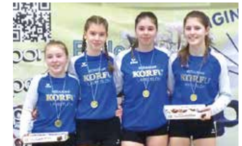
MTV Diepenau 5 + 6