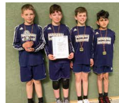
Ahlhorner SV - 3. Platz.