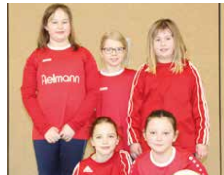
MTV Wangersen 1 - 7. Platz.