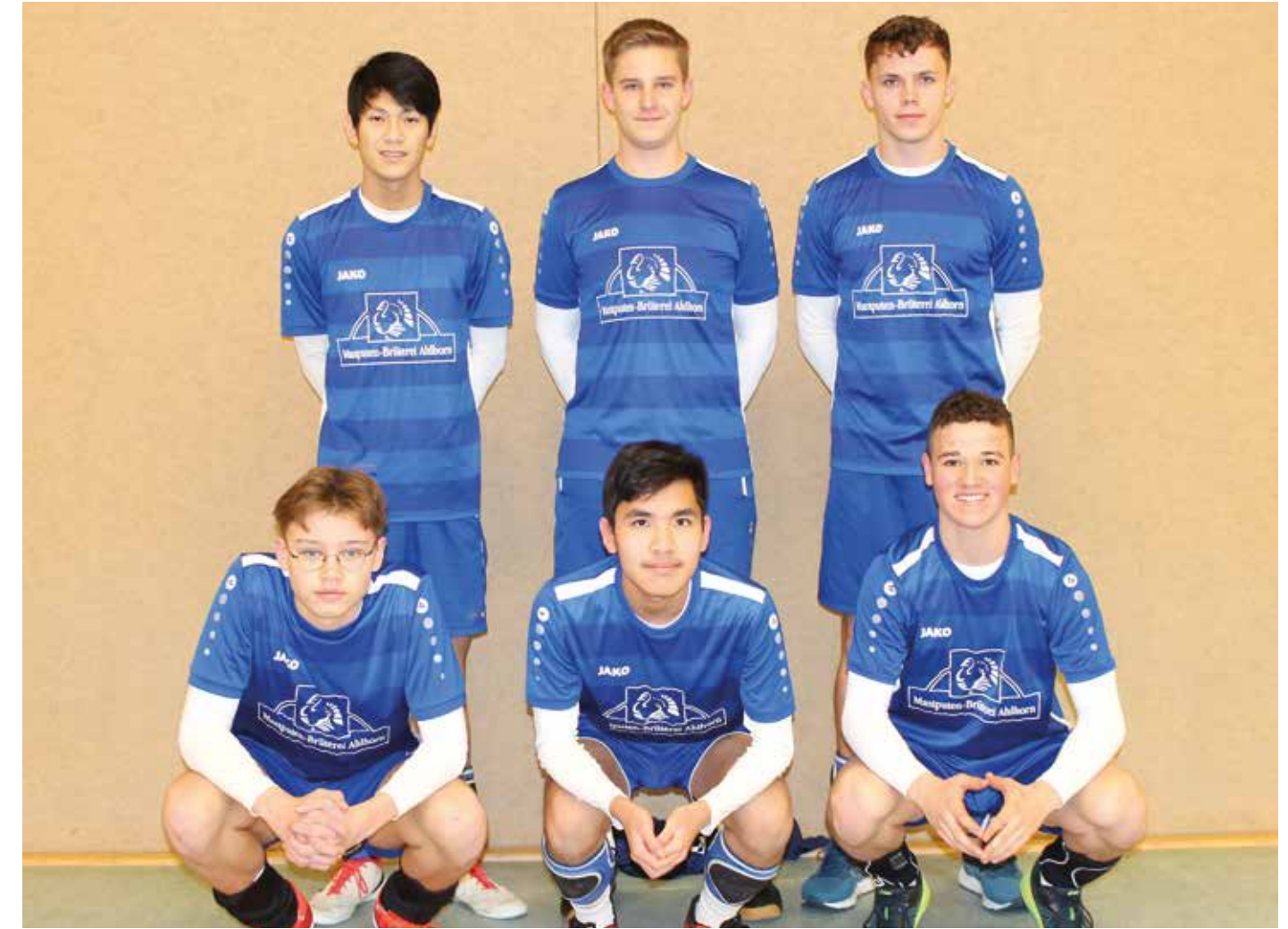
Ahlhorner SV - 1. Platz.