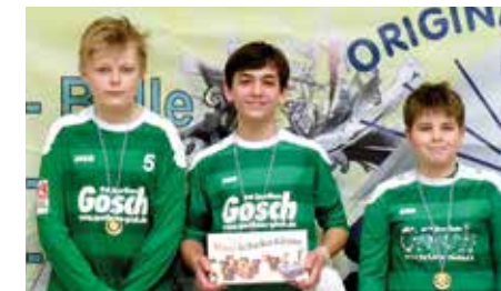
TuS 04 Bothfeld 2