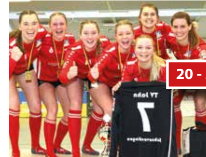
Von den Großen