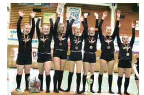
Mädchen U14 - TV Jahn Schneverdingen

Herzlichen Glückwunsch allen DM-Teilnehmern