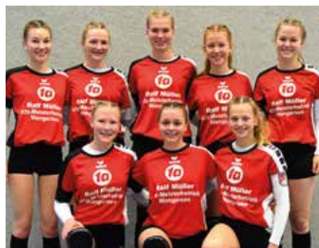
MTV Wangersen - 3. Platz.