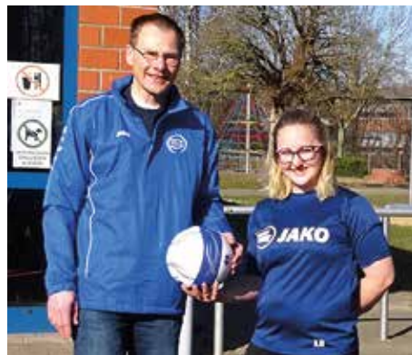
Übergabe der zwölf neuen Faustbälle an das Gymnasium Rahden.

Für 2022 ist bereits eine weitere Schulfaustball Übungsreihe, allerdings diesmal an der Sekundarschule in Rahden, geplant. Dann sind die Schüler bestens für die Teilnahme an der Schulfaustball Bezirksmeisterschaft in Empelde vorbereitet.“