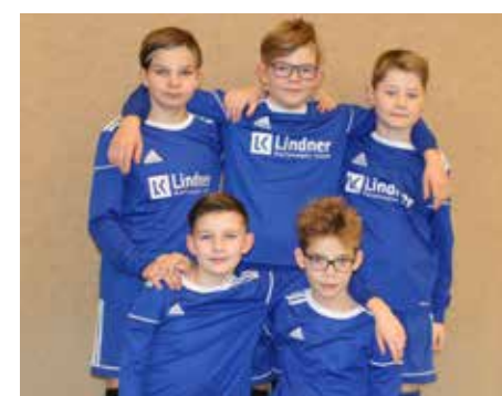
MTV Diepenau - 3. Platz.