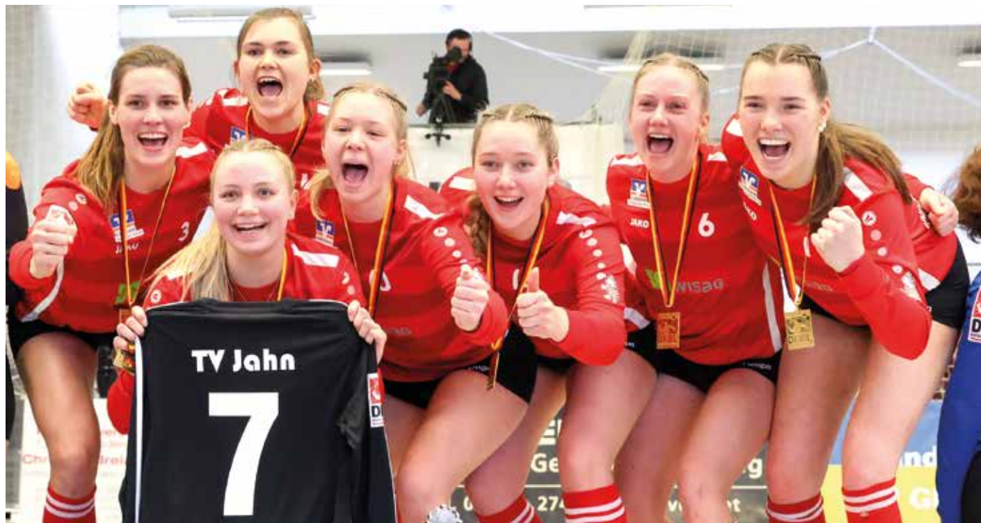
Jubeln nach dem DM-Titel auf dem Feld nun auch in der Halle: die Faustballerinnen des TV Jahn Schneverdingen.