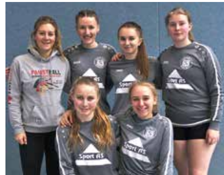
TSV Bardowick - 6. Platz.