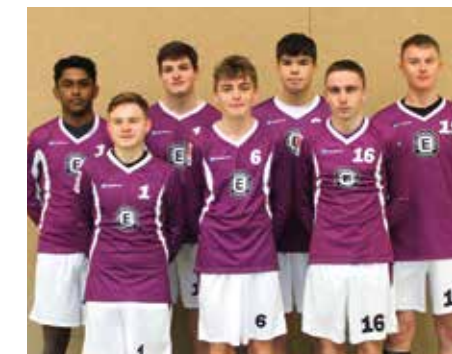
TuS Empelde - 4. Platz.