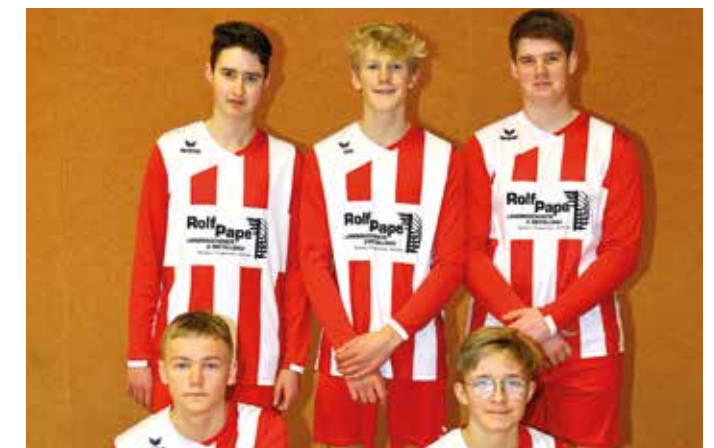
TSV Abbenseth - 5. Platz.