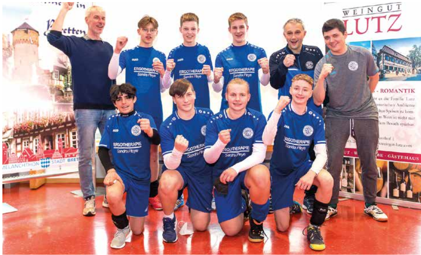
Die U16-Jungen des Ahlhorner SV verpassten die Bronzemedaille nur knapp.