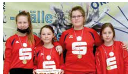
MSV Buna Schkopau 1