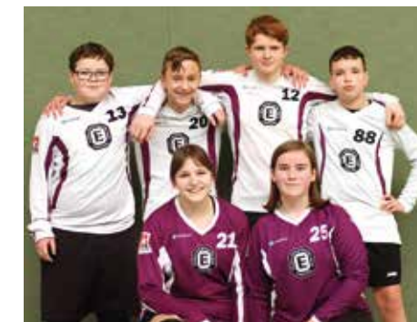
TuS Empelde - 6. Platz.