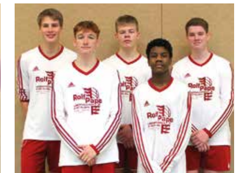
TSV Abbenseth - 6. Platz.