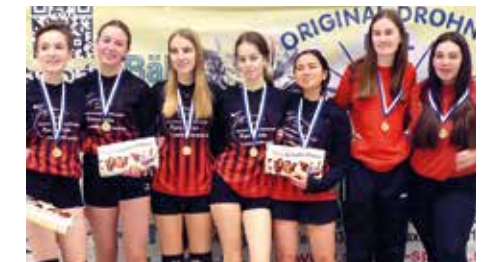
TuS Essenrode 3 - 5