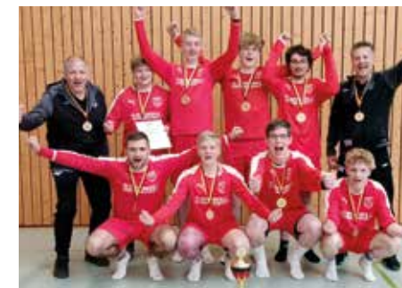
Jungen U18 - MTV Wangersen