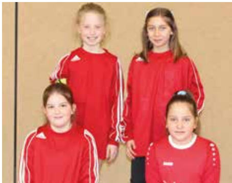
MTV Wangersen 2 - 2. Platz.