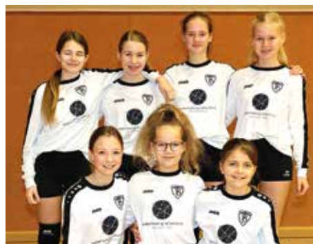
TV Brettorf - 2. Platz.