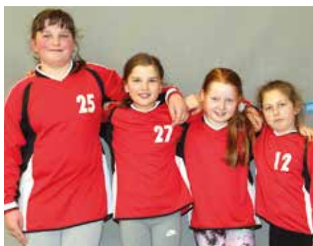
TV Huntlosen - 3. Platz.