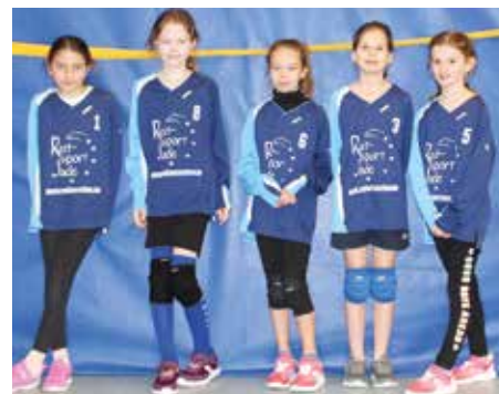
Ahlhorner SV - 5. Platz.