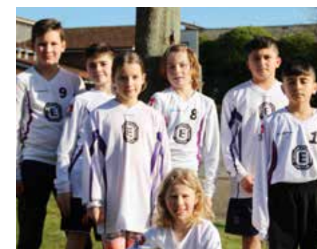
TuS Empelde - 7. Platz.