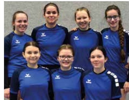
Wardenburger TV - 6. Platz.