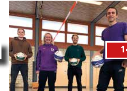
Schulfaustball im Bezirk Hannover