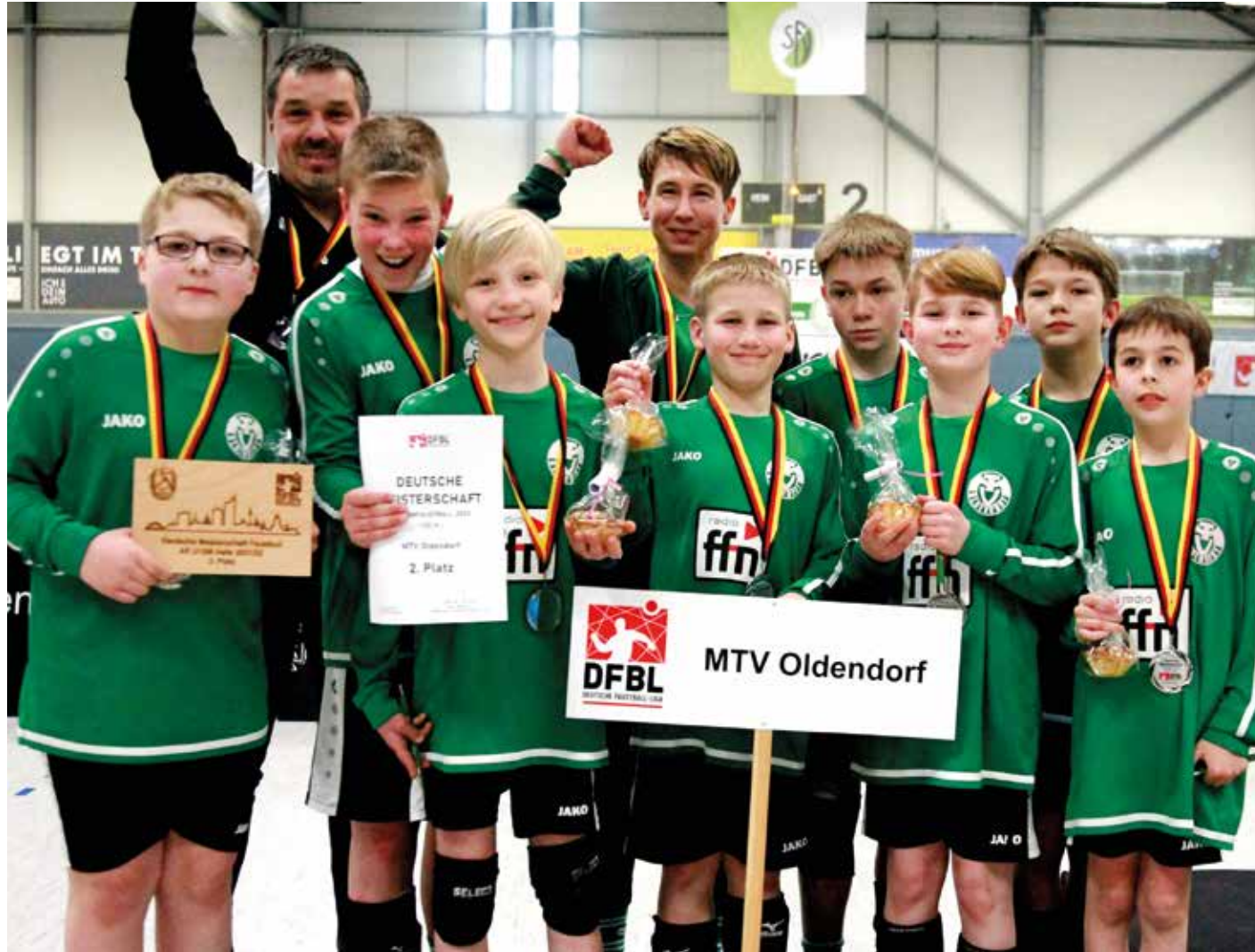
Toller Erfolg in Leipzig: Die männliche U12 des MTV Oldendorf feiert die DM-Silbermedaille.