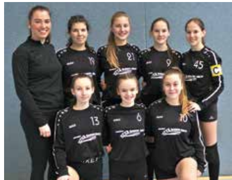
TV Jahn Schneverdingen - 2. Platz.