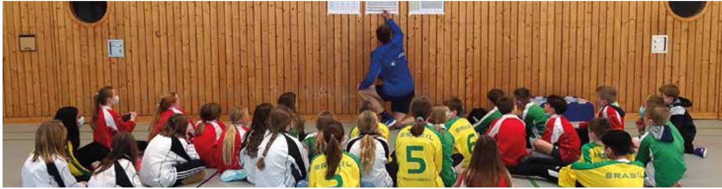
Die spannende Auswertung unmittelbar vor der Siegerehrung.