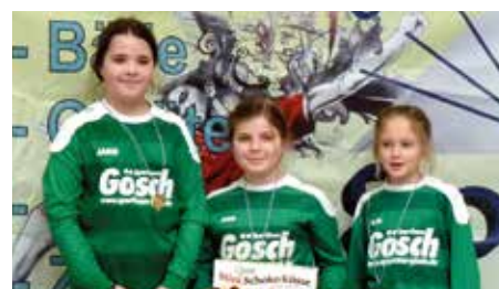
TuS 04 Bothfeld