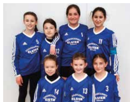
Ahlhorner SV - 6. Platz.