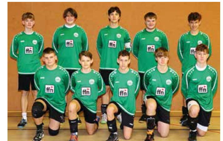
MTV Oldendorf - 4. Platz.