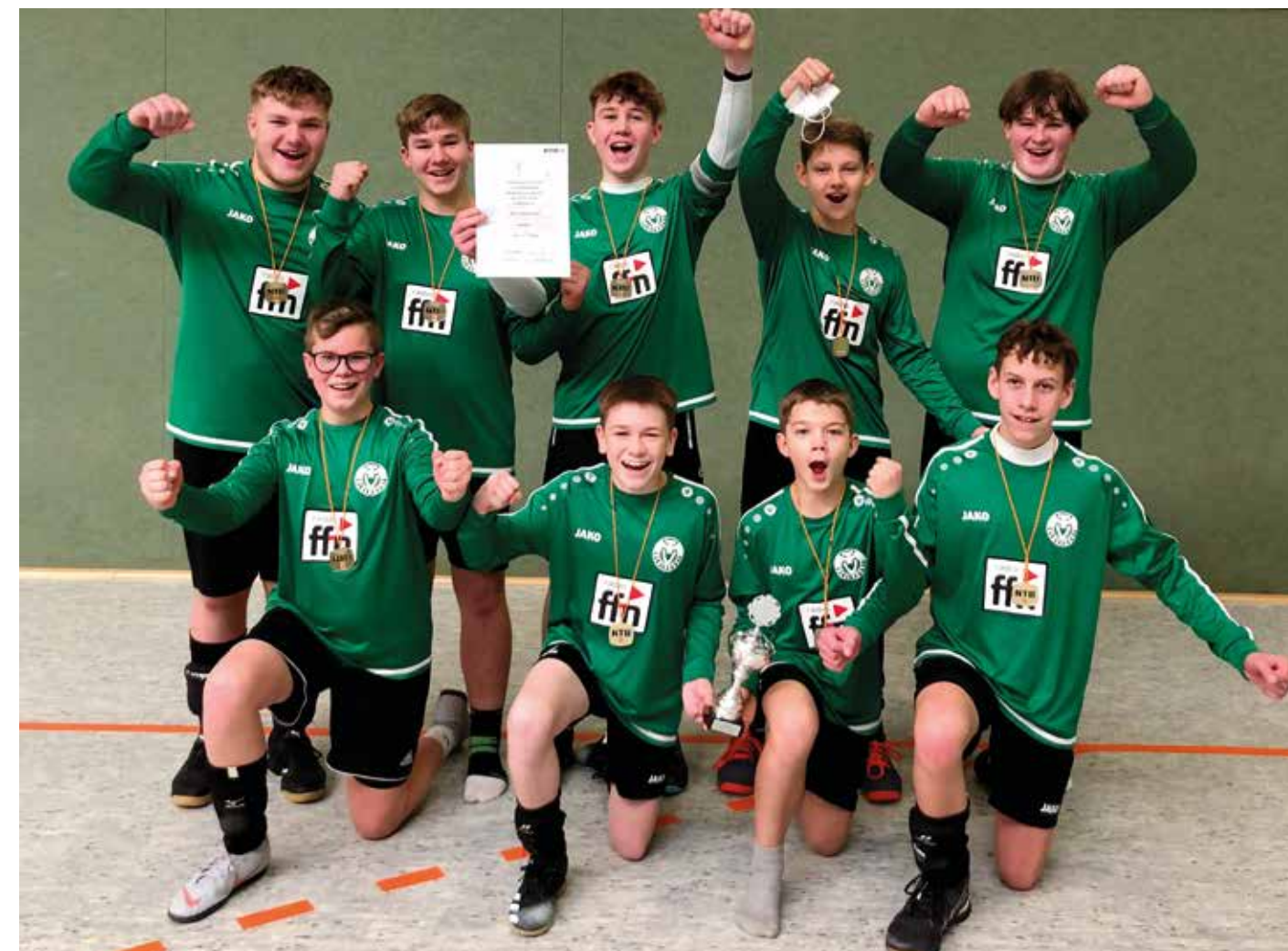
MTV Oldendorf - 1. Platz.