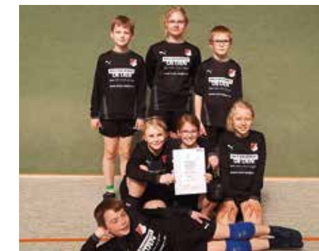
MTSV Selsingen - 4. Platz.