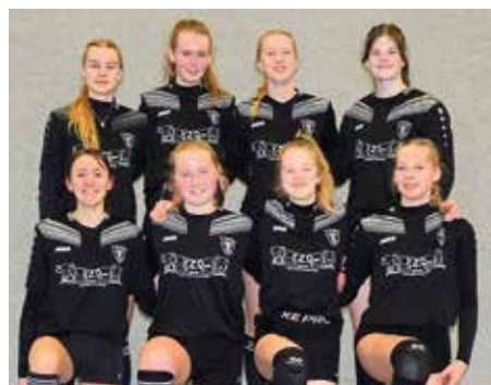
TV Brettorf - 5. Platz.