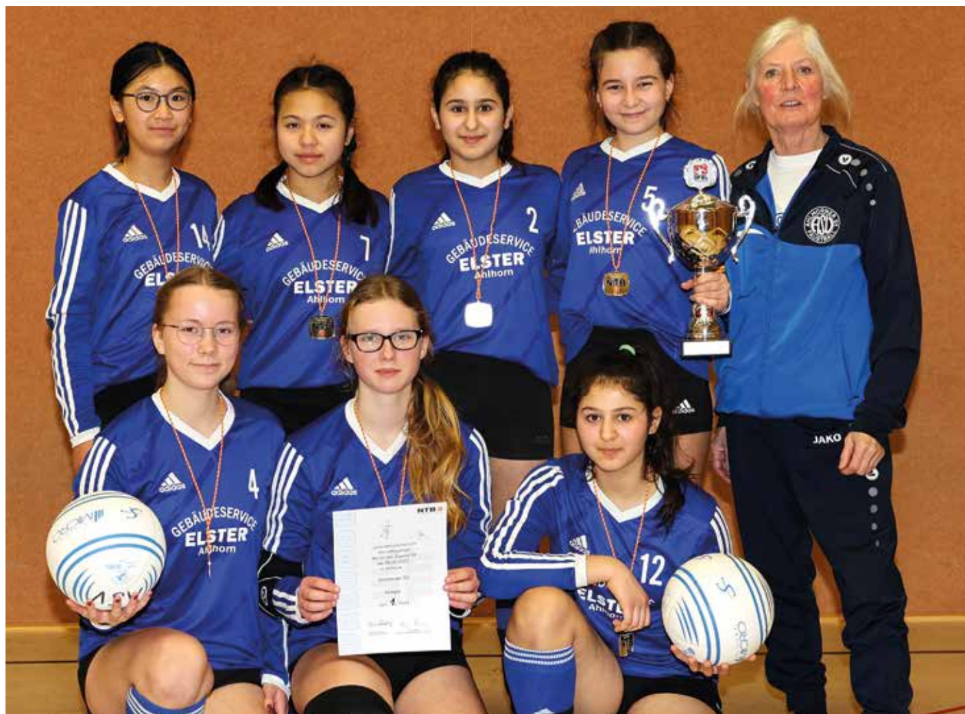
Ahlhorner SV - 1. Platz.