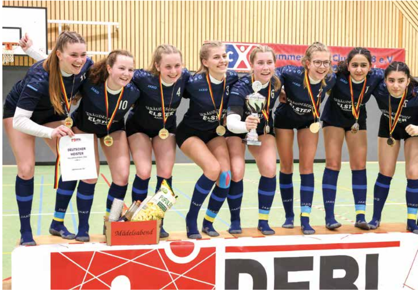
Ahlhorn gewinnt mit starker Leistung die Goldmedaillen