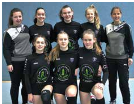
TV Brettorf - 5. Platz.