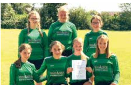
TSV Essel - 4. Platz.