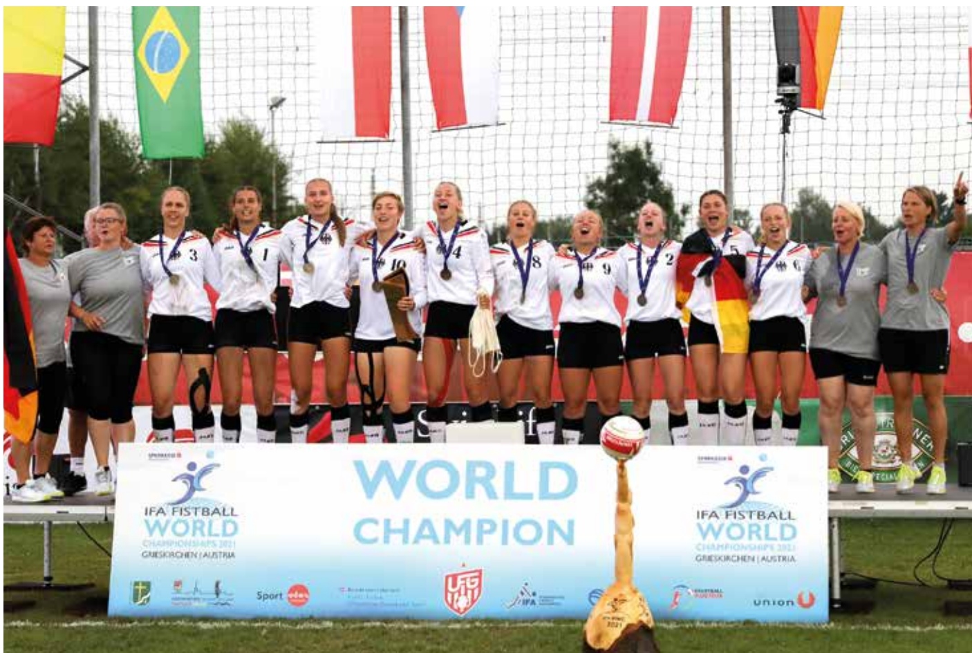
Die deutsche Frauen-Nationalmannschaft hat die Weltmeisterschaft gewonnen.