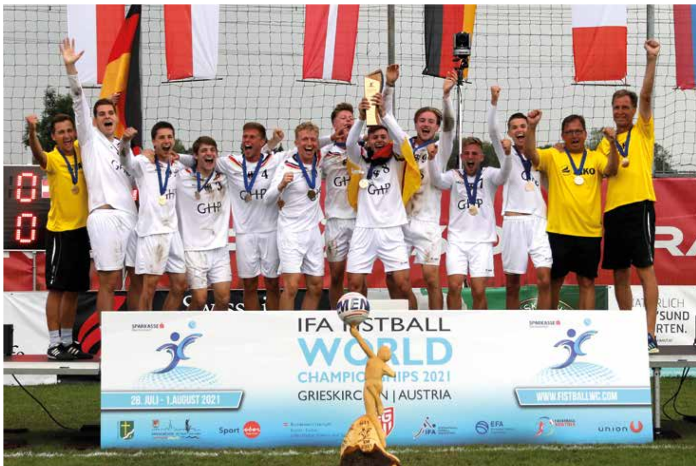
Freut sich über die Titelverteidigung: die U21-Nationalmannschaft.