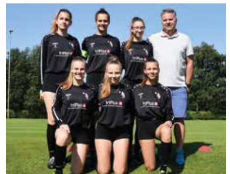
TV Jahn Schneverdingen - 6. Platz.