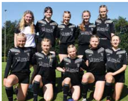
TV Brettorf - 4. Platz.