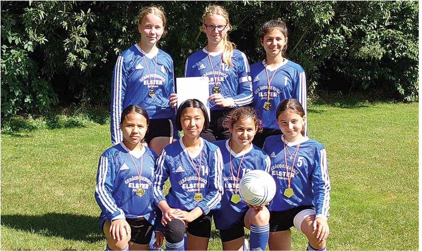
Ahlhorner SV - 1. Platz.