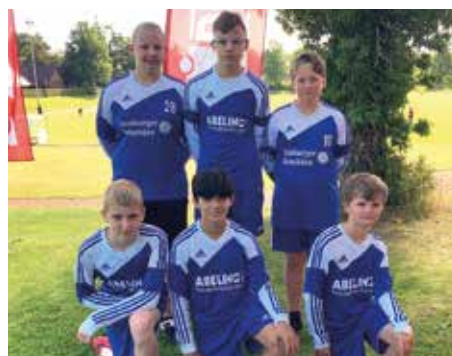
Ahlhorner SV - 4. Platz.