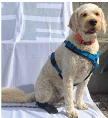
NTB-Masskottchen „Theo“ war auch dabei.

in der Vergangenheit lief, schmälern soll das die Leistungen keinswegs. Als einziges Team auf das Podest schaffte es die weibliche U18. Das Team war hinter Oberösterreich als Zweitplatzierter der Vorrundengruppe im Viertelfinale gegen Salzburg erfolgreich (11:8, 11:8) und traf im Halbfinale auf Schwaben. Hier gelang es zwar, einen 0:1-Rückstand auszugleichen, im verkürzten dritten Satz musste man sich aber geschlagen