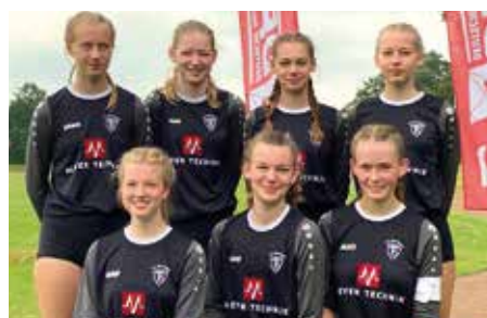
TV Brettorf - 7. Platz.