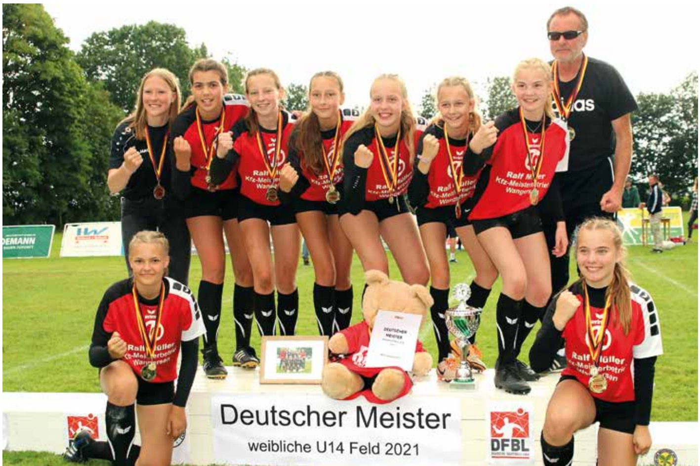
Damit hat kaum einer gerechnet. Wangersen gewinnt die Deutsche Meisterschaft.