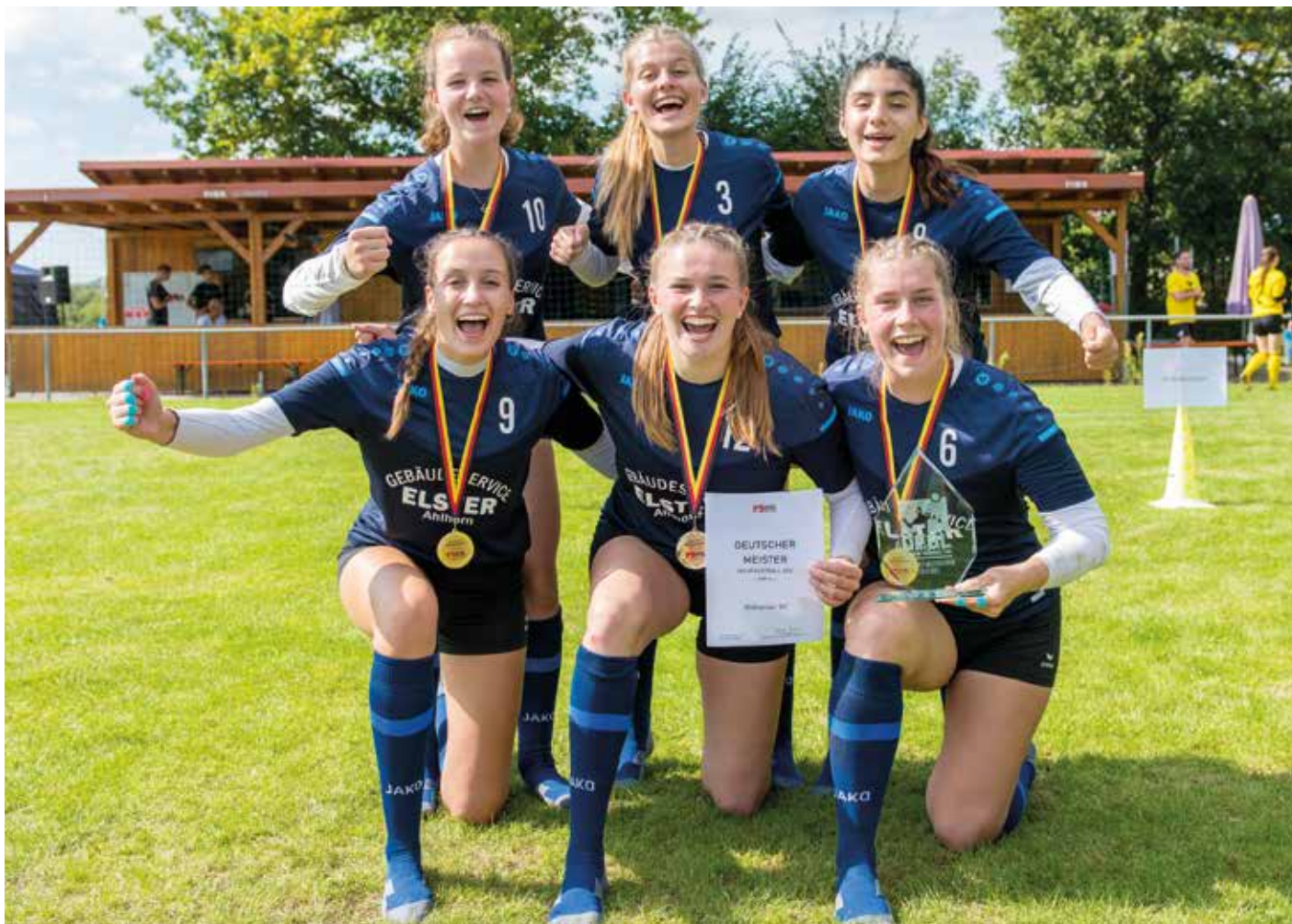
Große Freude bei den Ahlhorner Faustballerinnen: sie haben den Titel gewonnen.