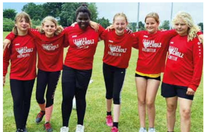
TV Huntlosen - 5. Platz.