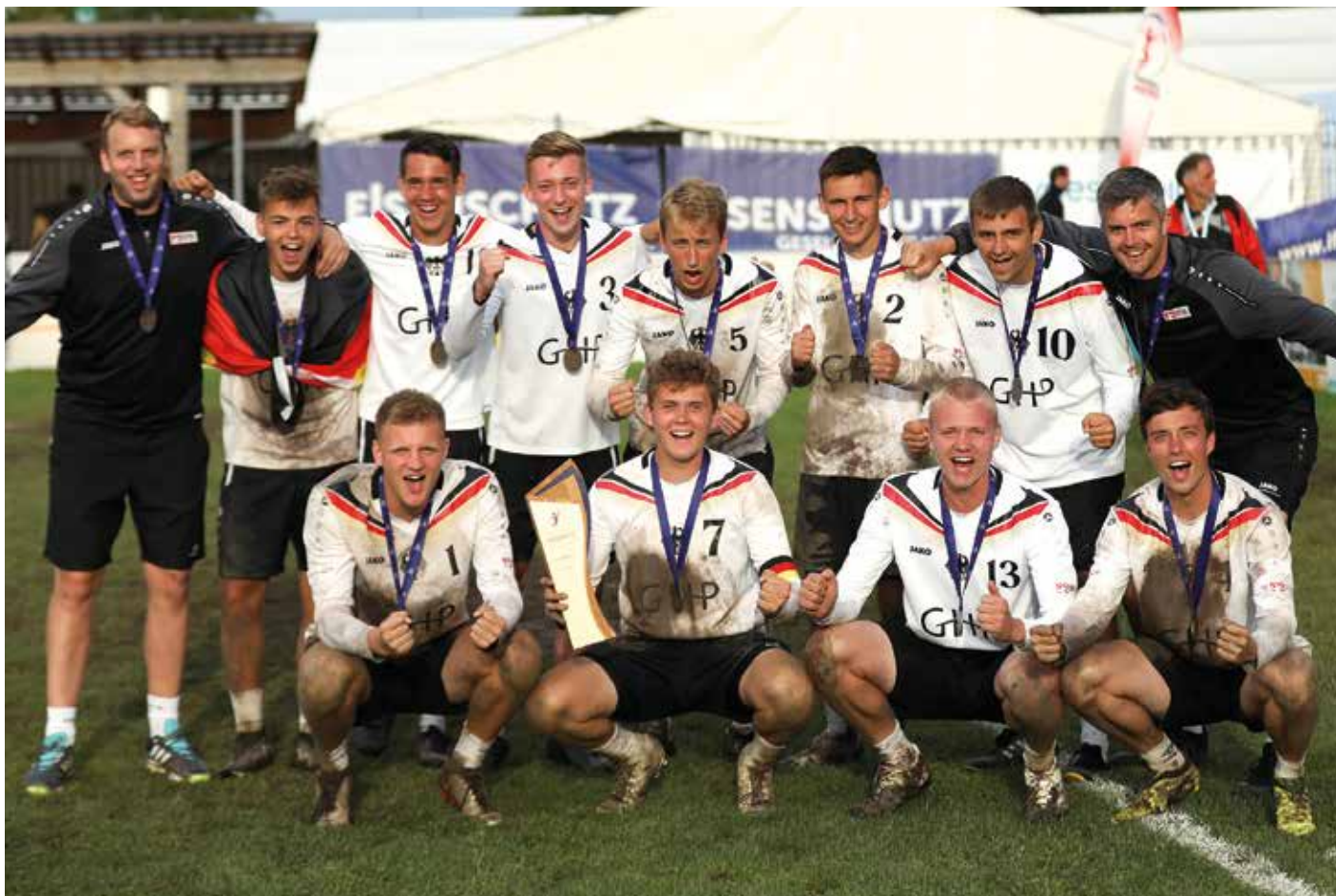
Hat den Weltmeistertitel nach Deutschland zurückgeholt: die Mannschaft der männlichen U18.