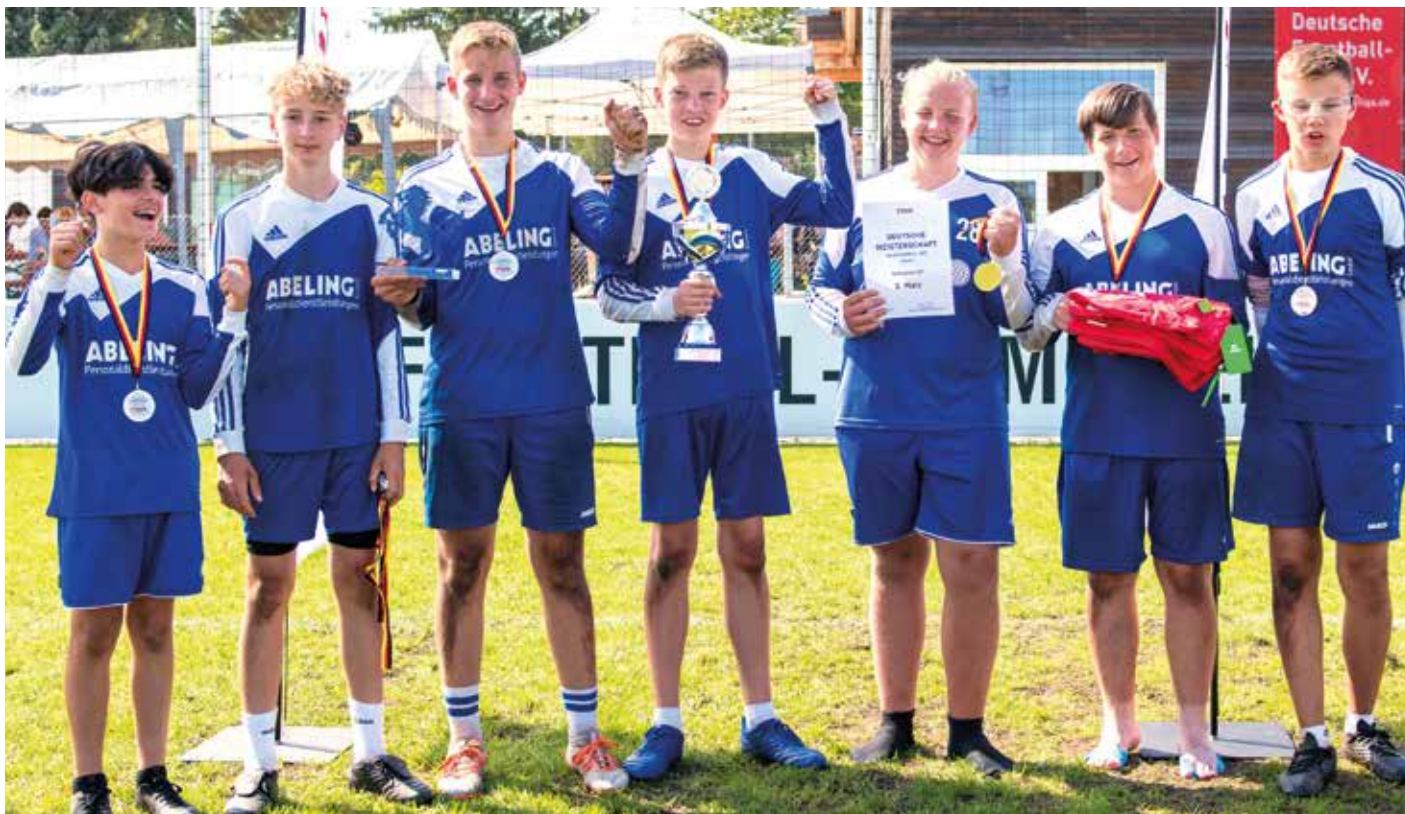
Die U16-Jungen des Ahlhorner SV freuen sich über die Vizemeisterschaft.