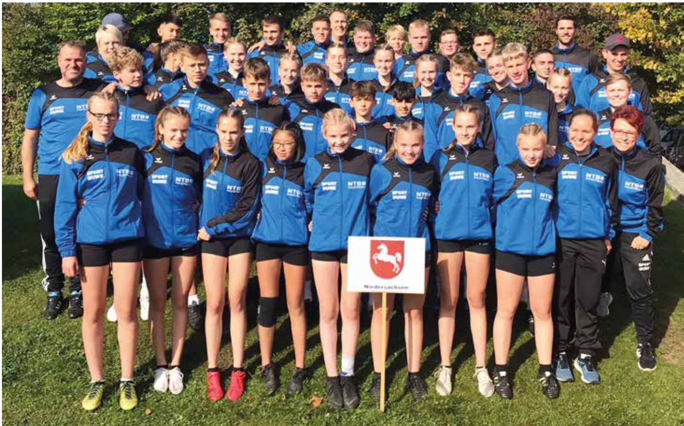
Die NTB-Delegation beim Jugend-Europapokal in der Schweiz.