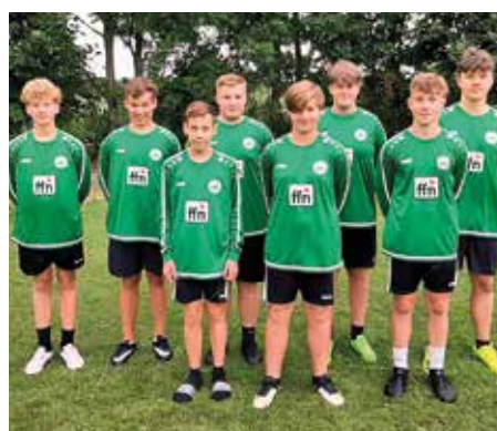
MTV Oldendorf - 5. Platz.