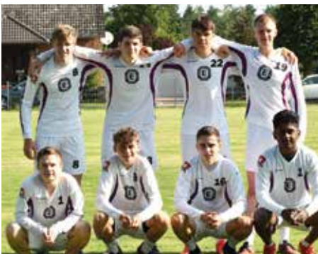
TuS Empelde - 2. Platz.