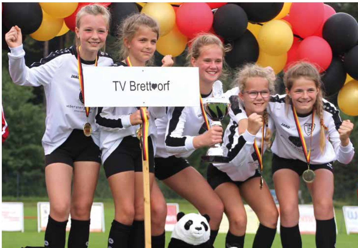
Verdient die Deutsche Meisterschaft gewonnen: die U12-Mädchen des TV Brettorf.