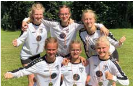
TV Brettorf - 2. Platz.