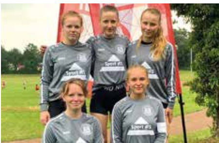
TSV Bardowick - 3. Platz.