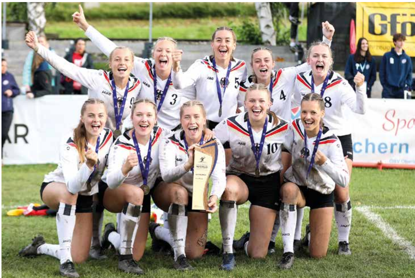
Deutschlands weibliche U18 ist Weltmeister.