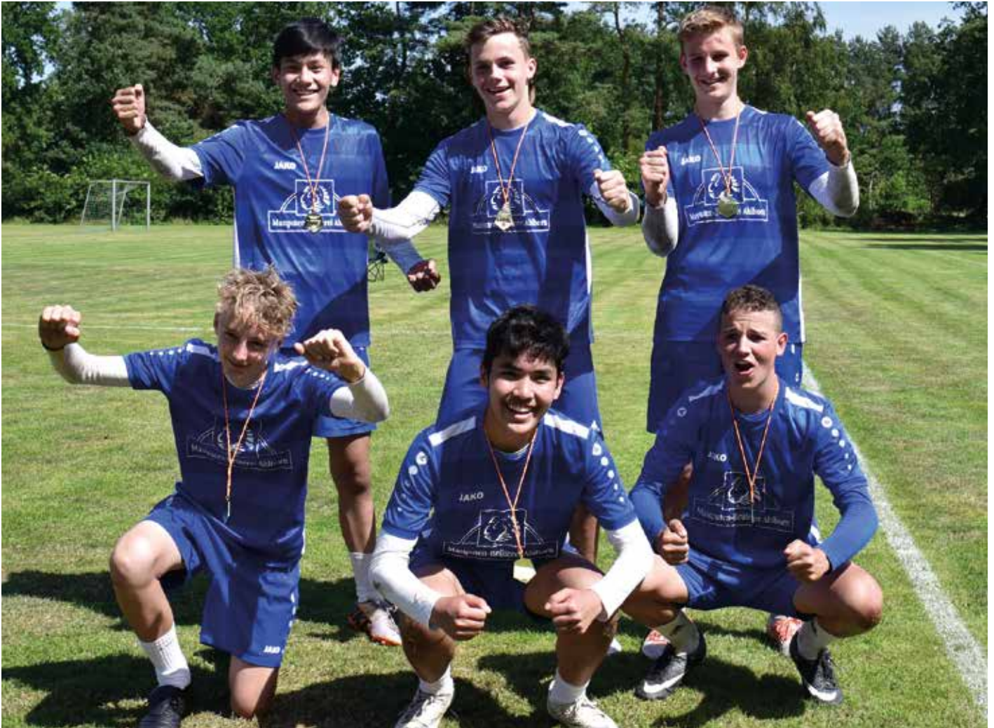
Ahlhorner SV - 1. Platz.