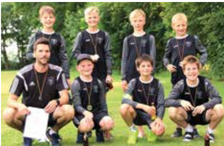
TV Brettorf - 2. Platz.