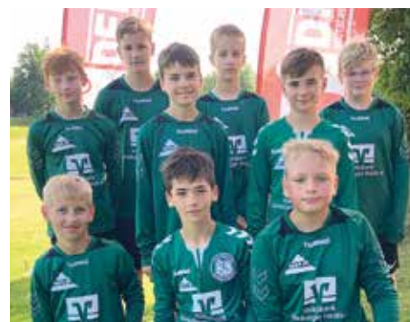
TSV Bardowick - 6. Platz.