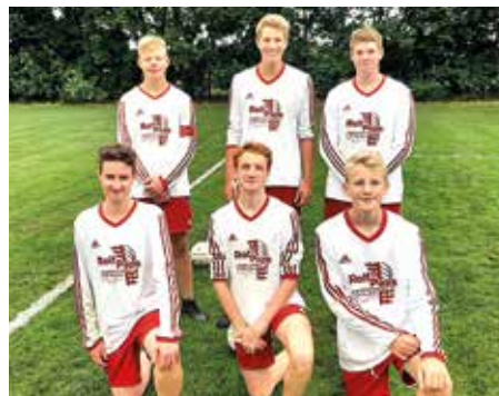
TSV Abbenseth - 4. Platz.