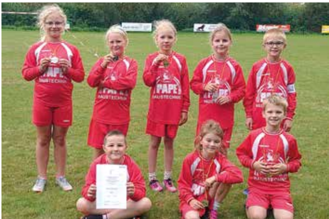
MTSV Selsingen - 2. Platz.