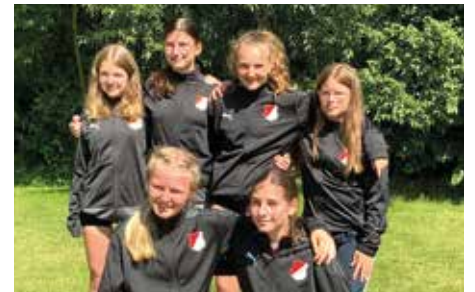
MTSV Selsing - 8. Platz.