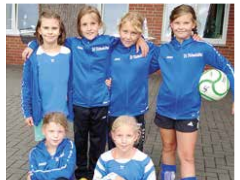
SV Düdenbüttel - 7. Platz.