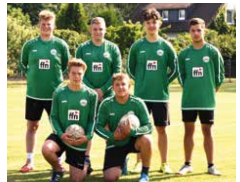
MTV Oldendorf - 6. Platz.