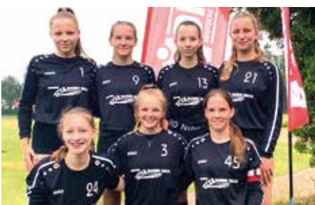
TV Jahn Schneverdingen - 4. Platz.