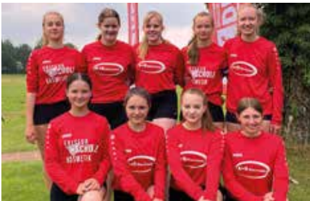
TV Huntlosen - 2. Platz.