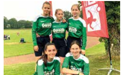
TuS Bothfeld - 8. Platz.