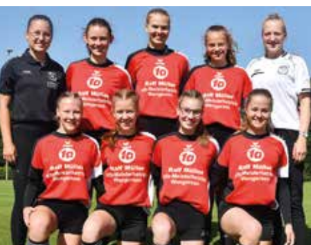
MTV Wangersen - 3. Platz.