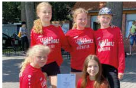
TV Huntlosen - 6. Platz.