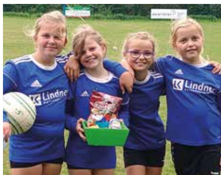
MTV Diepenau - 5. Platz.