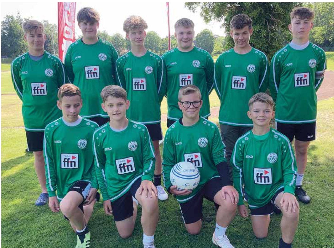
MTV Oldendorf - 1. Platz.