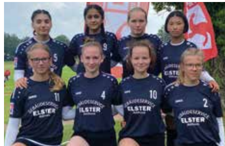
Ahlhorner SV - 5. Platz.