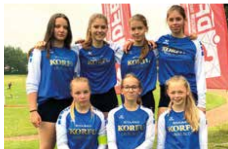
MTV Diepenau - 6. Platz.