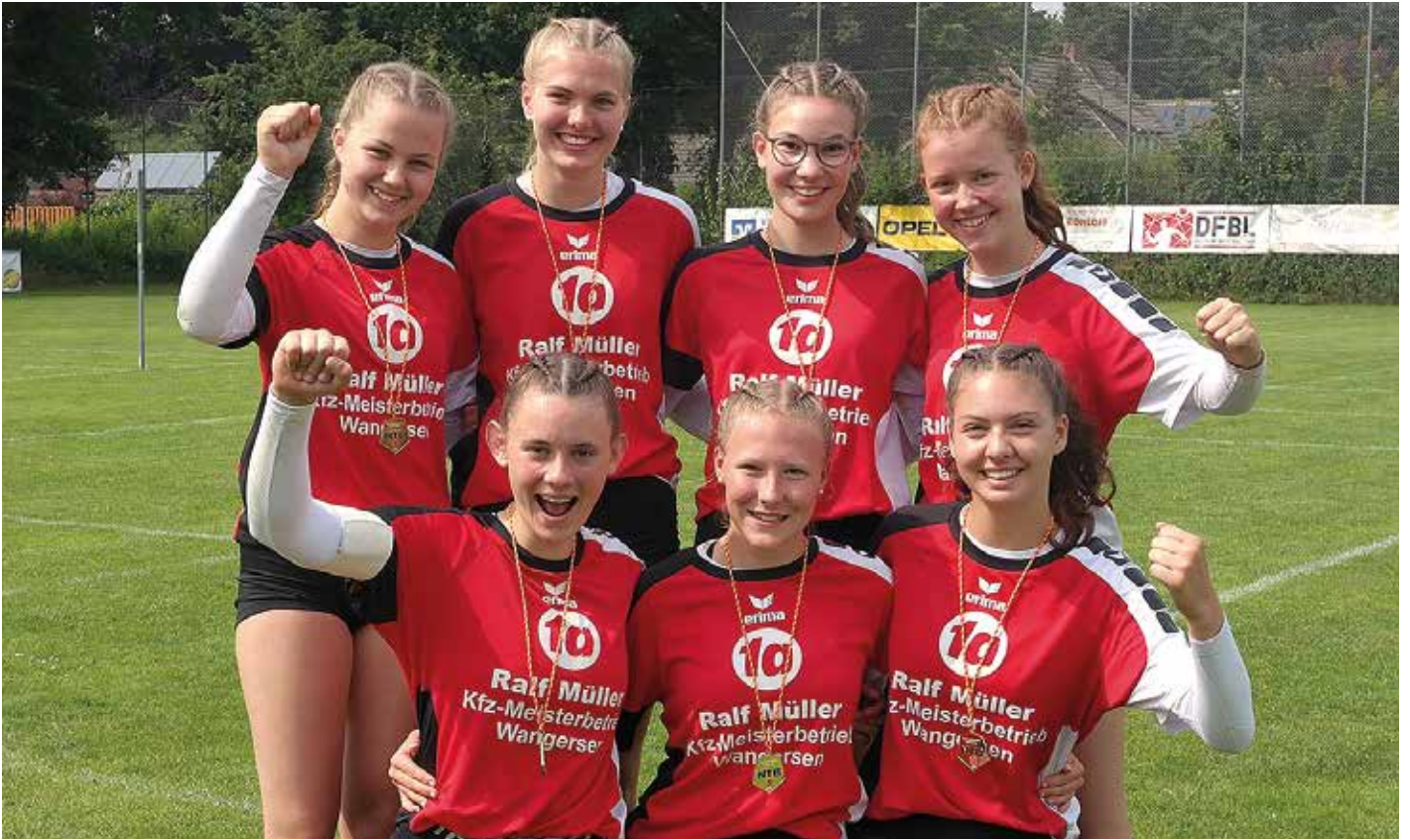
MTV Wangersen - 1. Platz.