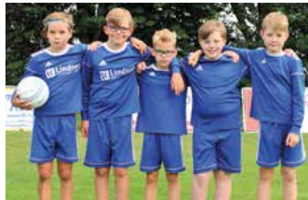
MTV Diepenau - 5. Platz.