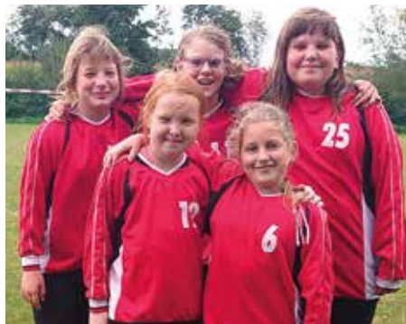
TV Huntlosen - 4. Platz.