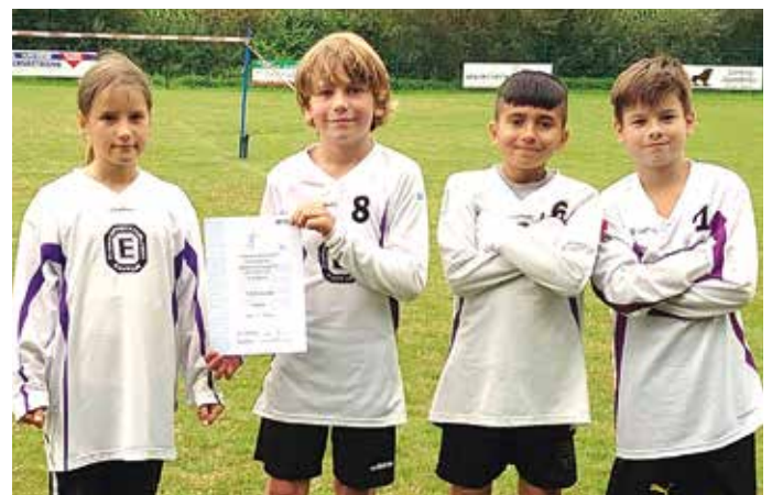
TuS Empelde - 5. Platz.