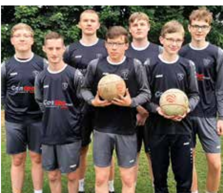
TV Brettorf - 3. Platz.