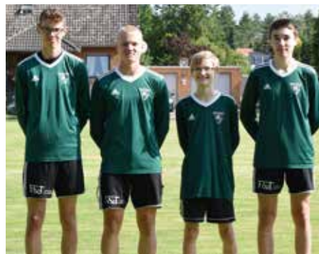
TSV Burgdorf - 4. Platz.