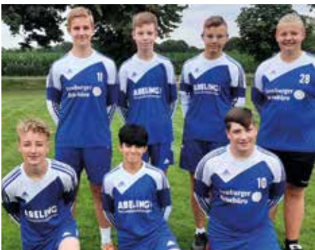
Ahlhorner SV - 2. Platz.