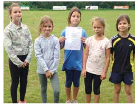
Ahlhorner SV - 6. Platz.