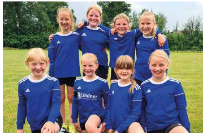
MTV Diepenau - 4. Platz.