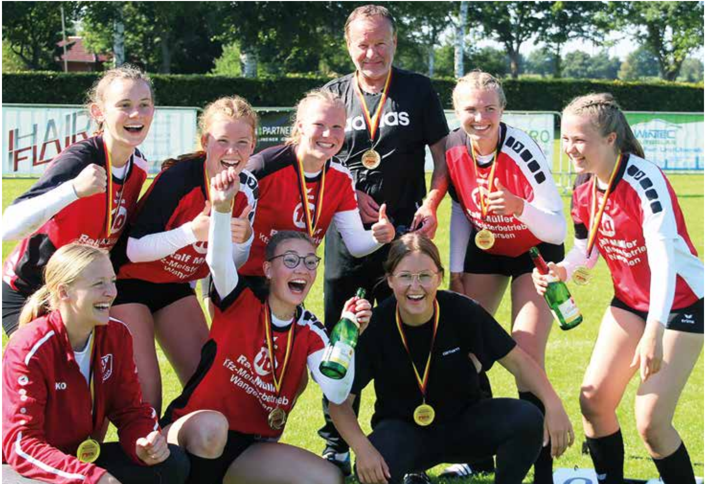
Sie feierten den Gewinn der Goldmedaillen mit einer Sektdusche: die U16-Faustballerinnen des MTV Wangersen.