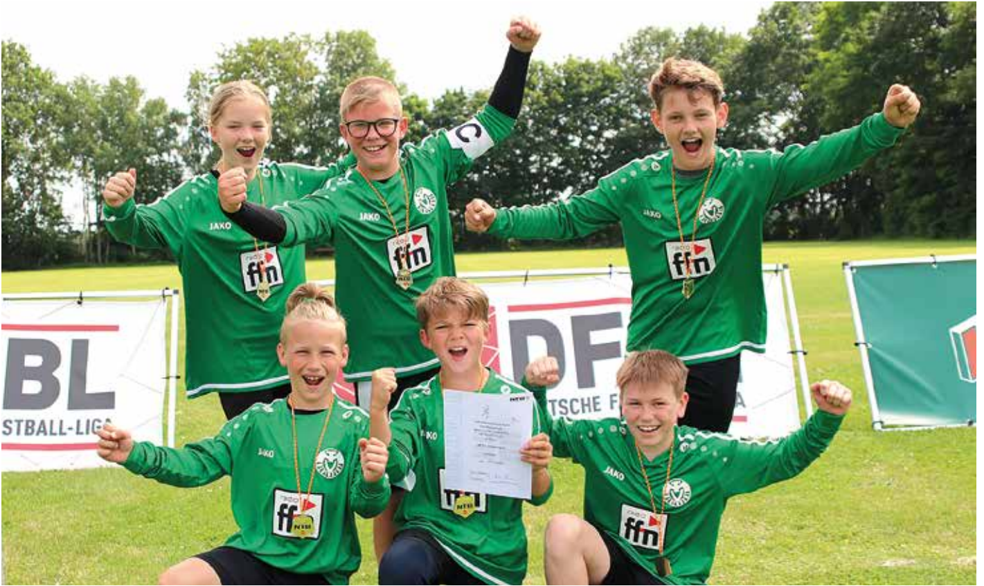
MTV Oldendorf - 1. Platz.