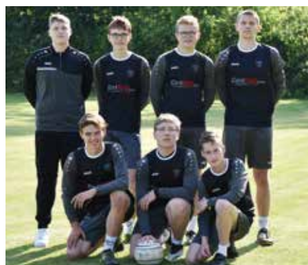
TV Brettorf - 5. Platz.