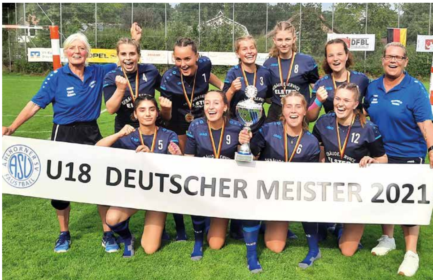
Ahlhorn gewinnt mit starker Leistung die Silbermedaillen