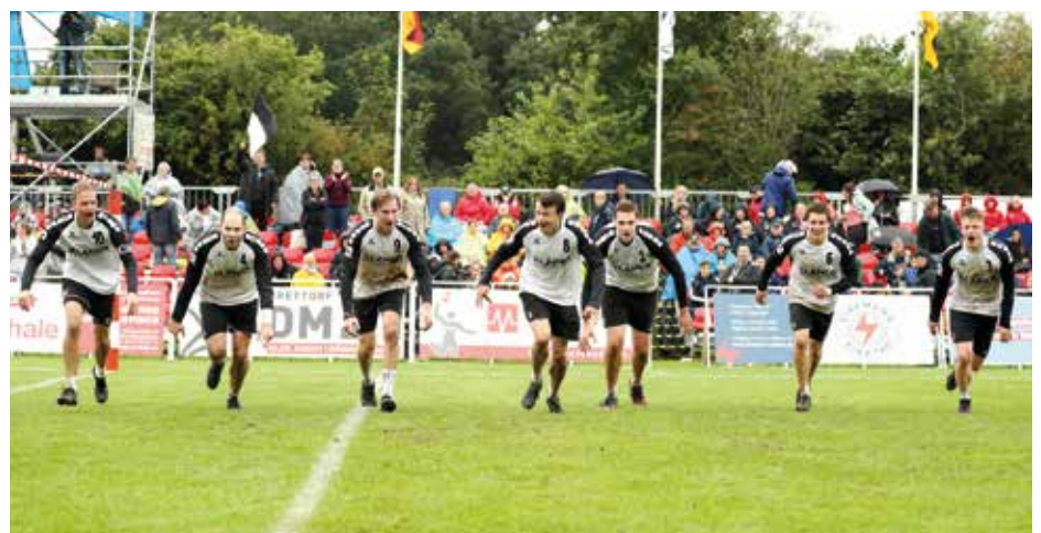
Die Brettorfer Jungs feiern den Gewinn der Bronze-Medaille.

Aufgrund der Corona-Pandemie war es am Ende nicht das rauschende Fest, das sich die Brettorfer Organisatoren erhofft hatten. Dafür gibt es 2022 eine weitere Chance. Dann richtet der TVB am 27. und 28. August die Deutsche Feldmeisterschaft der Männer und Frauen erneut aus – samt großem Faustballfest. Garantiert. (ssp)