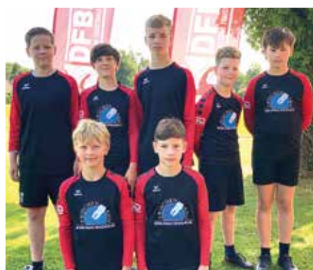
SV Moslesfehn- 5. Platz.