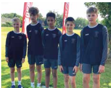
TV Brettorf - 2. Platz.