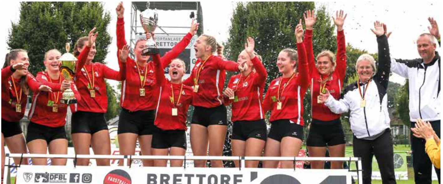
Das beste Team in Deutschland: Die Faustballerinnen des TV Jahn Schneverdingen gewinnen in Brettorf den DM-Titel.