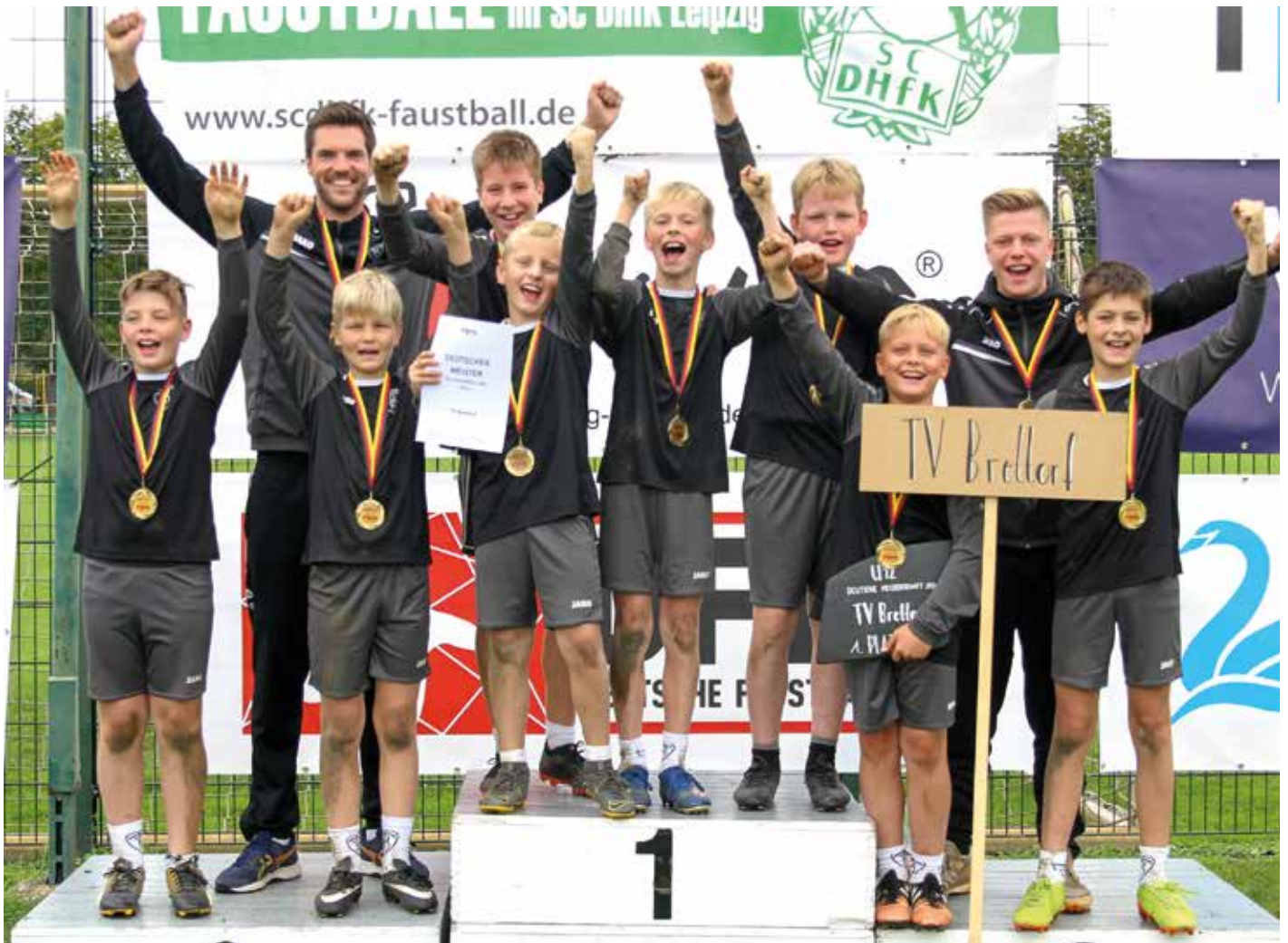
Große Freude herrschte nach dem überraschenden Gewinn der Deutschen Meisterschaft bei den U12-Jungen des TV Brettorf.