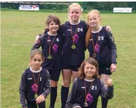
TV Jahn Schneverdingen - 2. Platz.