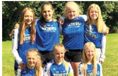
MTV Diepenau - 5. Platz.