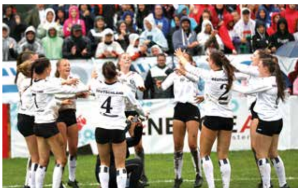
Jubel nach dem erneuten WM-Titel.

gewonnen. Im erneuten Aufeinandertreffen spielte Deutschland aber deutlich konzentrierter und machte mit 11:8, 11:8 und 12:10 den Finaleinzug perfekt. Bei nassem Boden und immer wieder einsetzendem Regen lieferte sich das deutsche Team hier gegen Österreich eine packende Begegnung. Die Gastgeberinnen gingen zunächst in Führung, dann aber übernahm Deutschland das Kommando und machte den vierten WM-Titel in Folge perfekt. (ssp)