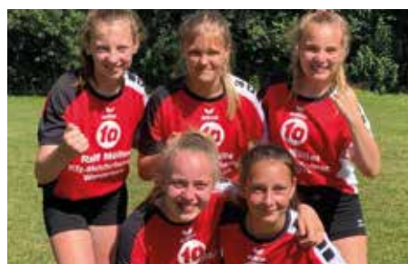
MTV Wangersen - 7. Platz.