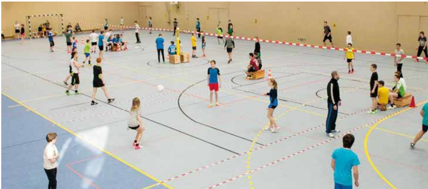
Jugendliche bei einem Schulf Faustballturnier.