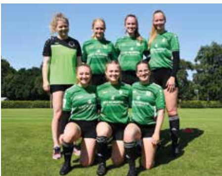
TSV Essel - 2. Platz.