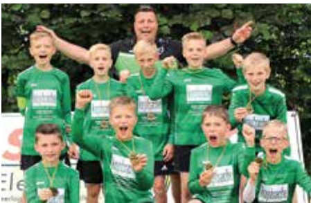
TSV Essel - 3. Platz.