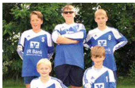
Ahlhorner SV - 7. Platz.