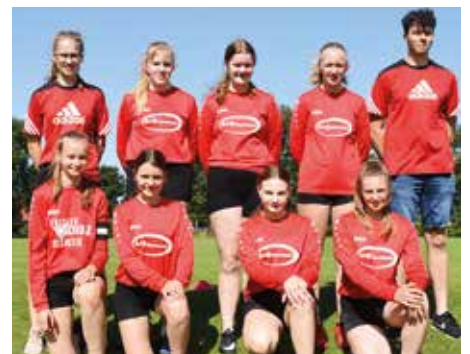
TV Huntlosen - 7. Platz.