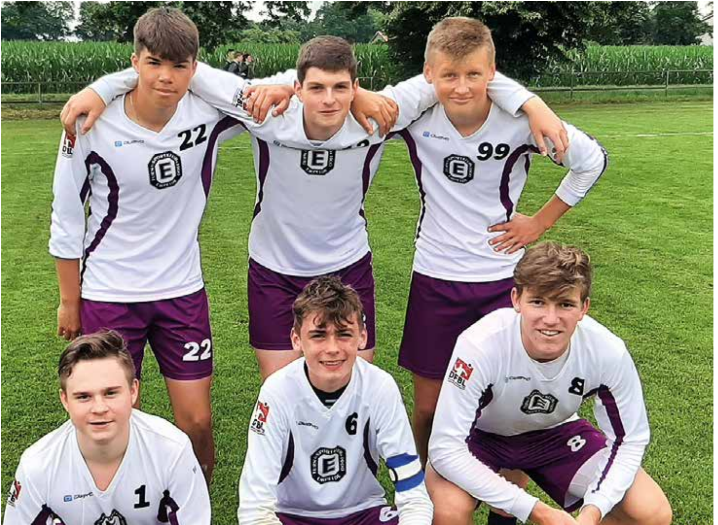
TuS Empelde - 1. Platz.