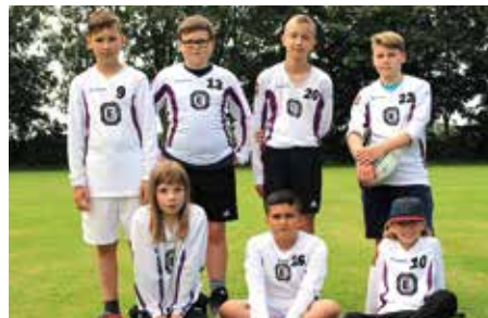
TuS Empelde - 6. Platz.