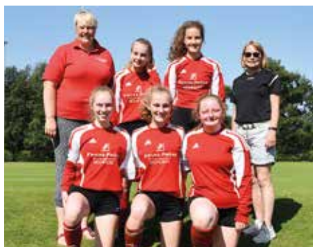
MTSV Selsingen - 5. Platz.