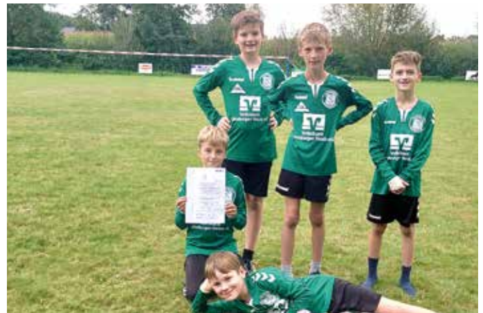
TSV Bardowick - 4. Platz.