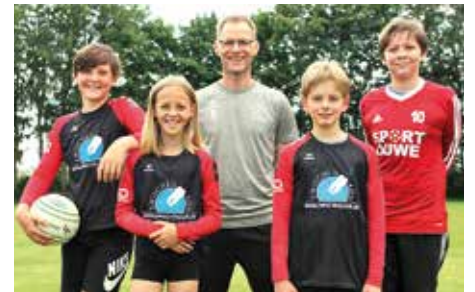
SV Moslesfehn - 8. Platz.