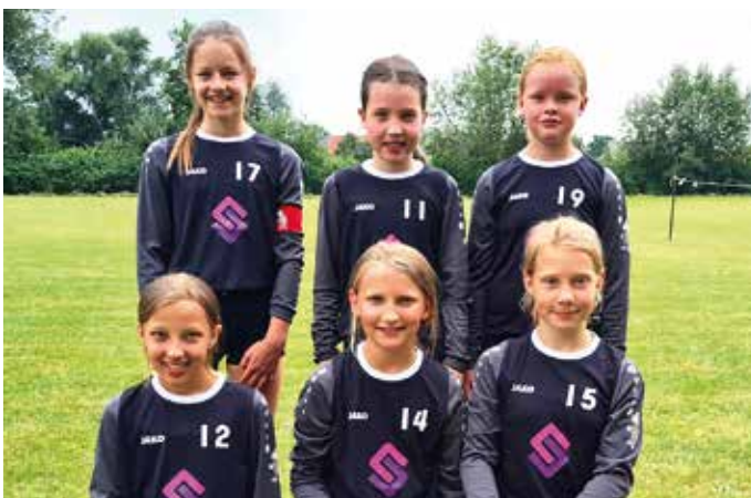
TV Jahn Schneverdingen - 3. Platz.