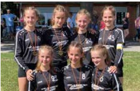
TV Jahn Schneverdingen - 3. Platz.