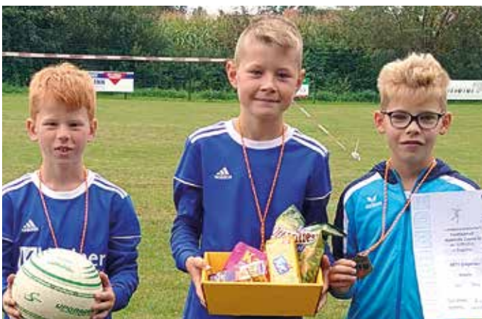
MTV Diepenau - 3. Platz.