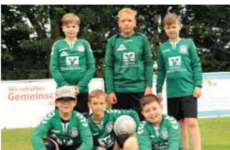
TSV Bardowick - 4. Platz.