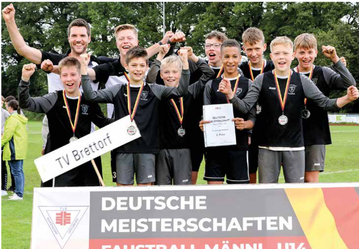
Erfolg für die Brettorfer Jungs: Deutscher Vizemeister der männlichen U14.