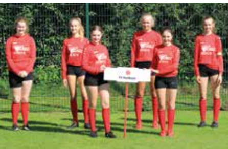
TV Huntlosen - 3. Platz.