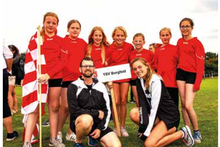
Der TSV Borgfeld bei der Deutschen Meisterschaft der U12.