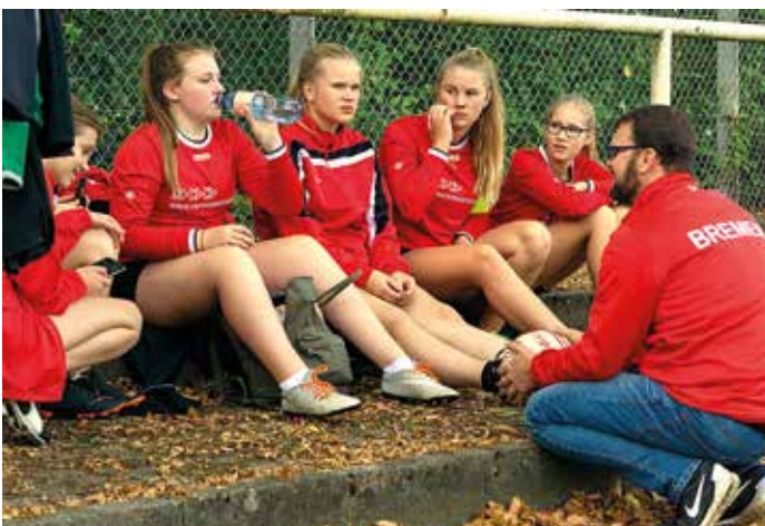
Deutschlandpokal 2019 in Dresden.