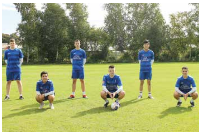
Ahlhorner SV - 2. Platz.