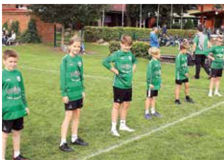
MTV Oldendorf - 5. Platz.