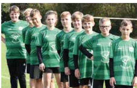
MTV Oldendorf - 4. Platz.