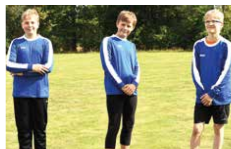
SCE Gliesmarode - 9. Platz.