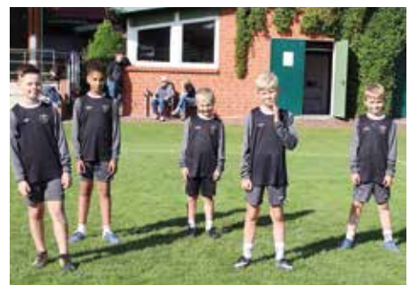
TV Brettorf 2 - 7. Platz.