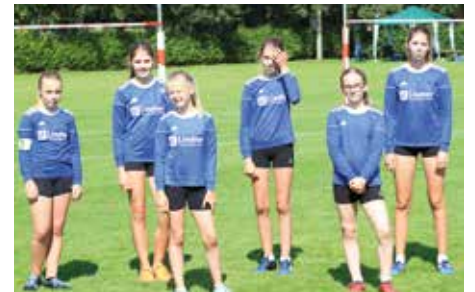
MTV Diepenau - 8. Platz.