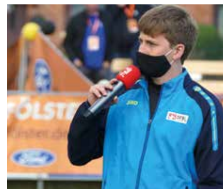
Ungewohnt: Moderation mit Mundschutz.