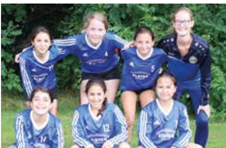
Ahlhorner SV - 3. Platz.