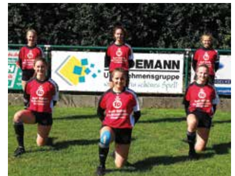
MTV Wangersen 2 - 6. Platz.