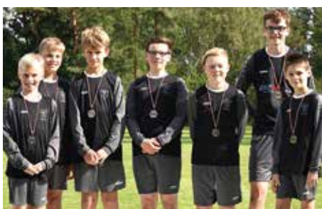
TV Brettorf - 3. Platz.