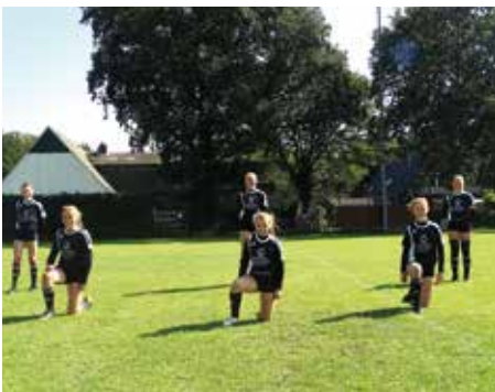
MTV Wangersen 1 - 2. Platz.