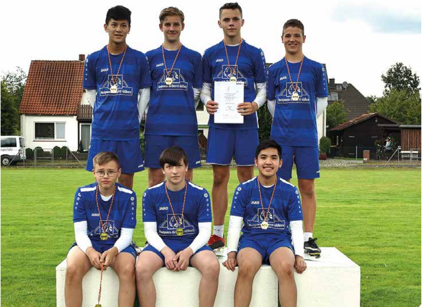
Ahlhorner SV - 1. Platz.