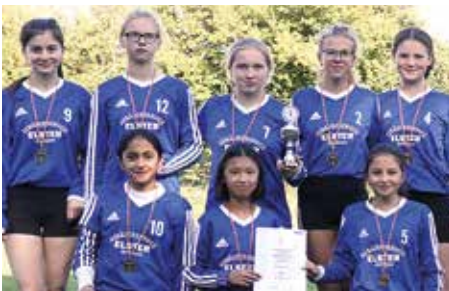
Ahlhorner SV - 3. Platz.