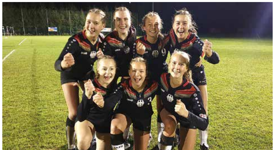
Länderspiel Österreich - Deutschland 2019 in Münzbach.

Merle: Gerade als der Lockdown war, habe ich viele Fitnessseinheiten absolviert. Und das ist auch nach den Lockerungen so geblieben. Neben dem Vereinstraining mache ich auch weiterhin noch Workouts und gehe mit einigen Freundinnen auf den Sportplatz, um auch zusätzlich zu trainieren.