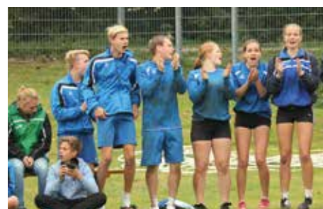
Gemeinsam laut: Mit vereinten Kräften werden die anderen NTB-Teams unterstützt.