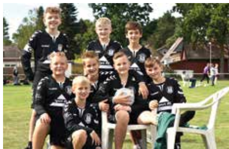
TSV Bardowick - 5. Platz.