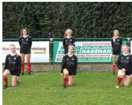
MTSV Selsingen - 4. Platz.