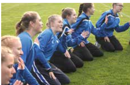
Darf nicht fehlen: Das Pferderennen bestreiten alle gemeinsam.