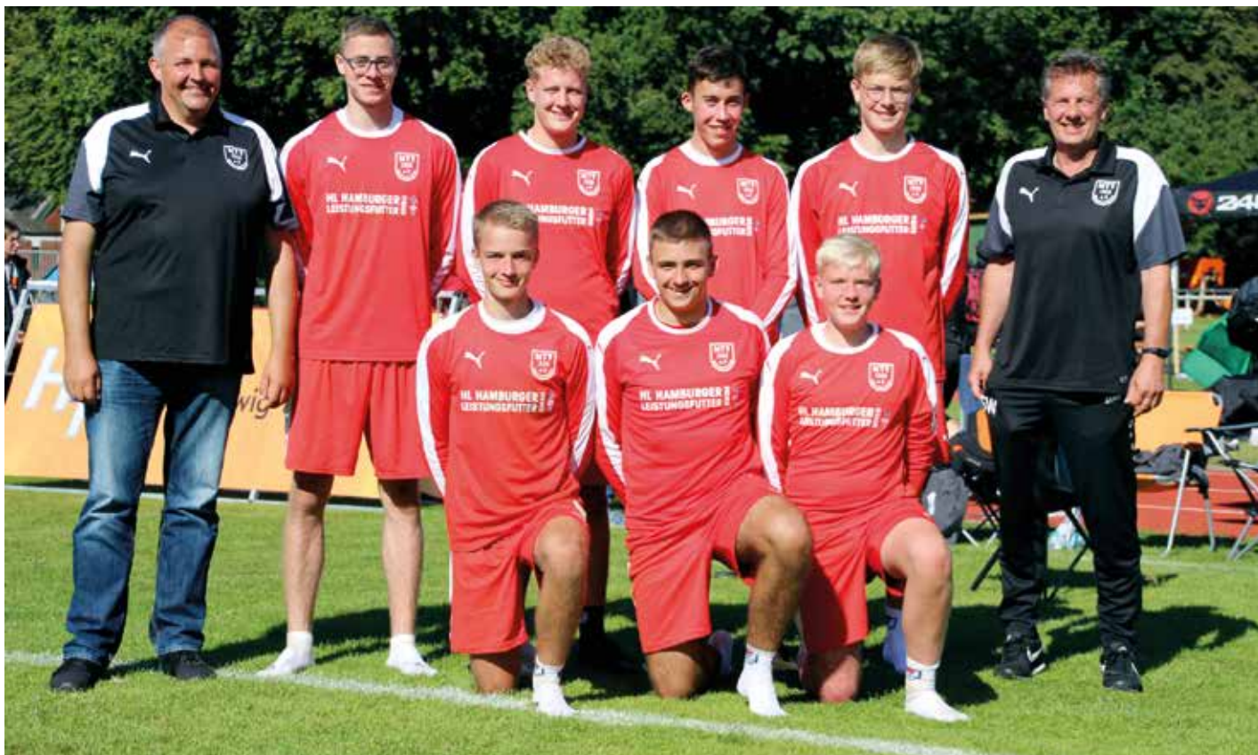
Mussten sich im Kampf um die Podestplätze geschlagen geben: Die U18 Jungs des MTV Wangersen schlossen die DM mit Platz vier ab.