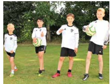
TV Brettorf 2 - 6. Platz.