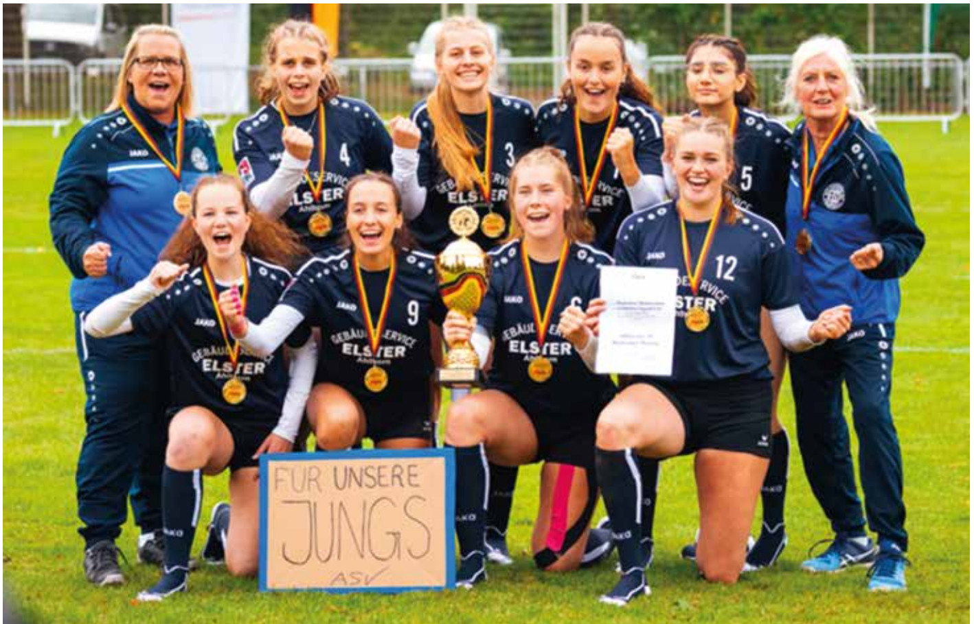
In der weiblichen U16 eine Macht: Der Ahlhorner SV ließ der Konkurrenz in Vaihingen/Enz keine Chance.