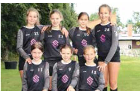
TV Jahn Schneverdingen - 4. Platz.