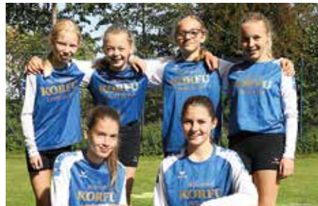
MTV Diepenau - 5. Platz.