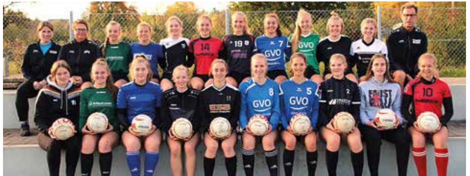
Lehrgang der weiblichen U18 2019 in Stammheim.

rinnen im Kader. Doch auch wenn alle drei Spielerinnen mit unterschiedlichen Voraussetzungen in den Kampf um die zehn Plätze im Kader eingreifen: Sie alle träumen davon, bei der Weltmeisterschaft 2021 dabei zu sein – und mit Deutschland den Titel zu gewinnen. (ssp)