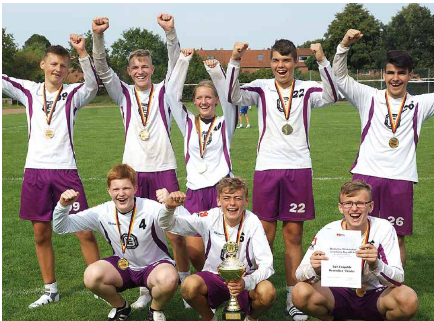
So jubelt der neue Deutsche Meister der männlichen U14: Der TuS Empelde triumphierte auf eigener Anlage.