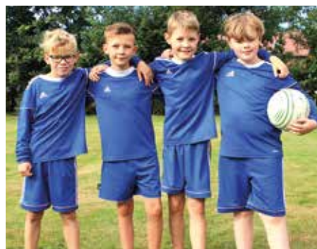
MTV Diepenau - 5. Platz.