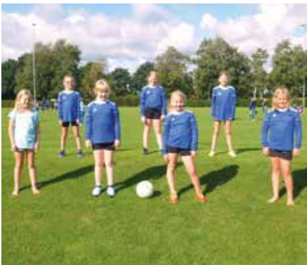
MTV Diepenau - 2. Platz.