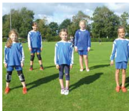
SV Düdenbüttel - 5. Platz.