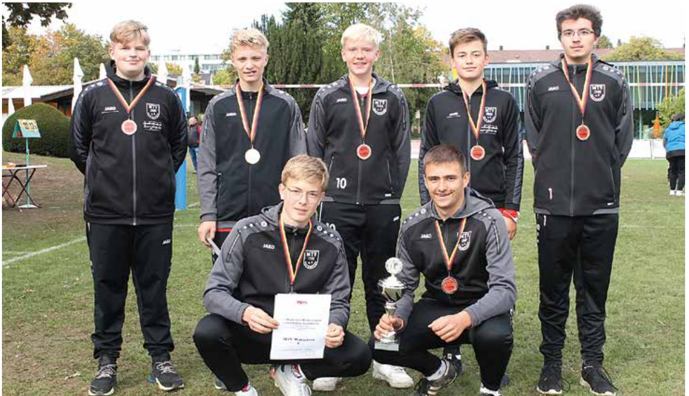
Versöhnlicher DM-Abschluss: Die männliche U16 des MTV Wangersen gewann die Bronzemedaille.