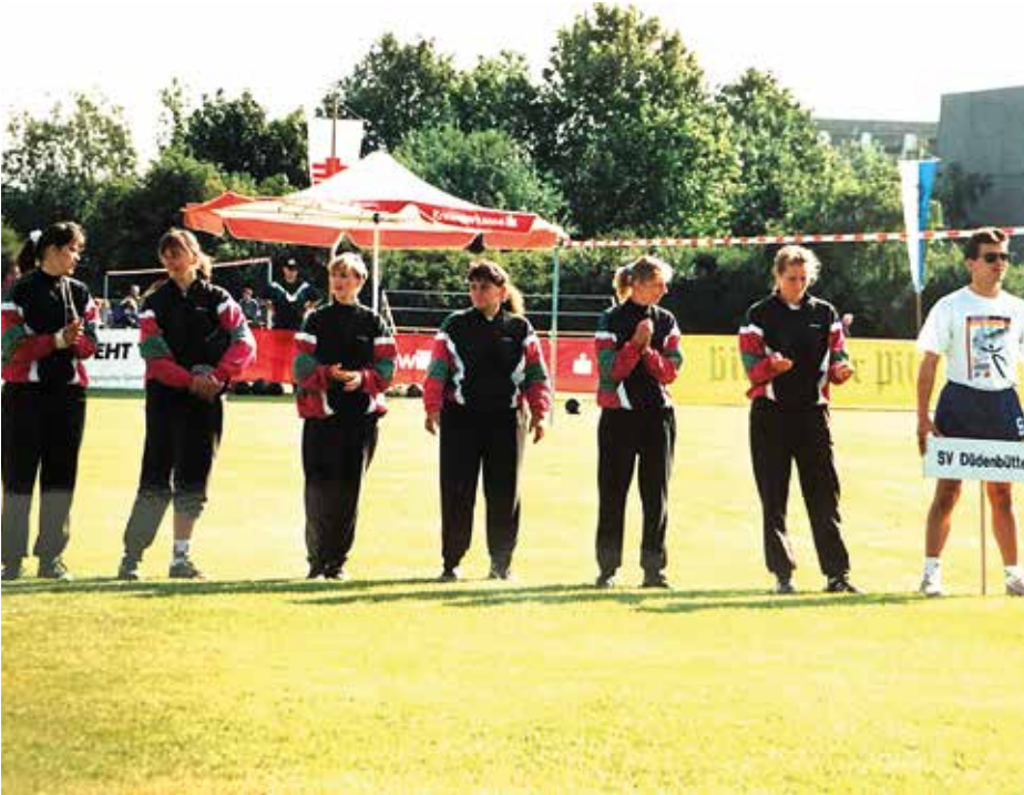
Bei der DM 1993 in Oberbruch: die Frauen vom SV Düdenbüttel.