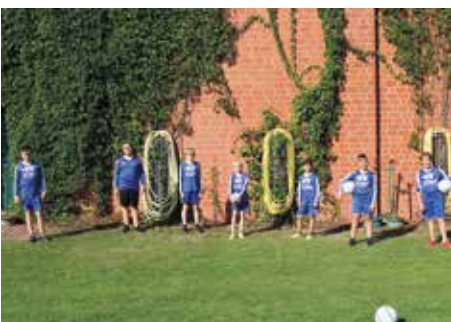
Ahlhorner SV - 3. Platz.