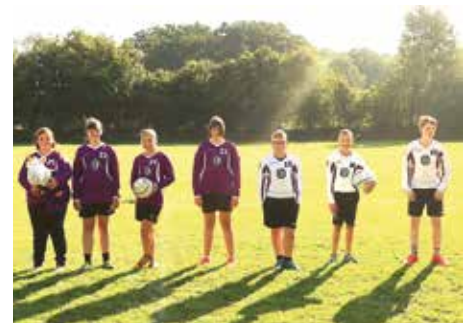
TuS Empelde - 6. Platz.