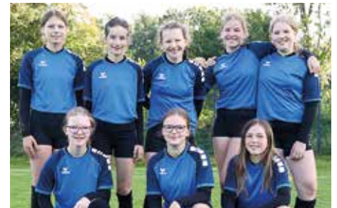
Wardenburger TV - 8. Platz.