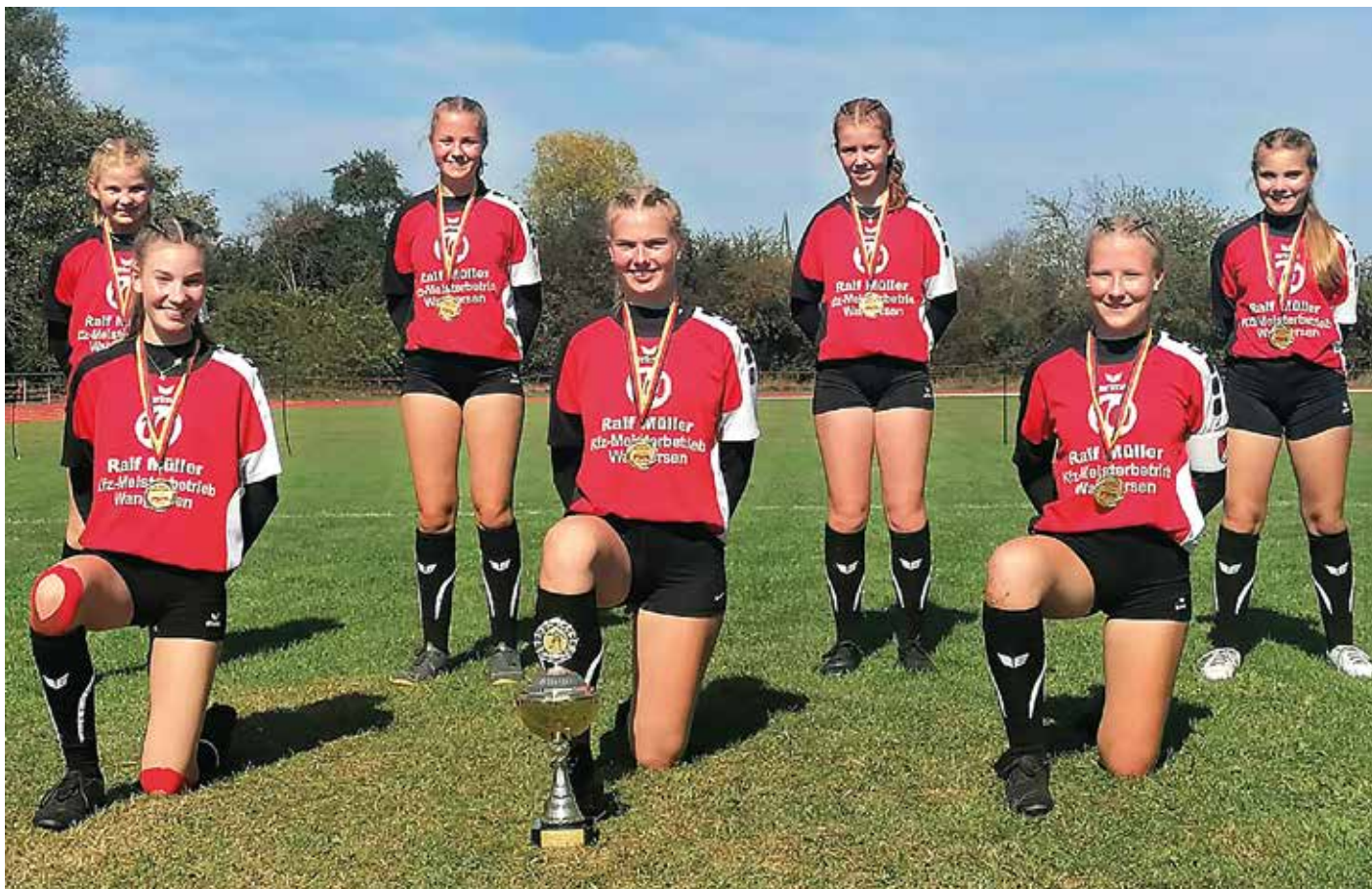
Siegerbild mit Abstand: Die U14-Mädchen des MTV Wangersen setzten sich bei der Deutschen Meisterschaft gegen die Konkurrenz durch.