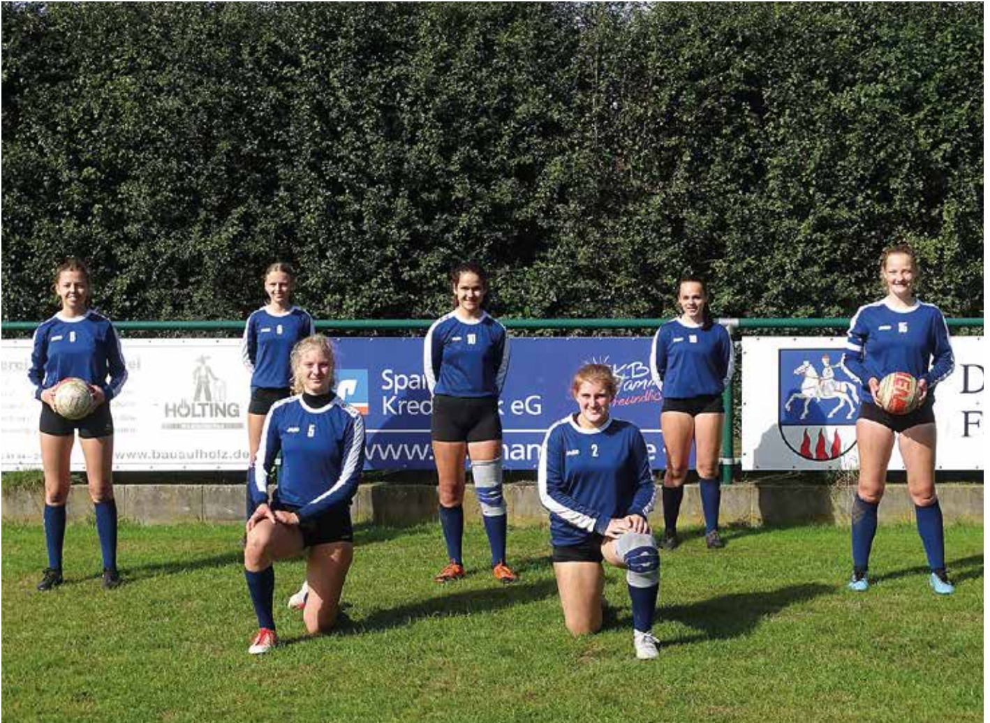
Wardenburger TV - 1. Platz.