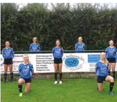
SV Düdenbüttel - 3. Platz.