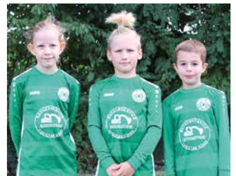
MTV Oldendorf - 7. Platz.