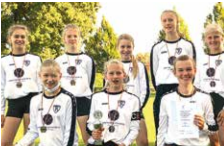
TV Brettorf - 2. Platz.