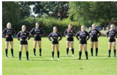
TV Jahn Schneverdingen - 6. Platz.