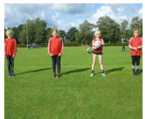
MTV Wangersen 2 - 6. Platz.