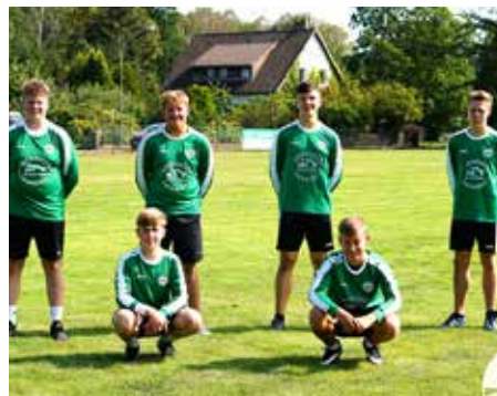
MTV Oldendorf - 4. Platz.