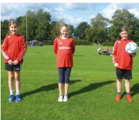
MTV Wangersen 1 - 3. Platz.