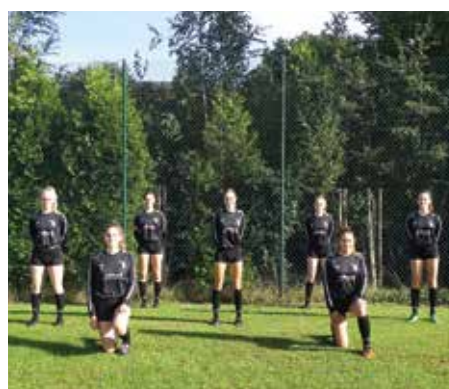
TV Jahn Schneverdingen - 5. Platz.