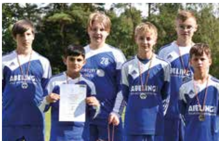
Ahlhorner SV - 2. Platz.