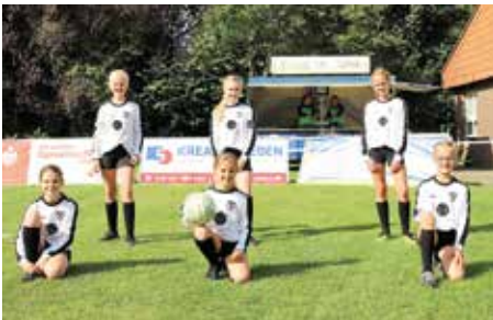
TV Brettorf - 2. Platz.