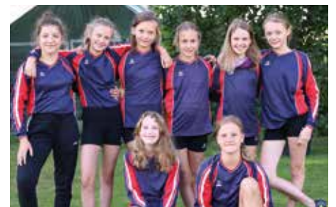
SV Düdenbüttel - 8. Platz.