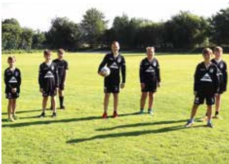
TSV Bardowick - 2. Platz.