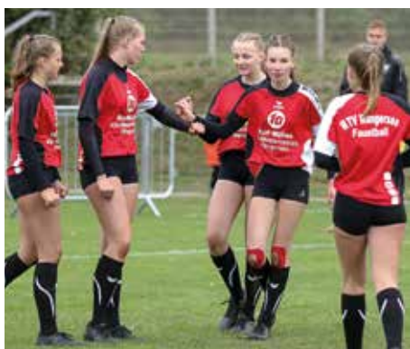
Abklatschen mit geschlossener Faust.