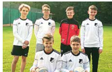
MTSV Selsingen - 7. Platz.