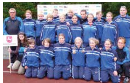
So fing alles an: Die beiden U14-Mannschaften beim Jugendeuropapokal 2010 in Weil am Rhein.