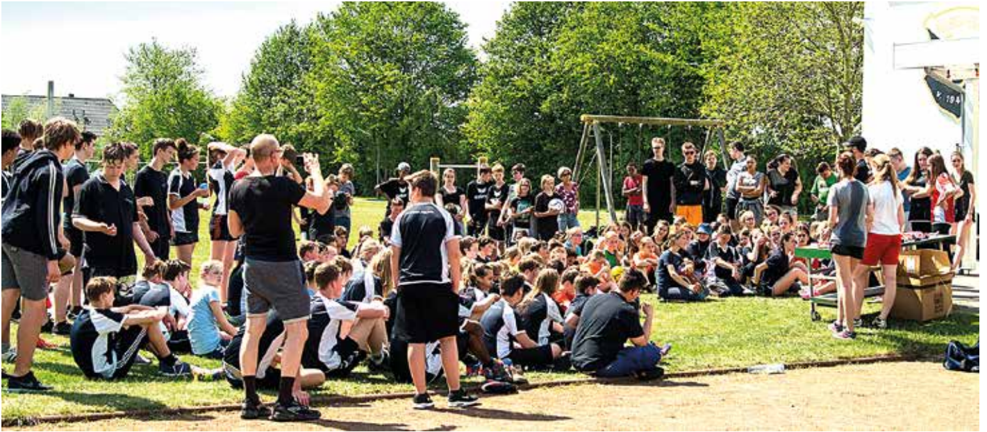
Siegerehrung beim Schulfaustballturnier 2016.