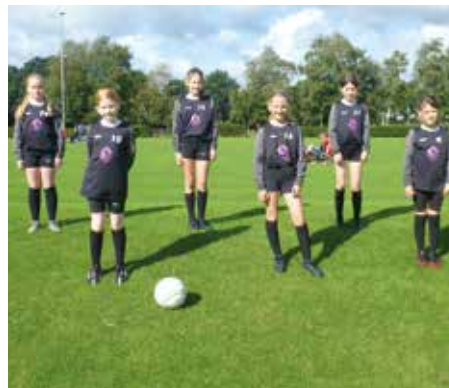
TV Jahn Schneverdingen - 4. Platz.