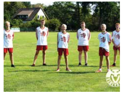
TSV Abbenseth - 6. Platz.