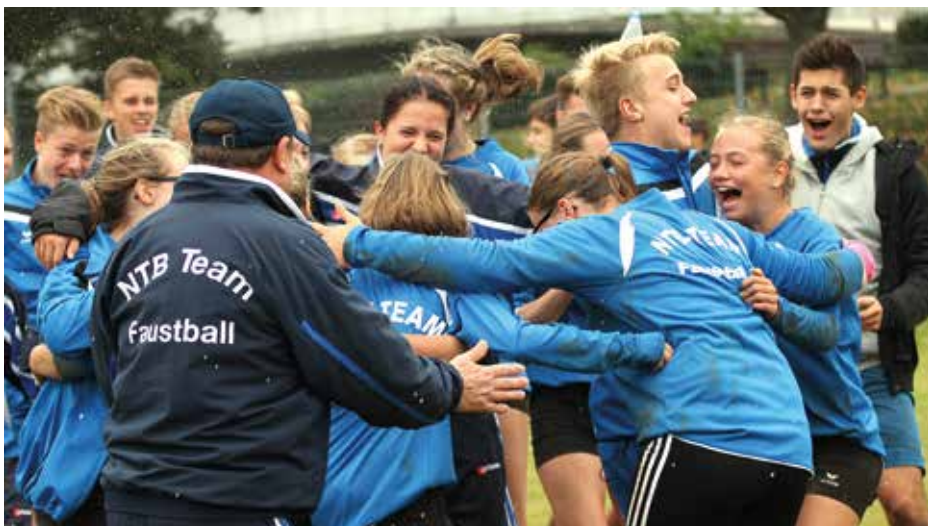
Großer Jubel: Gemeinsam feiert es sich immer noch am besten.