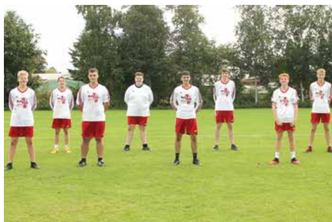
TSV Abbenseth - 3. Platz.

Wir unterstützen den Jugendfaustball in Niedersachsen.