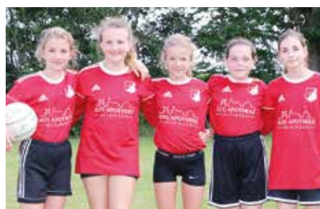
MTSV Selsingen - 6. Platz.