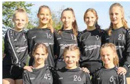
TV Jahn Schneverdingen - 6. Platz.