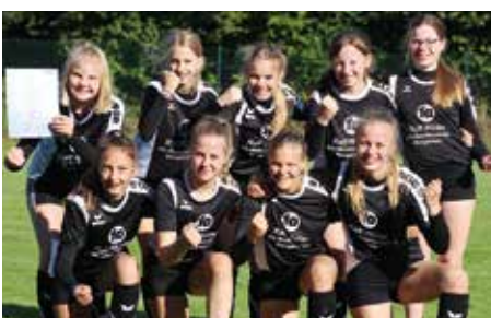
MTV Wangersen - 4. Platz.