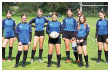
Wardenburger TV - 7. Platz.