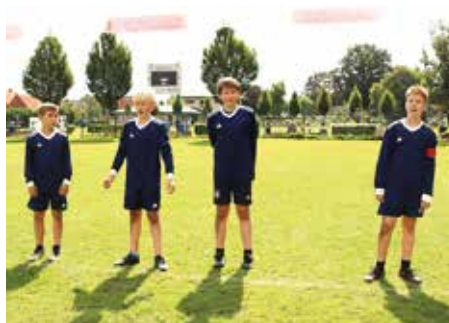
Wardenburger TV - 4. Platz.