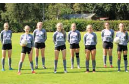
TSV Bardowick - 4. Platz.