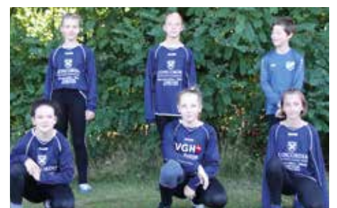
MTV Lübbberstedt - 9. Platz.