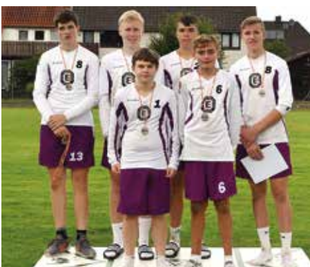
TuS Empelde - 3. Platz.