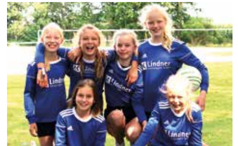
MTV Diepenau - 7. Platz.