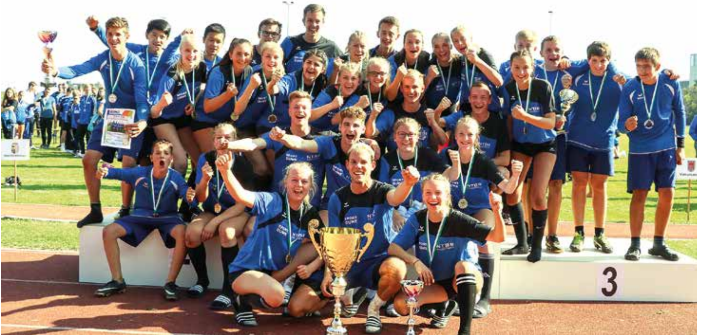
Erfolgreiche Delegation; 2018 feierte der NTB zum bisher letzten Mal den JEP-Titel.