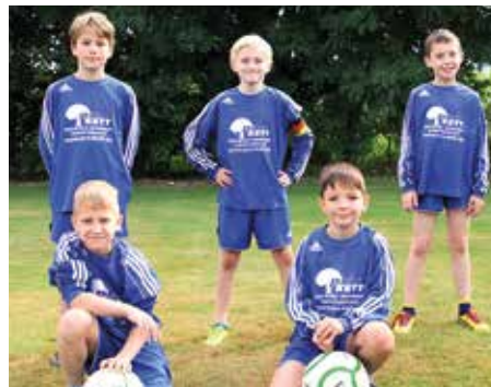
Ahlhorner SV - 4. Platz.