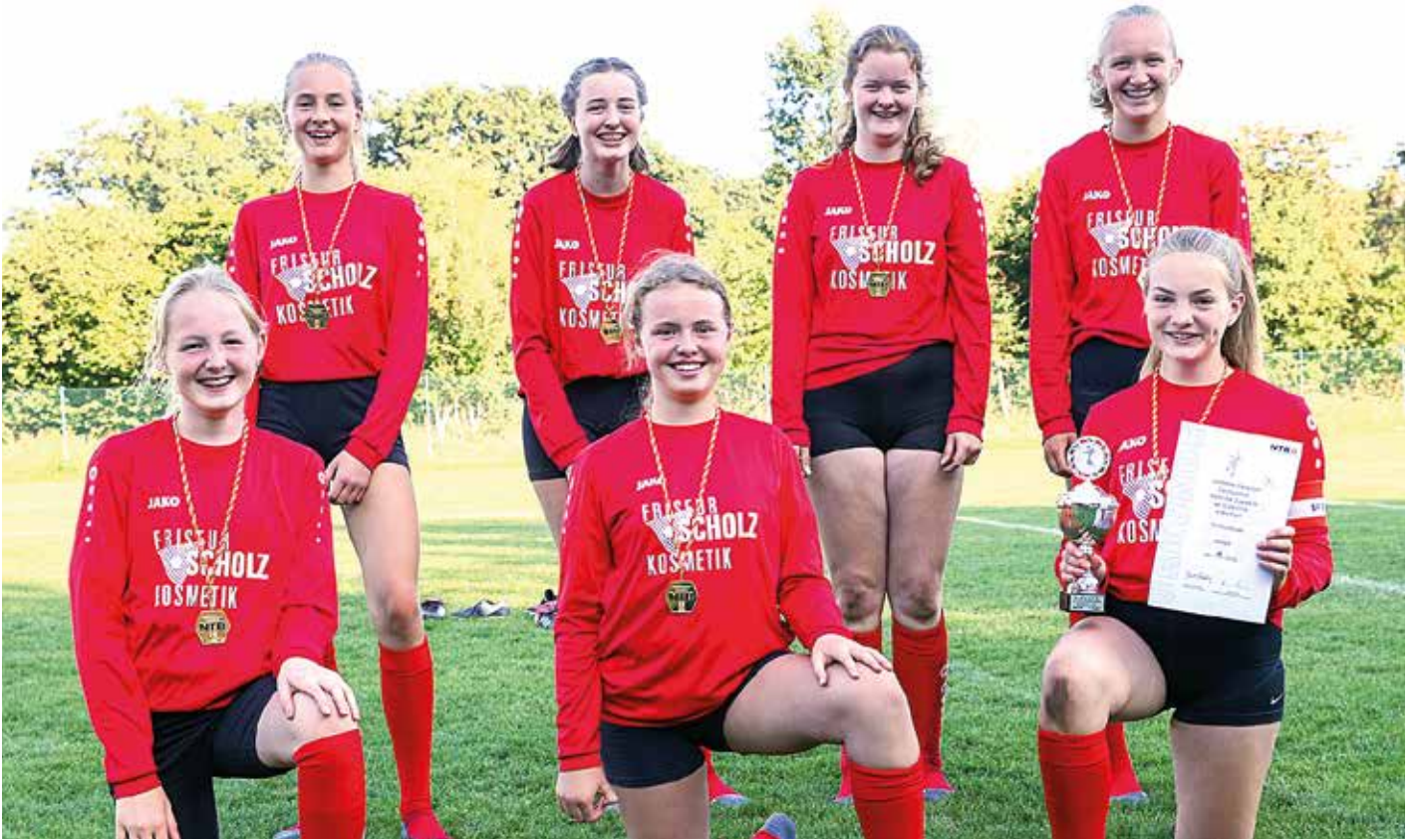
TV Huntlosen - 1. Platz.