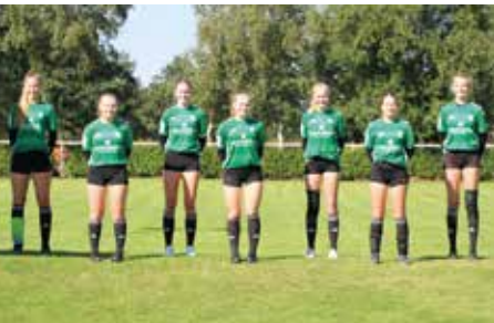
TSV Essel - 2. Platz.