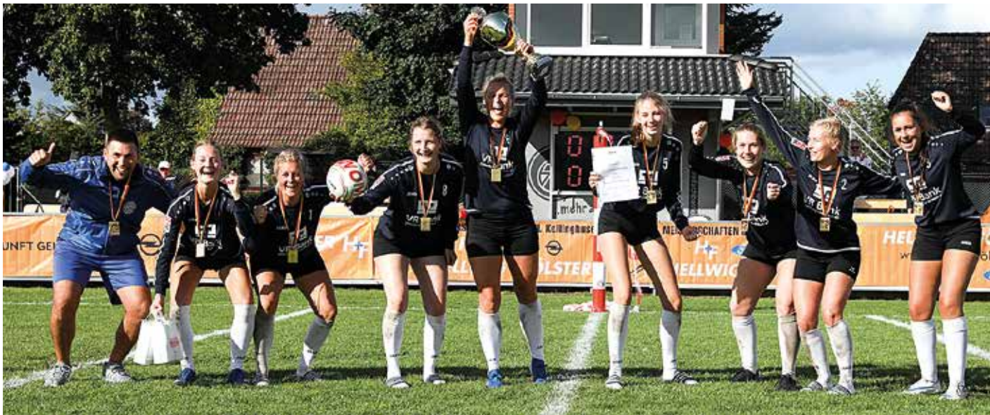
Das beste Team in Deutschland: Die Faustballerinnen des Ahlhorner SV verteidigen in Kellinghusen ihren DM-Titel.