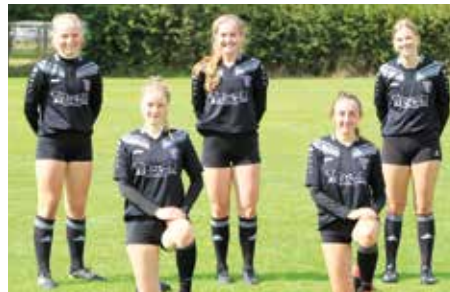
TV Brettorf - 5. Platz.