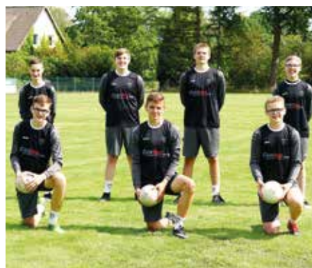
TV Brettorf - 5. Platz.