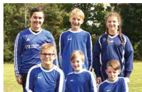
SV Düdenbüttel - 8. Platz.