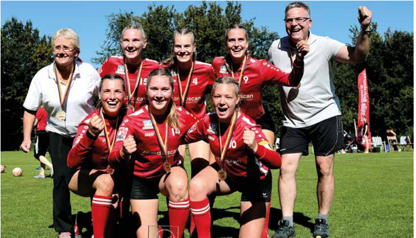
Triumphierten auf eigener Anlage: Die U18-Faustballerinnen des TV Jahn Schneverdingen belohnten sich für ihre starke Leistung mit DM-Gold.