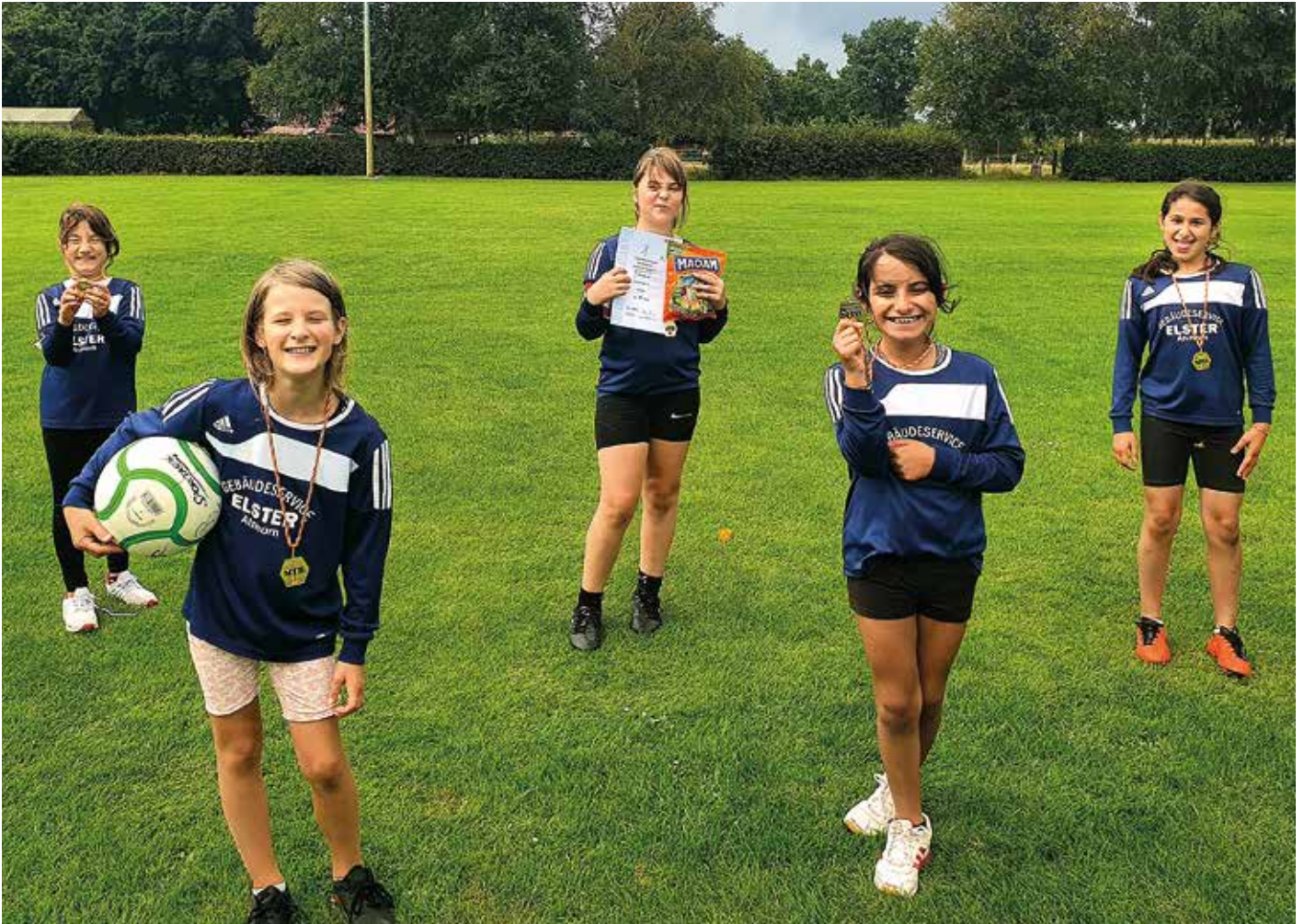
Ahlhorner SV - 1. Platz.