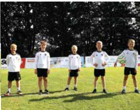
TV Brettorf 1 - 2. Platz.