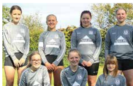
TSV Bardowick - 7. Platz.