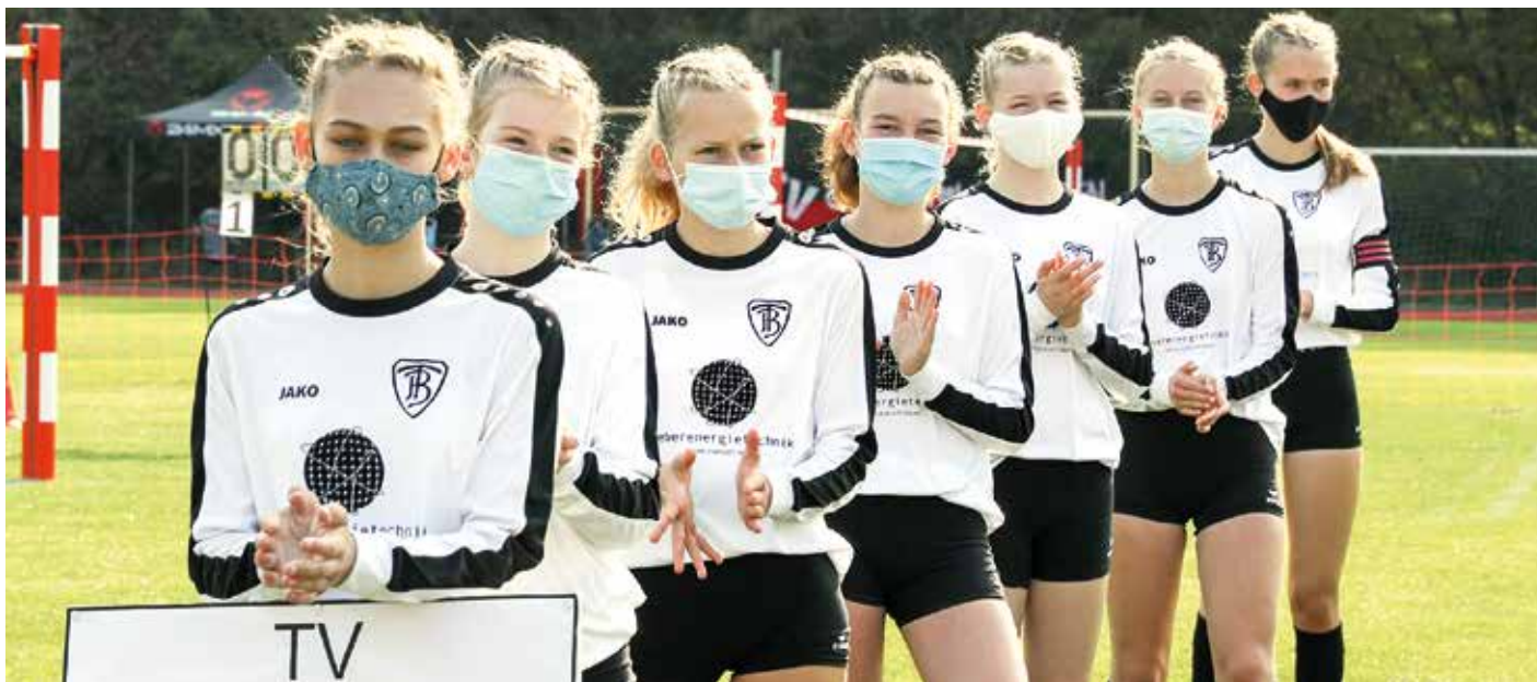
Eröffnung der Deutschen Meisterschaft in der Feldsaison 2020 - nur mit Hygienekonzept.