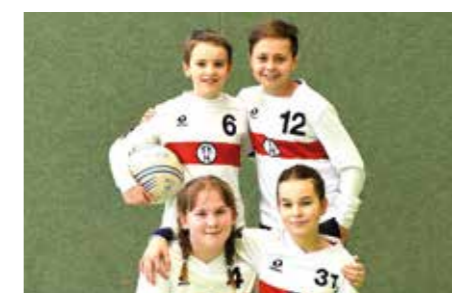
TK Hannover - 7. Platz.