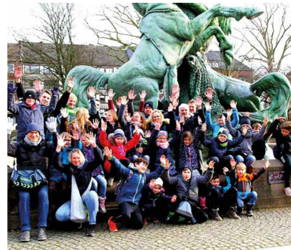
Gruppenbild mit den mitgereisten Eltern.

zweimal nachdem dieses Turnier zum ersten Mal durchgeführt wurde. Und wir sahen einen großen Unterschied und gewaltigen Fortschritt bei allen, es kamen tolle Spielzüge zustande und es waren viele spannende Spiele dabei. Insgesamt war das Teilnehmerfeld diesmal auch deutlich größer. Die Trainer waren stolz auf alle Teams und freuten sich auch, dass wieder so viele Eltern zum Anfeuern mit dabei waren. Im nächsten Jahr sind wir sicher wieder dabei. (ms)