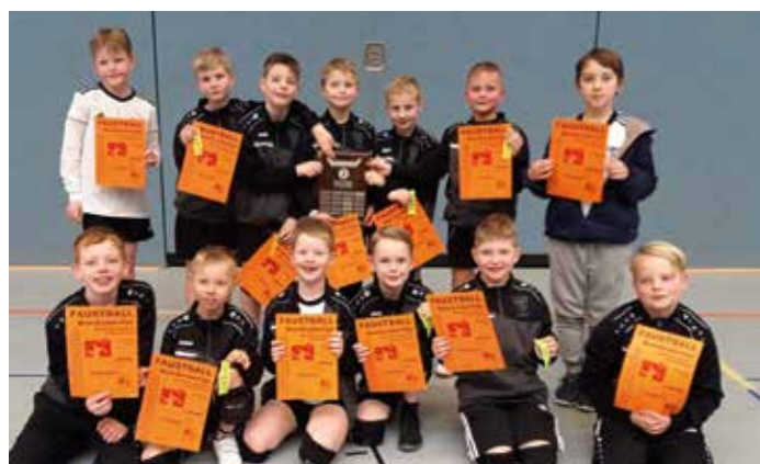
Hielten stolz die Urkunden in den Händen: die U8-Faustballer vom TV Brettorf.

die erste Brettorfer Mannschaft auf Platz eins (15:1 Punkte). Ärgster Rivale? Die eigene zweite Mannschaft. Sie steht nach acht Spielen mit 11:5 Punkten ebenfalls hervorragend da. Das junge Team TVB III sammelte dazu erste Erfahrungen im Meisterschaftsbetrieb – und schaffte gegen den ärgsten Rivalen aus Ahlhorn einen Sieg. (ssp)