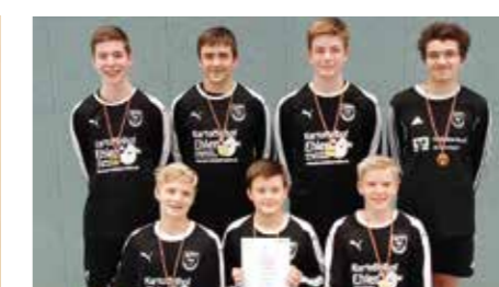
Jungen U16 - MTV Wangersen.