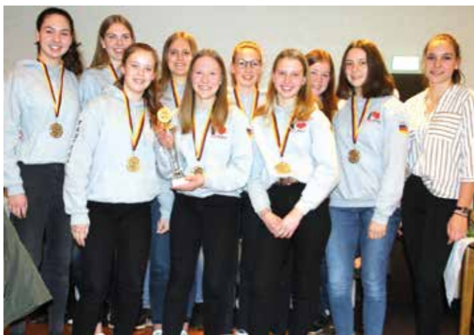
MTV Wangersen - 2. Deutsche Meisterschaft Mädchen U14 (Feld 2019).