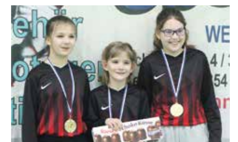
4. Platz - TuS Essenrode 1.