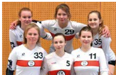
TK Hannover - 7. Platz.