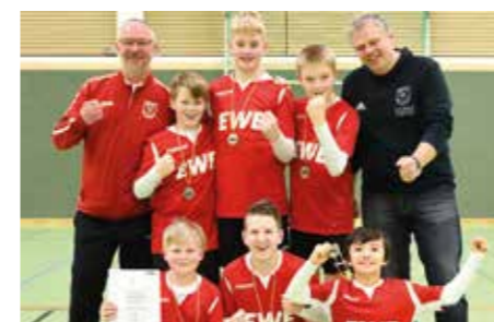
MTV Wangersen - 2. Platz.