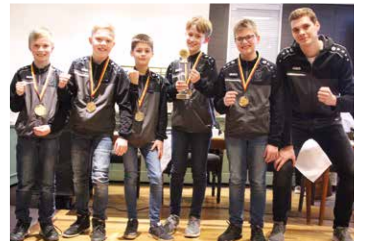
TV Brettorf - Landesmeister Halle 2018/2019.