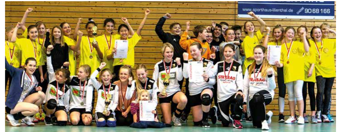
Premiere des Bremer Schul-Cups im Hallenfaustball geglückt. Die Teilnehmer bei der Siegerehrung.

Redaktionsschluss für Berichte von den Vereinen ist immer der 01.03. (Hallensaison) und der 01.09. (Feldsaison).