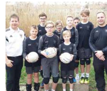
TV Brettorf - 4. Platz.