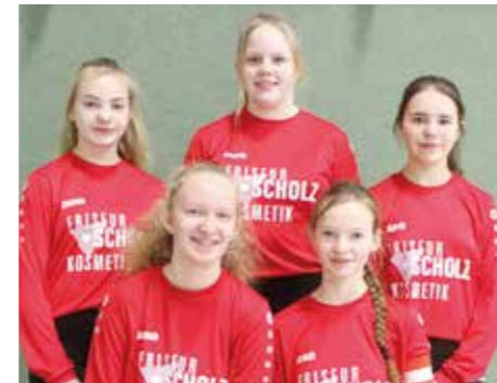
TV Huntlosen - 6. Platz.