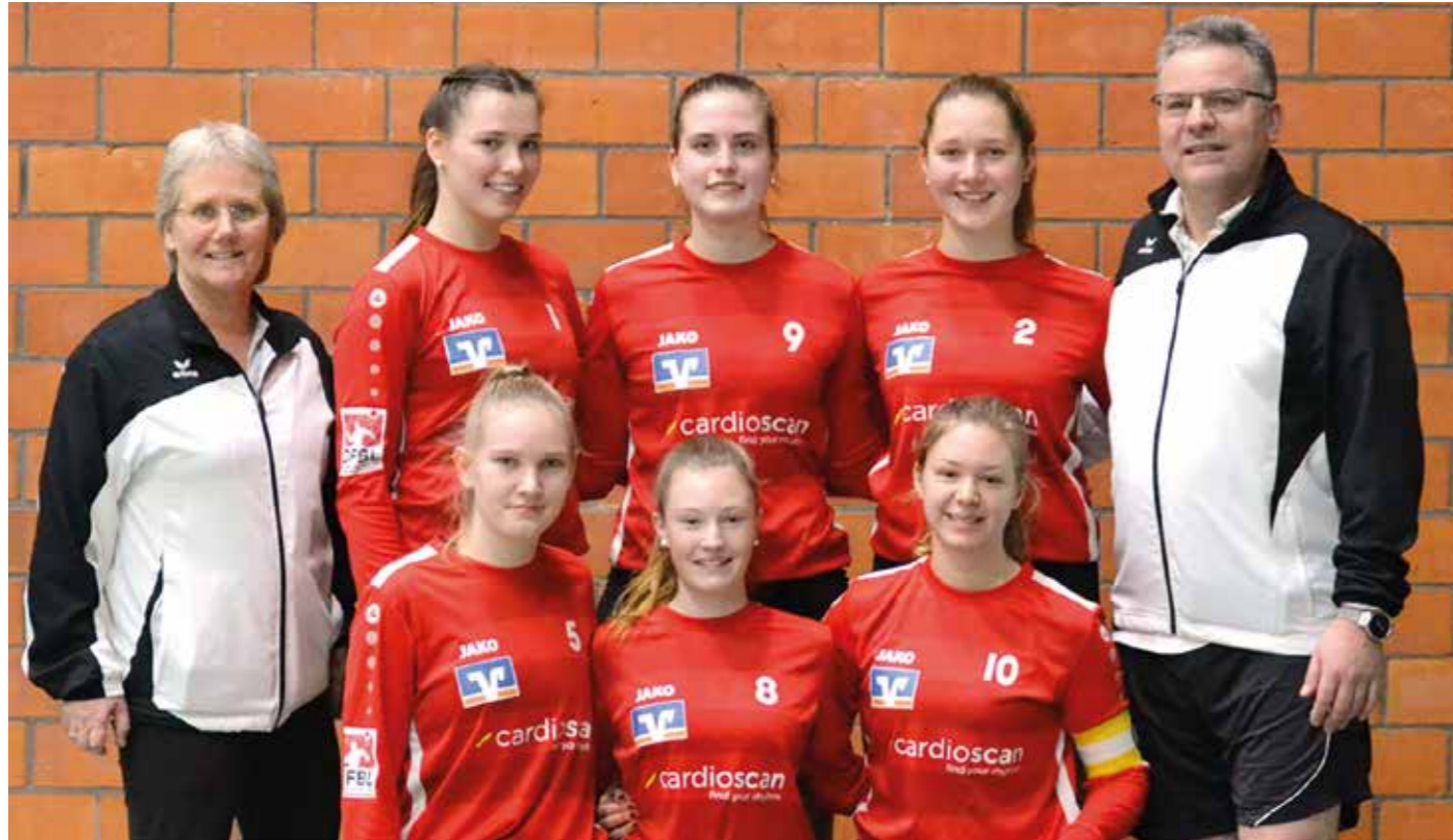
Norddeutscher Meister: Schneverdingen setzte sich im Endspiel gegen Ahlhorn durch.