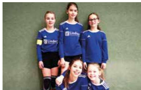
MTV Diepenau - 7. Platz.