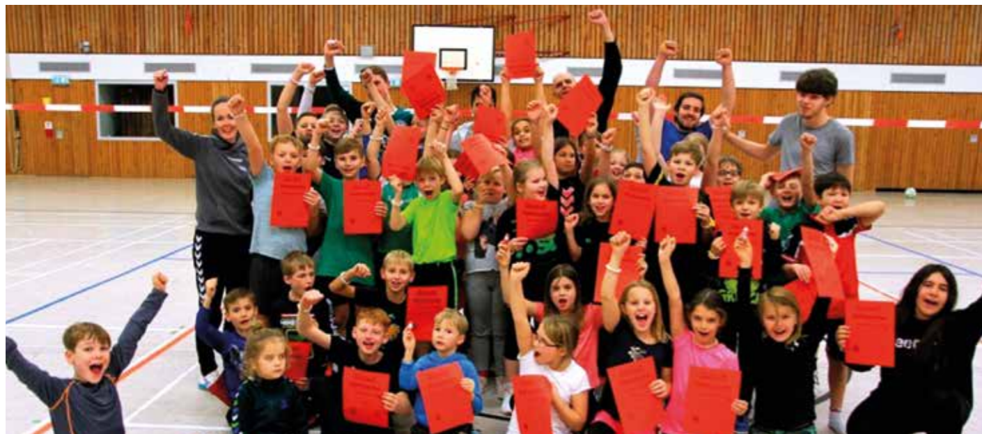
Große Freude bei Kindern und Trainern beim Bardowicker Weihnachtsturnier.