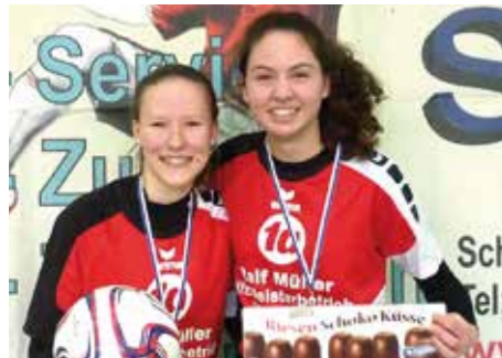
1. Platz - MTV Wangersen 4.