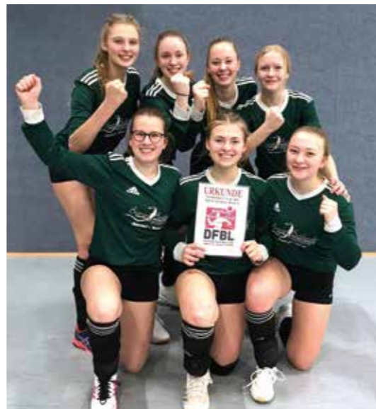
TSV Essel ist Vizemeister.

mit 2:0 (11:7, 11:6) gegen Hamm durch. Und auch im Endspiel geriet die ASV-Siegesserie nicht in Gefahr zu brechen. Mit 11:6 und 11:3 ließ Ahlhorn dem TSV Essel nicht den Hauch einer Chance. Brettorf ging im Spiel um den dritten Platz über drei Sätze - verließ mit 9:11, 11:7 und 11:13 aber als Verlierer den Platz. Rang fünf sicherte sich der MTV Wangersen mit einem 2:1-Erfolg (8:11, 11:4, 11:4) gegen Huntlosen. (ssp)