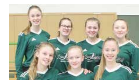
Mädchen U16 - TSV Essel.