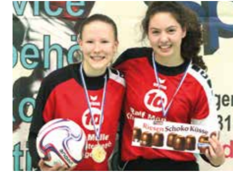
1. Platz - MTV Wangersen 4.