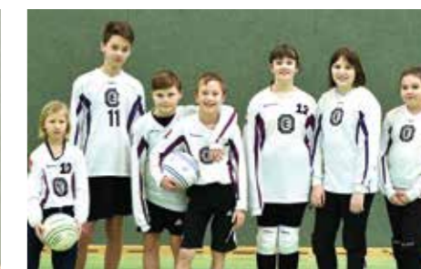
TuS Empelde - 7. Platz.