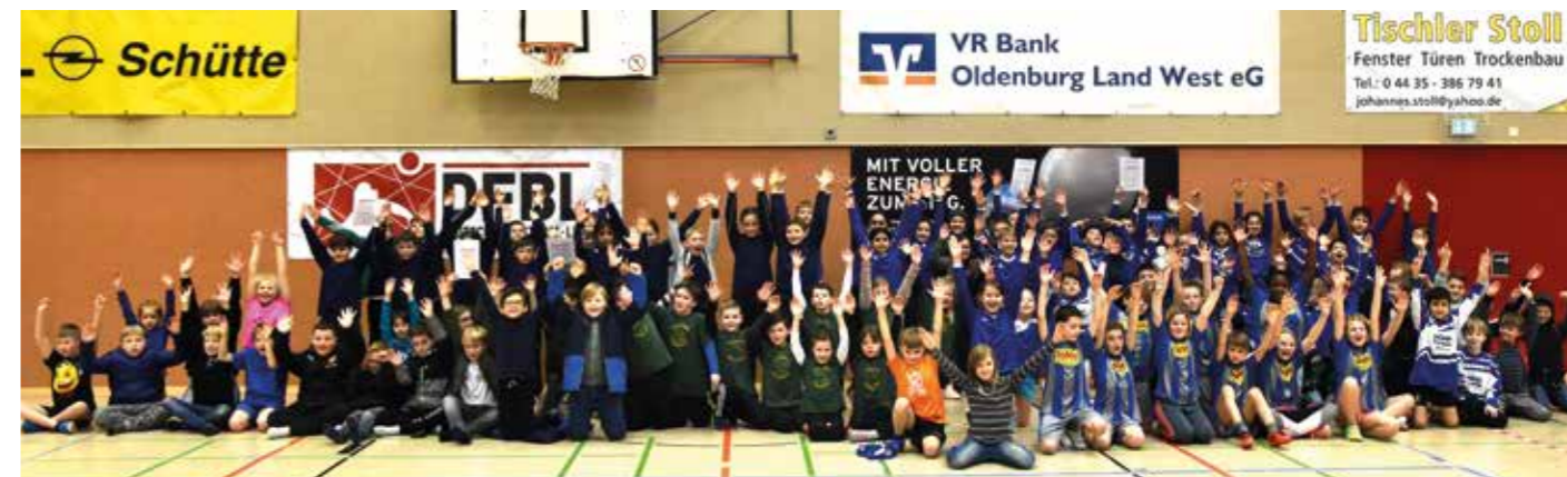
Großes Abschlussbild: Die Grundschulen aus Ahlhorn und Wardenburg hatten am Turnier des Ahlhorner SV großen Spaß. Foto um