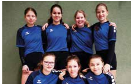
Wardenburger TV - 6. Platz.