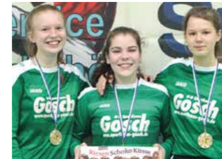
7. Platz - TuS Bothfeld.