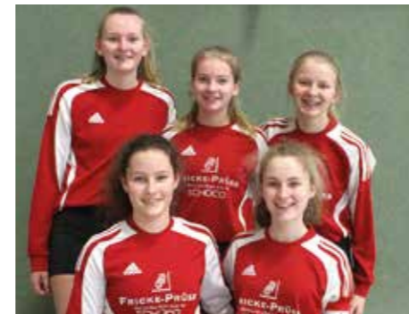
MTSV Selsingen - 7. Platz.