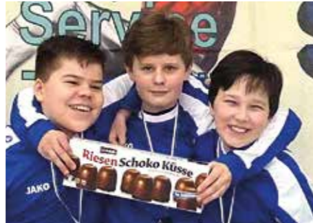
4. Platz - SCE Gliesmarode 2.