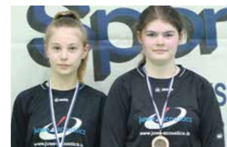
2. Platz - TV Oberg 2.