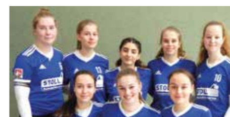
Mädchen U16 - Ahlhorner SV.

Ungewöhnlicher kann eine Saison wohl nicht enden. Ohne die Durchführung der Deutschen Meisterschaften war plötzlich Schluss. Das Coronavirus zerstörte den Traum vieler junger Faustballer*innen, die sich intensiv und mit hohem Aufwand auf ihren Saisonhöhepunkt vorbereitet und gefreut hatten. Groß war natürlich auch die Enttäuschung bei den Verantwortlichen der ausrichtenden Vereine, die viele Stunden in die Vorbereitung investiert hatten. Einige Kommunen sperrten Anfang März ihre Sportstätten und die Reaktion der Deutschen Faustball-Liga (DFBL) ließ nicht lange auf sich warten. Die DFBL sagte alle Deutschen Meisterschaften ab. Es war eine Entscheidung der Vernunft zum richtigen Zeitpunkt. Die dramatische Entwicklung in den letzten Wochen hat uns gezeigt, wie nebensächlich unser schöner Faustballsport plötzlich werden kann.