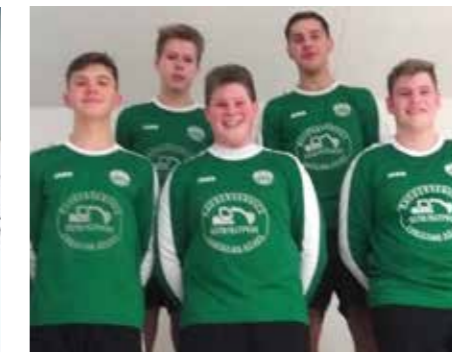
MTV Oldendorf - 5. Platz.