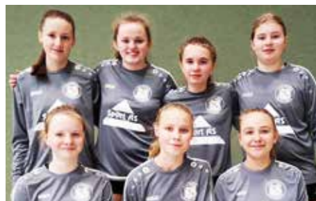
TSV Bardowick - 4. Platz.