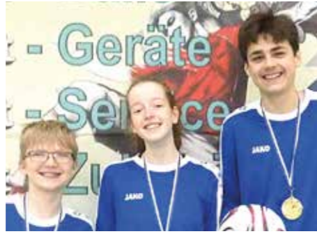
1. Platz - SCE Gliesmarode 1.