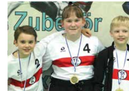
4. Platz - TK Hannover.