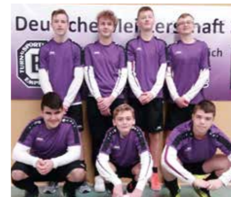
TuS Empelde - 2. Platz.