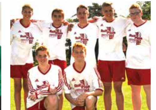
TSV Abbenseth - 7. Platz.