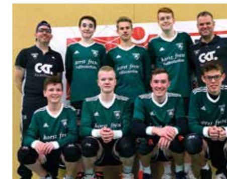
TSV Burgdorf - 3. Platz.