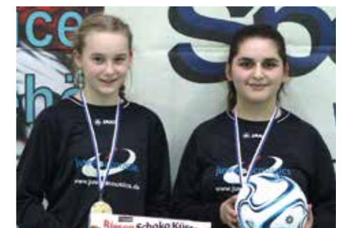
1. Platz - TV Oberg 1.