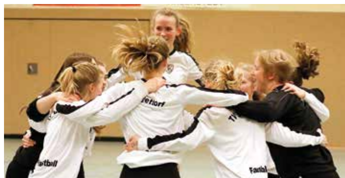
Jubel beim TV Brettorf...