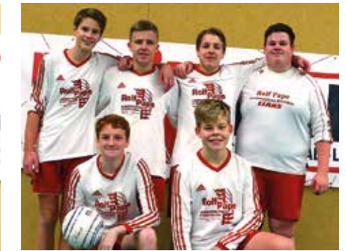
TSV Abbenseth - 6. Platz.