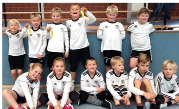
Der Bundesliga-Nachwuchs von morgen: Die U10 vom TVB setzte sich im Bezirk durch.