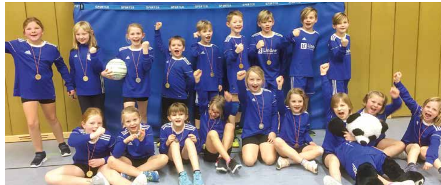
Wollen auch künftig an die ersten Erfolge anknüpfen: Diepenau U10-Faustballer.