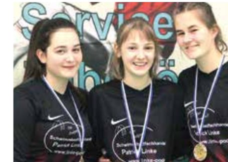
5. Platz - TuS Essenrode 1.