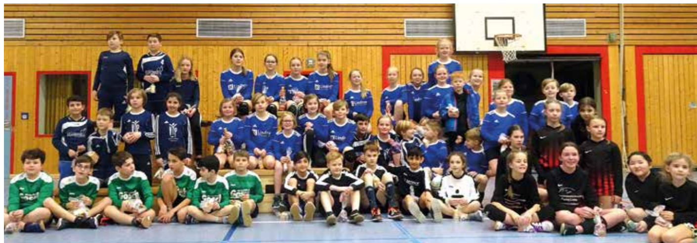
Die Siegerehrung beim Bezirkspokal in Uchte.