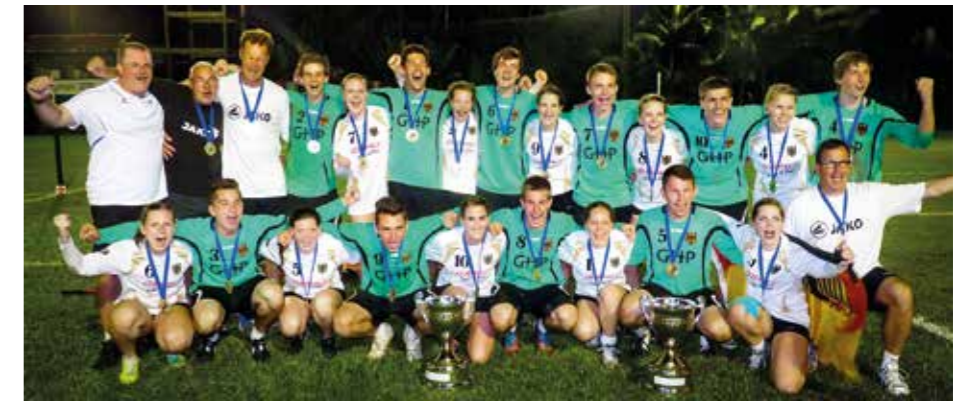
2014 in Pomerode (Brasilien): Deutschland ist Doppelweltmeister.

Die Spieler*innen in kursiver Schrift wurden Weltmeister*innen.