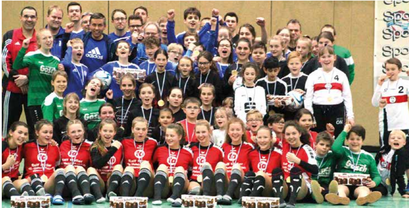
Gruppenfoto der teilnehmenden Mannschaften.