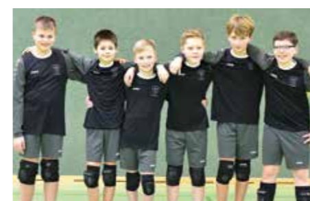
TV Brettorf - 4. Platz.