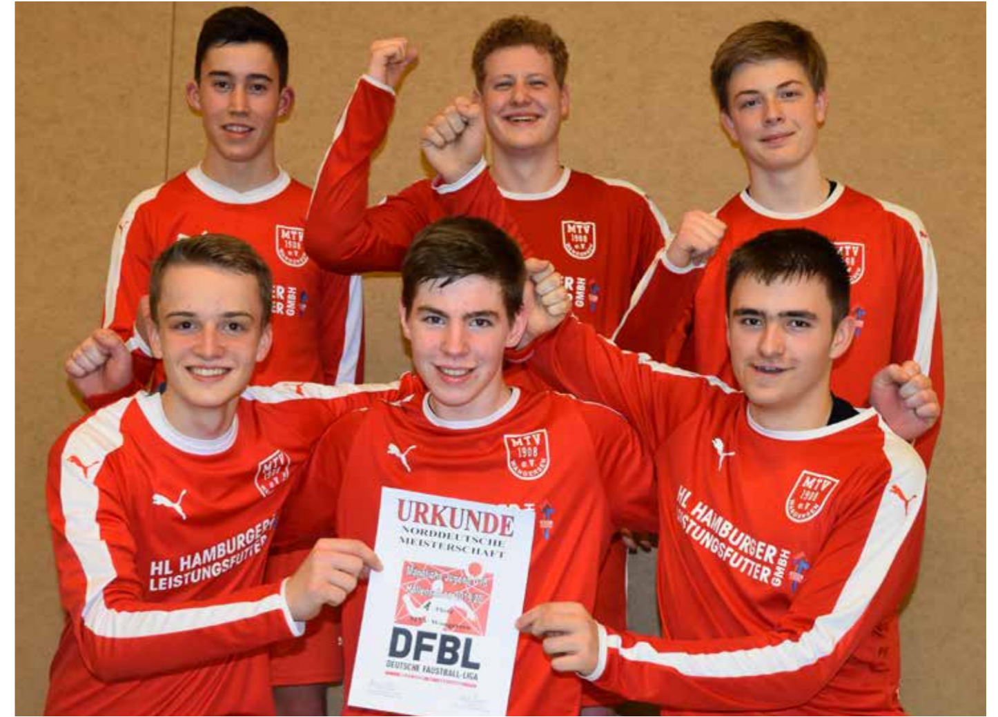
So sehen Sieger aus: Auch bei den Jungen U18 gewinnt Wangersen.