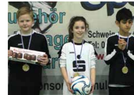
1. Platz - HV Wöhren.