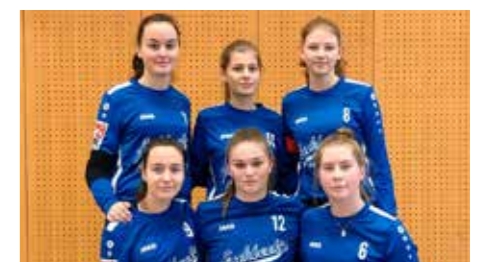
Mädchen U18 - Ahlhorner SV.