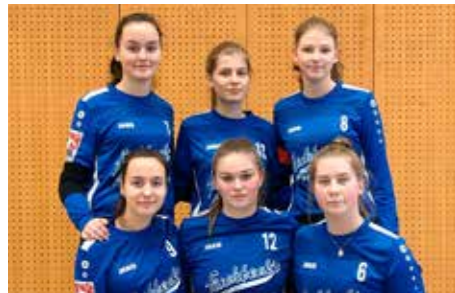
Ahlhorner SV - 2. Platz.