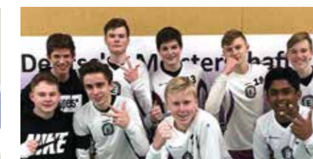
Jungen U16 - TuS Empelde.