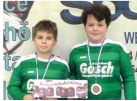
2. Platz - TuS Bothfeld.