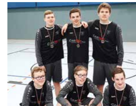
TV Brettorf - 3. Platz.