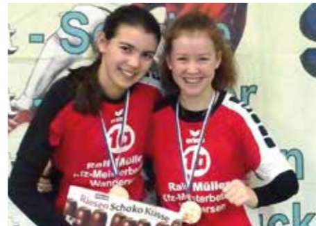
3. Platz - MTV Wangersen 3.