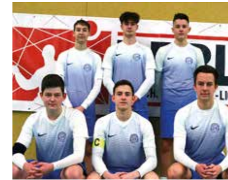
Ahlhorner SV - 2. Platz.