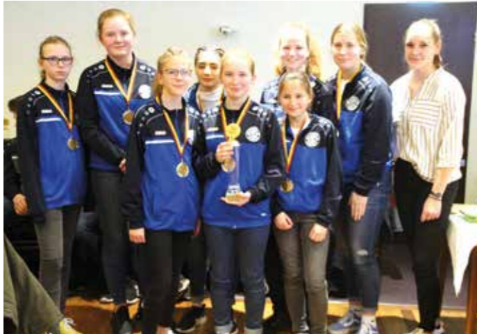
Der Ahlhorner SV wurde in der Hallensaison 2018-2019 Deutscher Meister der Mädchen U14.