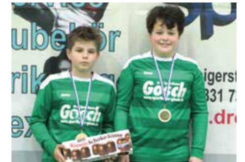
2. Platz - TuS Bothfeld.