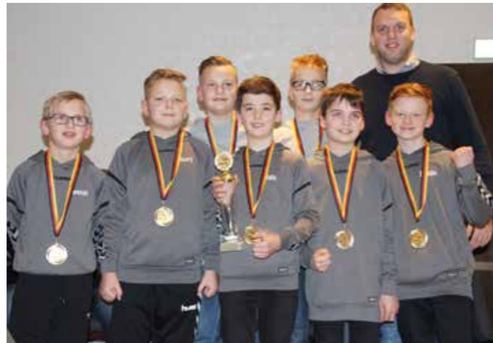
TSV Bardowick - Deutscher Vizemeister Jungen U12 (Feld 2019).