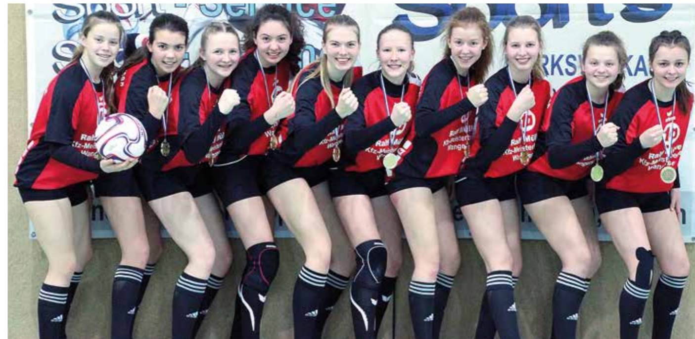
Wangersens Mädchen waren bei der U16 und U14 dabei.