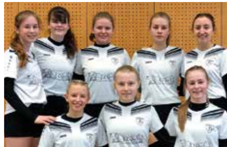
TV Brettorf - 5. Platz.