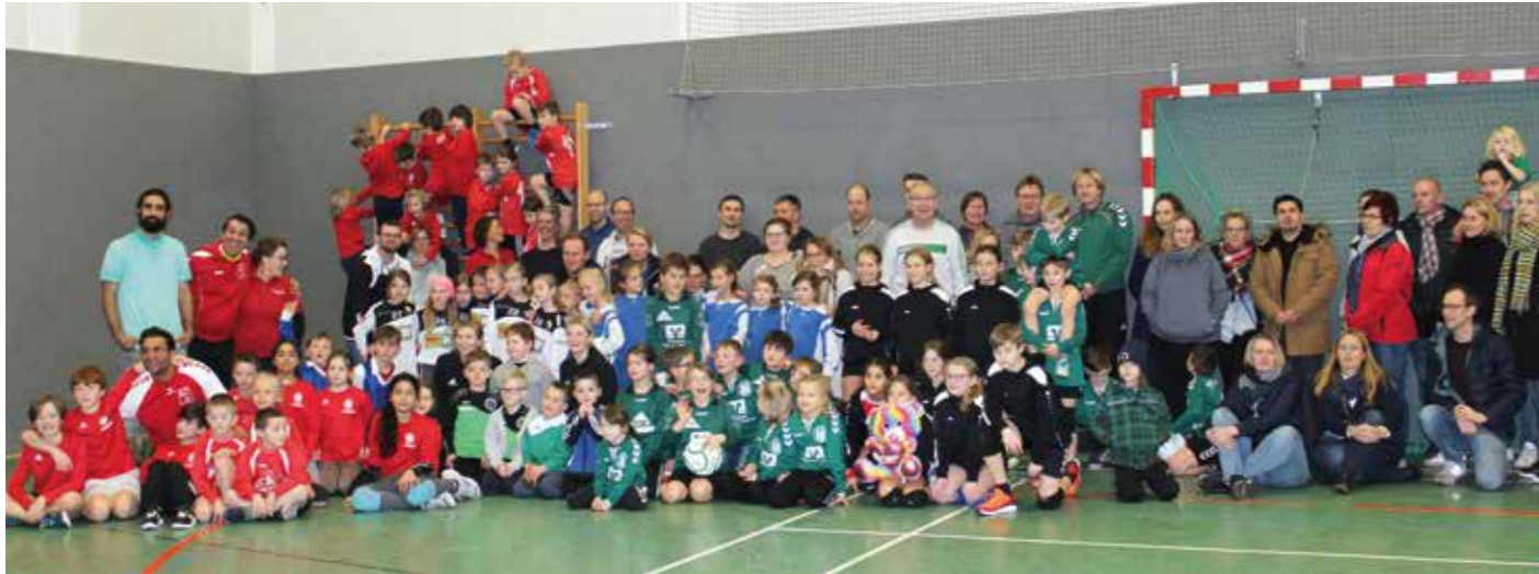
Glückliche Kinder bei der abschließenden Siegerehrung in Hamburg.