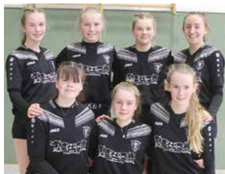
TV Brettorf - 3. Platz.