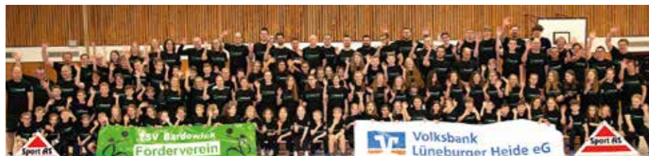
Die Bardowicker Faustballer haben jetzt einheitliche T-Shirts.

jede Woche dafür, dass die Bälle in den Bardowicker Sporthallen fliegen und die etwa 160 Faustballerinnen und Faustballer in Bewegung bleiben. Der Zulauf ist insbesondere in den jüngeren Jahrgängen momentan sehr groß und das freut die Verantwortlichen natürlich ganz besonders, die das Ziel verfolgen dauerhaft in allen Altersklassen, von der U8 bis zur U18, zwei Teams ins Rennen zu schicken, und das bei den Mädchen und bei den Jungs. Für die Erwachsenen wäre ein Wiederaufstieg in die Bundesliga ein großer Traum, dafür heißt trainieren, trainieren, trainieren. (ms)