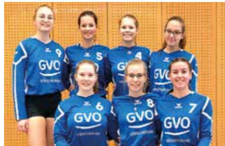
SV Düdenbüttel - 6. Platz.