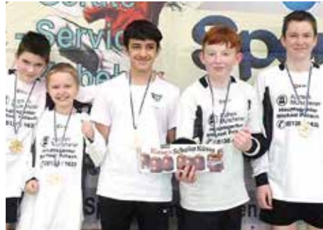
3. Platz - TSV Burgdorf.