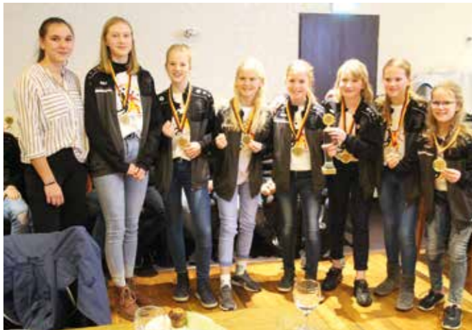
TV Brettorf - Deutscher Meister Mädchen U12 (Feld 2019).