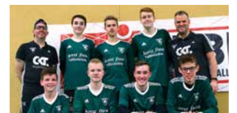
Jungen U18 - TSV Burgdorf.