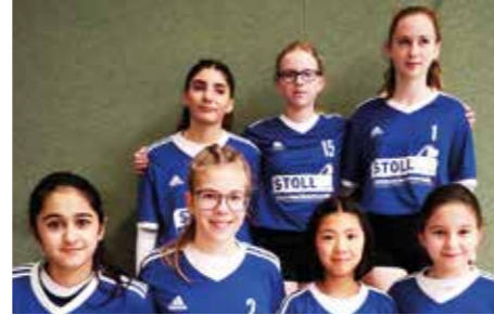
Ahlhorner SV - 7. Platz.