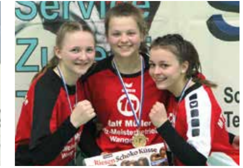
3. Platz - MTV Wangersen 1.