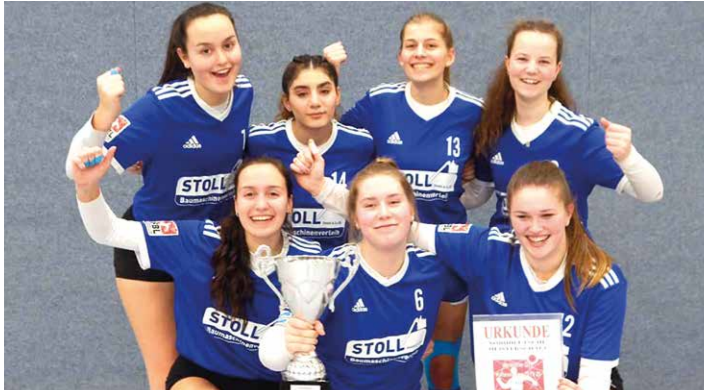
Jubel über den Titelgewinn in eigener Halle.