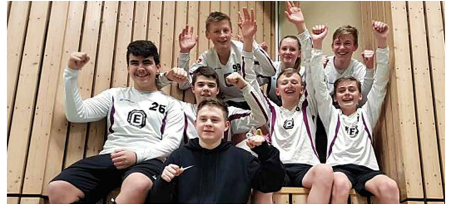
Der TuS Empelde gewinnt in Hamm die Norddeutsche Meisterschaft.