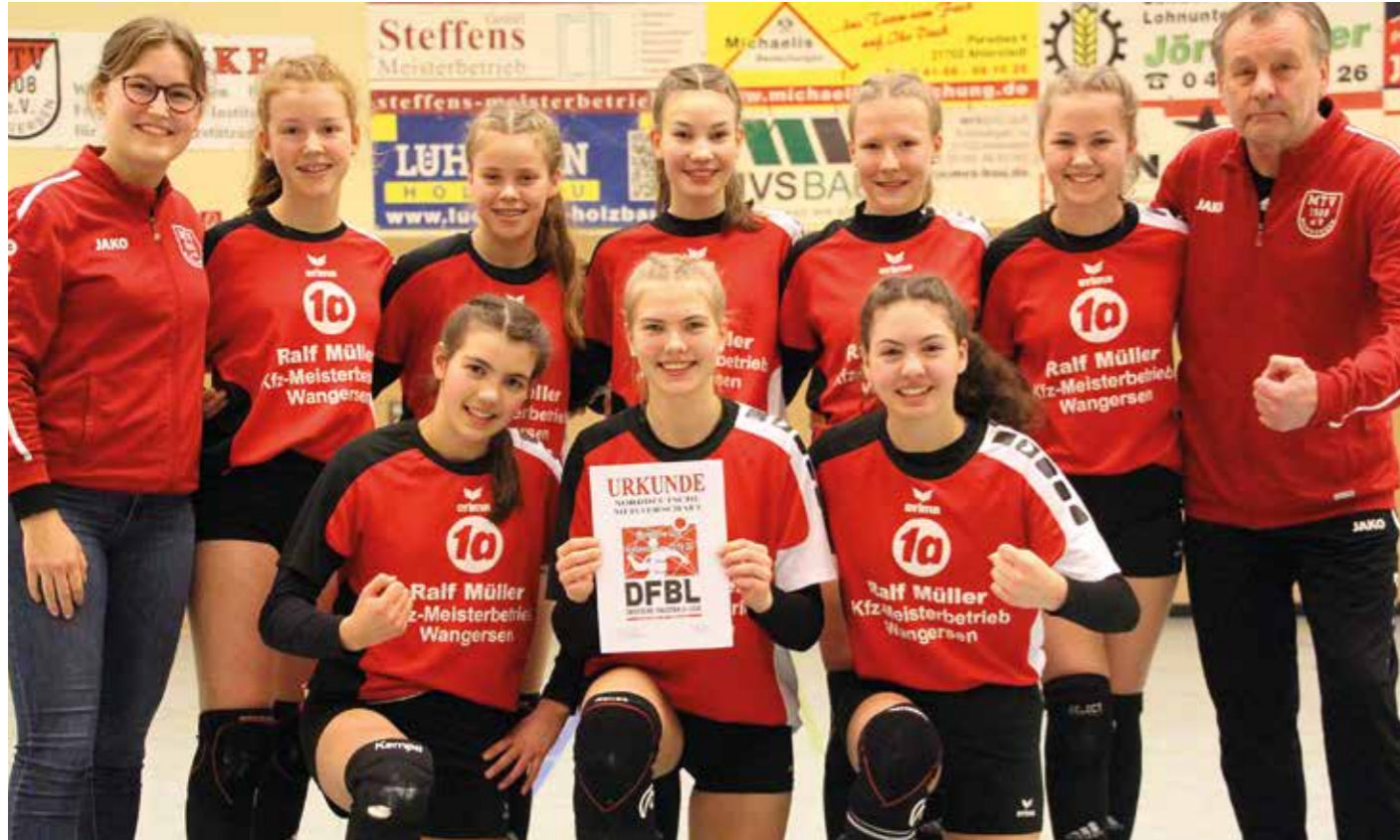
Klare Sache für den Gastgeber: Wangersen gewinnt in eigener Halle alle Spiele.