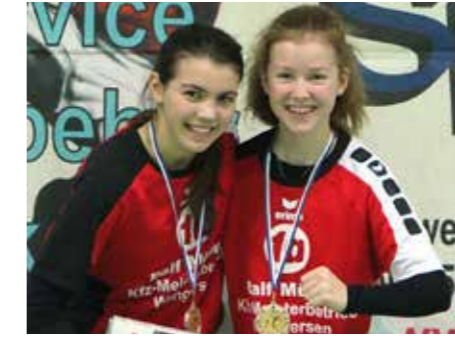
2. Platz - MTV Wangersen 3.