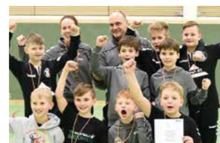
TSV Bardowick - 3. Platz.