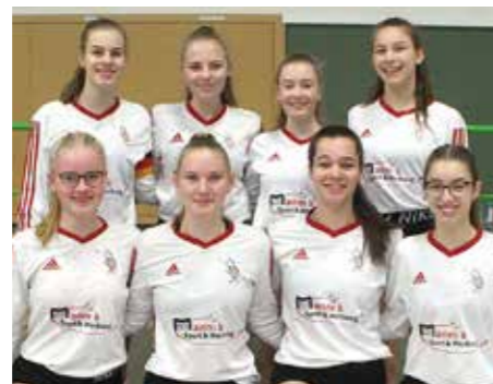
TV Jahn Schneverdingen - 5. Platz.