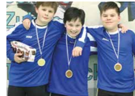
3. Platz - SCE Gliesmarode.