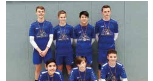
Jungen U16 - Ahlhorner SV.