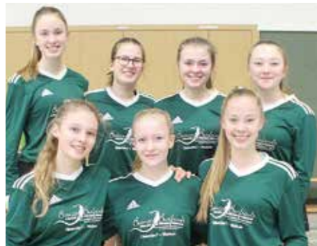
TSV Essel - 2. Platz.