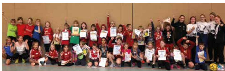
Die Kinder der Grundschule Ahlerstedt hatten viel Spaß beim Turnier.

alle Mädchen und Jungen bekamen eine Teilnehmermedaille, eine Urkunde und das aktuelle Jugend-Magazin Faustball überreicht. (bs)