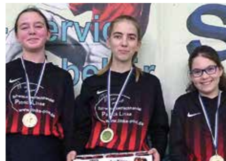
6. Platz - TuS Essenrode.