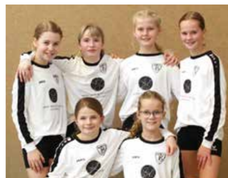
TV Brettorf - 6. Platz.