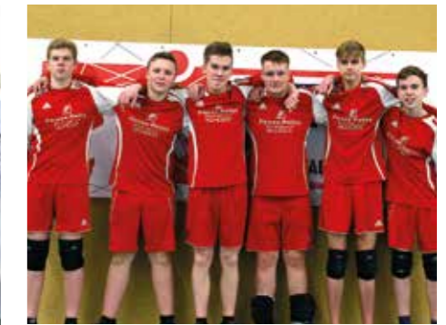
MTSV Selsingen - 7. Platz.