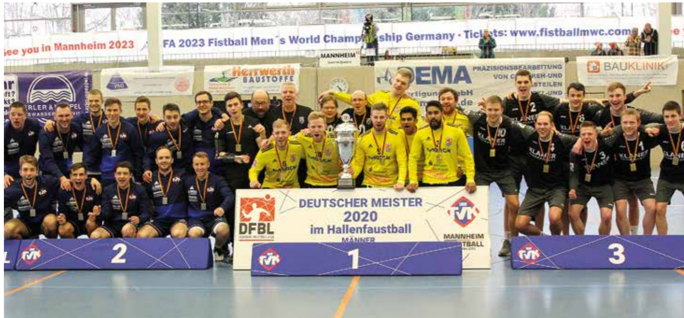
Pfungstadt, Käfertal und der TV Brettorf feiern den Gewinn der Medaillen.