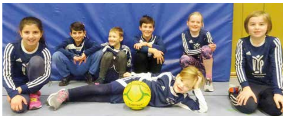
Die U10 des MTV Nordel gewann Platz zwei und Platz drei.