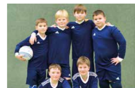
Wardenburger TV - 6. Platz.