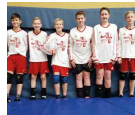
TSV Abbenseth - 5. Platz.