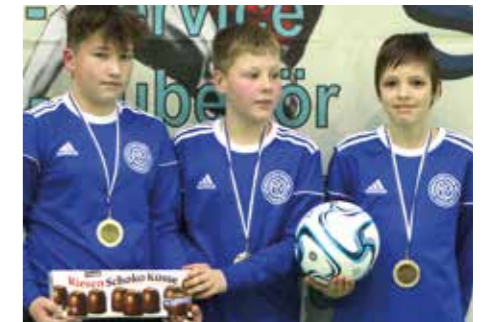
5. Platz - MTV Vorsfelde.