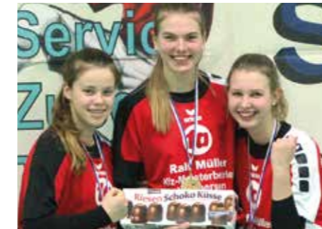
4. Platz - MTV Wangersen 2.