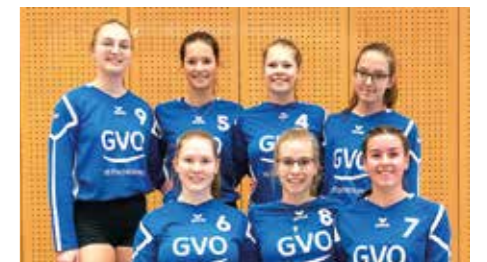
Mädchen U18 - SV Düdenbüttel.