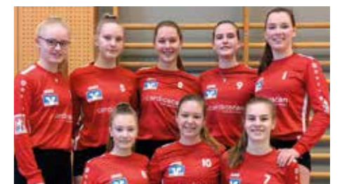
Mädchen U18 - TV Jahn Schneverdingen.