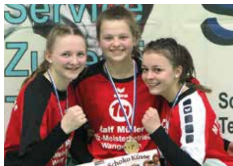
4. Platz - MTV Wangersen 1.