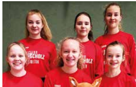
TV Huntlosen - 3. Platz.