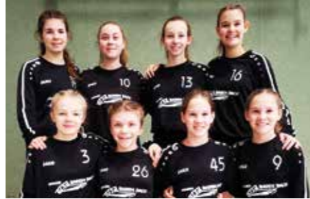
TV Jahn Schneverdingen - 5. Platz.