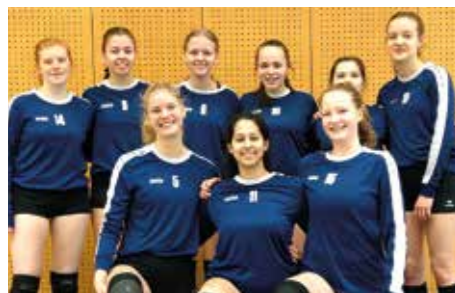
Wardenburger TV - 4. Platz.