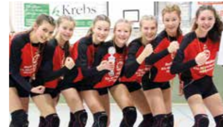
Mädchen U14 - MTV Wangersen.