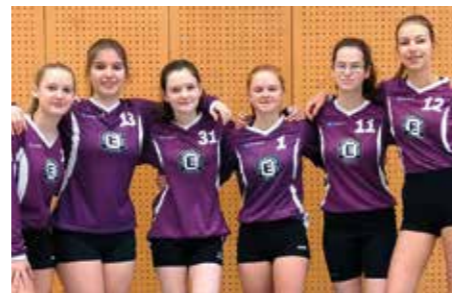
TuS Empelde - 7. Platz.