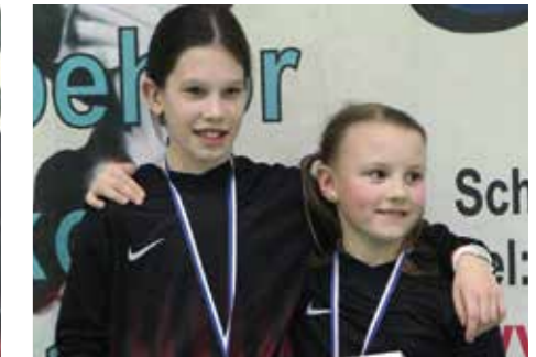
6. Platz - TuS Essenrode 2.