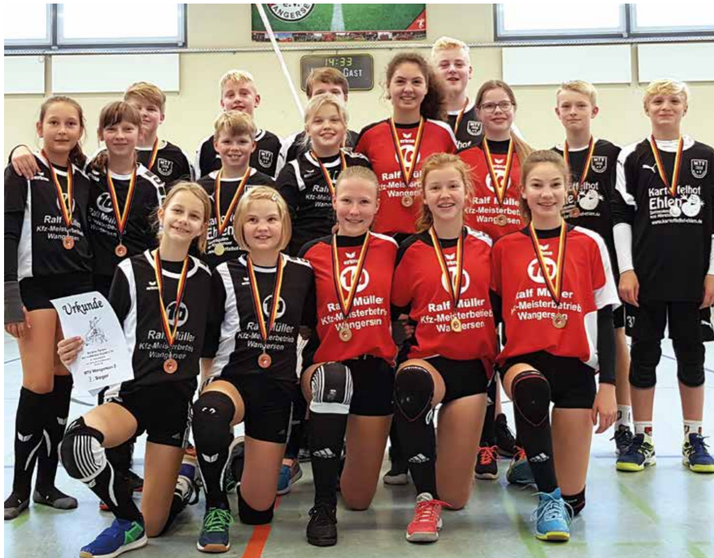
Wangersens Teams der weiblichen und männlichen U14.