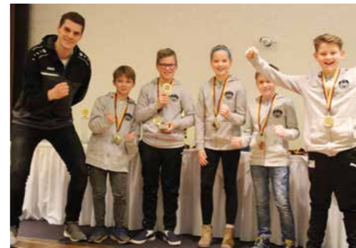
MTV Oldendorf - Landesmeister Feld 2019.