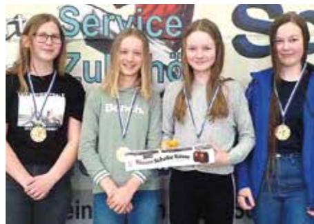
5. Platz - MTV Nordel.