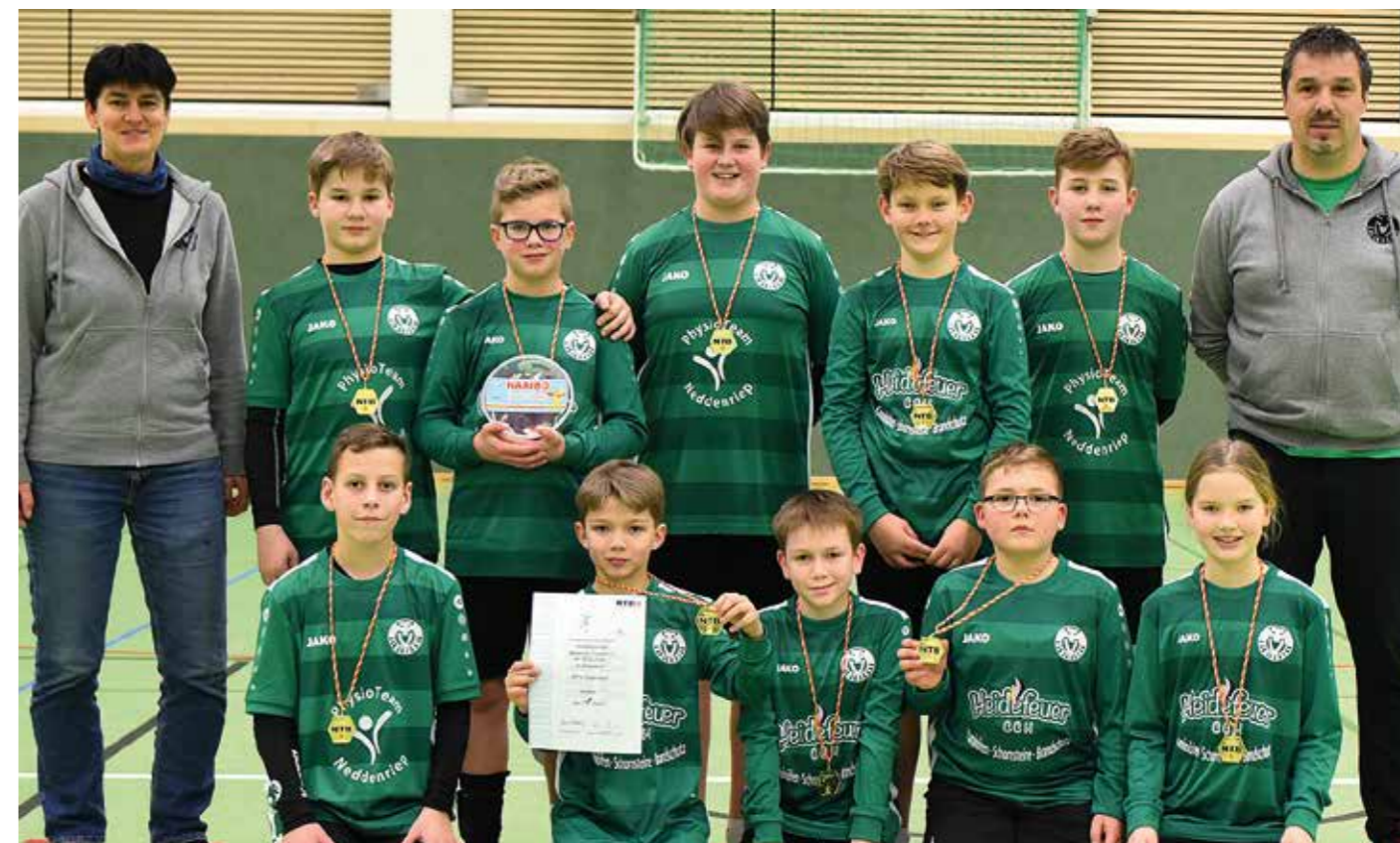
MTV Oldendorf - 1. Platz.