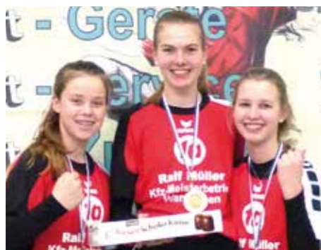
7. Platz - MTV Wangersen 2.