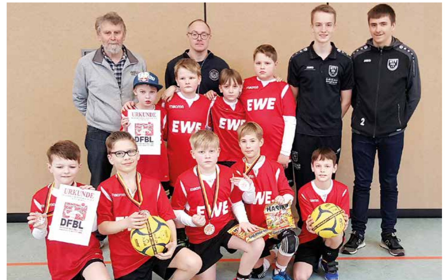
Die U10-Jungs sind neuer Bezirksvizemeister.