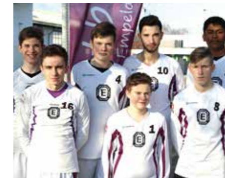
TuS Empelde - 5. Platz.