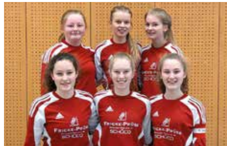
MTSV Selsingen - 3. Platz.