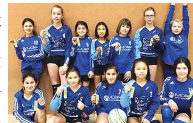
Die U12-Mädchen des Ahlhorner SV.

des besseren Ballverhältnisses gegenüber dem Ahlhorner SV 2. Die ASV-Zweitvertretung rundete mit dem vierten Platz das gute Gesamtergebnis des Vereins ab. Auch der Wardenburger TV, TV Huntlosen und SV Moslesfehn nahmen mit ihren Teams an den Bezirksmeisterschaften teil. (ssp)