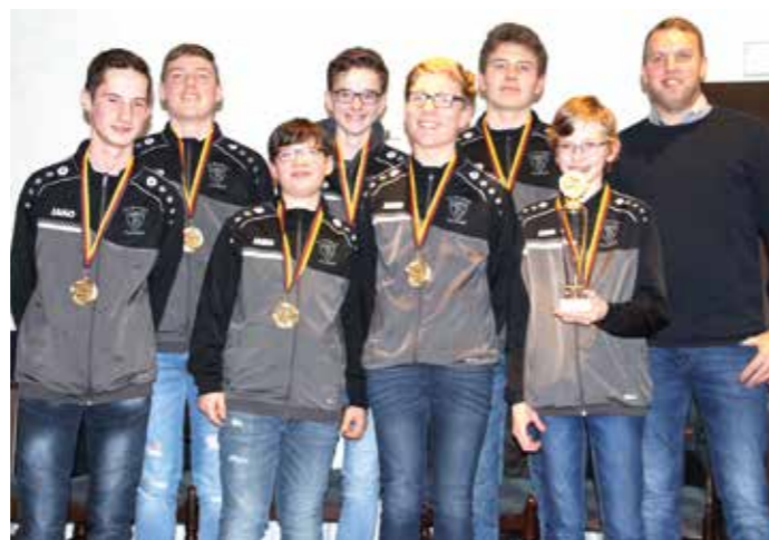
TV Brettorf - 3. Deutsche Meisterschaft Jungen U14 (Feld 2019).

Redaktionsschluss für Berichte von den Vereinen ist immer der 01.03. (Hallensaison) und der 01.09. (Feldsaison).