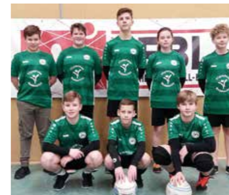
MTV Oldendorf - 3. Platz.