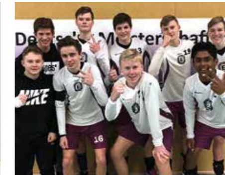
TuS Empelde - 4. Platz.