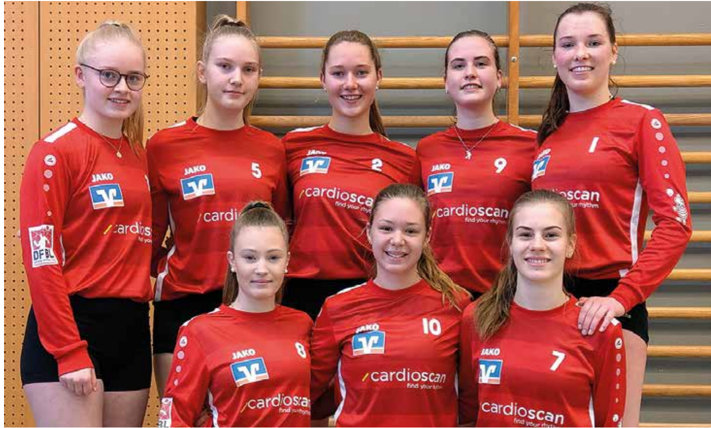
TV Jahn Schneverdingen - 1. Platz.