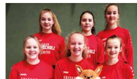
Mädchen U14 - TV Huntlosen.