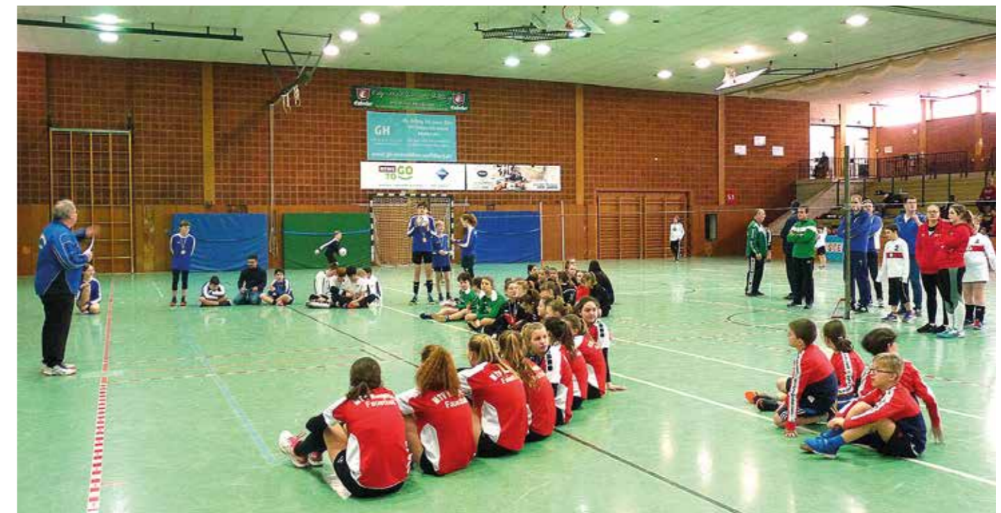
Siegerehrung beim Drohn-Youth-Bowl in Vorsfelde.