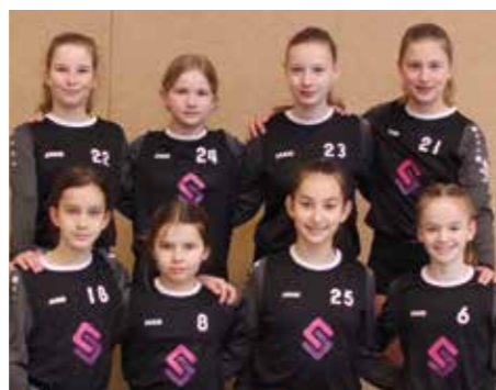
TV Jahn Schneverdingen - 4. Platz.