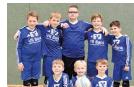
Ahlhorner SV - 5. Platz.