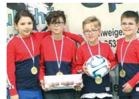
6. Platz - MTV Vienenburg.