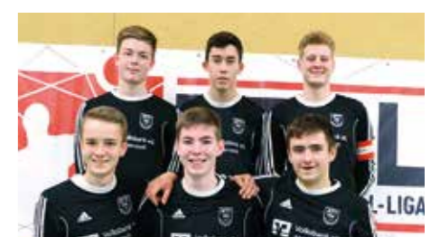
Jungen U18 - MTV Wangersen.