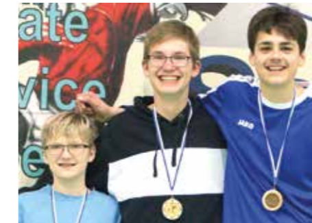
8. Platz - SCE Gliesmarode 2.