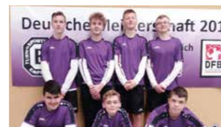
Jungen U14 - TuS Empelde.