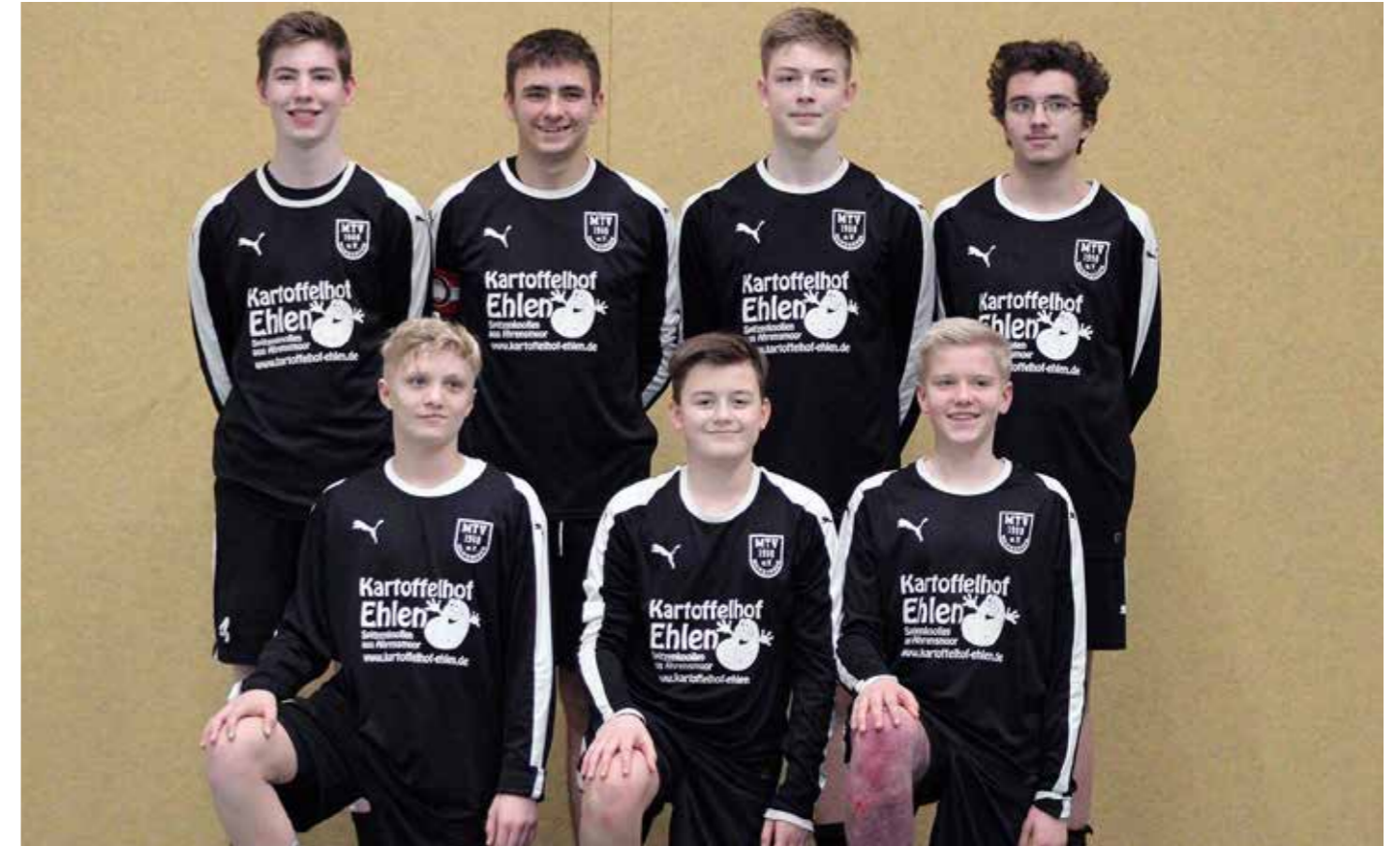
Strahlende Gesichter bei den Wangerser Jungen: Sie haben den Titel gewonnen.