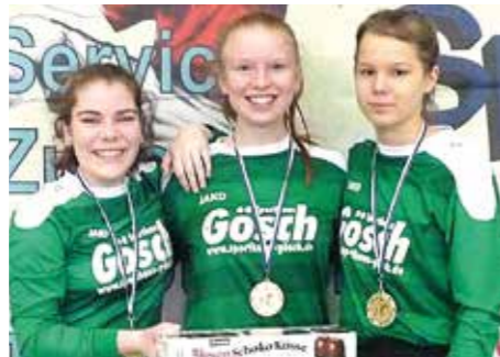
2. Platz - TuS Bothfeld.