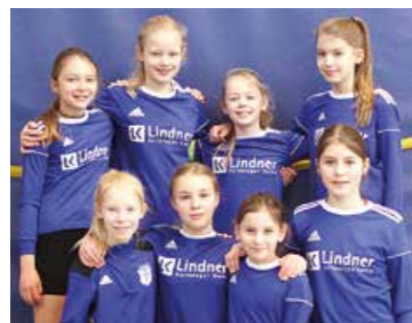
MTV Diepenau - 7. Platz.