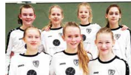
Mädchen U14 - TV Brettorf.