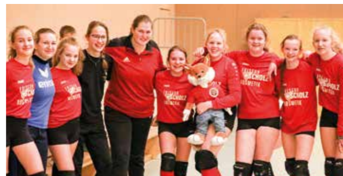
... und beim TV Huntlosen.