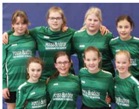
TSV Essel - 2. Platz.