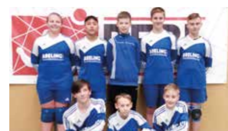
Jungen U14 - Ahlhorner SV.