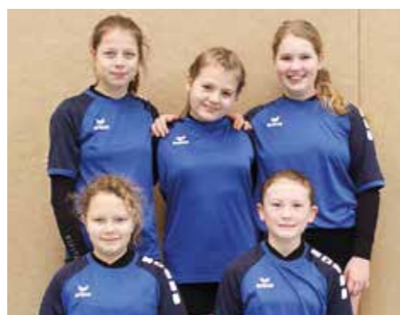
Wardenburger TV - 5. Platz.