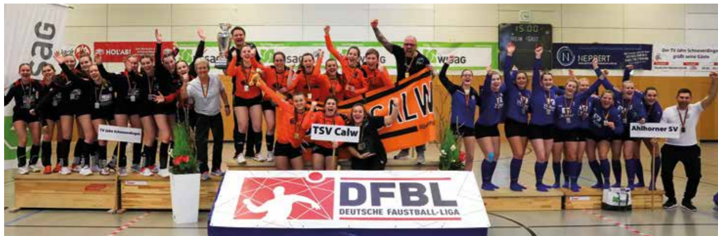
Siegerehrung für die Medaillengewinner.