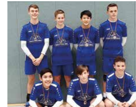
Ahlhorner SV - 2. Platz.