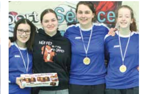
9. Platz - SCE Gliesmarode 1.