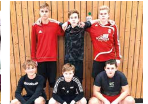
MTSV Selsingen - 6. Platz.