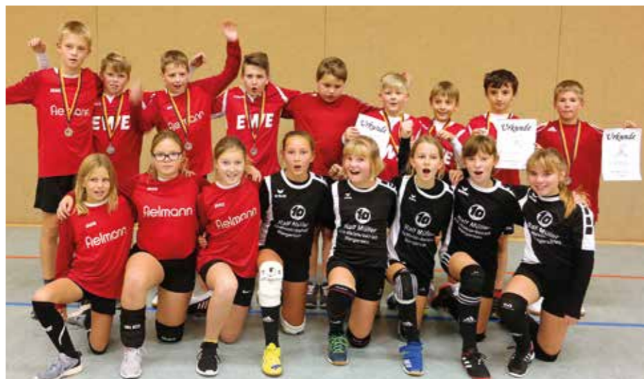
Auch bei der U12 war Wangersen stark vertreten.

auch die meisten Teilnehmer stellte. jeweils einmal Gold ging an den TSV Zweimal Gold gewann der TV Brettorf, Essel und an den TSV Bardowick. (bs)