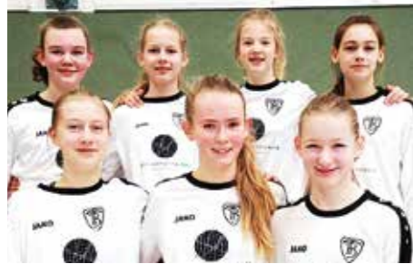
TV Brettorf - 2. Platz.