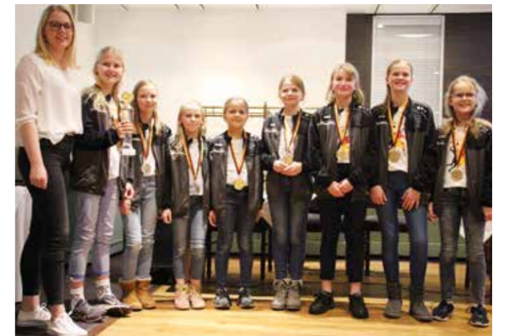
TV Brettorf - Landesmeister Halle 2018/2019 und Feld 2019.