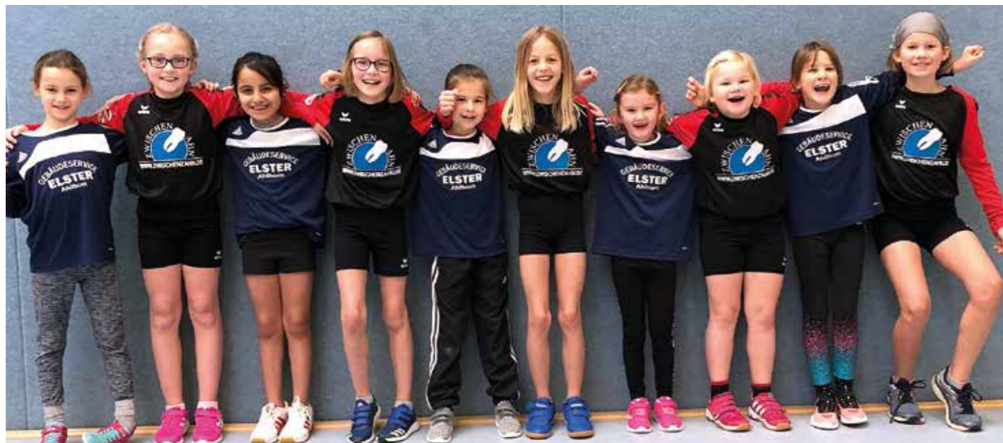
Gemeinsames Gruppenbild der Ahlhorner und Moslesfehner Mädchen.