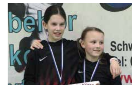
3. Platz - TuS Essenrode 2.