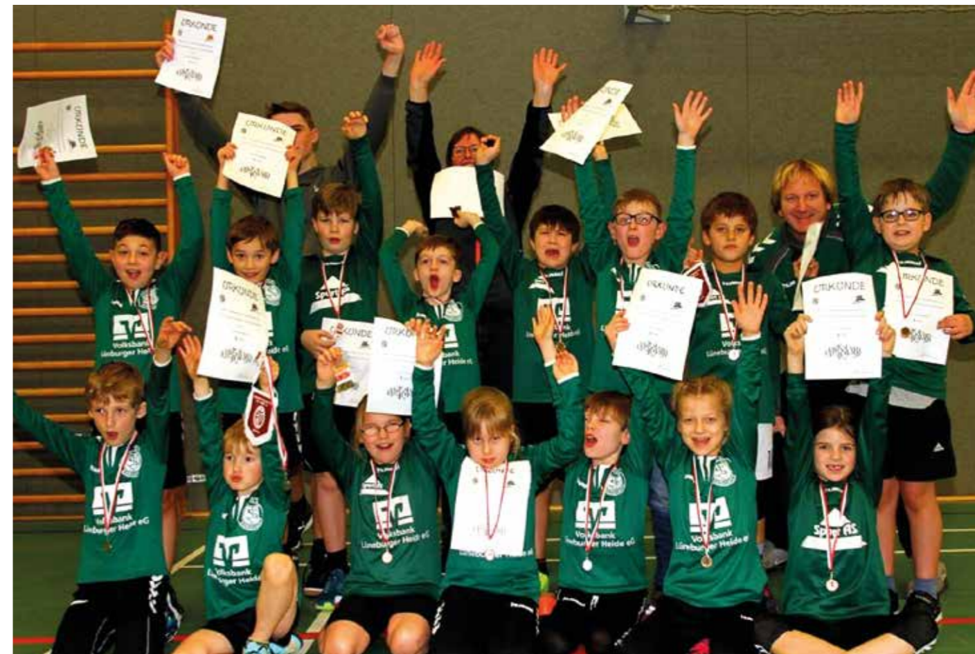
Medaillen und Urkunden für Bardowicks Faustballer.

Die U10-Mädchen des MTV Wangersen wahrten beim letzten Spieltag in Schneverdingen die weiße Weste, gewannen in dieser Saison bisher alle Spiele und sicherten sich damit die Bezirksmeistermeisterschaft im Hallenfaustball. Das entscheidende Spiel gegen Schneverdingen gewann das Team mit 32:23. Die zweite Mannschaft des MTV belegte immerhin noch Platz fünf. (bs)