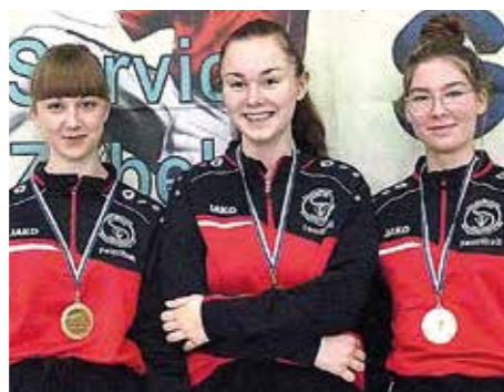
4. Platz - TSV Schwiegershausen.