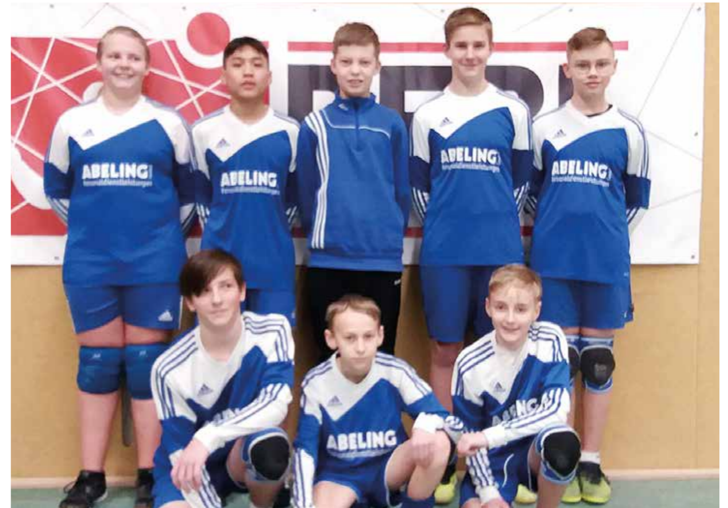
Ahlhorner SV - 1. Platz.