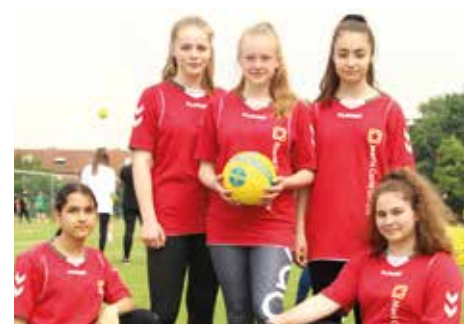
7. Platz - Marie-Curie-Schule Empelde 1