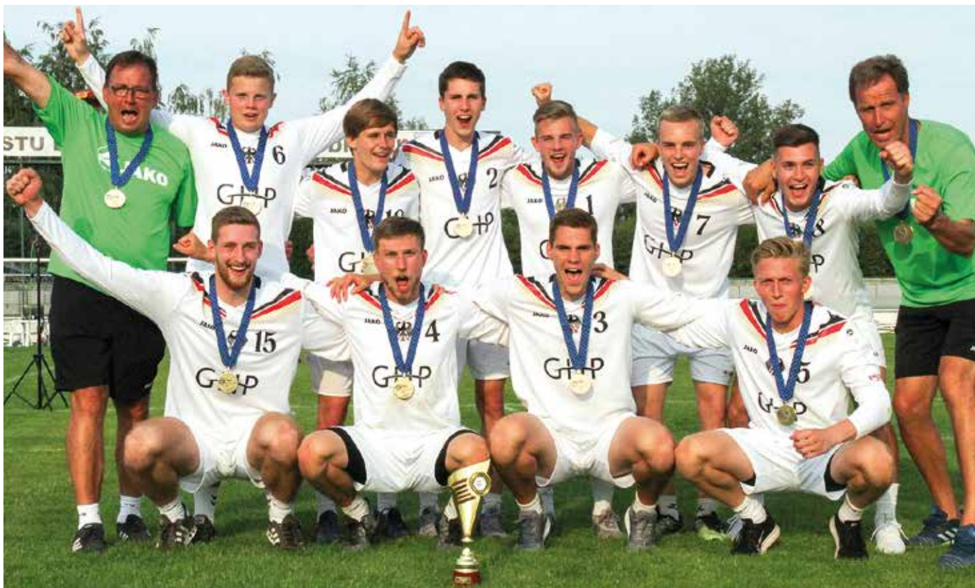
Das deutsche Team feiert den Finalsieg gegen Österreich.