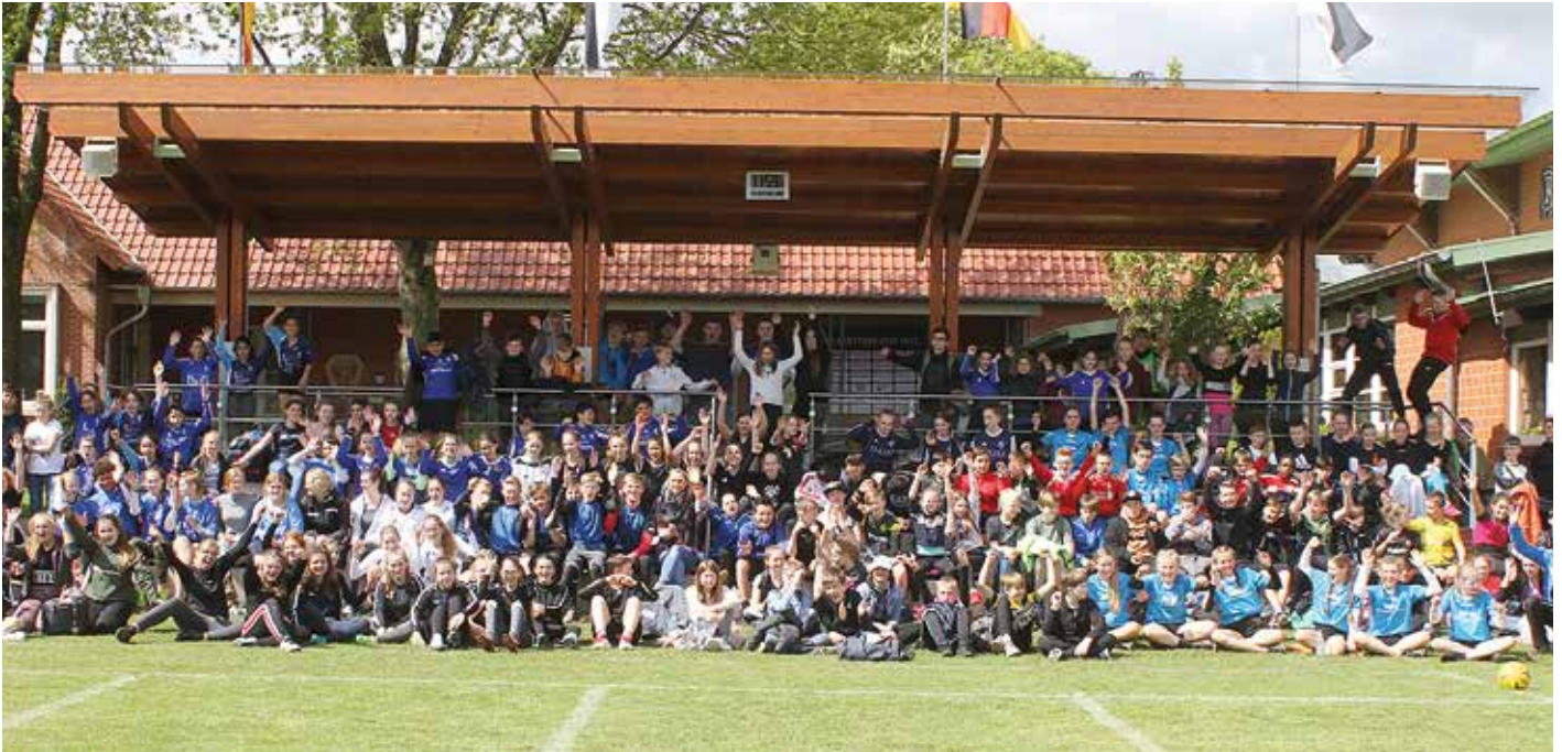
47 Mannschaften haben an der Bezirksmeisterschaft der Wettkampfklasse III und IV teilgenommen.