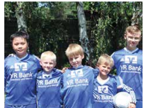
Ahlhorner SV - 6. Platz.