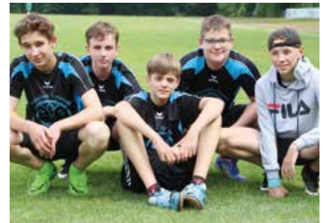
7. Platz - RS am Röddenberg Osterode