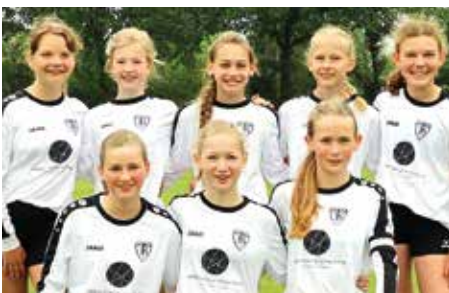
TV Brettorf - 3. Platz.