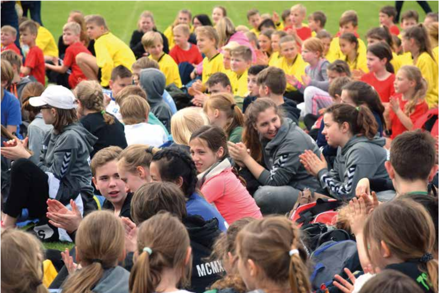
Die Schüler bei der Siegerehrung.