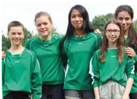
4. Platz - IGS Franzshes Feld BS 3