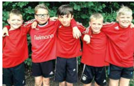
MTV Wangersen - 6. Platz.