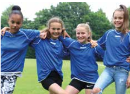
5. Platz - IGS Franzshes Feld BS 1