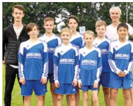
Ahlhorner SV - 4. Platz.