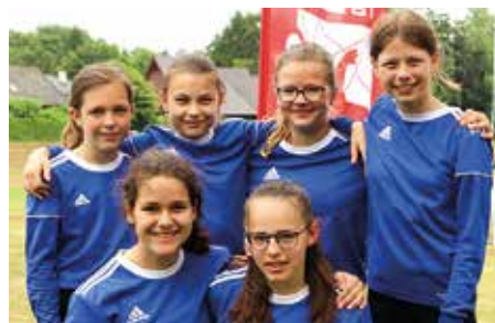
Wardenburger TV - 6. Platz.