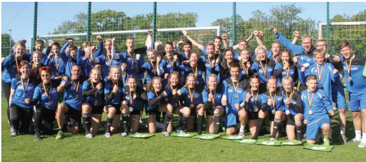
Gruppenbild der Faustballerinnen und Faustballer Niedersachsens nach der Siegerehrung.