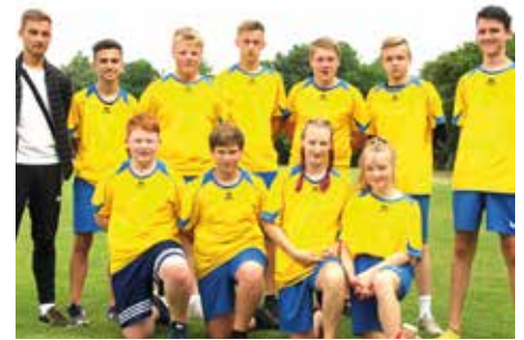
4. Platz - OBS Berne