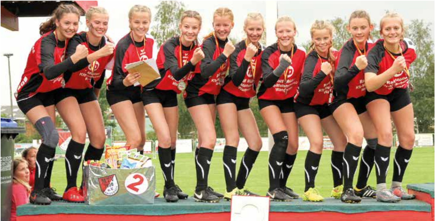
Große Freude bei Wangersens U14-Mädchen nach dem Gewinn der Silbermedaillen.