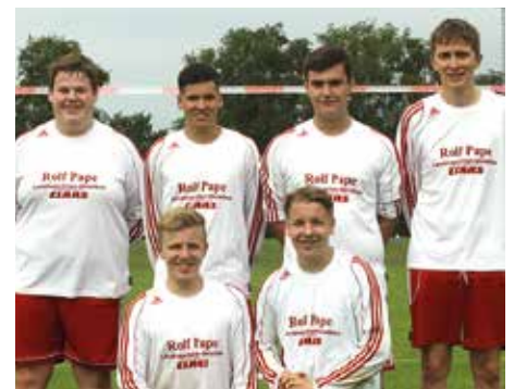
TSV Abbenseth - 5. Platz.