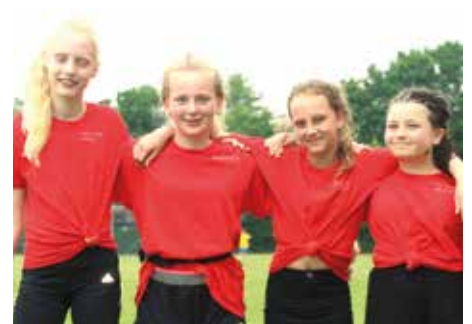
5. Platz - IGS Am Everkamp Wardenburg 2