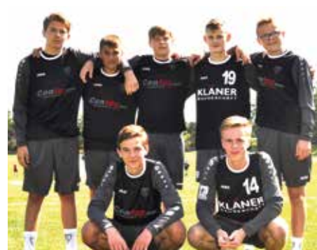
TV Brettorf - 6. Platz.