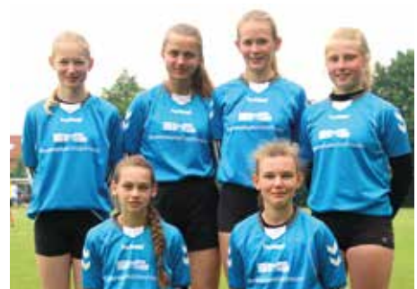
2. Platz - Gym. Wildeshausen 1