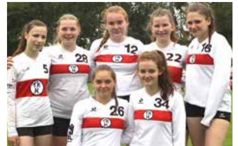
TK Hannover - 8. Platz.