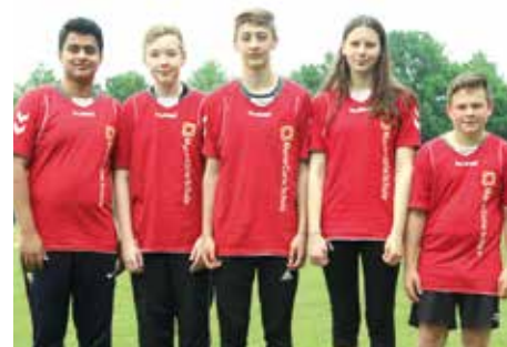
1. Platz - Marie-Curie-Schule Empelde 2