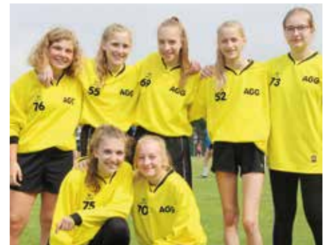
4. Platz - Aue-Geest-Gym. Harsefeld 1