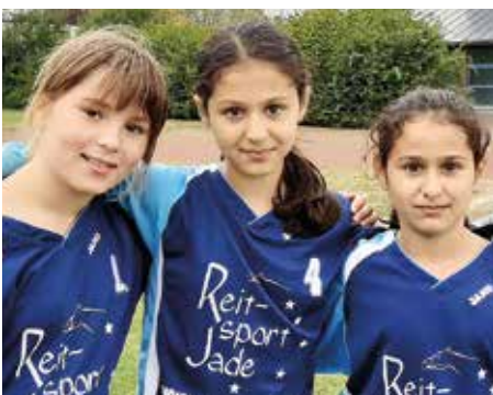
Ahlhorner SV - 2. Platz.