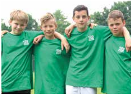
1. Platz - Herderschule Lüneburg 3