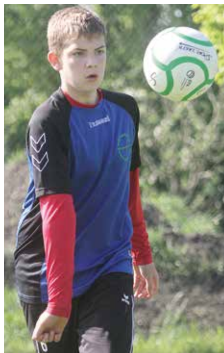
Volle Konzentration bei der Ballannahme.

trich-Bonhoeffer-Gymnasium Ahlhorn (Leistungsklasse Mädchen und Jungen 3). Außerdem jubelten die Realschule Wildeshausen (Anfänger Jungen 3), die IGS Wardenburg (Anfänger Mädchen 4) und die Waldschule Hatten (Leistungsklasse Jungen 4) über einen ersten Platz – den sie in wenigen Wochen bereits wiederholen können. Die Teams haben sich schließlich mit ihren Erfolgen für