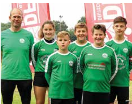
MTV Oldendorf - 3. Platz.