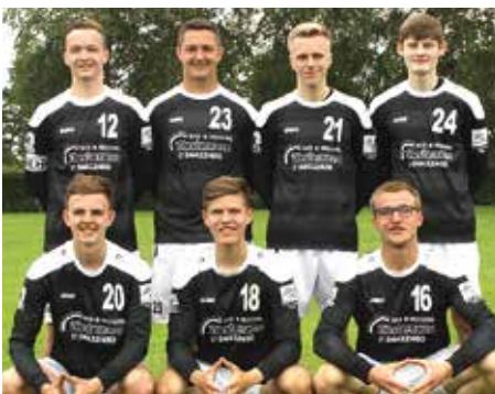
TV Brettorf - 2. Platz.