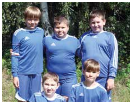
Wardenburger TV - 5. Platz.