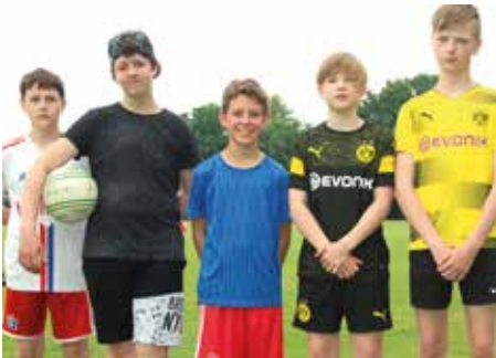
3. Platz - Waldschule Hatten