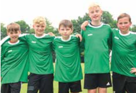
2. Platz - Schule am Auetal Ahlerstedt