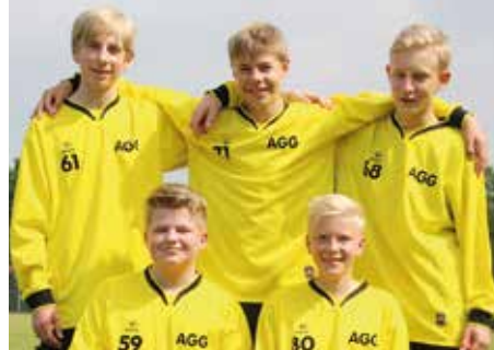
2. Platz - Aue-Geest-Gym. Harsefeld 5