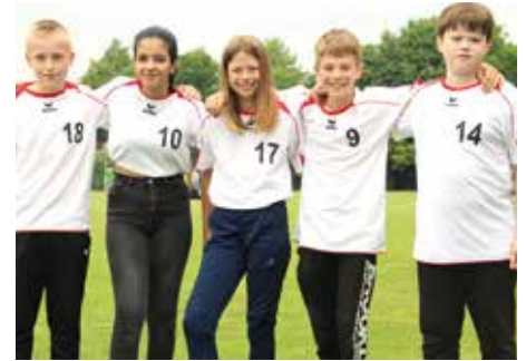
2. Platz - IGS Am Everkamp Wardenburg 4