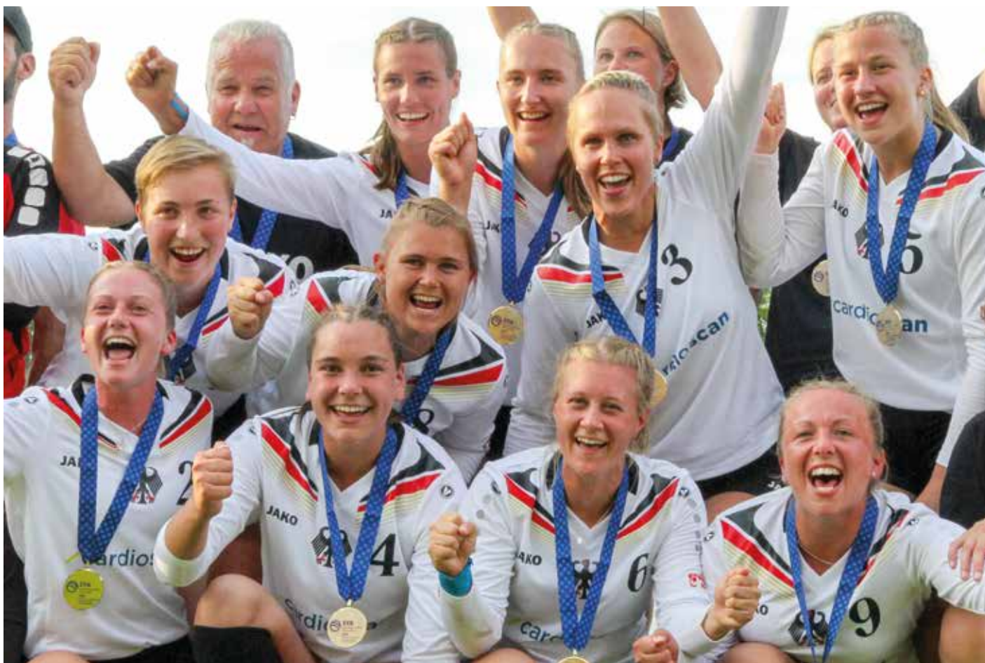
Deutschlands Frauen sind seit sechs Jahren ungeschlagen.