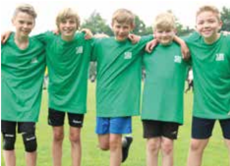
6. Platz - Herderschule Lüneburg 4