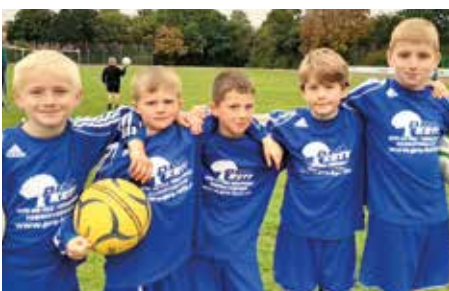
Ahlhorner SV - 4. Platz.