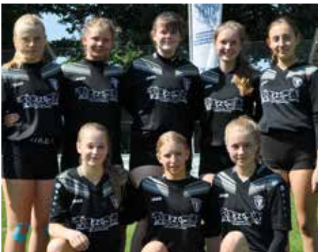
TV Brettorf - 2. Platz.