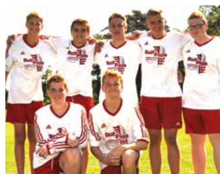
TSV Abbenseth - 7. Platz.