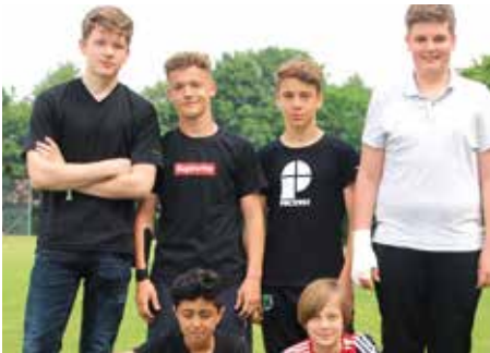
5. Platz - IGS Franzshes Feld BS 2