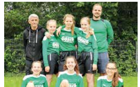
TuS Bothfeld - 8. Platz.