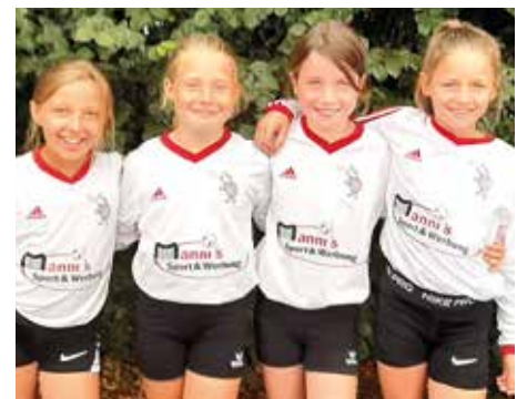
TV Jahn Schneverdingen - 5. Platz.