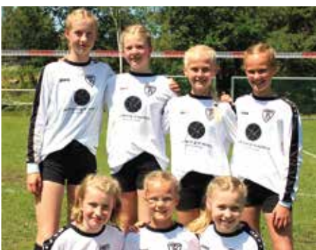
TV Brettorf - 3. Platz.