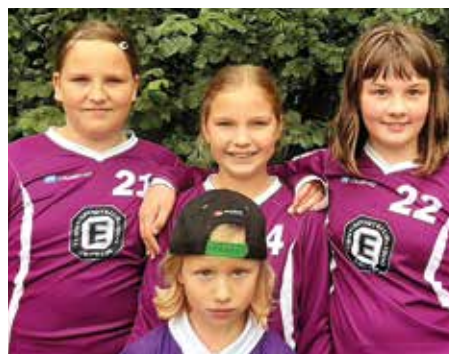
TuS Empelde - 4. Platz.