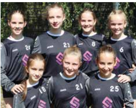
TV Jahn Schneverdingen - 2. Platz.