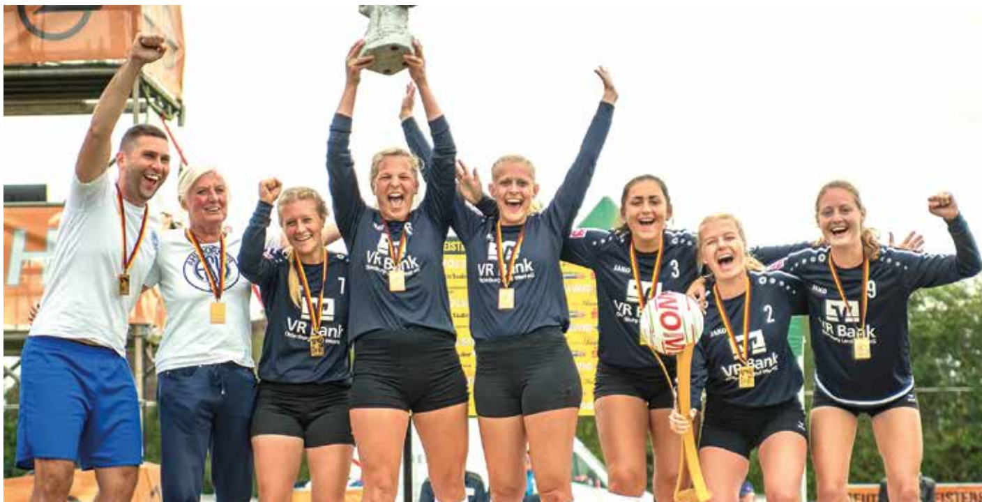
Die Ahlhorner Frauen feiern den Gewinn der Deutschen Meisterschaft.