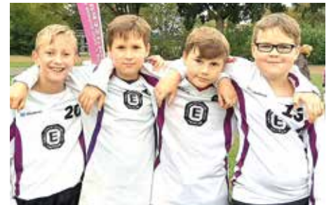
TuS Empelde - 8. Platz.