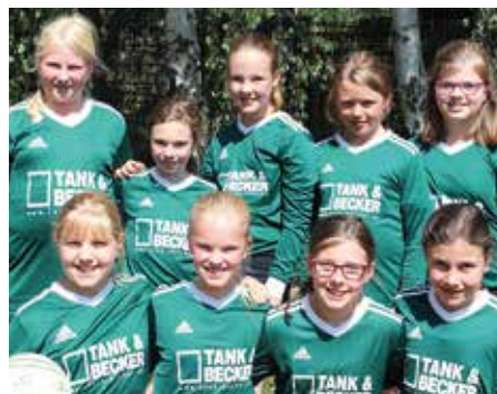
TSV Essel - 4. Platz.