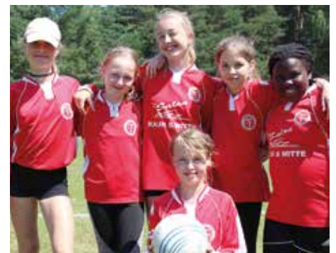
TV Huntlosen - 6. Platz.