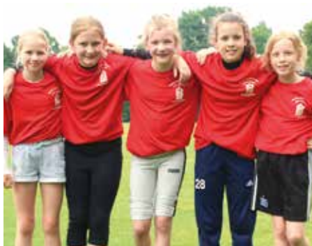
1. Platz - PCS Himmelpforten 2