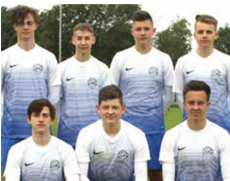
Ahlhorner SV - 3. Platz.