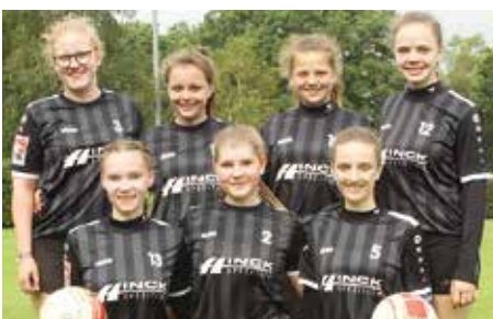
MTV Wangersen - 4. Platz.