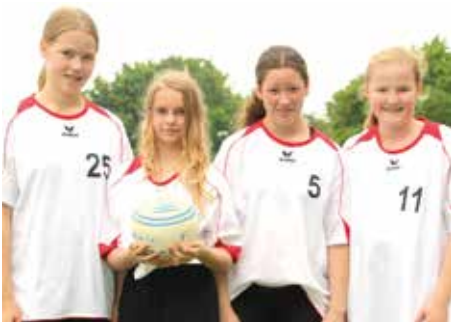
6. Platz - IGS Am Everkamp Wardenburg 3