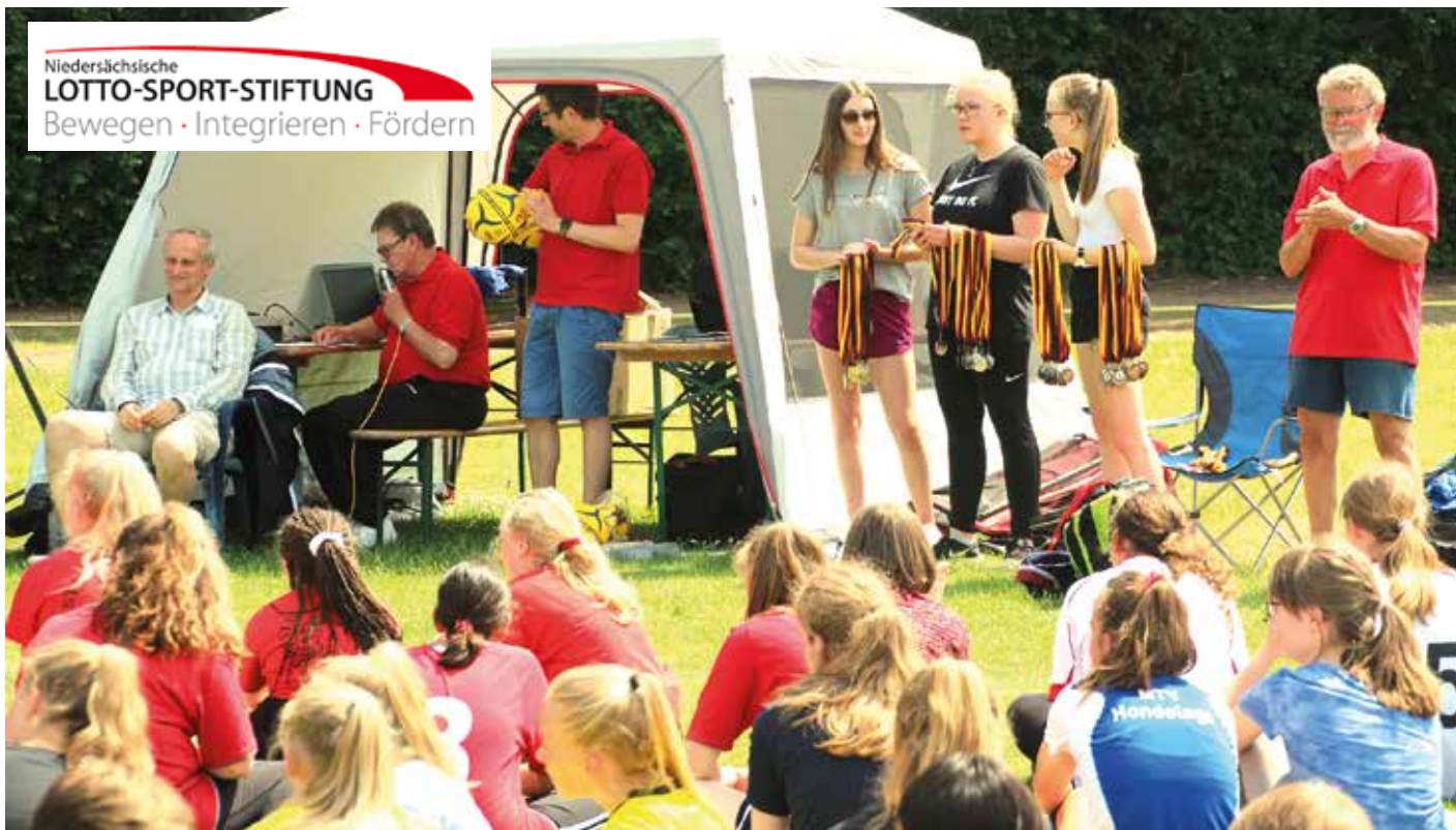
39 Mannschaften aus 16 Schulen waren bei der Landesmeisterschaft in Empelde dabei.