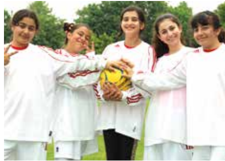
7. Platz - OBS-CHRS Garbsen