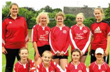
TV Huntlosen - 5. Platz.