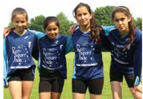
1. Platz - GvZ-Schule Ahlhorn 2