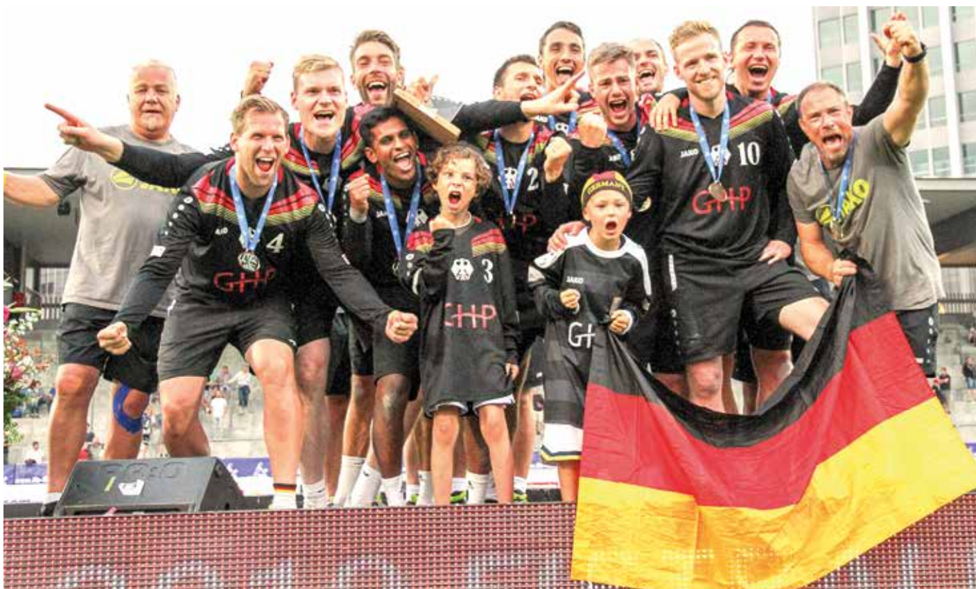
Große Freude beim deutschen Team nach dem Finale gegen Österreich.