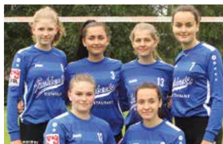
Ahlhorner SV - 7. Platz.