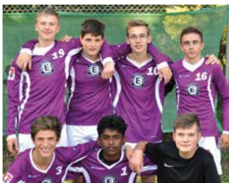
TuS Empelde - 4. Platz.