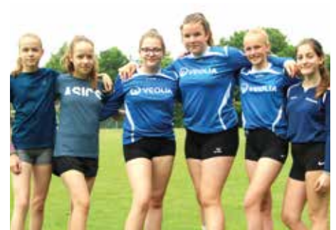
1. Platz - PCS Himmelforten