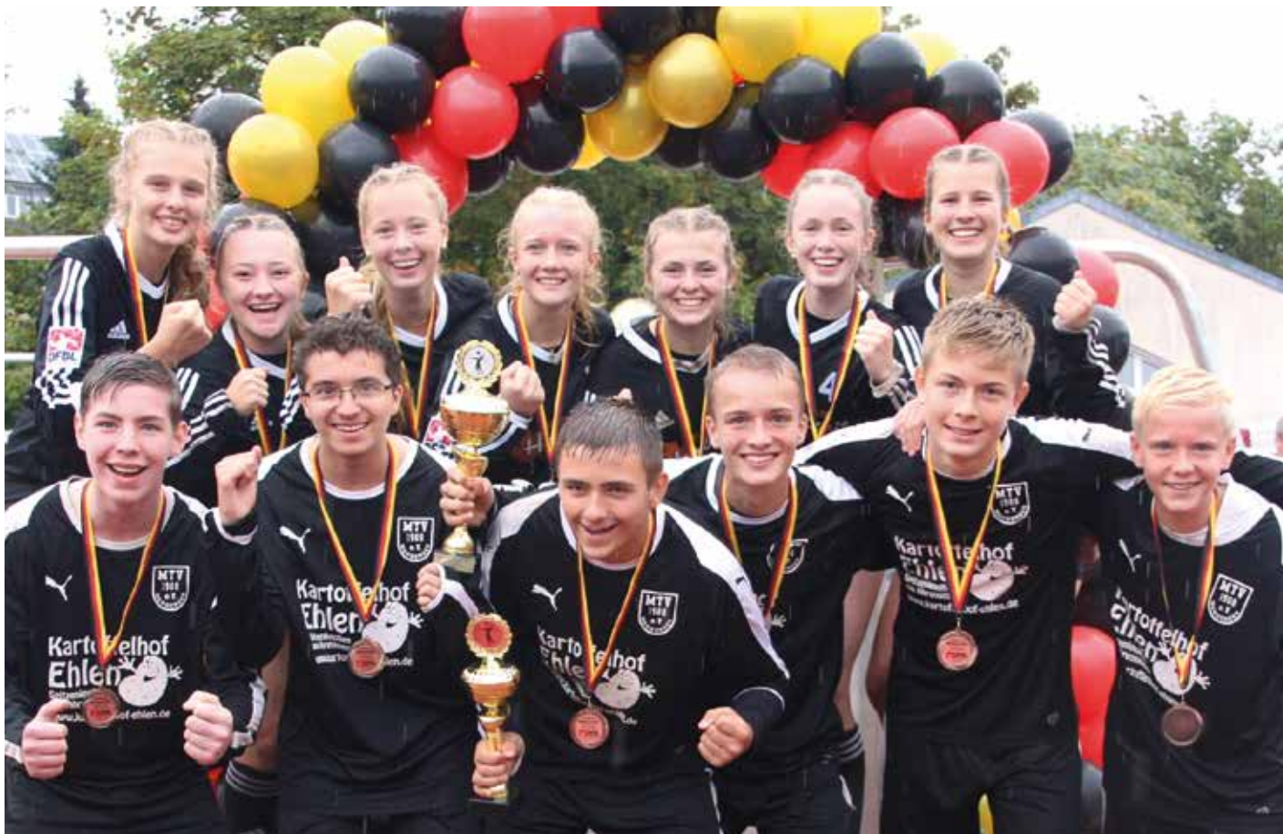
Essels Mädchen und Wangersens Jungen freuen sich gemeinsam über den Gewinn der Medaillen.