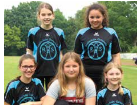
2. Platz - RS Röddenberg - Die Vier