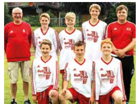
TSV Abbenseth - 6. Platz.