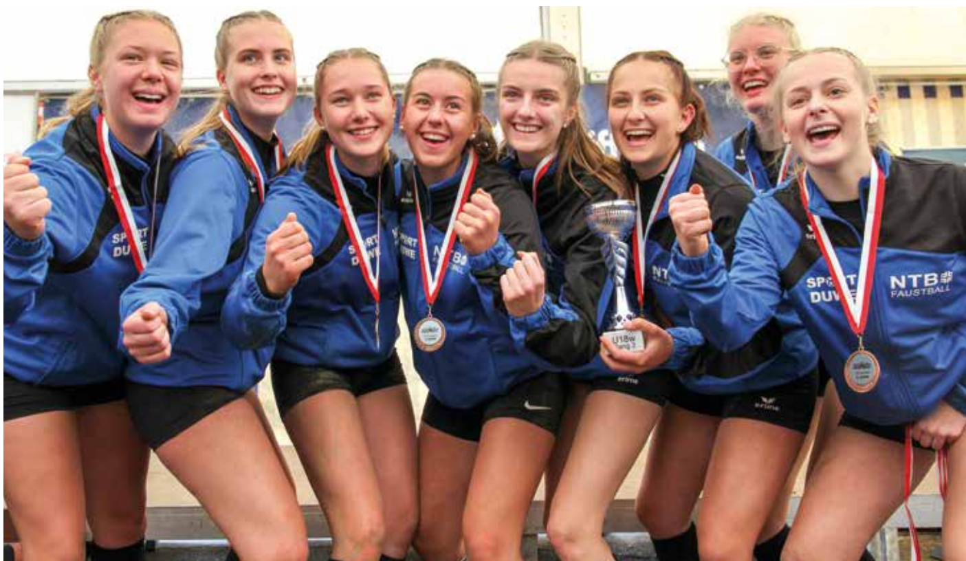
Sie waren für Niedersachsen am erfolgreichsten: Die U18 Mädchen gewinnen in der Einzelwertung Bronze.