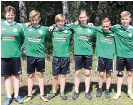
MTV Oldendorf - 2. Platz.