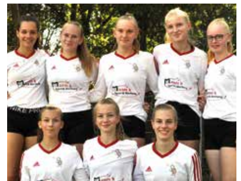
TV Jahn Schneverdingen - 7. Platz.