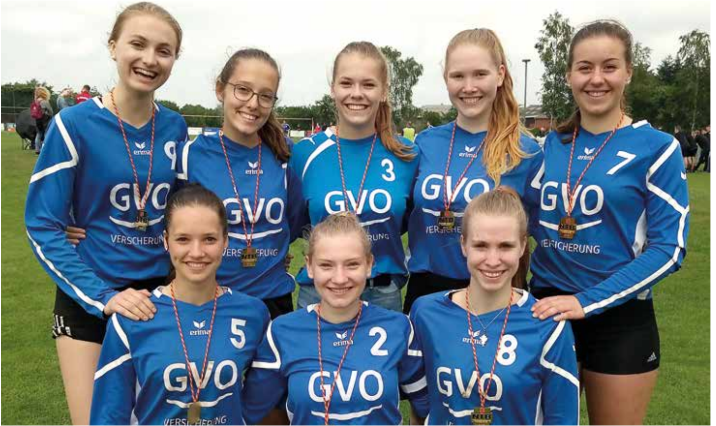
SV Düdenbüttel - 1. Platz.