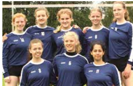
Wardenburger TV - 5. Platz.