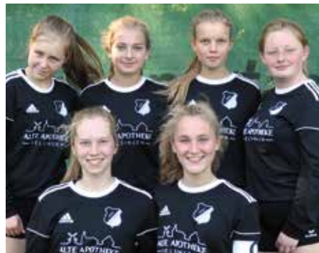
MTSV Selsingen - 4. Platz.