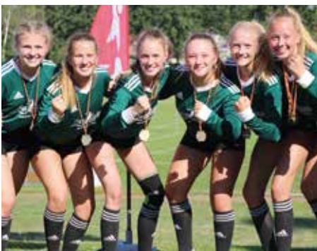
TSV Essel - 3. Platz.