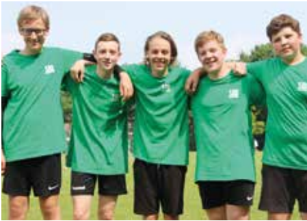
2. Platz - Herderschule Lüneburg 1