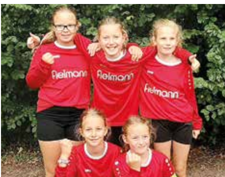
MTV Wangersen - 3. Platz.