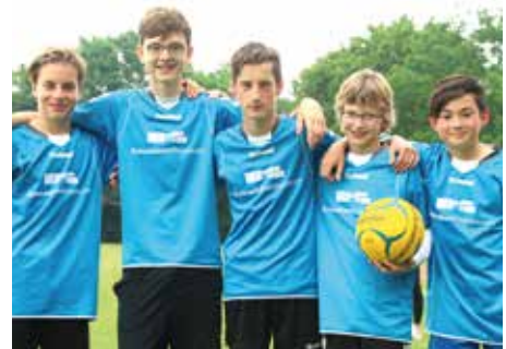
3. Platz - Gym. Wildeshausen 2