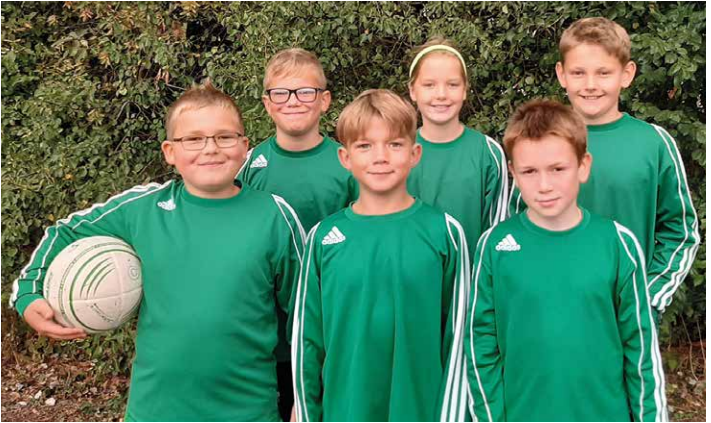
MTV Oldendorf - 1. Platz.