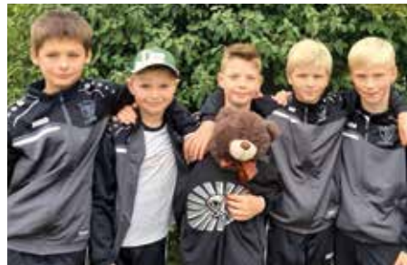
TV Brettorf - 5. Platz.