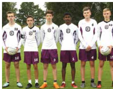
TuS Empelde - 4. Platz.