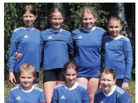
Wardenburger TV - 7. Platz.