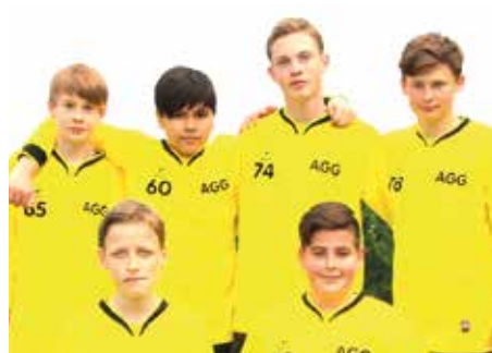
6. Platz - Aue-Geest-Gym. Harsefeld 2