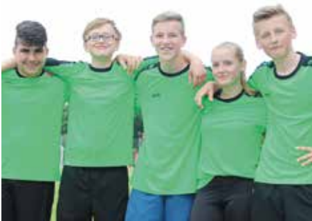
1. Platz - Marie-Curie-Schule Empelde 5