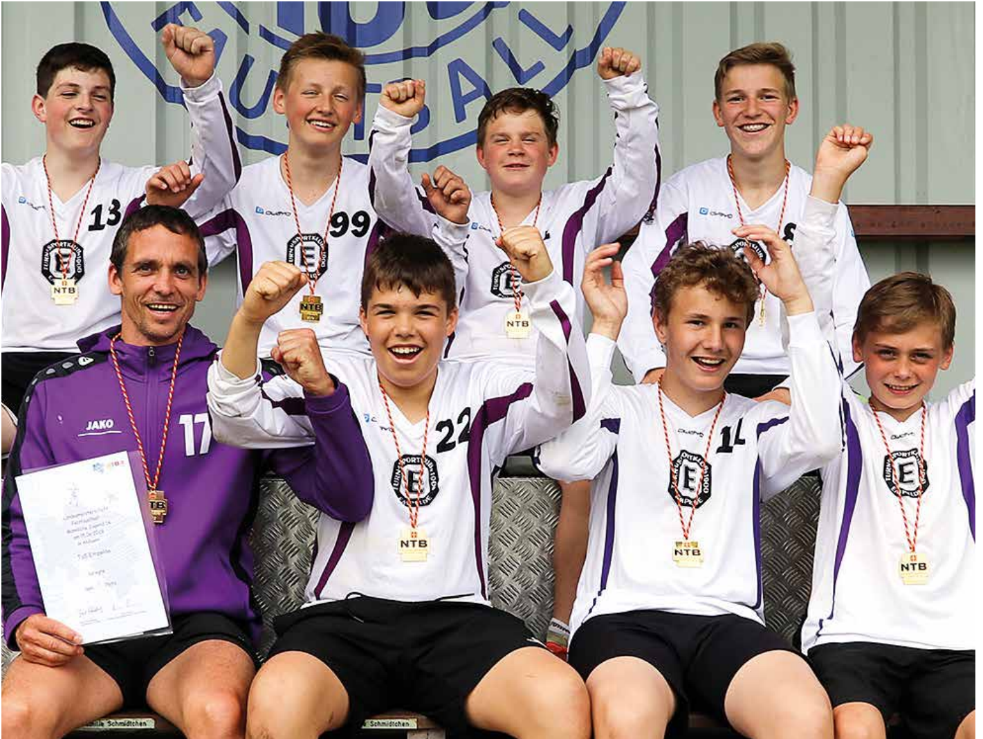
TuS Empelde - 1. Platz.