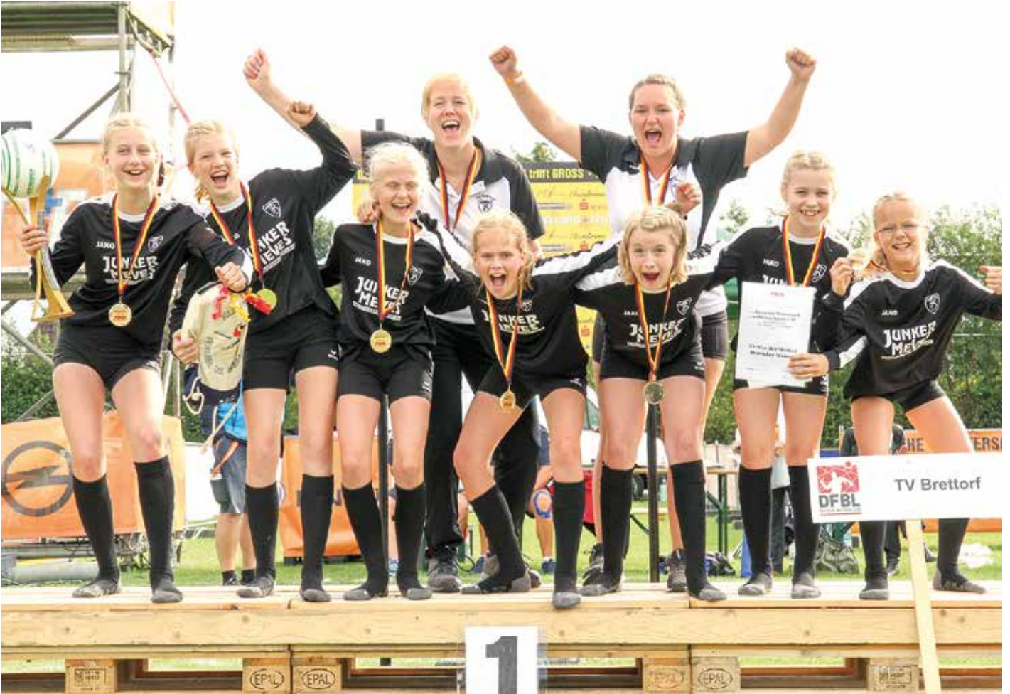
Die Brettorfer Mädchen freuen sich über den Gewinn der Goldmedaillen.