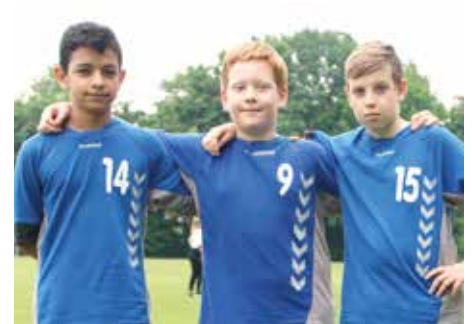
8. Platz - KGS Sehnde