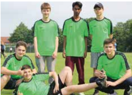
8. Platz - Marie-Curie-Schule Empelde 3