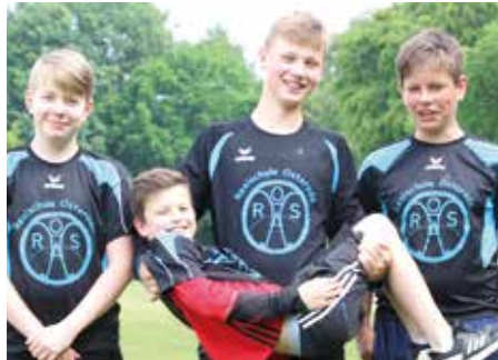
7. Platz - RS Röddenberg - Sucuc