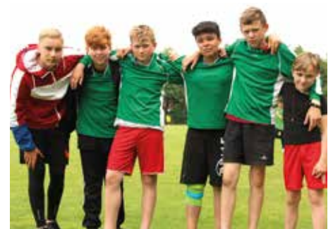
5. Platz - IGS Franzshes Feld BS 4