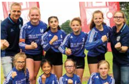
Ahlhorner SV - 2. Platz.