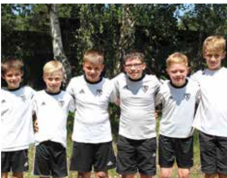
TuS Empelde - 3. Platz.