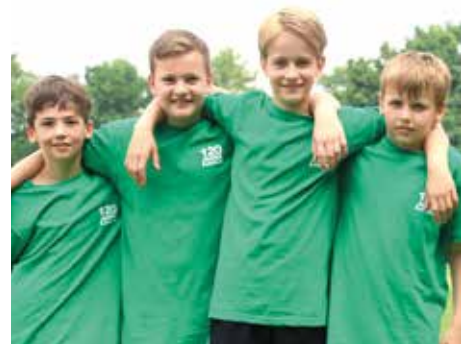
1. Platz - Herderschule Lüneburg 5