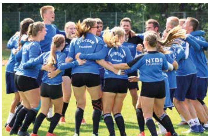
Jubel bei den Auswahlmannschaften.

Nerven und zog mit 3:1 ins Endspiel ein. Hier ging es gegen Schwaben – mit einem perfekten Start. Doch nach dem 11:8 im ersten Satz, ging der zweite verloren (9:11). Somit musste im Entscheidungssatz (bis elf) der neue Sieger gefunden werden. Niedersachsen setzte sich deutlich durch: Mit 11:4 war der niedersächsische Doppel-Erfolg perfekt. (ssp)