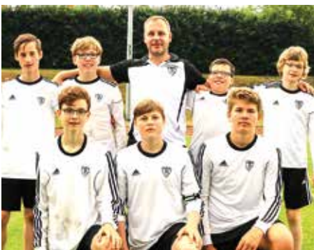
TV Brettorf - 2. Platz.