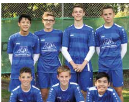
Ahlhorner SV - 3. Platz.