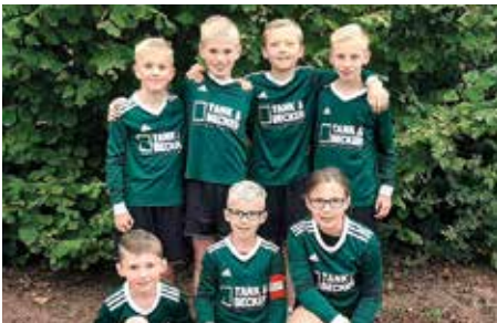
TSV Essel - 2. Platz.