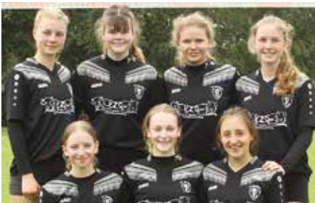
TV Brettorf - 3. Platz.