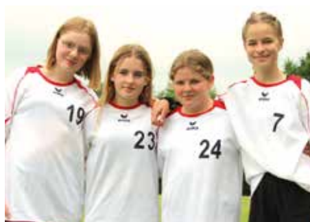
6. Platz - IGS Am Everkamp Wardenburg 1