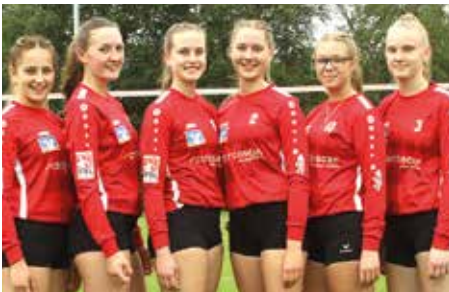
TV Jahn Schneverdingen - 2. Platz.