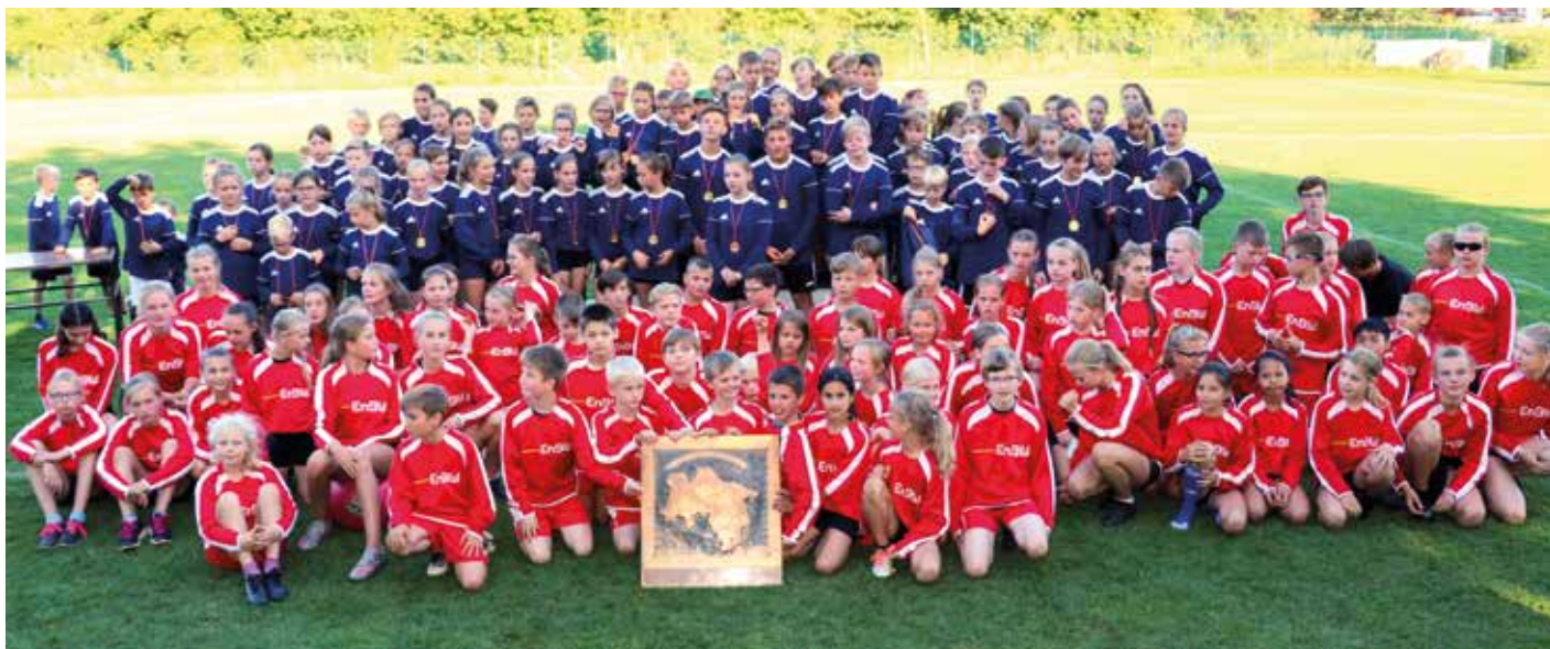
Gruppenbild der siegreichen Mannschaften aus Lüneburg und Weser-Ems.