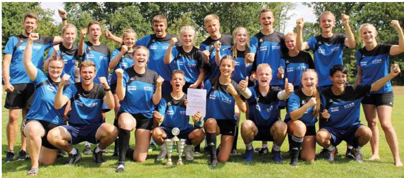
Die NTB Delegation mit den beiden Siegerpokalen.