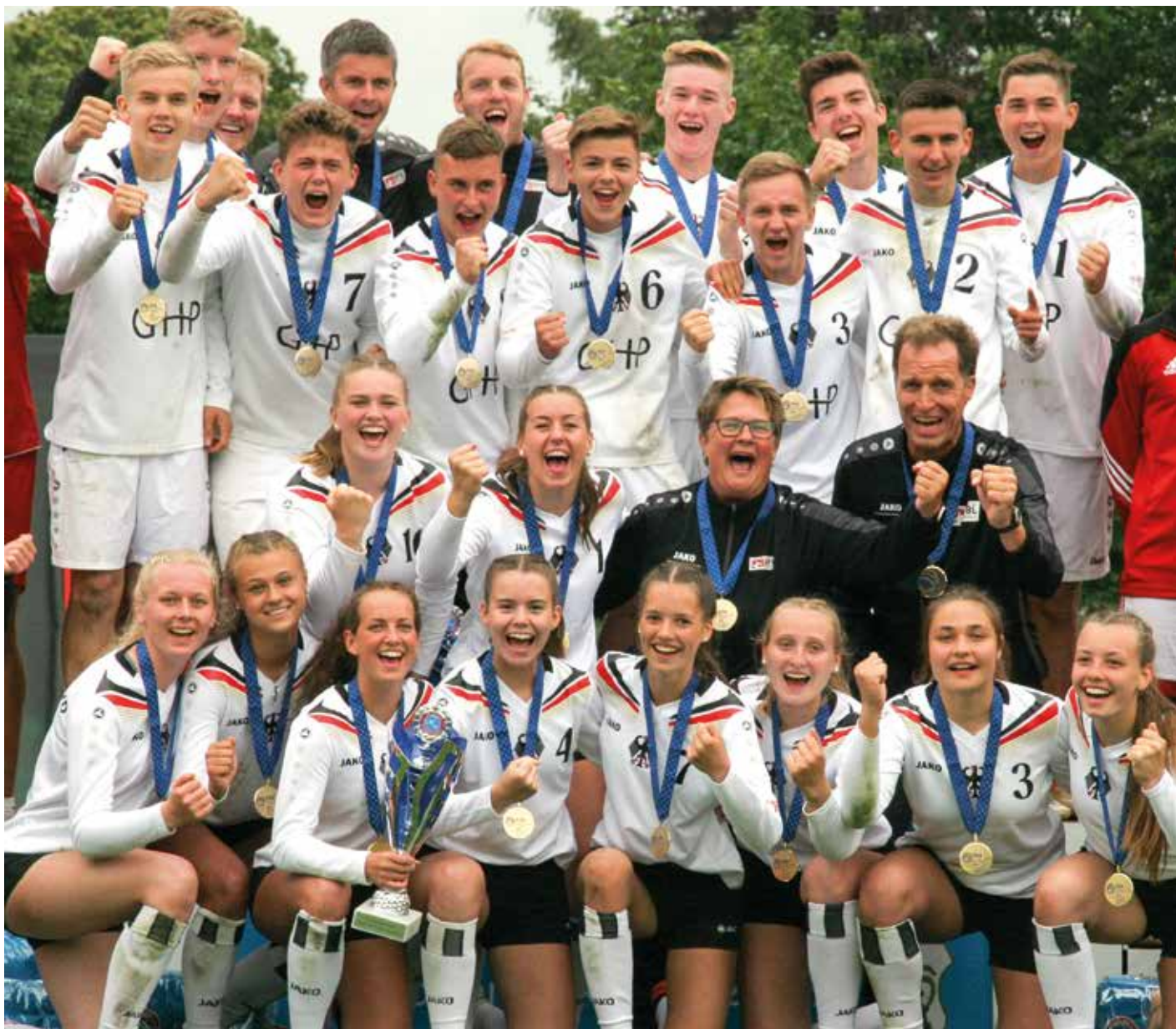
Die U18-Nationamannschaften feiern den Gewinn der Goldmedaille.