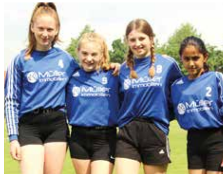
3. Platz - GvZ-Schule Ahlhorn 1