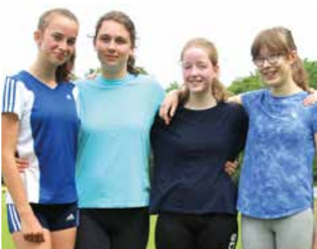
2. Platz - Richarda-Huch