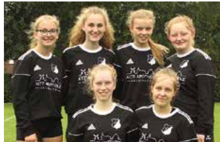
MTSV Selsingen - 6. Platz.