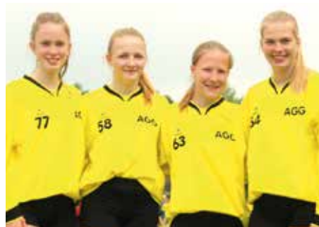
1. Platz - Aue-Geest-Gym. Harsefeld 3