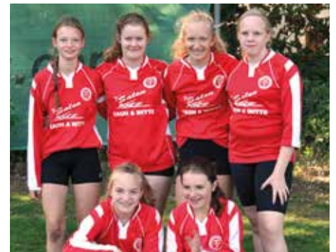
TV Huntlosen - 6. Platz.