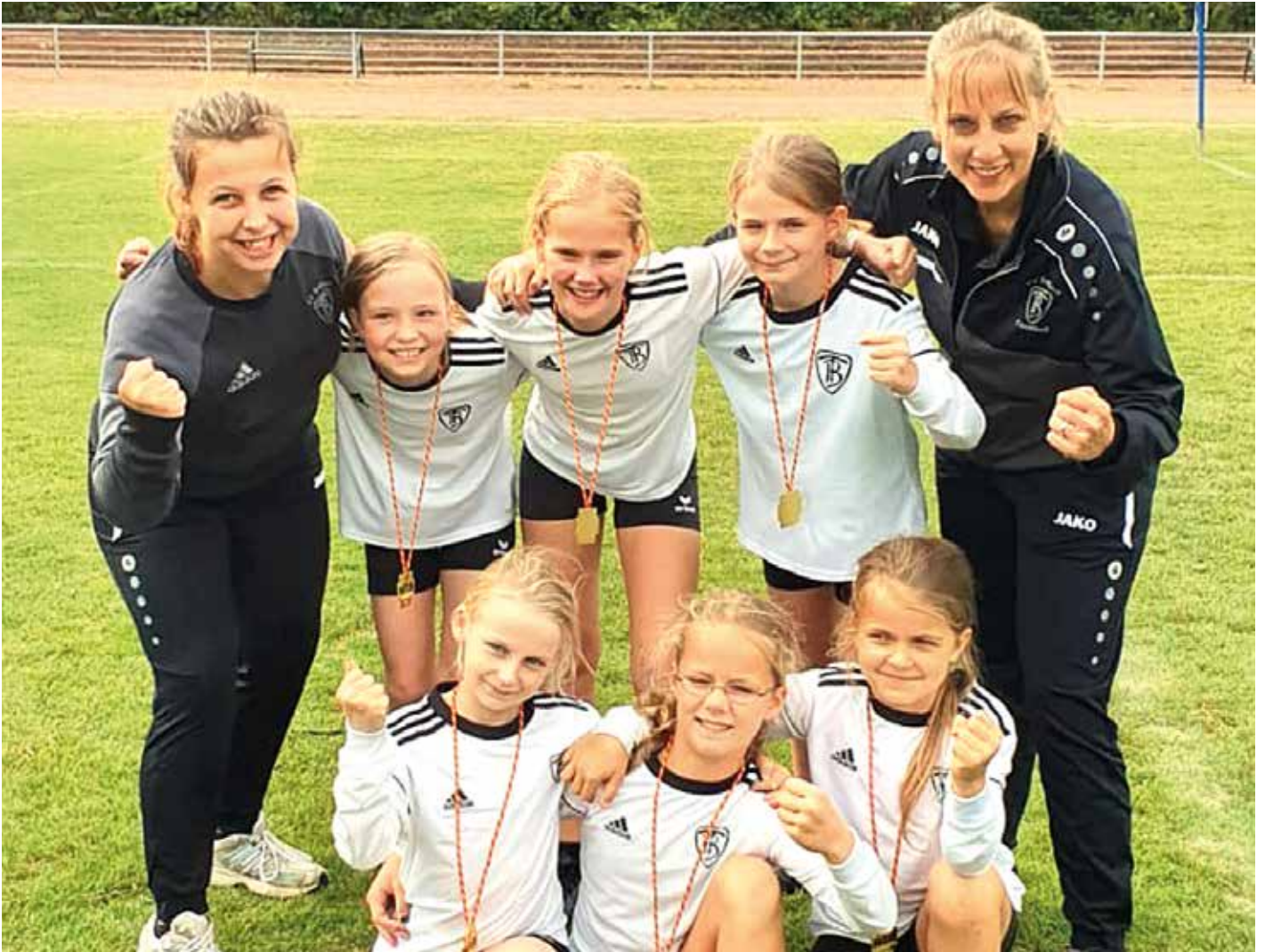
TV Brettorf - 1. Platz.