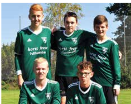
TSV Burgdorf - 2. Platz.