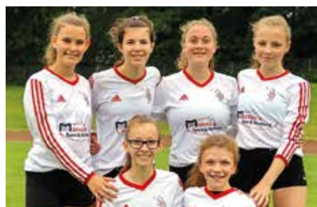
TV Jahn Schneverdingen - 7. Platz.