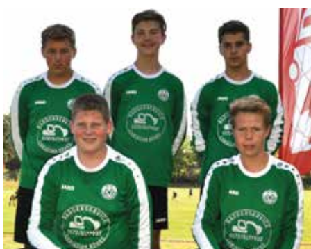
MTV Oldendorf - 5. Platz.