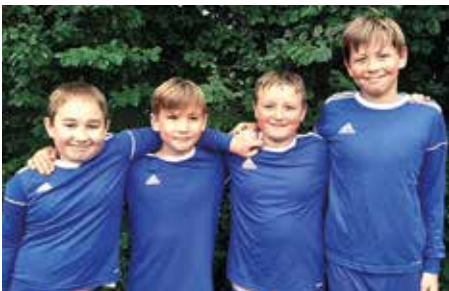
Wardenburger TV - 3. Platz.