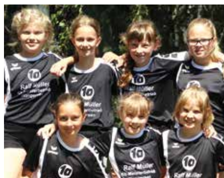
MTV Wangersen - 5. Platz.