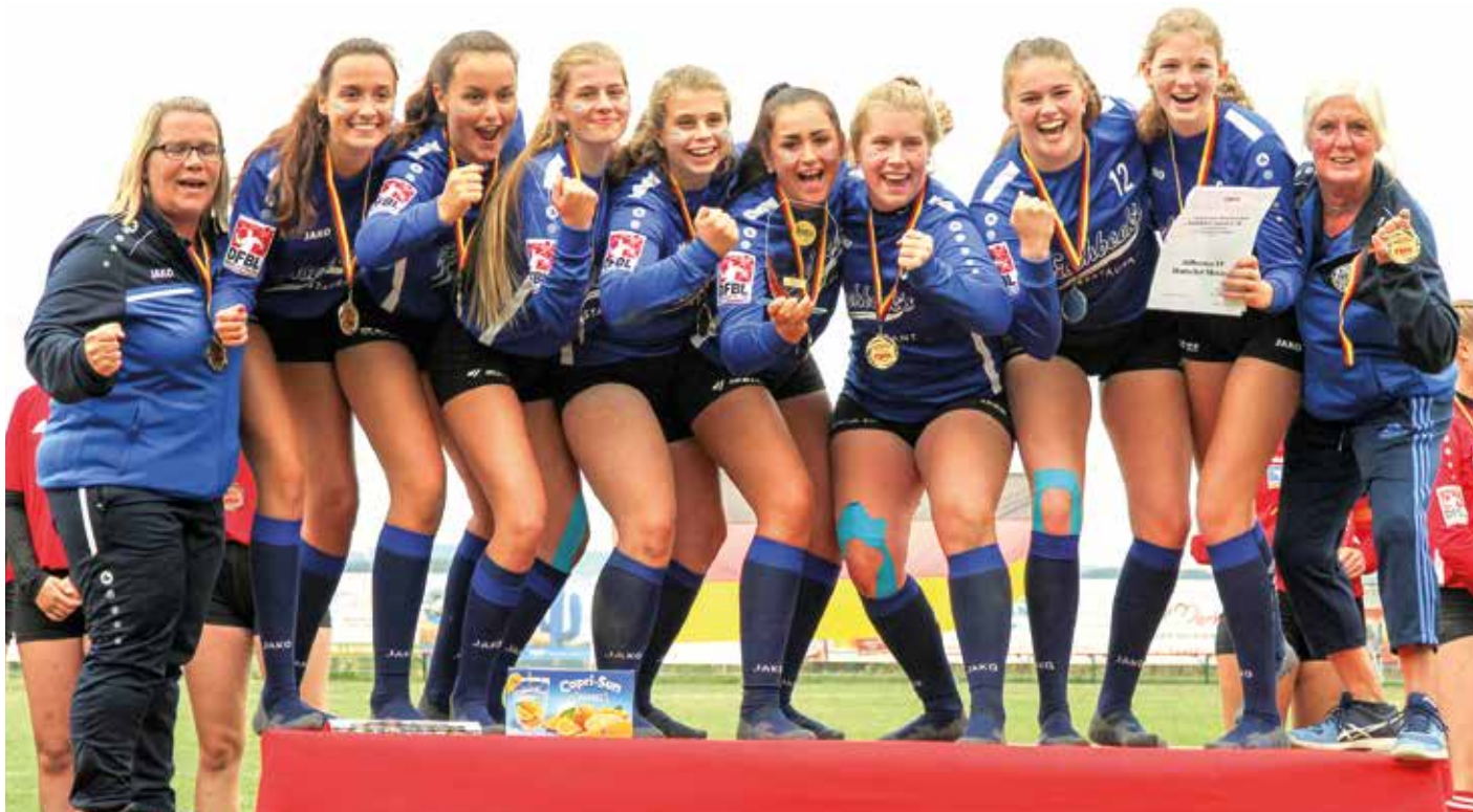
Ahlhorns U18-Mädchen haben überraschend die Deutsche Meisterschaft gewonnen.