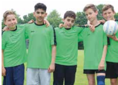
4. Platz - Marie-Curie-Schule Empelde 4