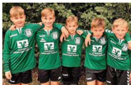
TSV Bardowick - 7. Platz.