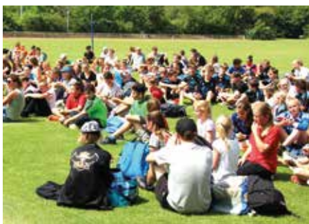
Bei gutem Wetter warten die Schüler gerne auf die Siegerehrung.

der letzten Jahre bedeutet. Da wir aber den Fokus auf die Nachwuchsförderung und -gewinnung legen, können wir dieses Resultat verkraften. Unter den Augen der Bürgermeisterin kämpften die Teams