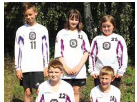
TuS Empelde - 7. Platz.