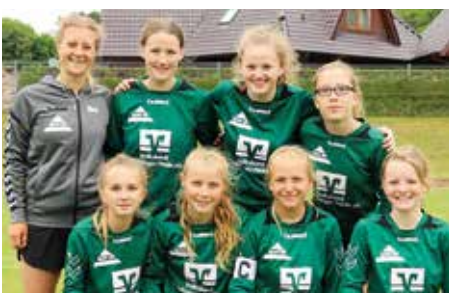
TSV Bardowick - 4. Platz.