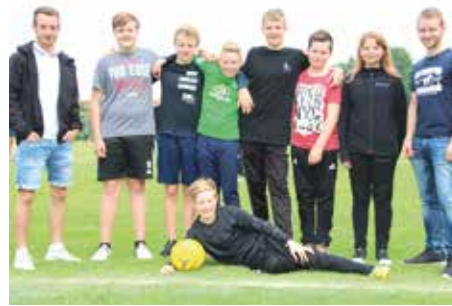
3. Platz - RS Wildeshausen