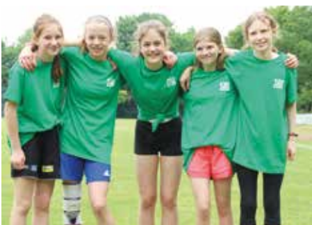
3. Platz - Herderschule Lüneburg 2