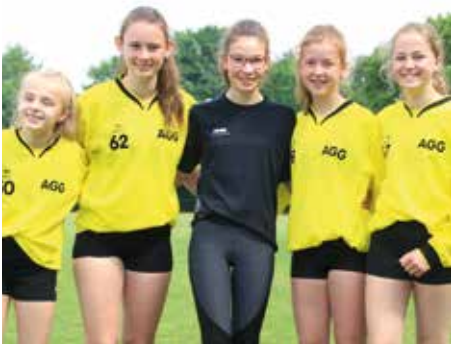
3. Platz - Aue-Geest-Gym. Harsefeld 4