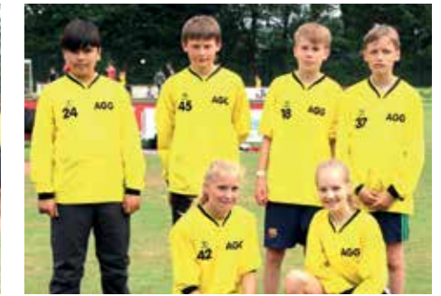
7. Platz - Aue-Geest-Gym. Harsefeld 7