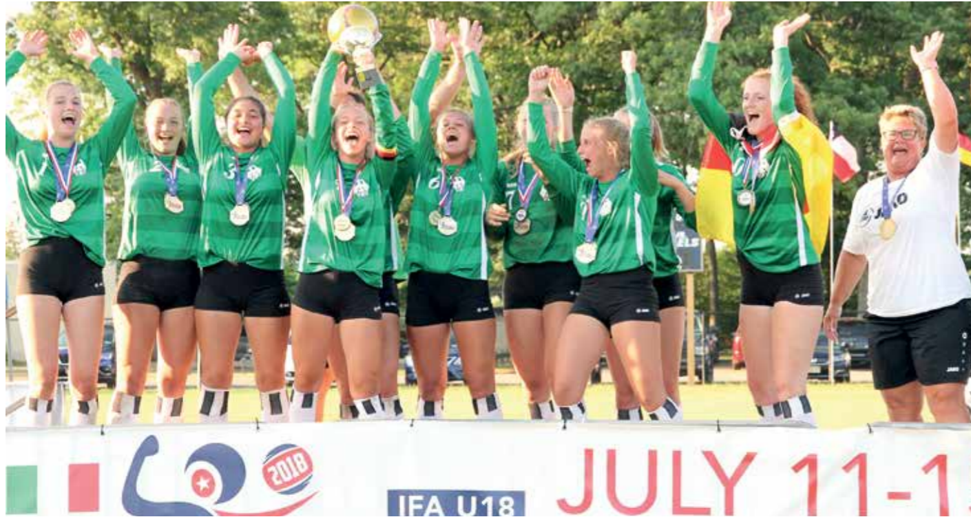
Die U18-Nationamannschaft feiert den Gewinn der Goldmedaille.