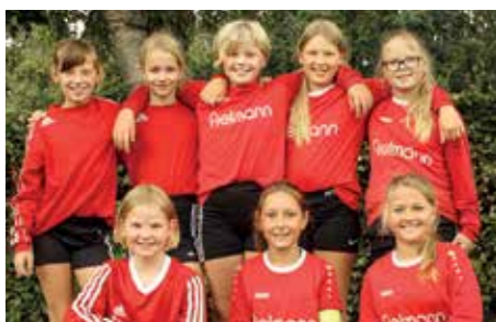
MTV Wangersen - 4. Platz.