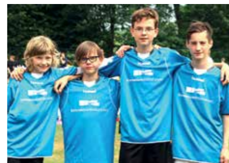
3. Platz - Gynasium Wildeshausen 2