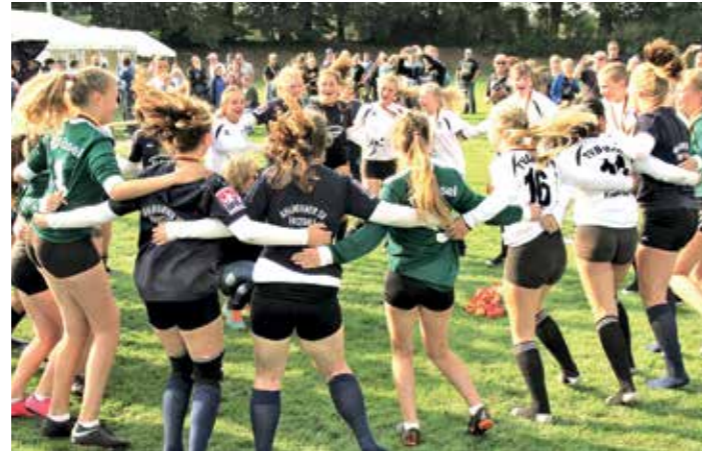
Großer Jubel bei den niedersächsischen Mannschaften.

Brettorf (11:2, 11:7), TSV Gnutz (11:7, 11:7), TV Vaihingen/Enz (11:5, 14:12) und TSV Karlsdorf (11:4, 11:5) durch und machte damit den direkten Halbfinaleinzug perfekt. Hier trafen die Blau-Weißen erneut auf den TV Brettorf. Dieser war als Gruppendritter im Quali-Spiel gegen Biberach gefordert und setzte sich hier 11:6 und 11:8 durch. Das Semifinale der beiden Landkreis-Kontrahenten war dann gerade im ersten Satz