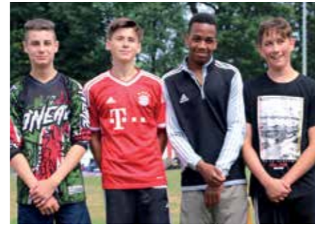
8. Platz - Waldschule Hatten 1