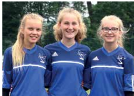
1. Platz - Gymnasium St. Viti Zeven