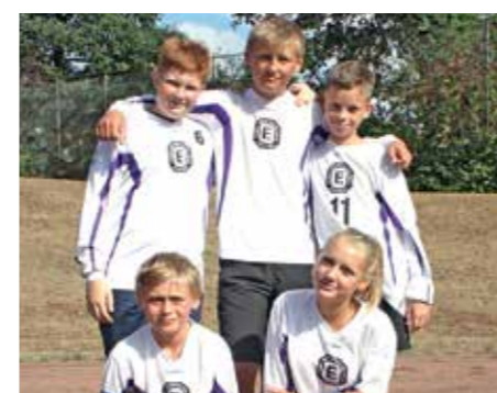
TuS Empelde - 3. Platz.