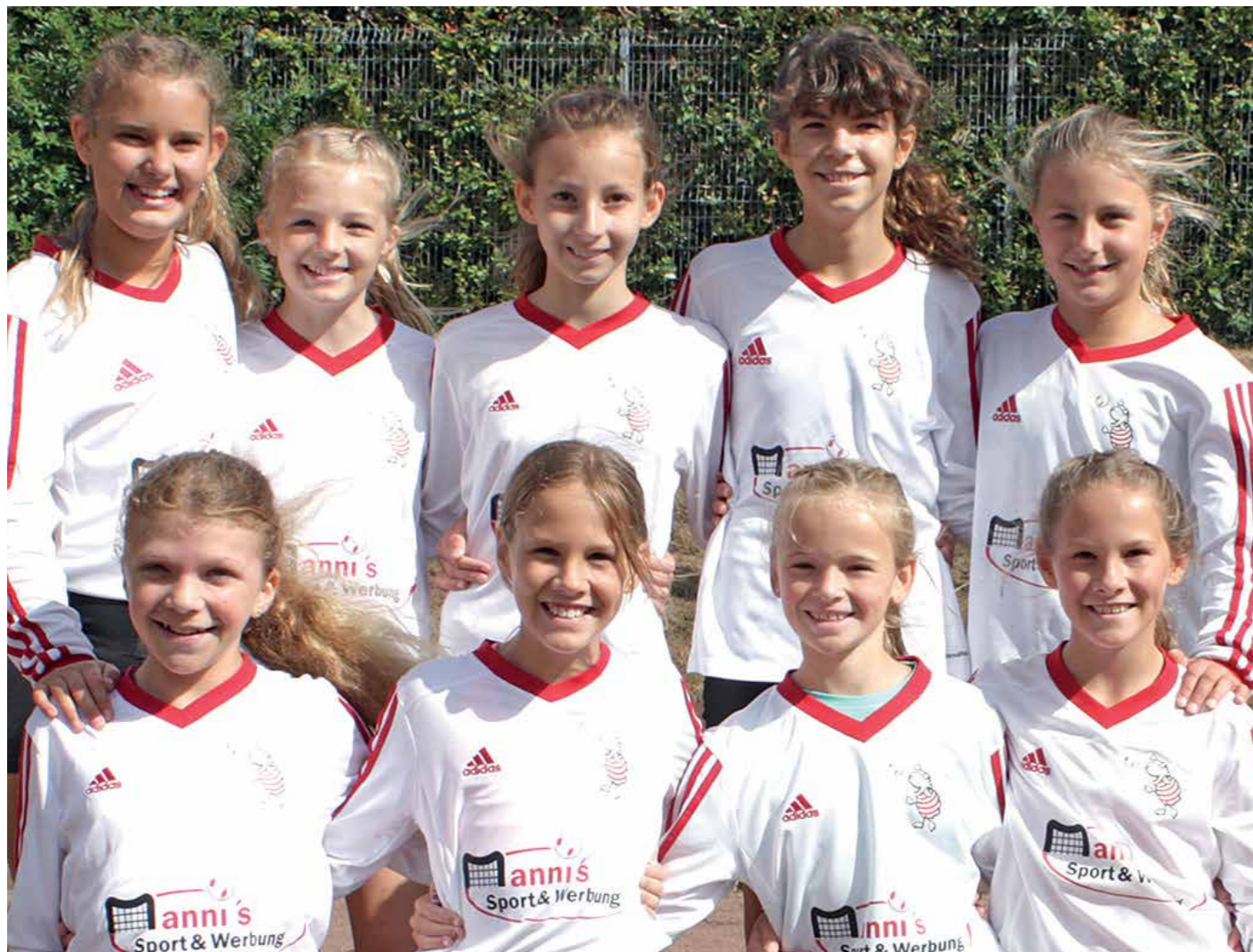
TV Jahn Schneverdingen - 1. Platz.