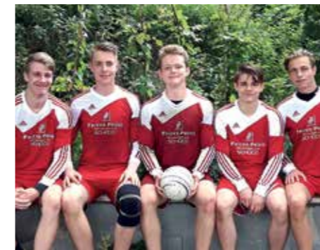
MTSV Selsingen - 3. Platz.