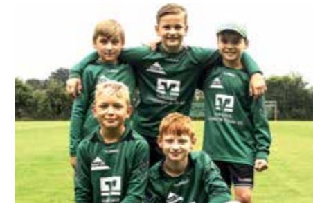
TSV Bardowick - 2. Platz.