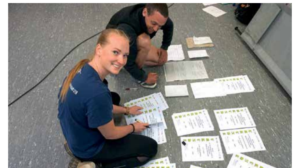
Auswertung vor der Siegerehrung.