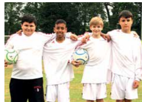
4. Platz - OBS Garbsen