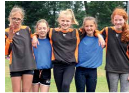
3. Platz - Eschhofschule Lemwerder