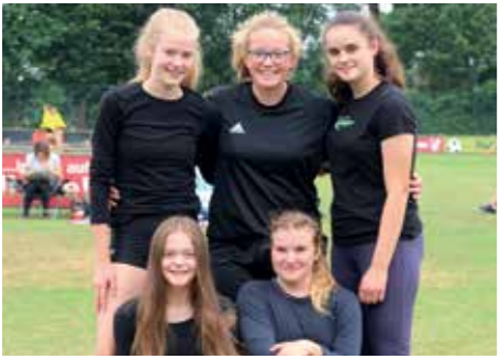
2. Platz - D.-Bonhoeffer-Gym Ahlhorn 2