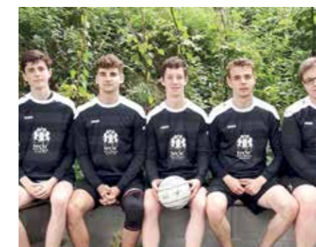
SV Düdenbüttel - 4. Platz.