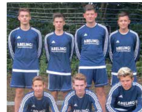
Ahlhorner SV - 2. Platz.