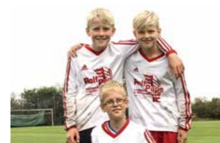
TSV Abbenseth - 4. Platz.