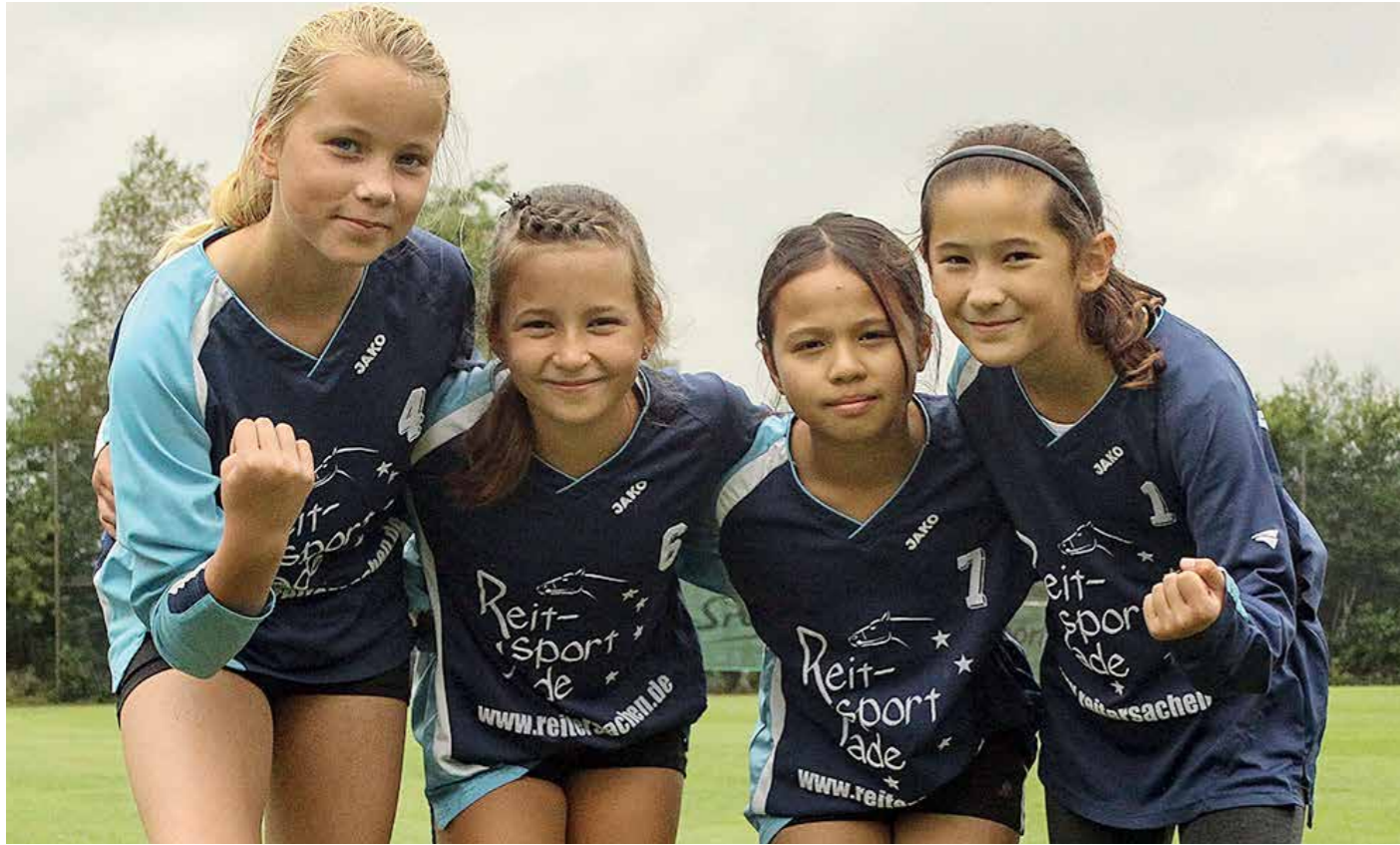
Ahlhorner SV 1 - 1. Platz.