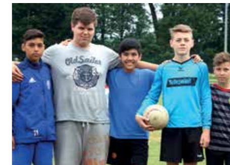
4. Platz - D.-Bonhoeffer-Gym. Ahlhorn 5