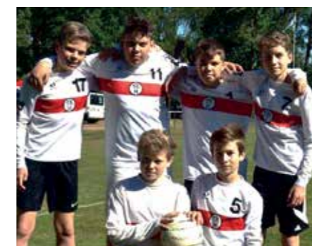
TK Hannover - 5. Platz.