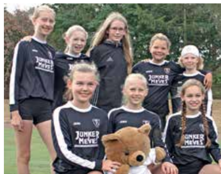
TV Brettorf - 2. Platz.