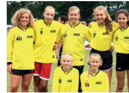
4. Platz - Aue-Geest-Gym. Harsefeld 3