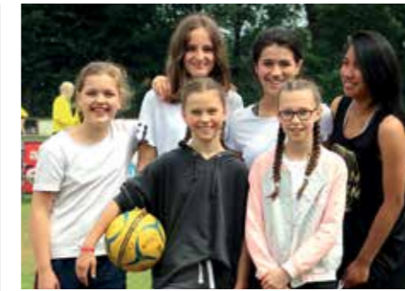
1. Platz - IGS Franzches Feld BS 3