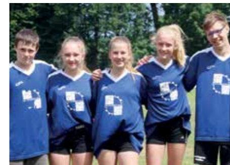
3. Platz - Geestlandschule Fredenbeck 2