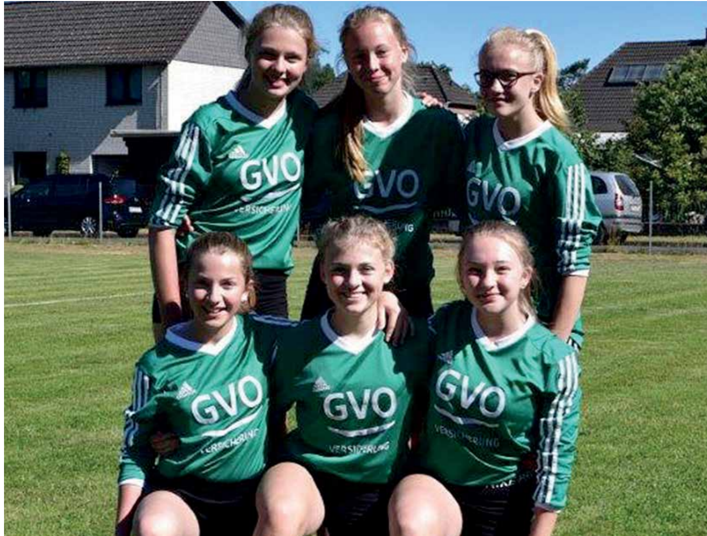
TSV Essel - 1. Platz.