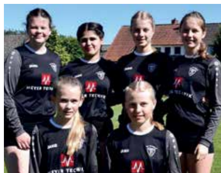
TV Brettorf - 3. Platz.