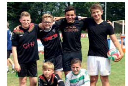
5. Platz - RS Wildeshausen 2