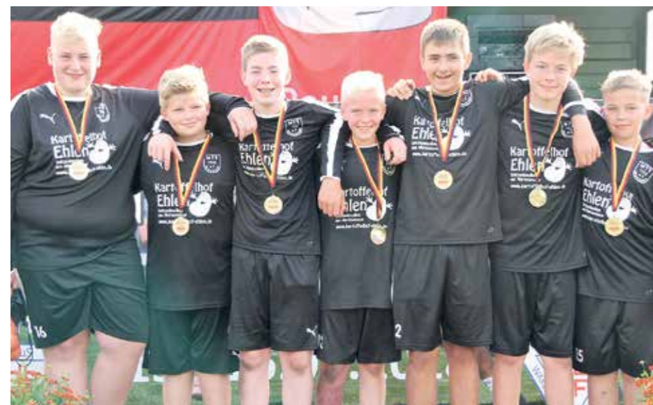
Die Jungs aus Wangersen sind Deutscher Meister.