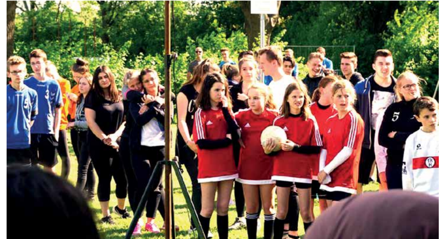
Die Marie Curie Schule in Empelde richtet zum ersten Mal die Schulfaustball Bezirksmeisterschaft aus.

Bei den Jungen siegte die RS Osterode 2 vor den „Hunters“ und Osterode 5. Bei den Mädchen des Jahrgang 7/8 landete das Hattorfer Team ganz vorn. Hattorf war auch bei den Mädchen der Leistungsklasse 9.-12. KL siegreich. Bei den 9.-12.Jahrgängen kamen ansonsten alle Erstplatzierten von der IGS FF. Bei den Mädchen „Barbie“ vor IGS 9.3 und 9.4. Bei den Jungen „Diedie“ vor „Jagamix“ und Hattorf. Für die Landesmeisterschaften im Schulfaustball sind jeweils die ersten beiden Mannschaften der männlichen, wie auch der weiblichen Jugend qualifiziert. Bei der Siegerehrung ging aber niemand leer aus. Jeder erhielt eine Medaille und ein Faustball-T-Shirt zur Erinnerung. Für jedes Team gab es natürlich auch eine Siegerurkunde. (obe)