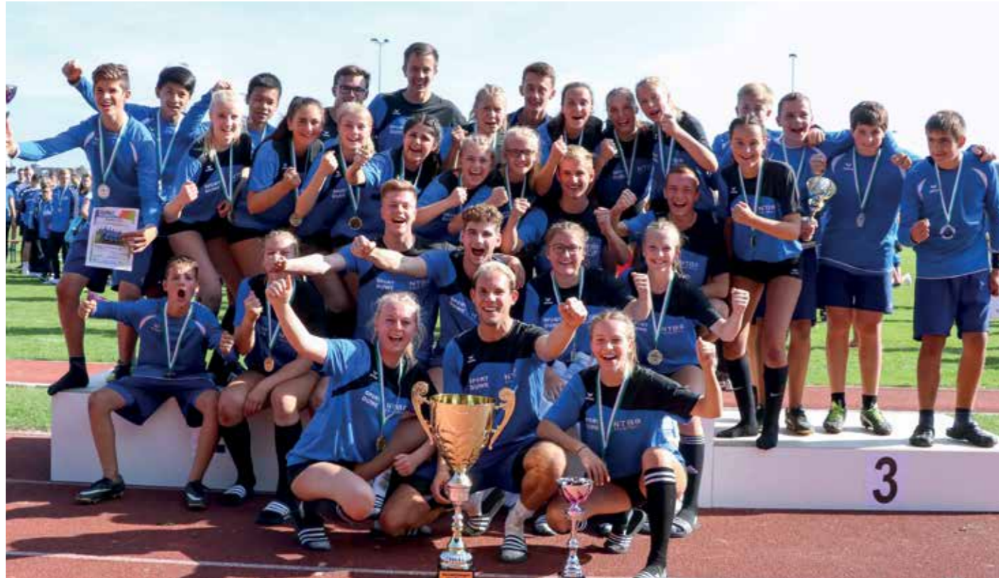
Mehr geht nicht: Der Faustball-Nachwuchs aus Niedersachsen freut sich über die Titelverteidigung.