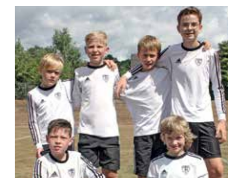
TV Brettorf - 7. Platz.