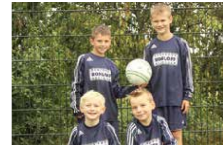
Ahlhorner SV - 6. Platz.