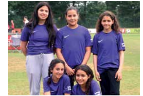
2. Platz - OBS Alexanderstr. Oldenburg 2