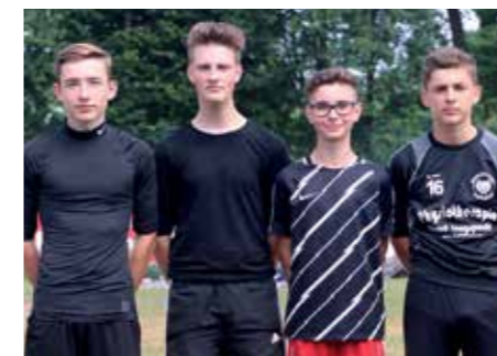
3. Platz - Waldschule Hatten 2