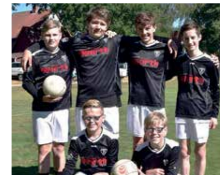
TV Brettorf - 4. Platz.