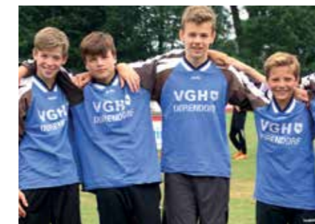
4. Platz - Herderschule Lüneburg 1