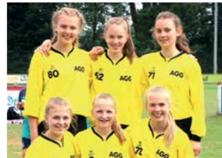
2. Platz - Aue-Geest-Gym. Harsefeld 4