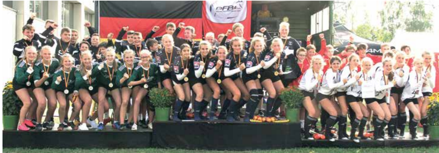
Gold, Silber und Bronze für die Mannschaften aus Niedersachsen bei den Mädchen.