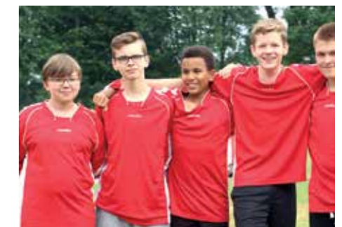
5. Platz - IFS Franzshes Feld BS 2