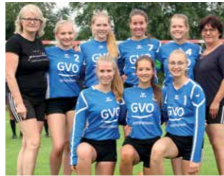
SV Düdenbüttel - 4. Platz.