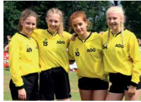
3. Platz - Aue-Geest-Gym. Harsefeld 2