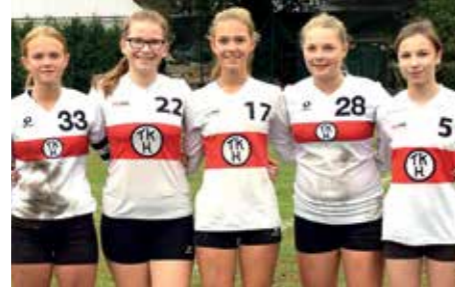
TK Hannover - 7. Platz.