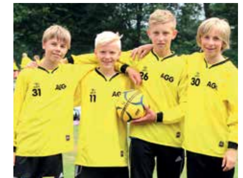
2. Platz - Aue-Geest-Gym. Harsefeld 5