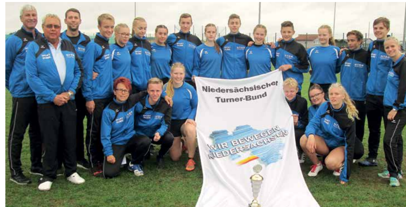
Die NTB Delegation mit dem Pokal der U16-Mädchen.