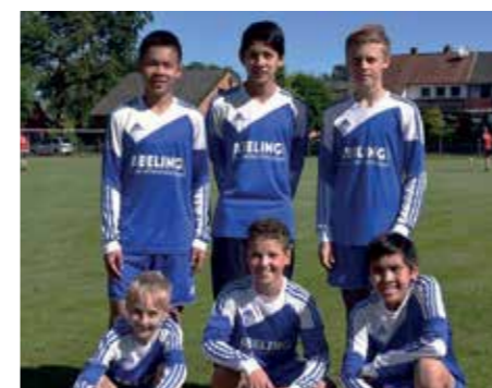
Ahlhorner SV - 3. Platz.