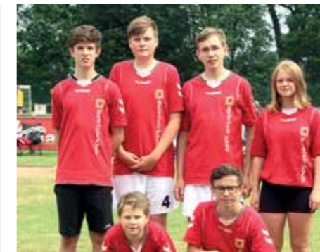
1. Platz - Marie-Curie-Schule Empelde 3