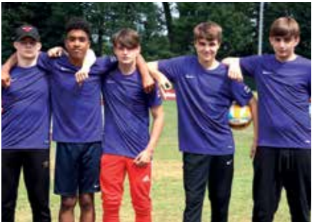
8. Platz - OBS Alexanderstraße Oldenburg