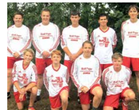
TSV Abbenseth - 5. Platz.