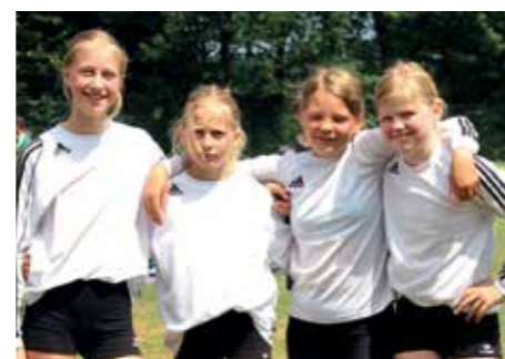
3. Platz - RS Wildeshausen 3