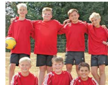
MTV Wangersen - 4. Platz.