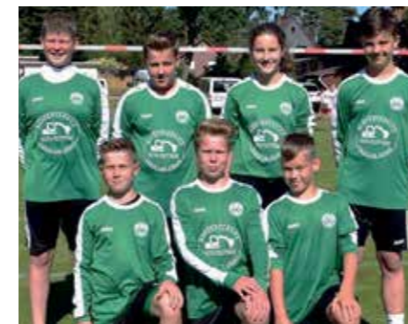
MTV Oldendorf - 2. Platz.