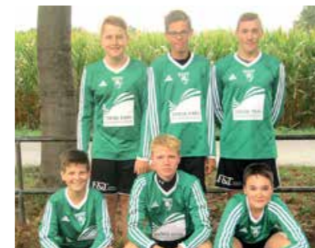
TSV Burgdorf - 3. Platz.