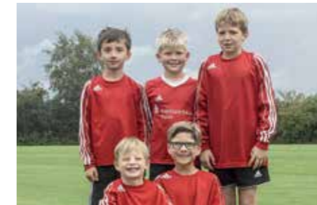
MTV Wangersen - 5. Platz.