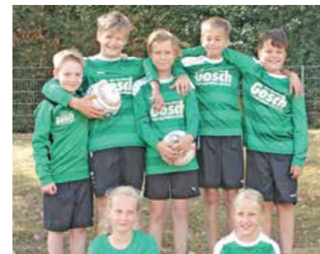
TuS Bothfeld 04 - 2. Platz.