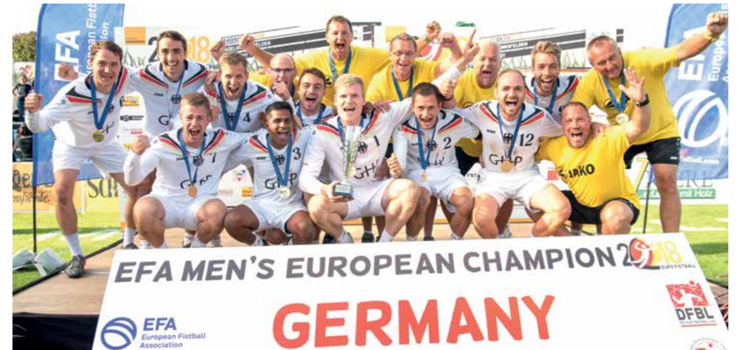
Sie feiern den Titelgewinn: Die Männer der deutschen Nationalmannschaft.