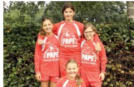
MTSV Selsingen - 5. Platz.