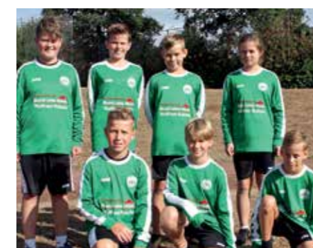
MTV Oldendorf - 5. Platz.