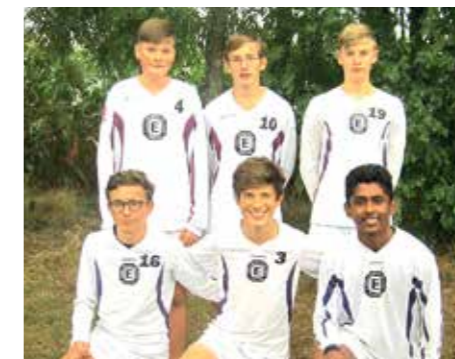
TuS Empelde - 4. Platz.