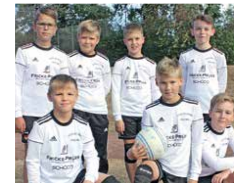
MTSV Selsingen - 6. Platz.