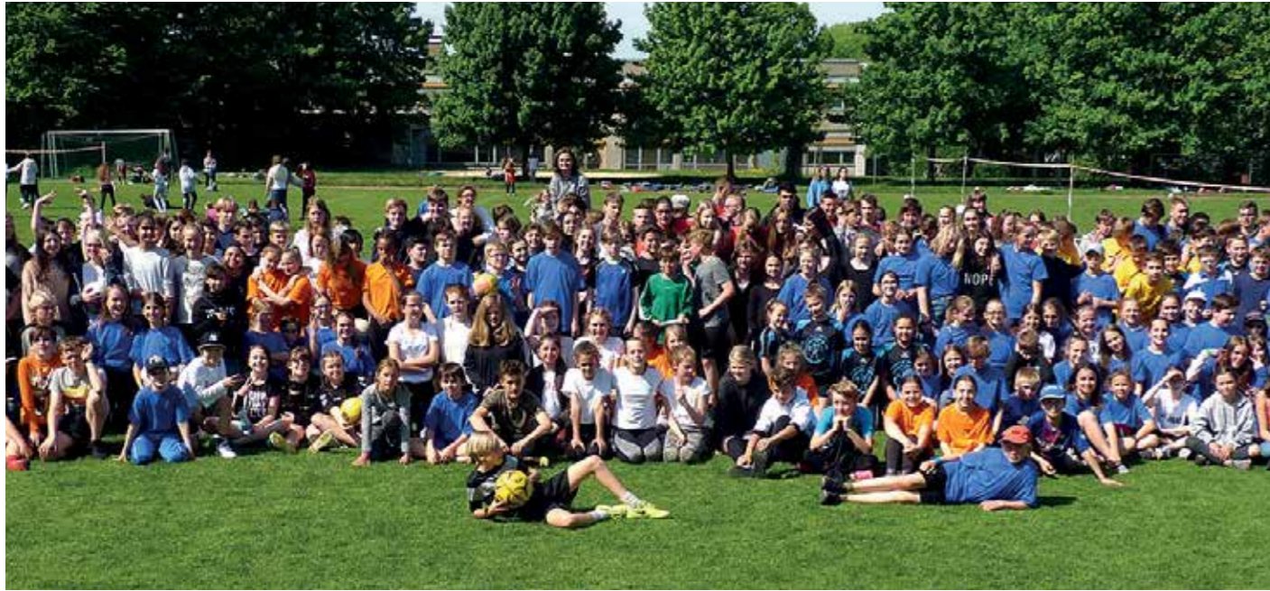
53 Mannschaften machten in Braunschweig mit.