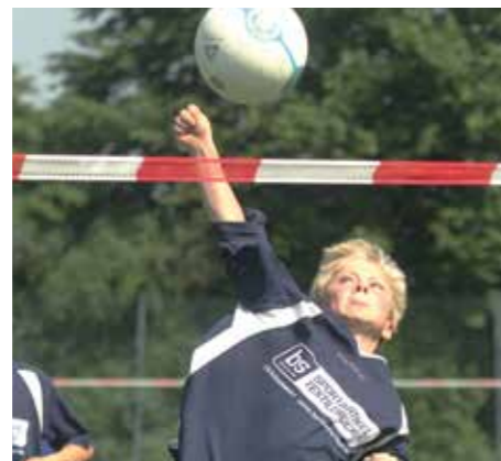
Gute Technik: Dieser Nachwuchs spielt schon im Verein.