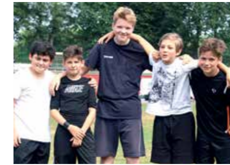
6. Platz - IGS Franzches Feld BS 6