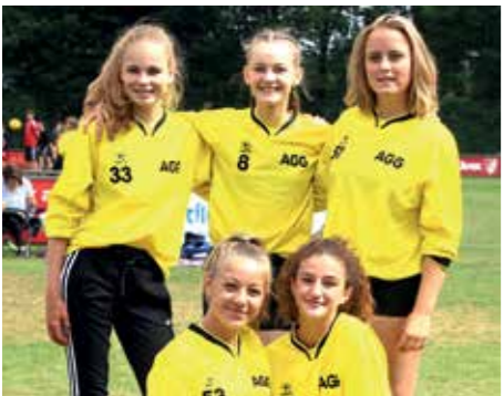
5. Platz - Aue-Geest-Gym. Harsefeld 1