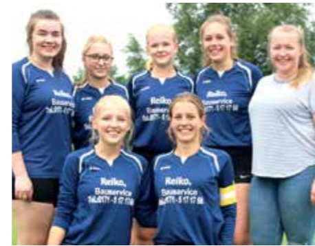
MTV Hammah - 6. Platz.