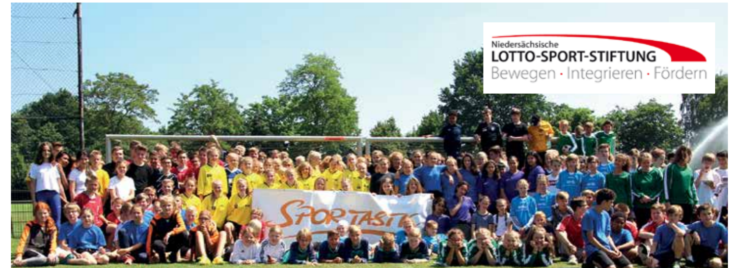
41 Mannschaften aus 16 Schulen waren bei der Landesmeisterschaft in Delmenhorst dabei.