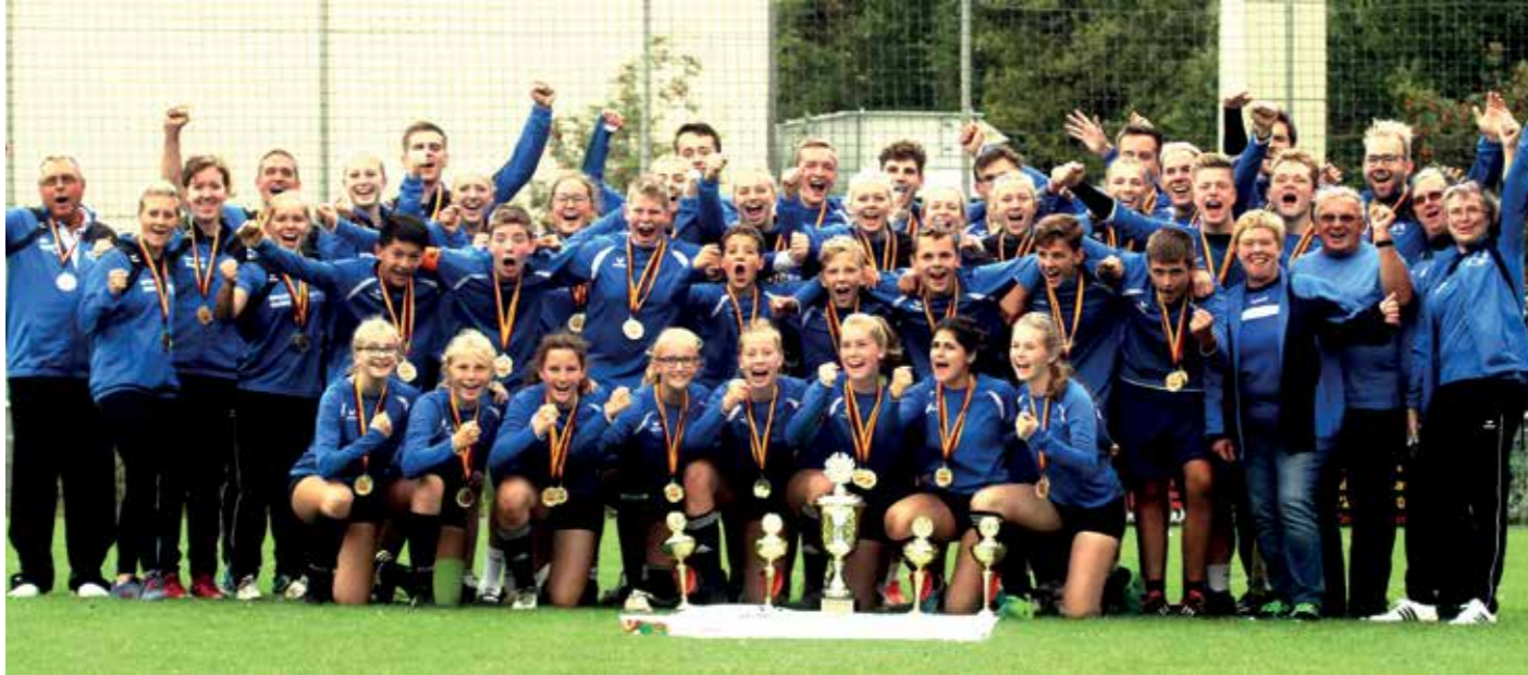
Die Auswahl Niedersachsens hat in allen vier Spielklassen den Titel gewonnen.