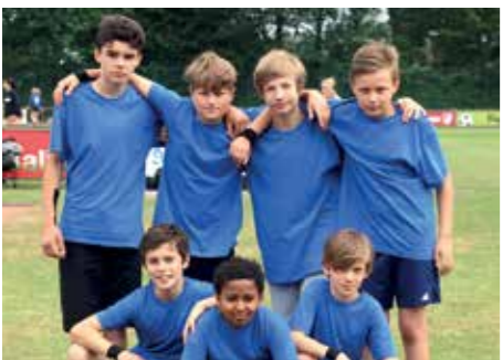
2. Platz - IGS Franzches Feld BS 5