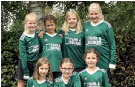
TSV Essel - 2. Platz.