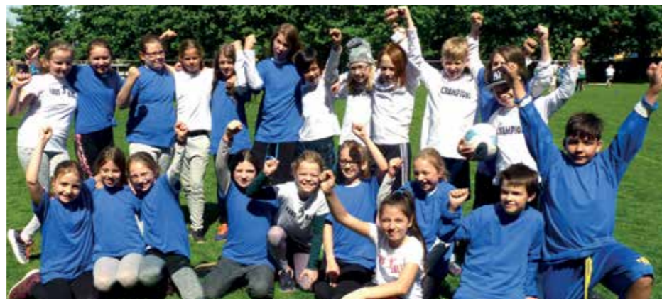
Neue T-Shirts und Urkunden - da war die Freude groß bei den Kindern.

das Team „Nie ohne“ vor „RTT“ und den „Black Panther“. Der vierte Platz ging an das Gymnasium Ricarda-Huch. Neben den weiteren 14 IGS-Mannschaften mit ähnlich phantasievollen Namen, war hier die Realschule Osterode am Harz mit vier Teams am Start und erreichte die Plätze 8-10 und Rang 16. Die Klasse 6.2 siegte bei den Mädchen der 5./6.Klasse. Es folgten die „Five Hörnchen“ auf dem 2. Platz. Erstmals am Start war die Henriette-Breymann-Gesamtschule aus Wolfenbüttel, die sich über einen tollen 3. Platz freuten, den sich sie mit den „Cacahuettes“ teilen. Auch hier folgen dann noch weitere 11 Teams der IGS FF. Dazwischen noch die RS Osterode auf dem 10. Platz. Die Harzer waren dafür bei den Jahrgängen der 7./8. Klassen erfolgreich.