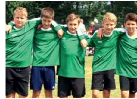
5. Platz - OBS Ahlerstedt 1