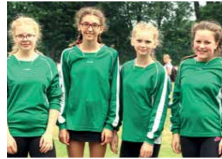
4. Platz - IGS Franzches Feld BS 1