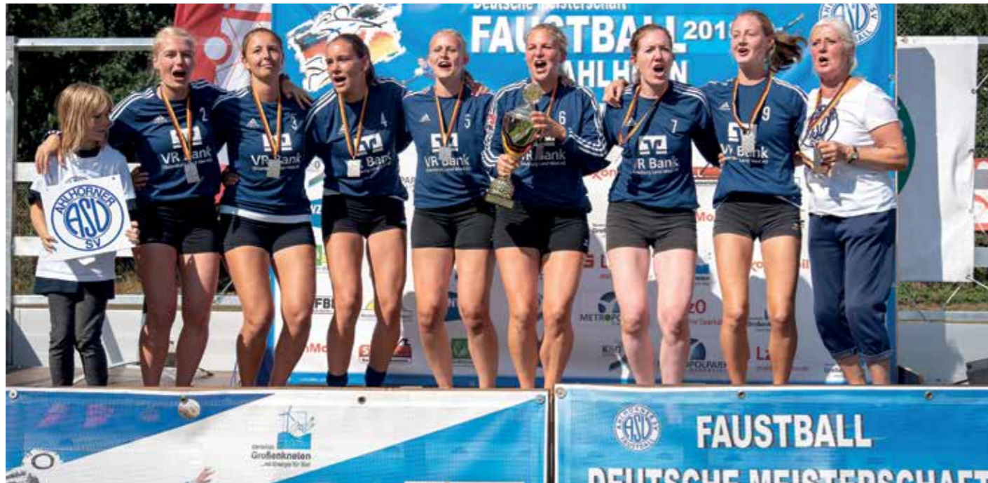
Die Ahlhorner Frauen feiern den Gewinn der Silbermedaille.