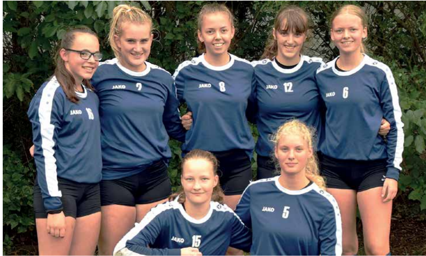
Wardenburger TV - 1. Platz.