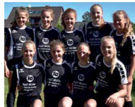
MTV Wangersen - 5. Platz.