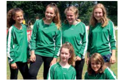
5. Platz - IGS Franzches Feld BS 4