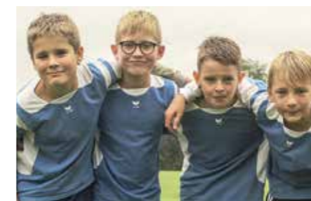
SV Düdenbüttel - 7. Platz.