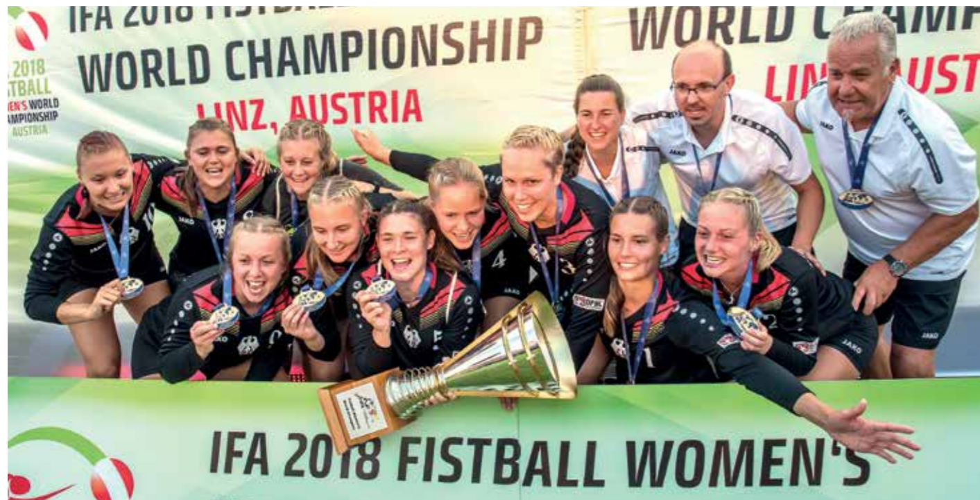
Sie sind wieder Weltmeister: die deutschen Faustball-Frauen.