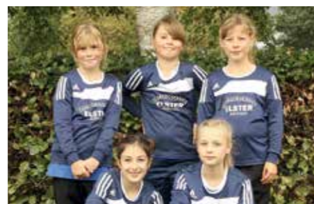
Ahlhorner SV 2 - 7. Platz.