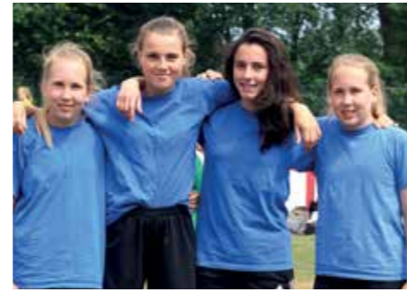
1. Platz - D.-Bonhoeffer-Gym Ahlhorn 1