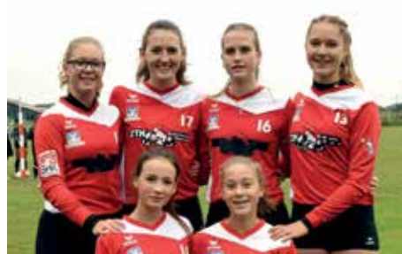
TV Jahn Schneverdingen - 4. Platz.