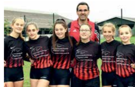
TuS Essenrode - 8. Platz.