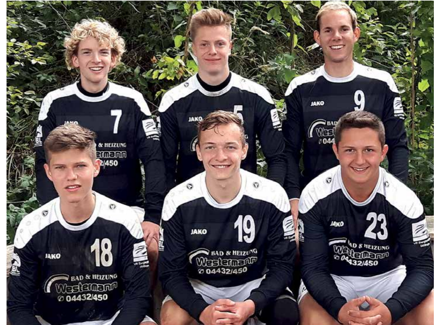
TV Brettorf - 1. Platz.