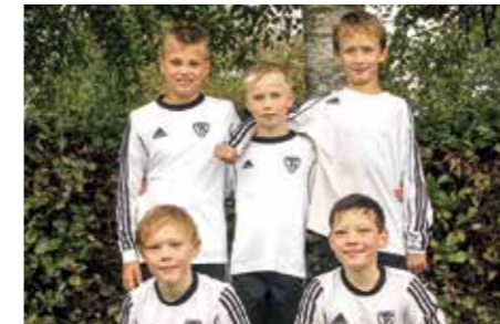
TV Brettorf - 3. Platz.