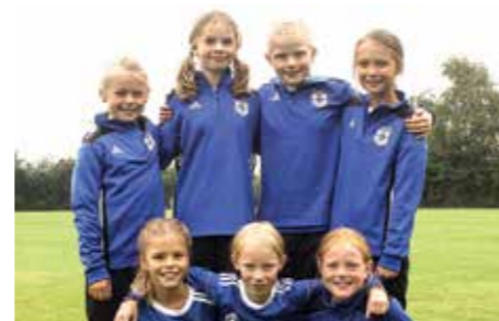
MTV Diepenau - 8. Platz.