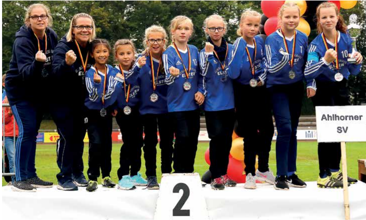
Die Ahlhorner Mädchen freuen sich über den Gewinn der Silbermedaillen.