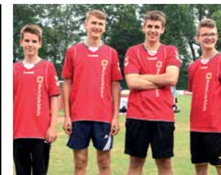
1. Platz - Marie-Curie-Schule Empelde 1