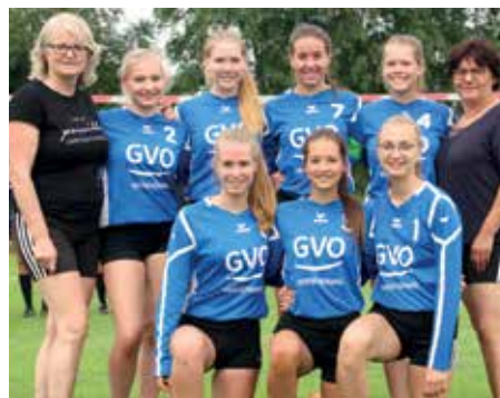
SV Düdenbüttel - 4. Platz.