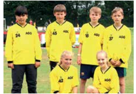
7. Platz - Aue-Geest-Gym. Harsefeld 7