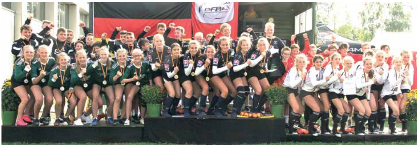
Gold, Silber und Bronze für die Mannschaften aus Niedersachsen bei den Mädchen.