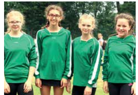
4. Platz - IGS Franzshes Feld BS 1