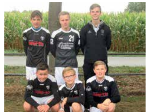
TV Brettorf - 6. Platz.