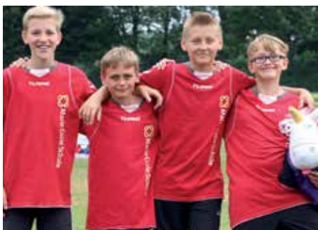
1. Platz - Marie-Curie-Schule Empelde 4