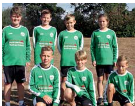
MTV Oldendorf - 5. Platz.