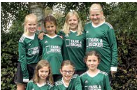
TSV Essel - 2. Platz.