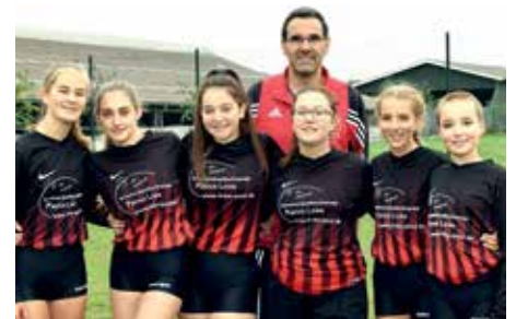
TuS Essenrode - 8. Platz.