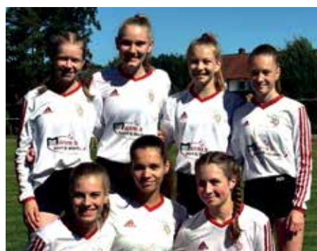
TV Jahn Schneverdingen - 4. Platz.