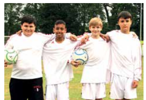
4. Platz - OBS Garbsen