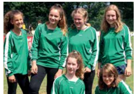
5. Platz - IGS Franzshes Feld BS 4