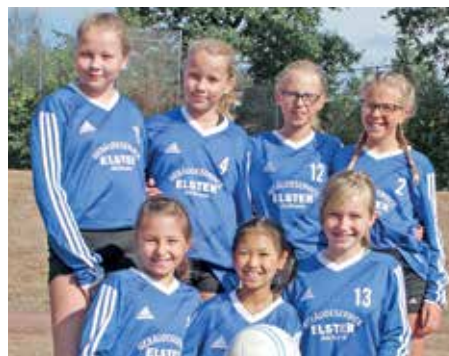
Ahlhorner SV - 4. Platz.