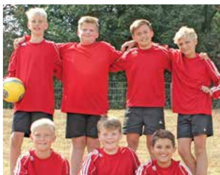
MTV Wangersen - 4. Platz.