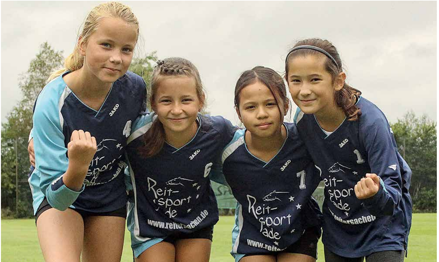
Ahlhorner SV 1 - 1. Platz.