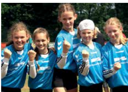
1. Platz - Gymnasium Wildeshausen 2