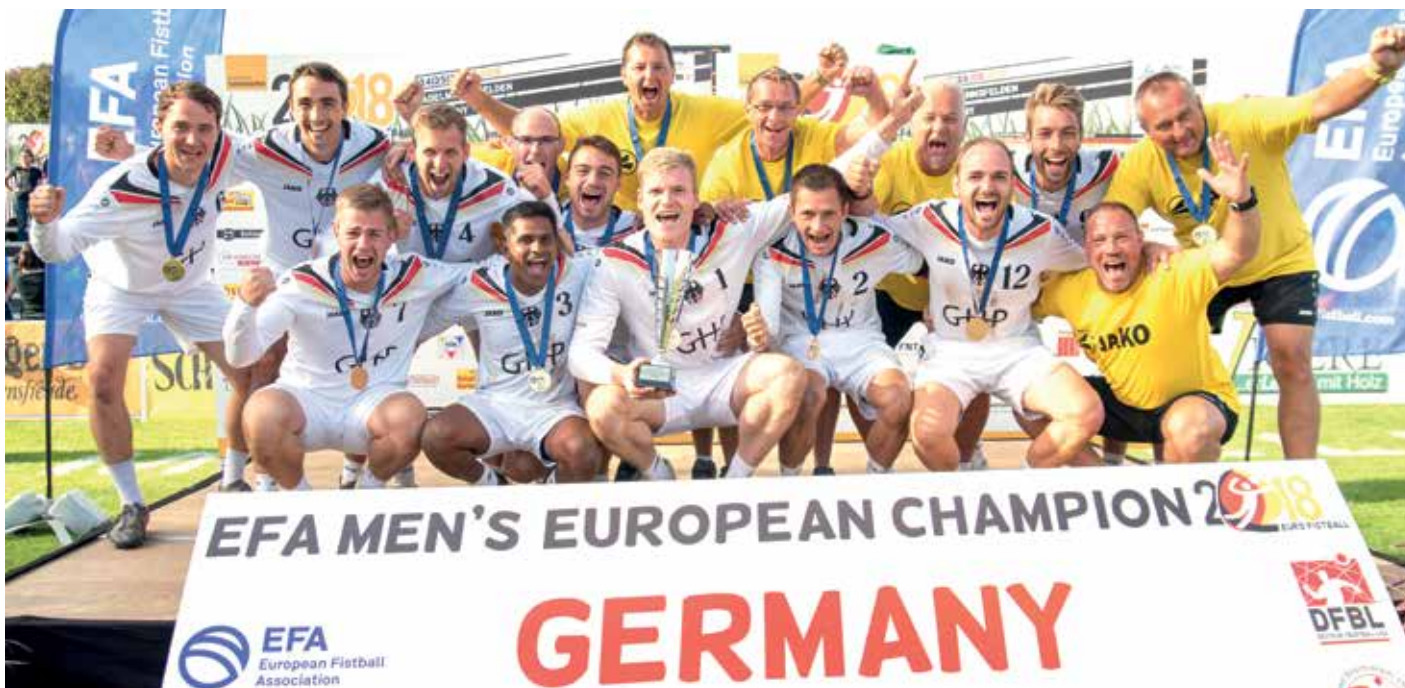
Sie feiern den Titelgewinn: Die Männer der deutschen Nationalmannschaft.