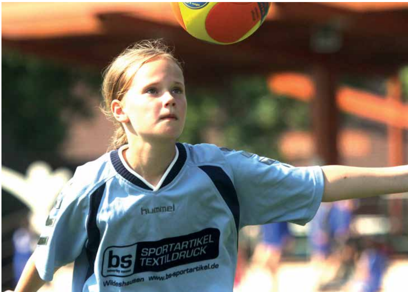
Hohes Niveau: Bei der Bezirksmeisterschaft waren viele Aktive dabei.