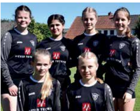
TV Brettorf - 3. Platz.