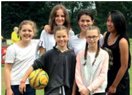
1. Platz - IGS Franzshes Feld BS 3