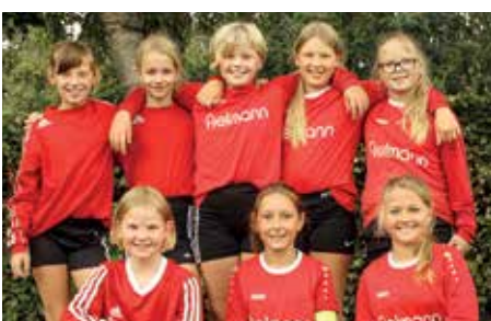
MTV Wangersen - 4. Platz.