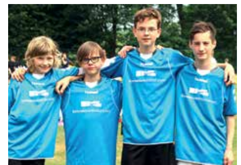
3. Platz - Gmysnasium Wildeshausen 2