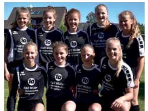
MTV Wangersen - 5. Platz.