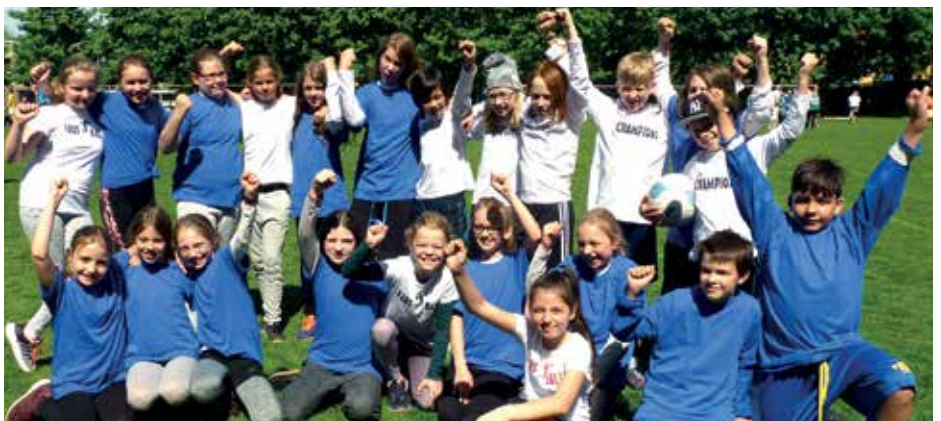
Neue T-Shirts und Urkunden - da war die Freude groß bei den Kindern.

Bei den Jungen siegte die RS Osterode 2 vor den „Hunters“ und Osterode 5. Bei den Mädchen des Jahrgang 7/8 landete das Hattorfer Team ganz vorn. Hattorf war auch bei den Mädchen der Leistungsklasse 9.-12. KL siegreich. Bei den 9.-12.Jahrgängen kamen ansonsten alle Erstplatzierten von der IGS FF. Bei den Mädchen „Barbie“ vor IGS 9.3 und 9.4. Bei den Jungen „Diedie“ vor „Jagamix“ und Hattorf. Für die Landesmeisterschaften im Schulfaustball sind jeweils die ersten beiden Mannschaften der männlichen, wie auch der weiblichen Jugend qualifiziert. Bei der Siegerehrung ging aber niemand leer aus. Jeder erhielt eine Medaille und ein Faustball-T-Shirt zur Erinnerung. Für jedes Team gab es natürlich auch eine Siegerurkunde. (obe)