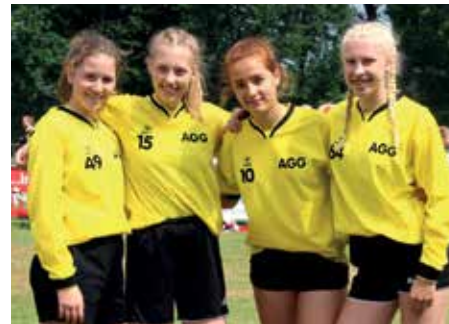
3. Platz - Aue-Geest-Gym. Harsefeld 2