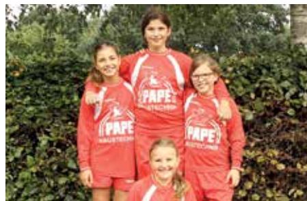
MTSV Selsingen - 5. Platz.