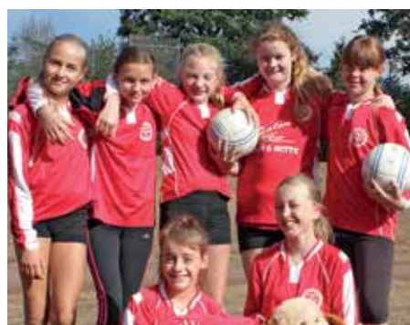
TV Huntlosen - 5. Platz.