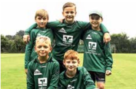
TSV Bardowick - 2. Platz.