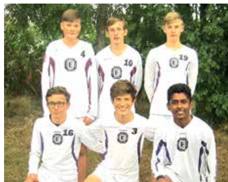
TuS Empelde - 4. Platz.