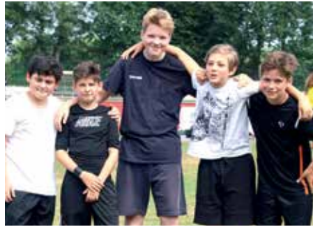
6. Platz - IGS Franzshes Feld BS 6