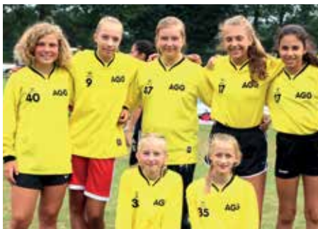
4. Platz - Aue-Geest-Gym. Harsefeld 3