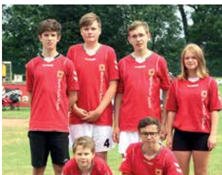
1. Platz - Marie-Curie-Schule Empelde 3