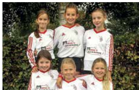
TV Jahn Schneverdingen - 6. Platz.