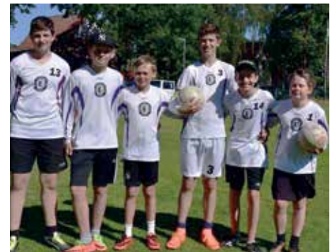
TuS Empelde - 6. Platz.