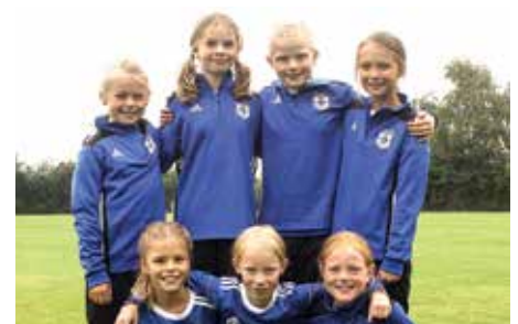
MTV Diepenau - 8. Platz.