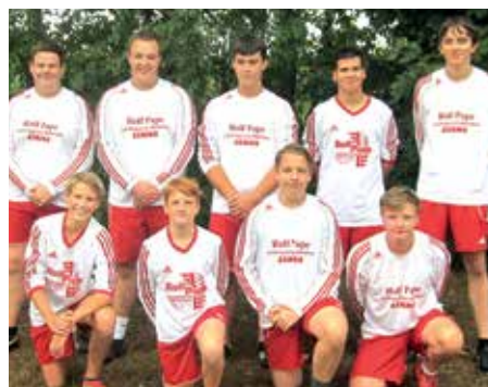
TSV Abbenseth - 5. Platz.