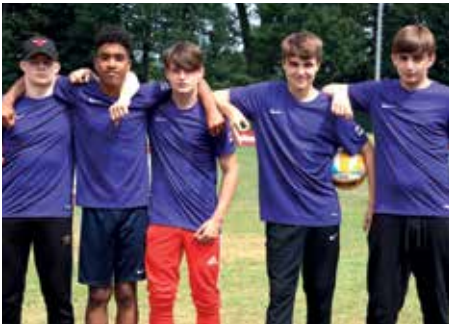
8. Platz - OBS Alexanderstraße Oldenburg