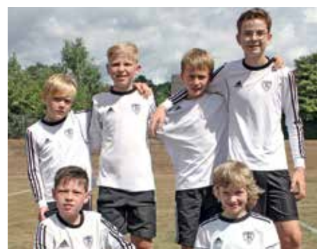
TV Brettorf - 7. Platz.