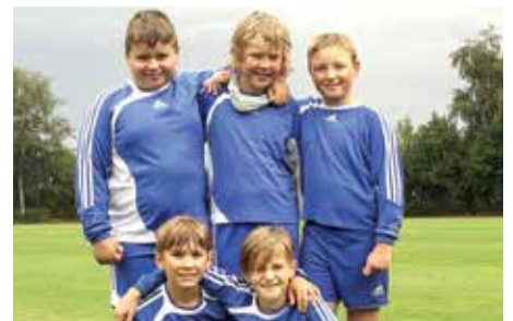
Wardenburger TV - 8. Platz.