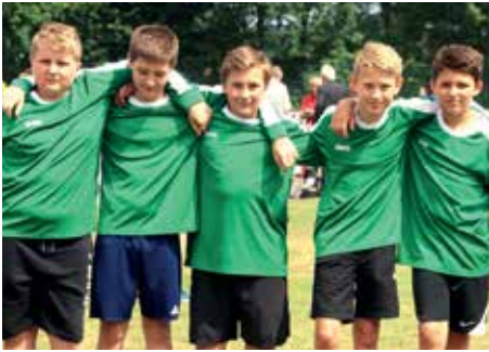
5. Platz - OBS Ahlerstedt 1