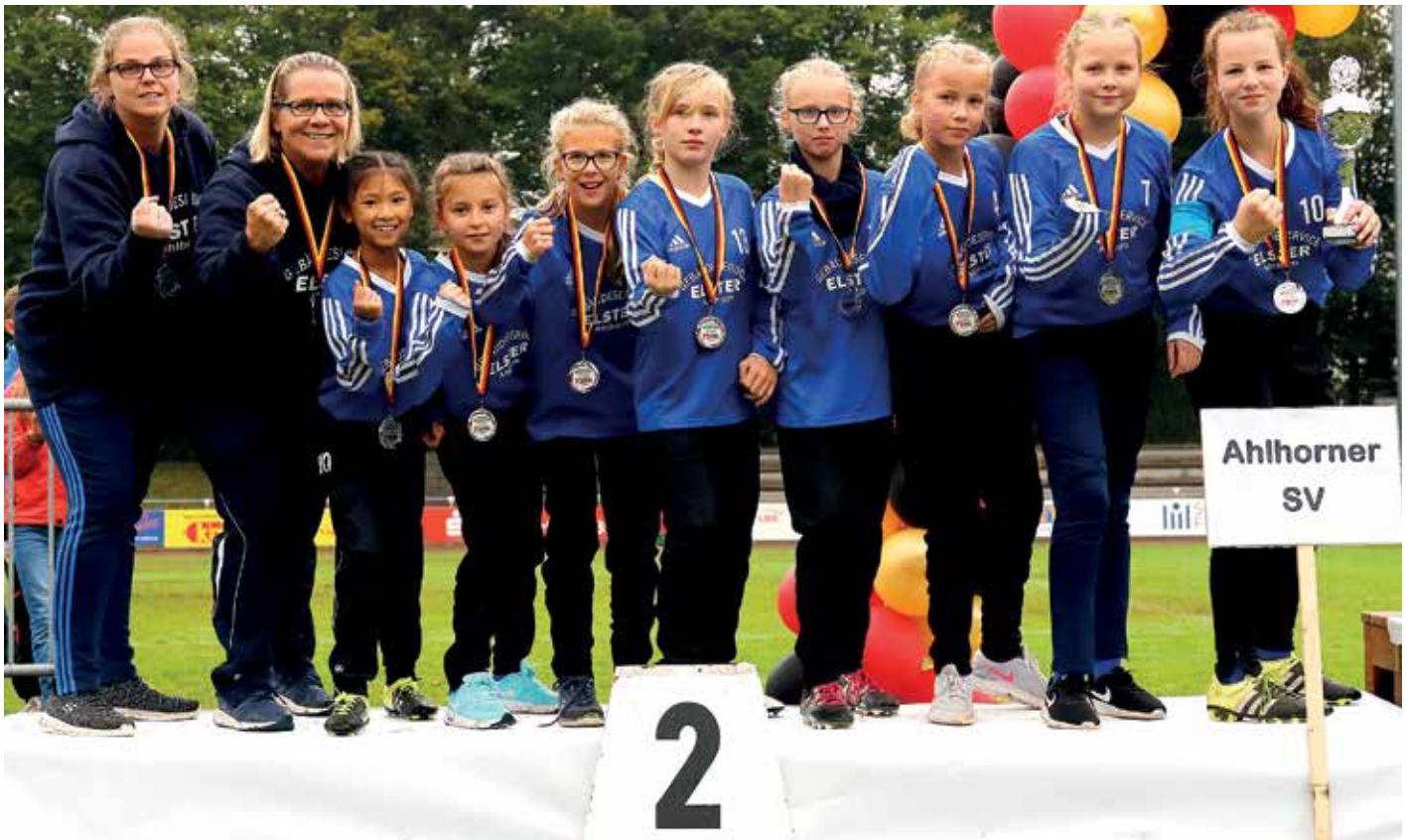
Die Ahlhorner Mädchen freuen sich über den Gewinn der Silbermedaillen.