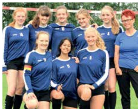
Wardenburger TV - 5. Platz.