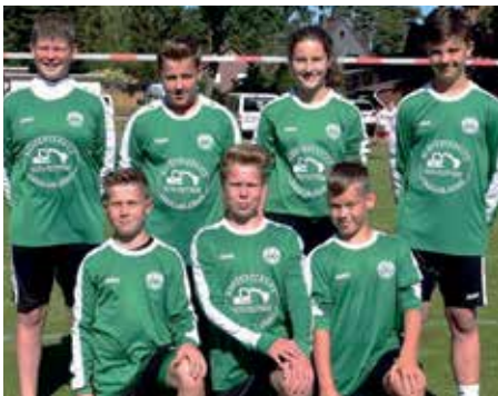
MTV Oldendorf - 2. Platz.