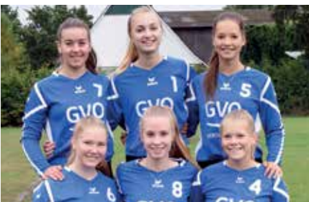
SV Düdenbüttel - 3. Platz.