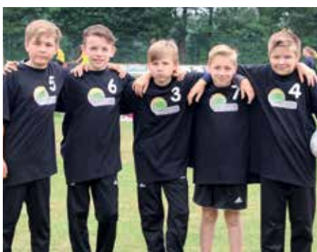
4. Platz - H.-Behnken-Schule Selsingen