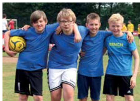
3. Platz - D.-Bonhoeffer-Gym Ahlhorn 3