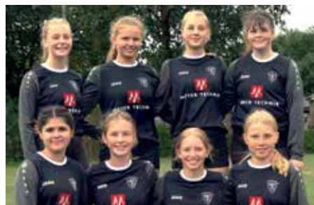
TV Brettorf - 6. Platz.