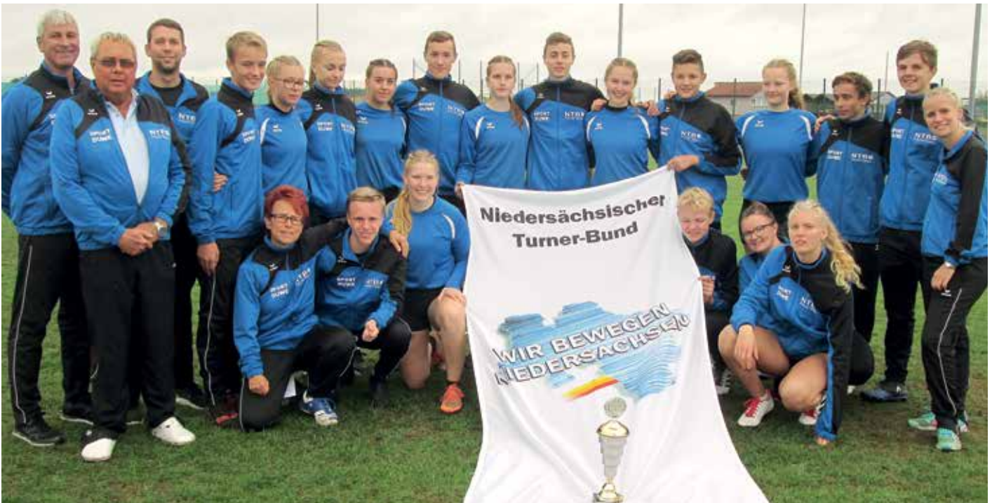
Die NTB Delegation mit dem Pokal der U16-Mädchen.