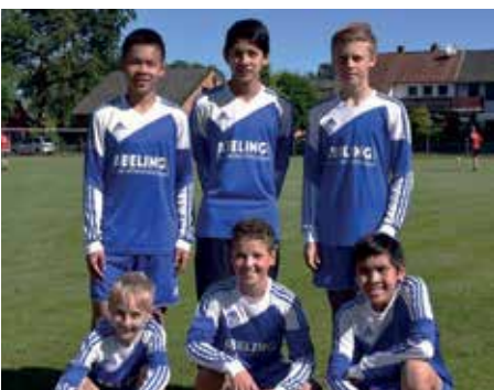
Ahlhorner SV - 3. Platz.