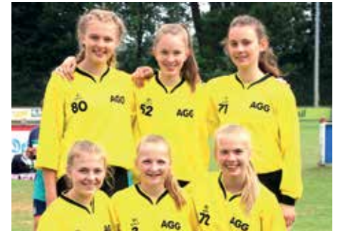
2. Platz - Aue-Geest-Gym. Harsefeld 4