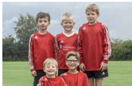
MTV Wangersen - 5. Platz.