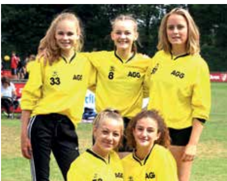
5. Platz - Aue-Geest-Gym. Harsefeld 1