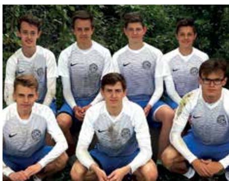
Ahlhorner SV - 2. Platz.