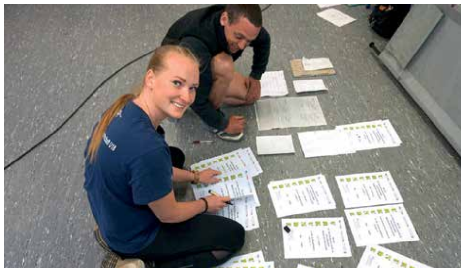
Auswertung vor der Siegerehrung.