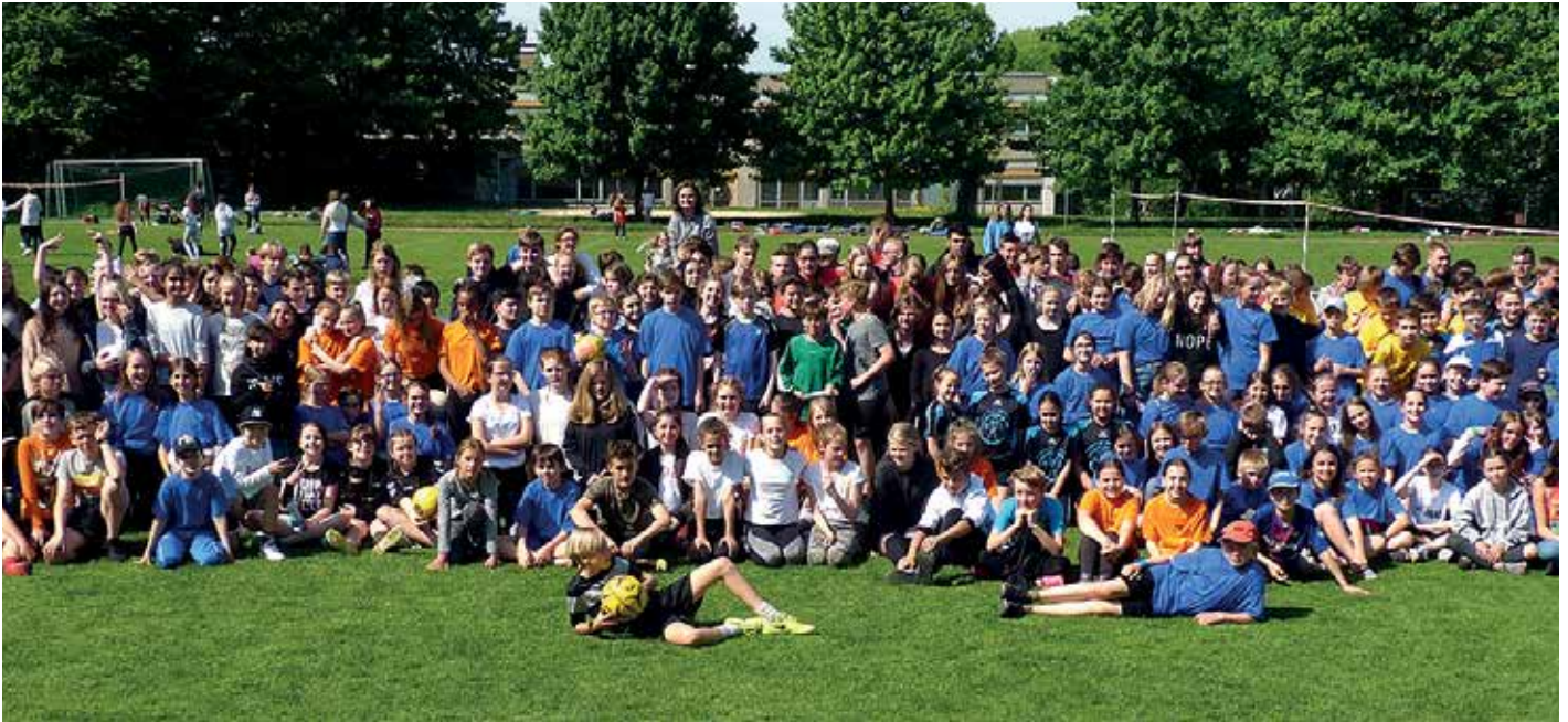
53 Mannschaften machten in Braunschweig mit.