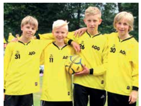
2. Platz - Aue-Geest-Gym. Harsefeld 5