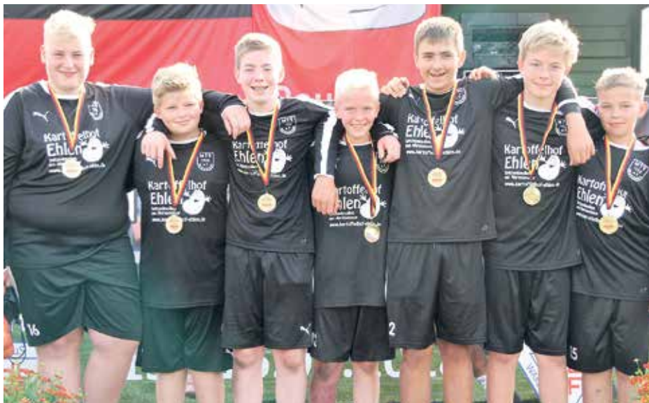
Die Jungs aus Wangersen sind Deutscher Meister.