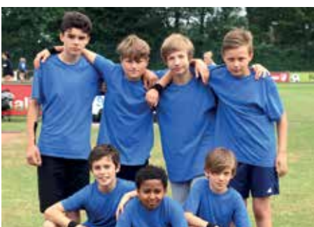
2. Platz - IGS Franzshes Feld BS 5