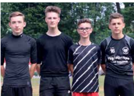
3. Platz - Waldschule Hatten 2