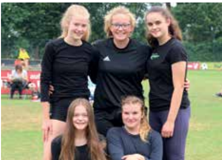
2. Platz - D.-Bonhoeffer-Gym Ahlhorn 2