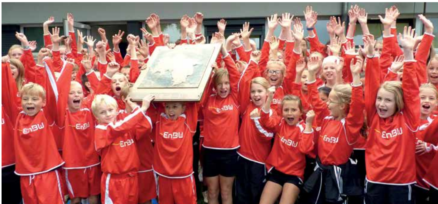
Niedersachsenschild gewonnen: Weser-Ems jubelt.