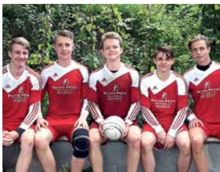
MTSV Selsingen - 3. Platz.