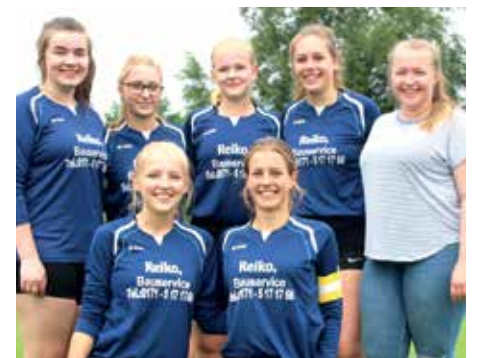
MTV Hammah - 6. Platz.