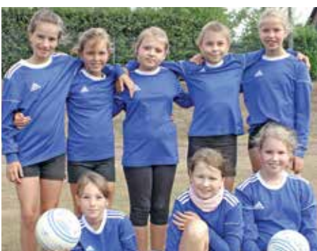
Wardenburger TV - 3. Platz.