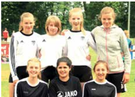
3. Platz - RS Wildeshausen 1