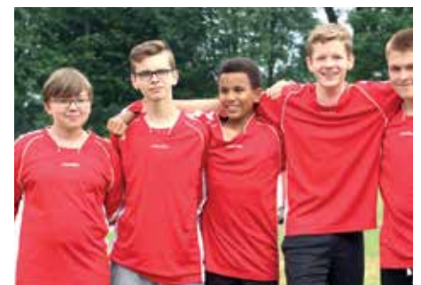
5. Platz - IFS Franzshes Feld BS 2