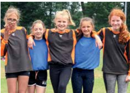
3. Platz - Eschhofschule Lemwerder