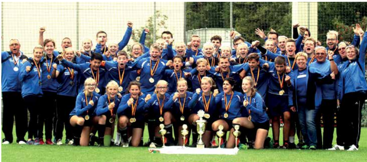
Die Auswahl Niedersachsens hat in allen vier Spielklassen den Titel gewonnen.