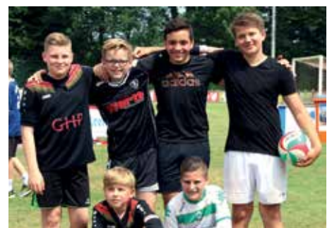
5. Platz - RS Wildeshausen 2