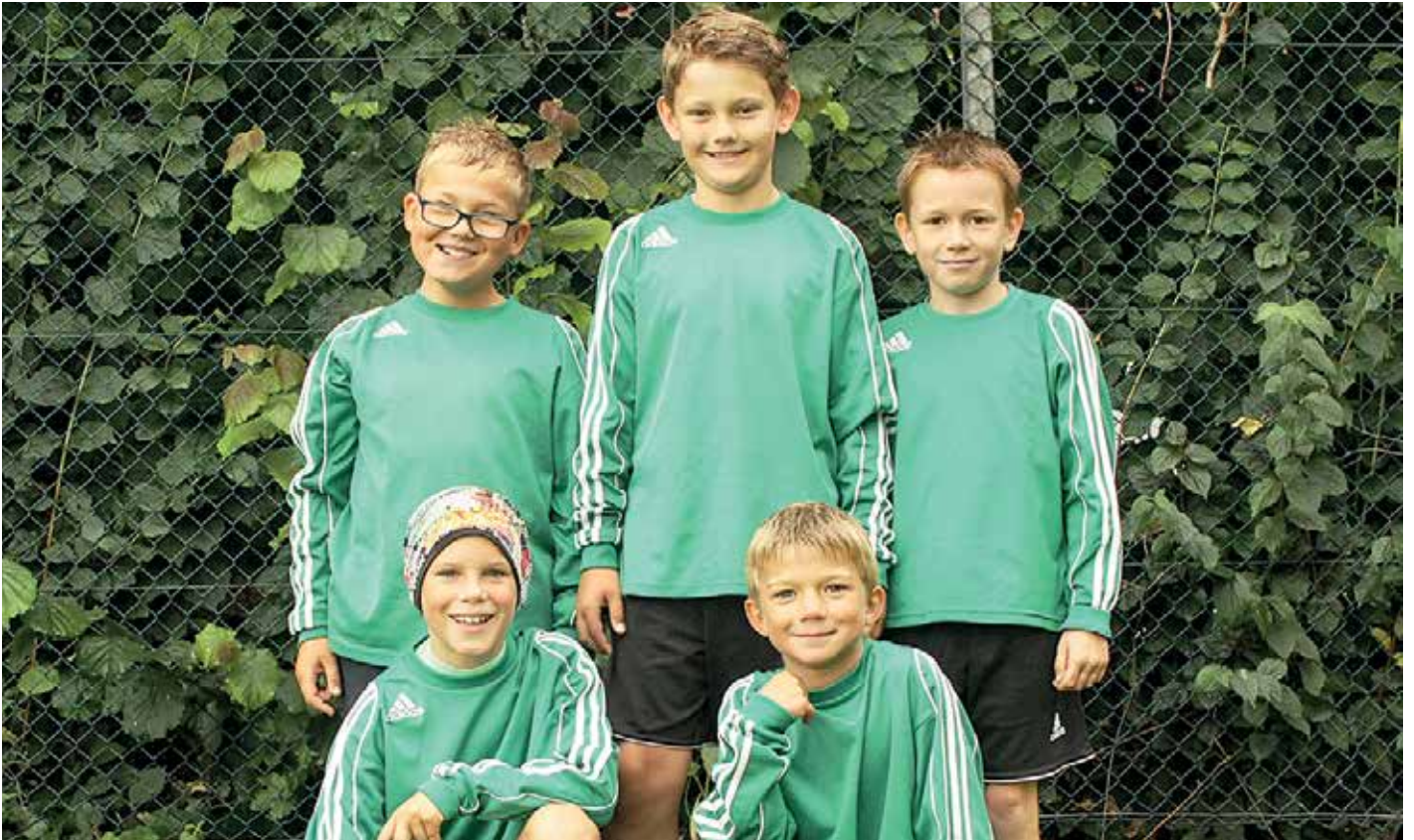
MTV Oldendorf - 1. Platz.