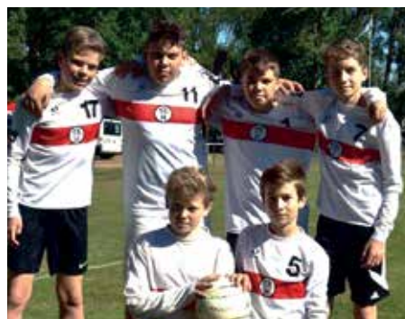
TK Hannover - 5. Platz.