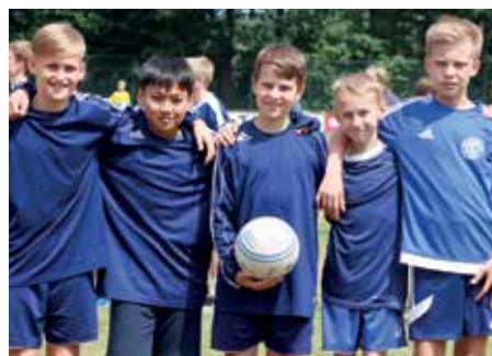
2. Platz - D.-Bonhoeffer-Gym Ahlhorn 6