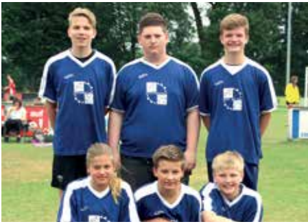
6. Platz - Geestlandsschule Fredenbeck 1