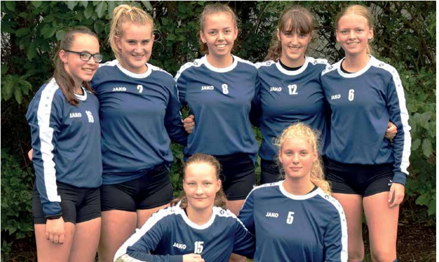
Wardenburger TV - 1. Platz.