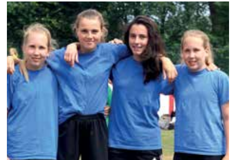
1. Platz - D.-Bonhoeffer-Gym Ahlhorn 1