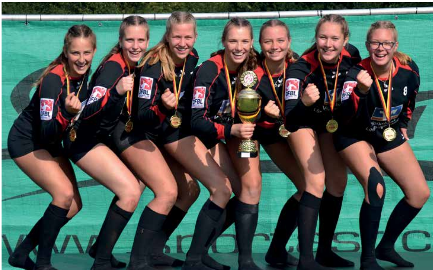
Die Schneverdingen Mädchen freuen sich über den Gewinn der Goldmedaillen.