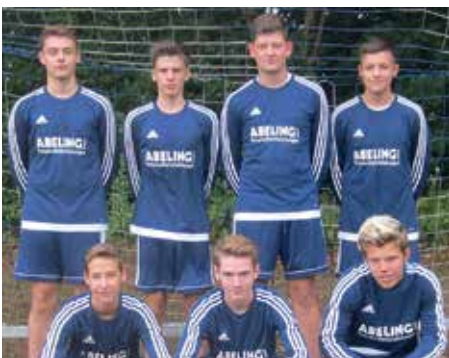
Ahlhorner SV - 2. Platz.