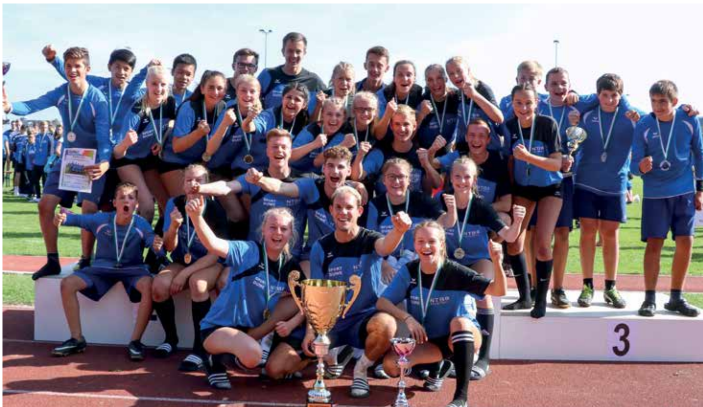
Mehr geht nicht: Der Faustball-Nachwuchs aus Niedersachsen freut sich über die Titelverteidigung.