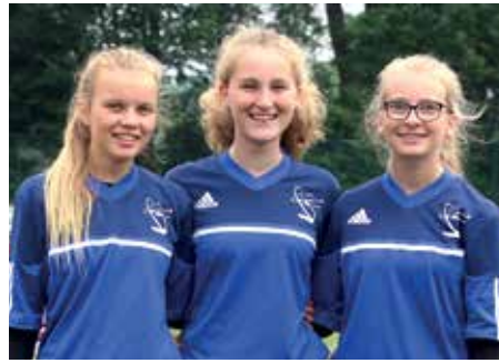
1. Platz - Gymnasium St. Viti Zeven