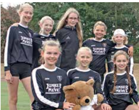
TV Brettorf - 2. Platz.