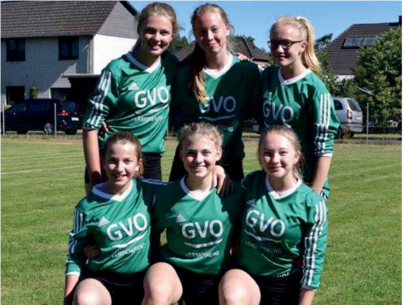
TSV Essel - 1. Platz.