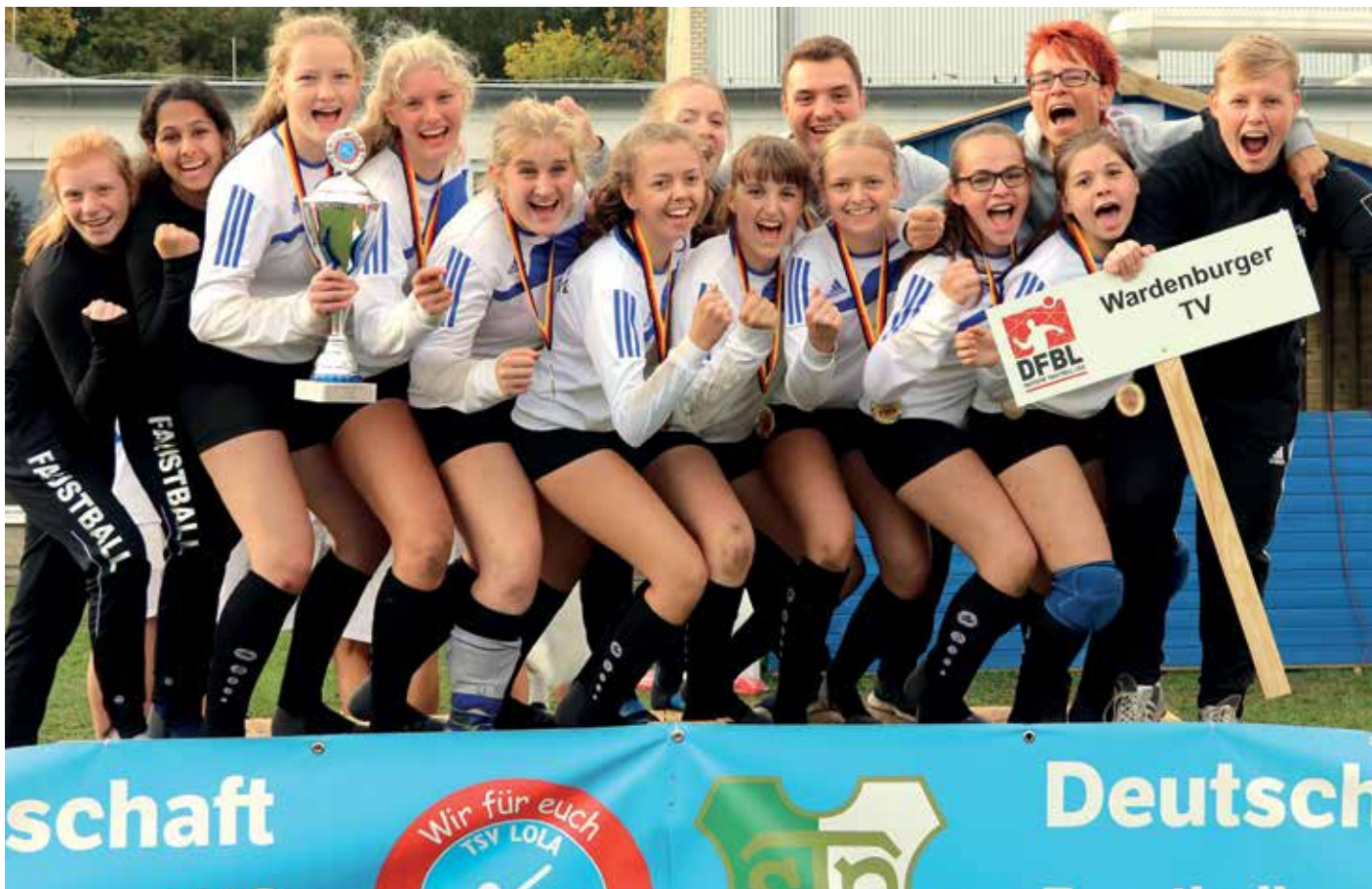
Die Wardenburger Mädchen gewannen alle Spiele. Entsprechend groß war die Freude bei der Siegerehrung.