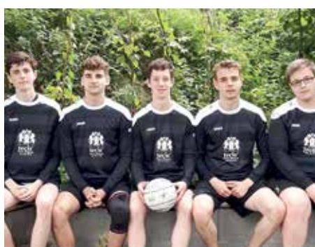
SV Düdenbüttel - 4. Platz.