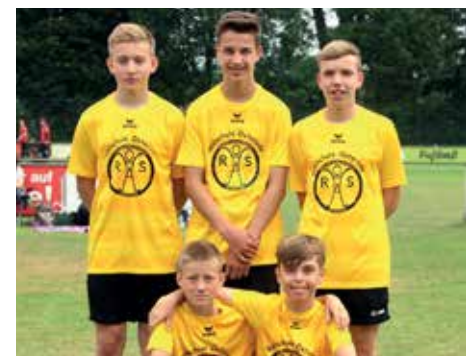
2. Platz - RS am Röddenberg Osterode