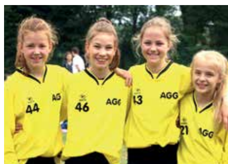
2. Platz - Aue-Geest-Gym. Harsefeld 6