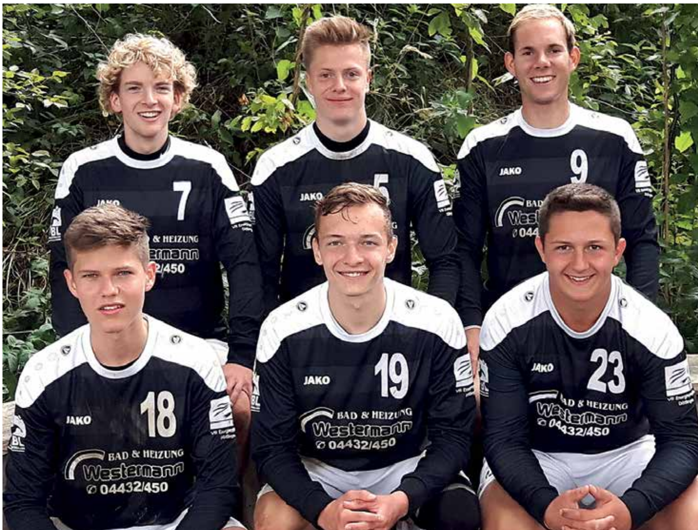
TV Brettorf - 1. Platz.