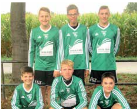
TSV Burgdorf - 3. Platz.