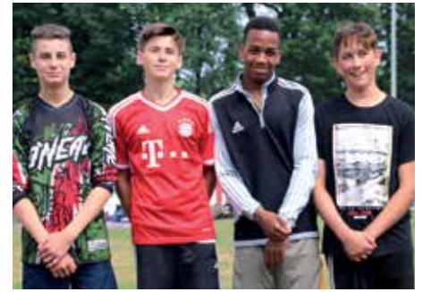
8. Platz - Waldschule Hatten 1