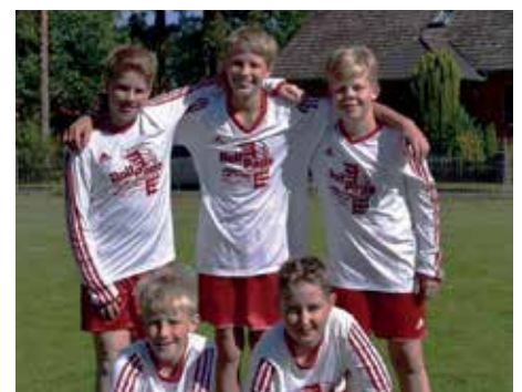
TSV Abbenseth - 7. Platz.