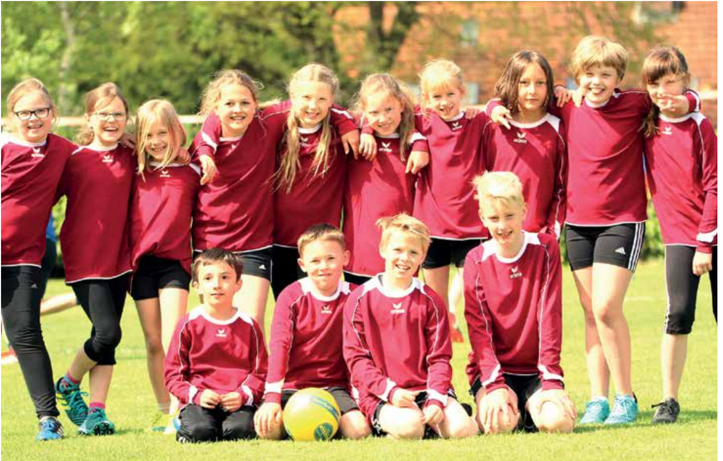
Die Grundschule Ahlerstedt war zahlreich dabei.