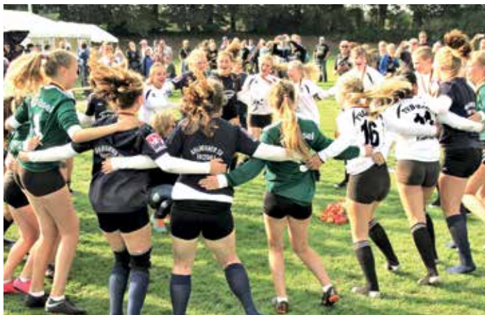
Großer Jubel bei den niedersächsischen Mannschaften.

Brettorf (11:2, 11:7), TSV Gnutz (11:7, 11:7), TV Vaihingen/Enz (11:5, 14:12) und TSV Karlsdorf (11:4, 11:5) durch und machte damit den direkten Halbfinaleinzug perfekt. Hier trafen die Blau-Weißen erneut auf den TV Brettorf. Dieser war als Gruppensieger im Quali-Spiel gegen Biberach gefordert und setzte sich hier 11:6 und 11:8 durch. Das Semifinale der beiden Landkontrahenten war dann gerade im ersten Satz