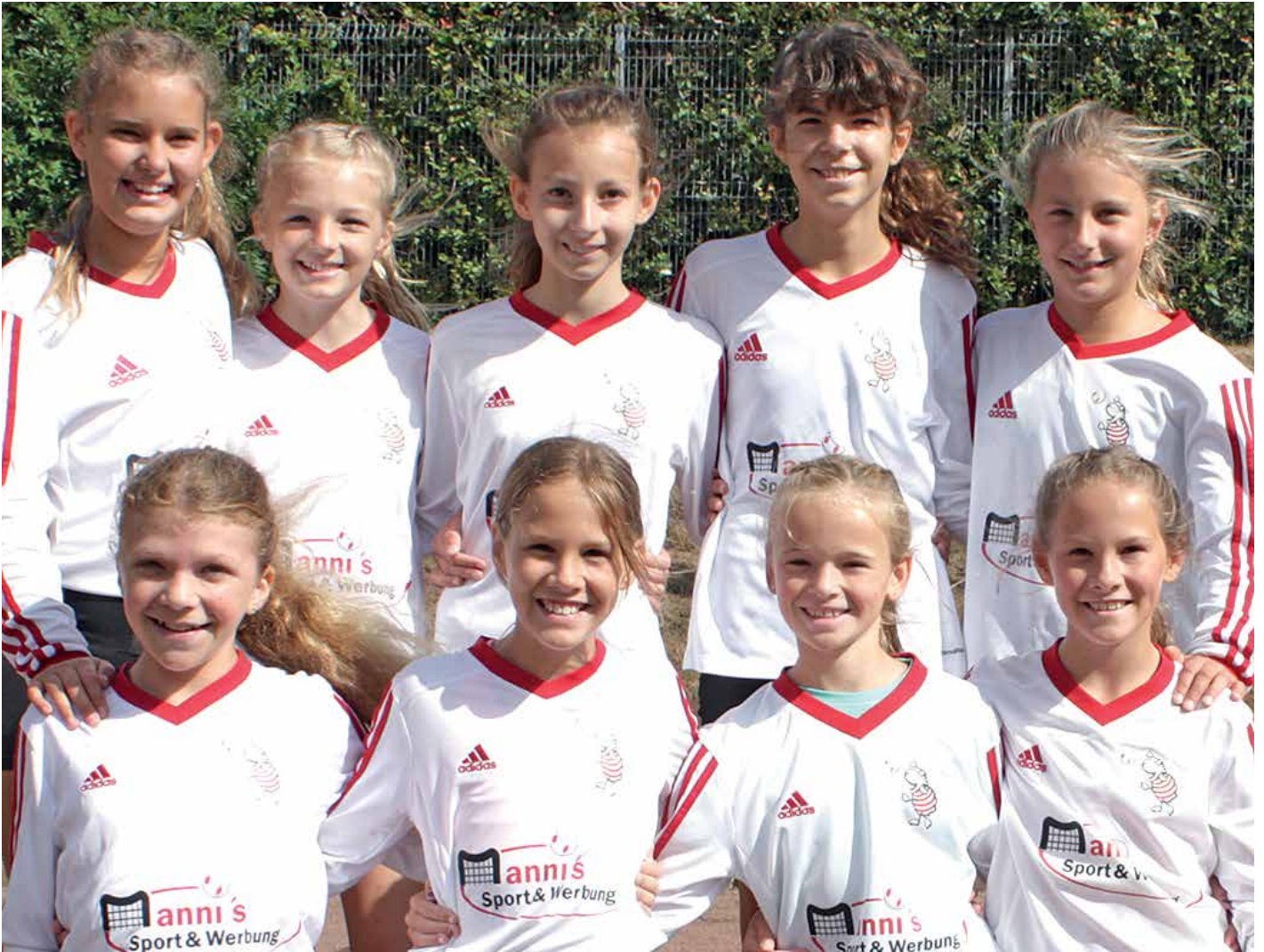
TV Jahn Schneverdingen - 1. Platz.