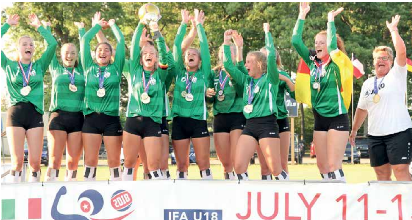
Die U18-Nationamannschaft feiert den Gewinn der Goldmedaille.