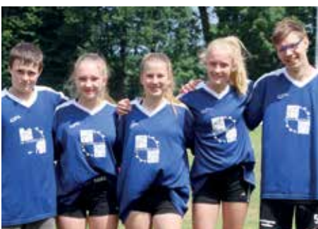
3. Platz - Geestlandschule Fredenbeck 2