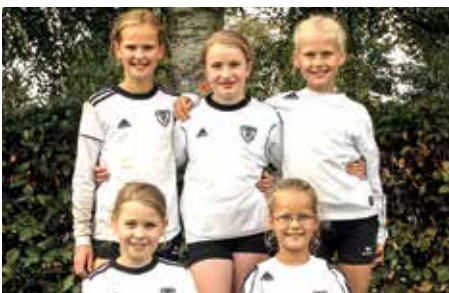
TV Brettorf - 3. Platz.