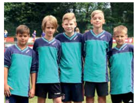
1. Platz - Herderschule Lüneburg 2