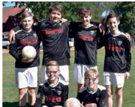
TV Brettorf - 4. Platz.