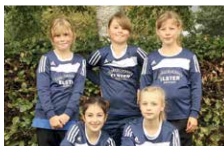
Ahlhorner SV 2 - 7. Platz.