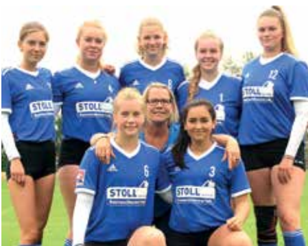
Ahlhorner SV - 2. Platz.