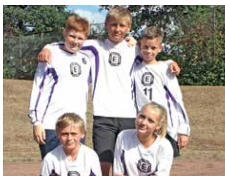
TuS Empelde - 3. Platz.