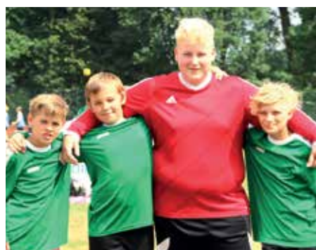
5. Platz - OBS Ahlerstedt 2