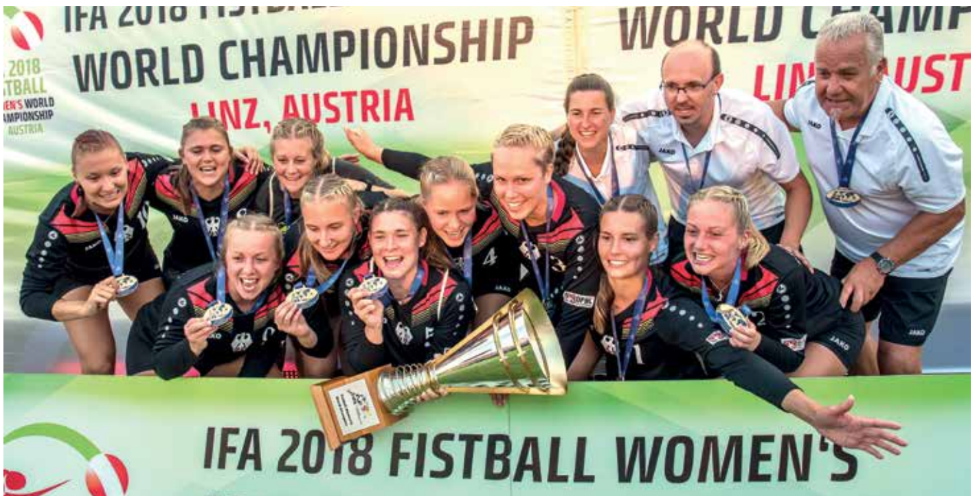
Sie sind wieder Weltmeister: die deutschen Faustball-Frauen.