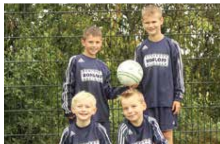
Ahlhorner SV - 6. Platz.