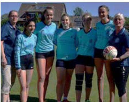
Ahlhorner SV - 2. Platz.