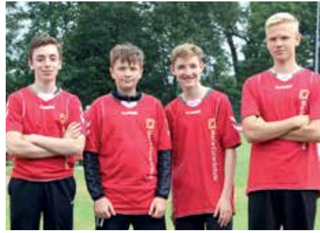
7. Platz - Marie-Curie-Schule Empelde 2