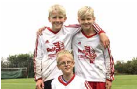
TSV Abbenseth - 4. Platz.