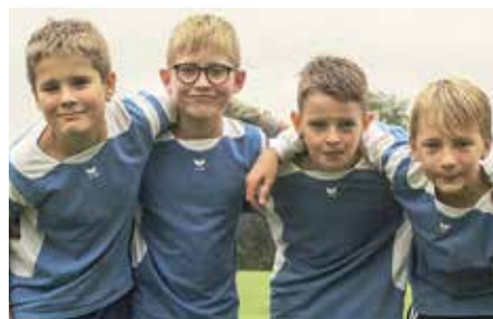
SV Düdenbüttel - 7. Platz.