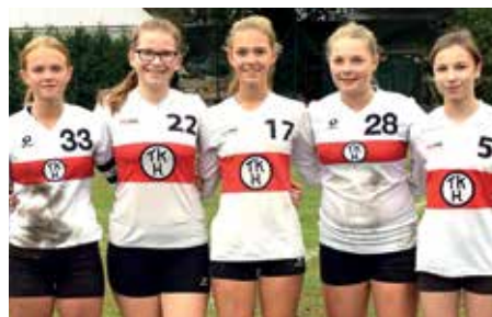
TK Hannover - 7. Platz.