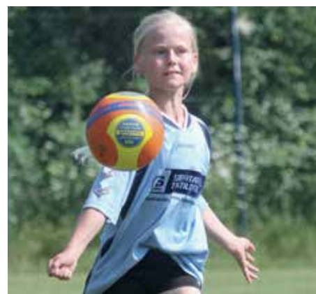
Gute Technik: Dieser Nachwuchs spielt schon im Verein.