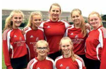
MTSV Selsingen - 5. Platz.