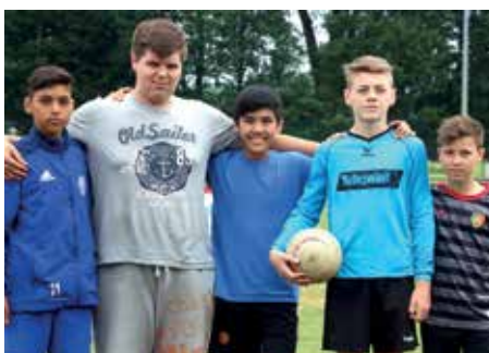
4. Platz - D.-Bonhoeffer-Gym. Ahlhorn 5