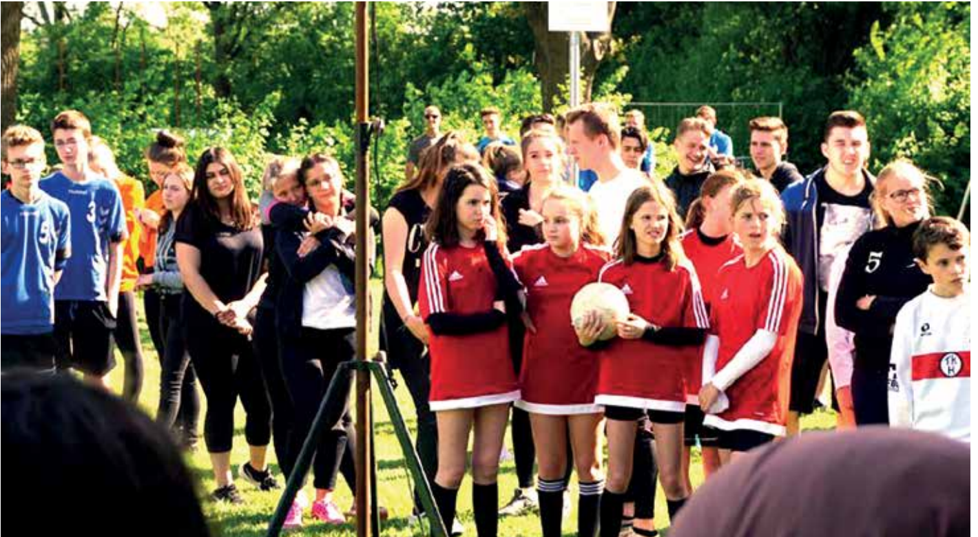
Die Marie Curie Schule in Empelde richtet zum ersten Mal die Schulfaustball Bezirksmeisterschaft aus.