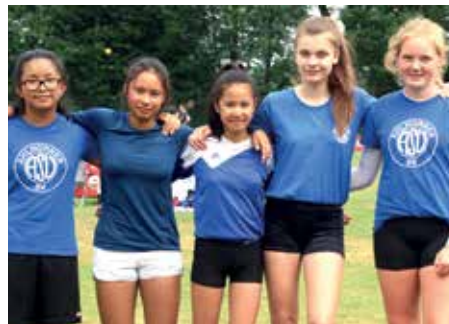
4. Platz - D.-Bonhoeffer-Gym. Ahlhorn 4