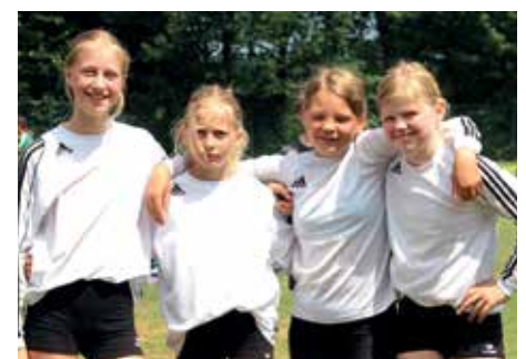
3. Platz - RS Wildeshausen 3