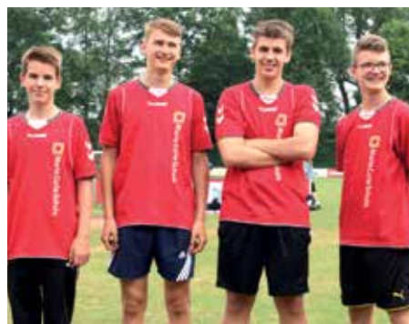
1. Platz - Marie-Curie-Schule Empelde 1