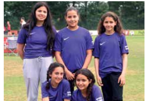
2. Platz - OBS Alexanderstr. Oldenburg 2