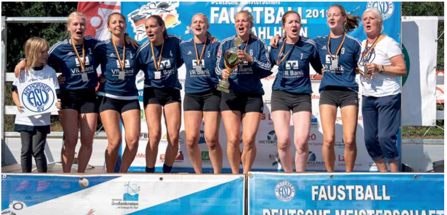
Die Ahlhorner Frauen feiern den Gewinn der Silbermedaille.