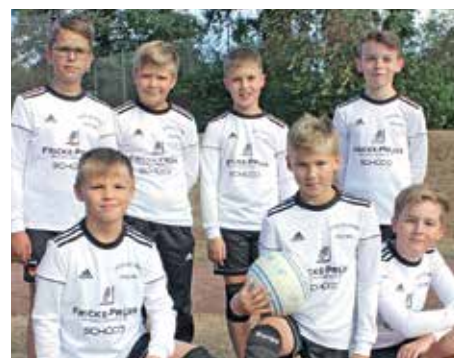
MTSV Selsingen - 6. Platz.