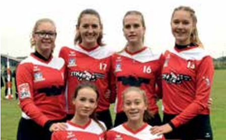
TV Jahn Schneverdingen - 4. Platz.