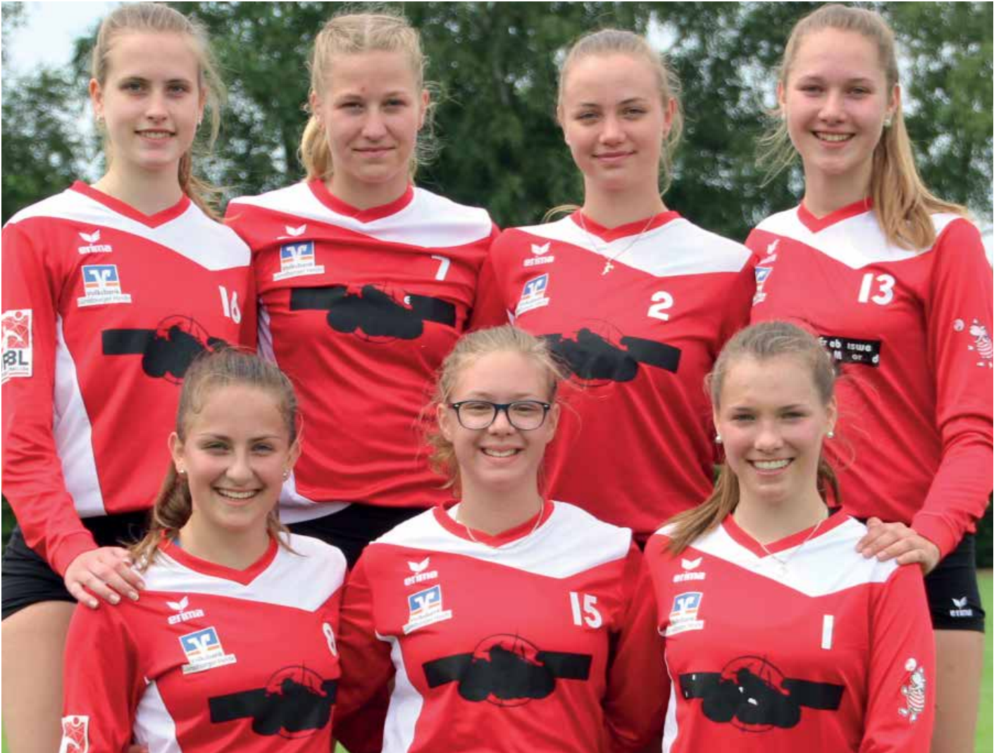
TV Jahn Schneverdingen - 1. Platz.