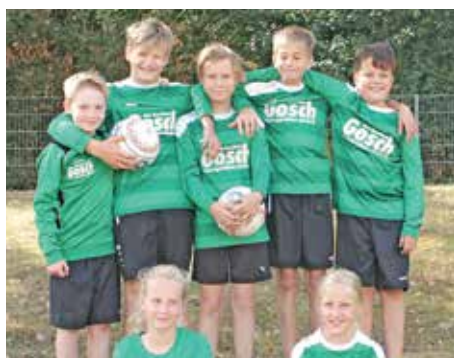
TuS Bothfeld 04 - 2. Platz.