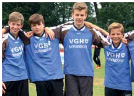
4. Platz - Herderschule Lüneburg 1