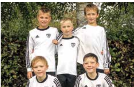
TV Brettorf - 3. Platz.