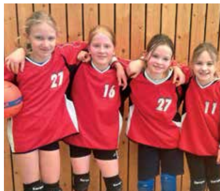
TV Huntlosen - 4. Platz.