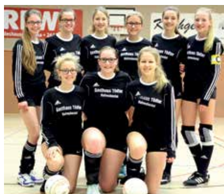
MTV Wangersen - 5. Platz.