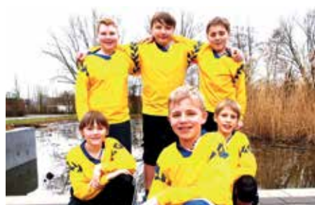
SV Armstorf - 7. Platz.