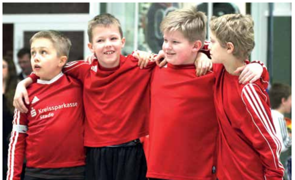
Wangersens Jungs bei der U12.