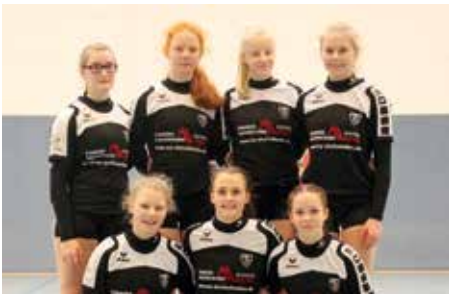
TV GH Brettorf - 2. Platz.