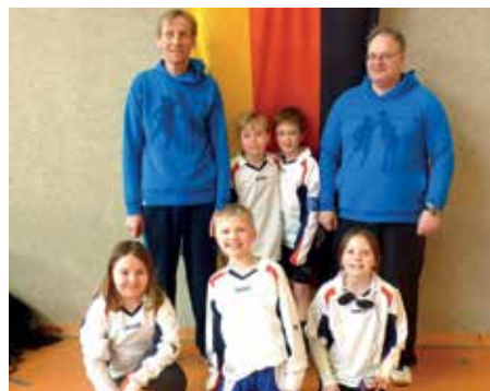
SCE Gliesmarode - 4. Platz.