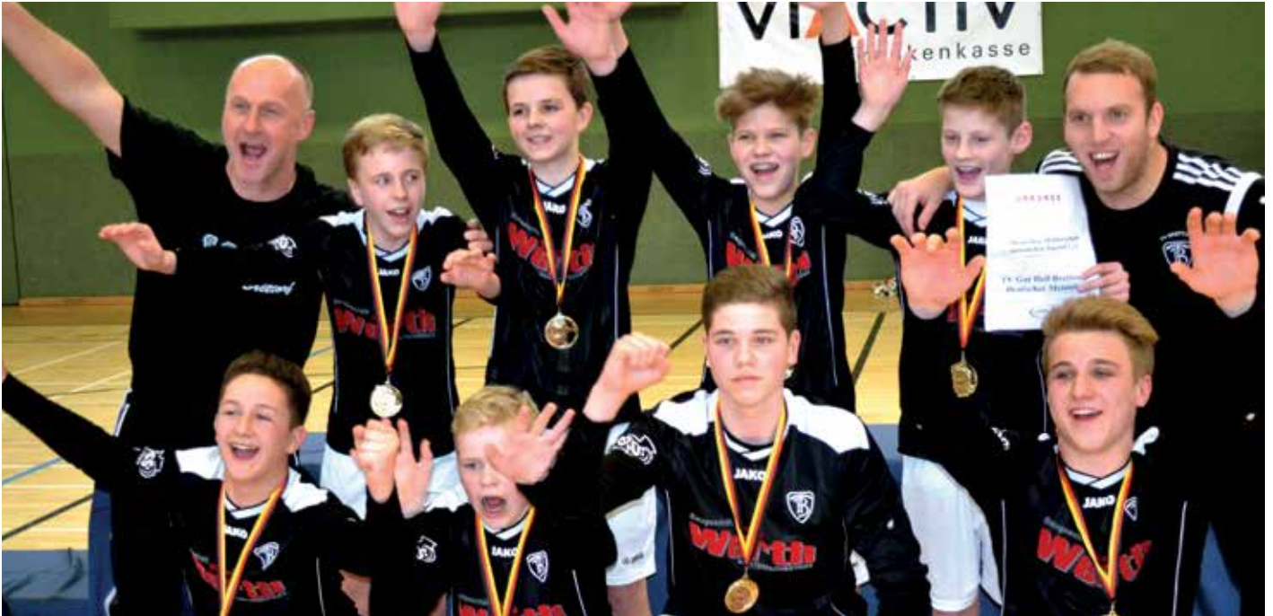
Das Brettortor Team freut sich riesig über den Gewinn der Goldmedaillen.