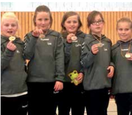
TSV Bardowick - 2. Platz.