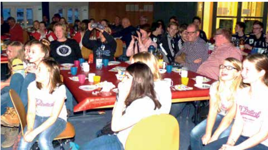
Die Aula der IGS Franzshes Feld war bis auf den letzten Platz gefüllt.