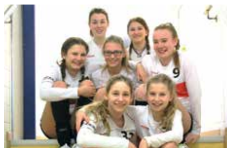
TK Hannover - 7. Platz.