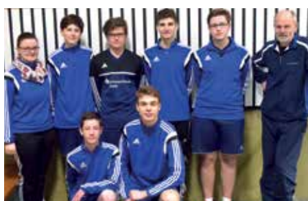
SV Düdenbüttel - 7. Platz.