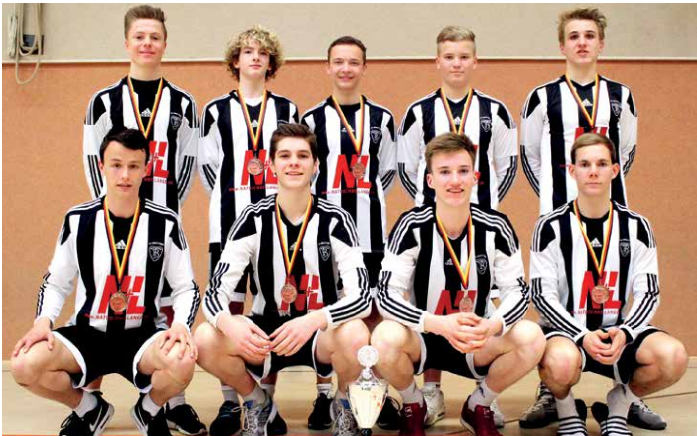
Die Brettorfer haben in Ahlhorn die Bronze-Medaille gewonnen.