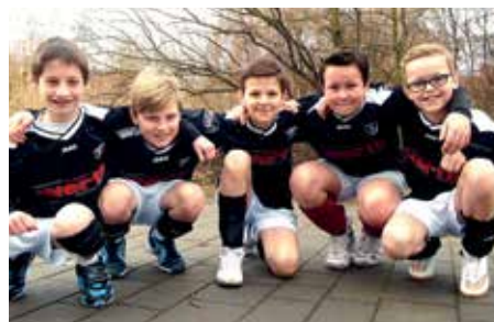
TV GH Brettorf - 6. Platz.