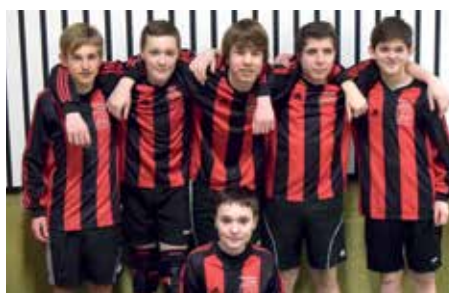
TuS Essenrode - 6. Platz.