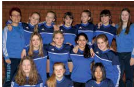
Wardenburger TV - 5. Platz.