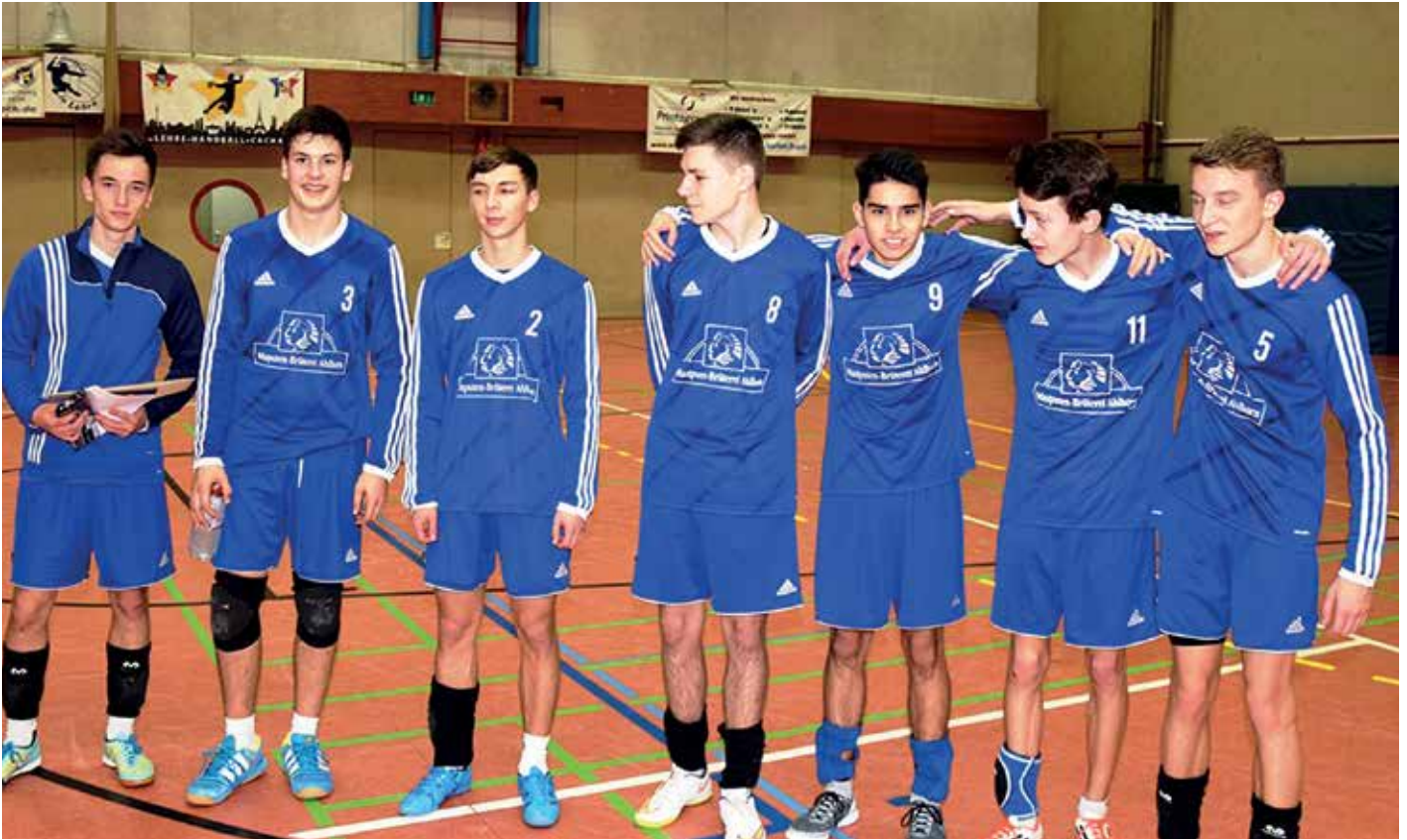
Ahlhorner SV - 1. Platz.