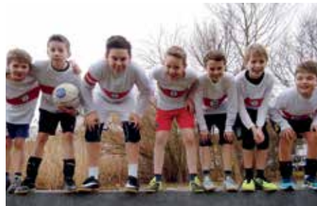
TK Hannover - 5. Platz.