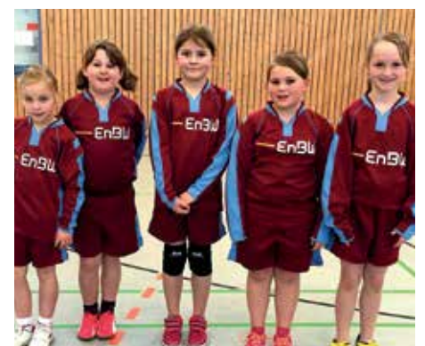
MTV Diepenau - 8. Platz.