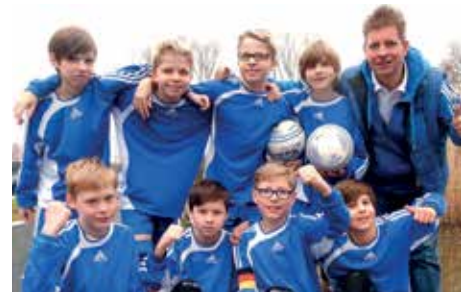
Wardenburger TV - 7. Platz.