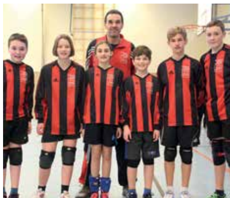
TuS Essenrode - 5. Platz.