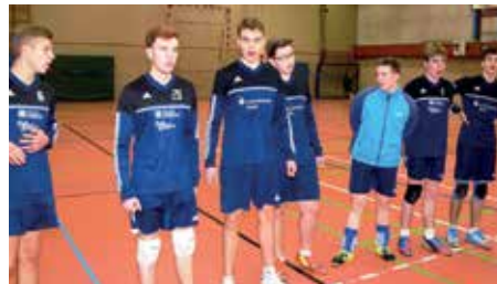
SV Düdenbüttel - 5. Platz.