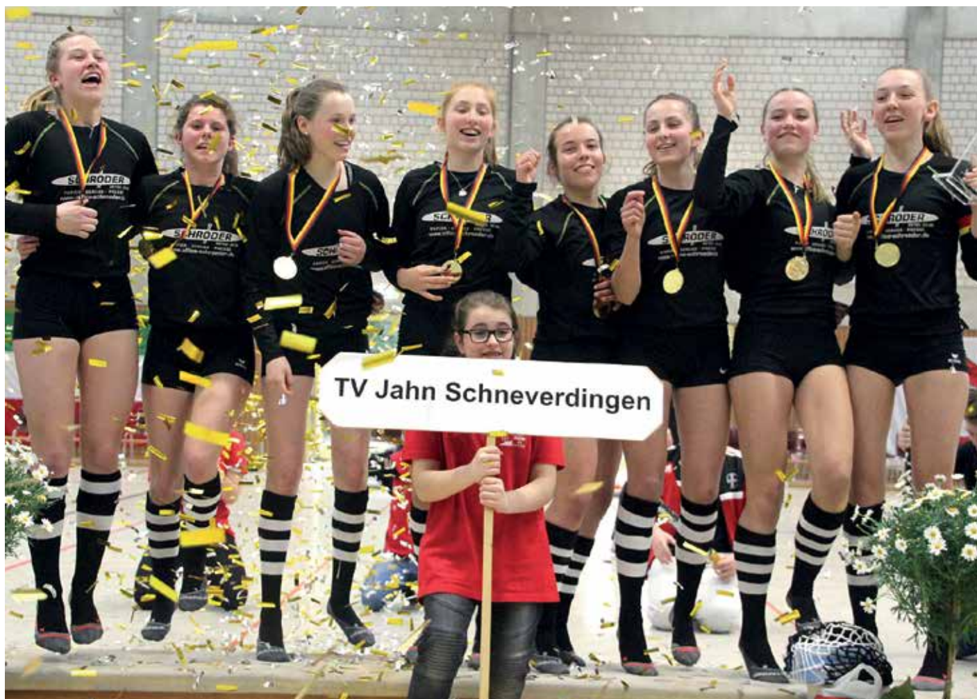
Schneverdingen feiert im Goldregen die gerade gewonnene Deutsche Meisterschaft.