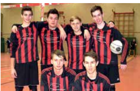
TuS Essenrode - 4. Platz.