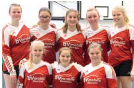
MTSV Selsingen - 5. Platz.