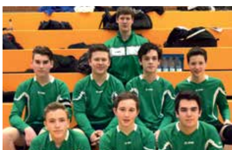
TuS Bothfeld - 4. Platz.