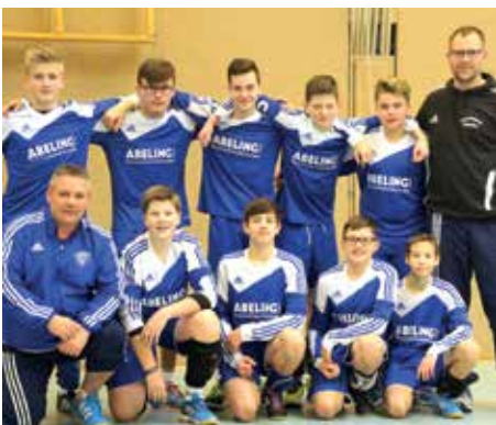
Ahlhorner SV - 3. Platz.