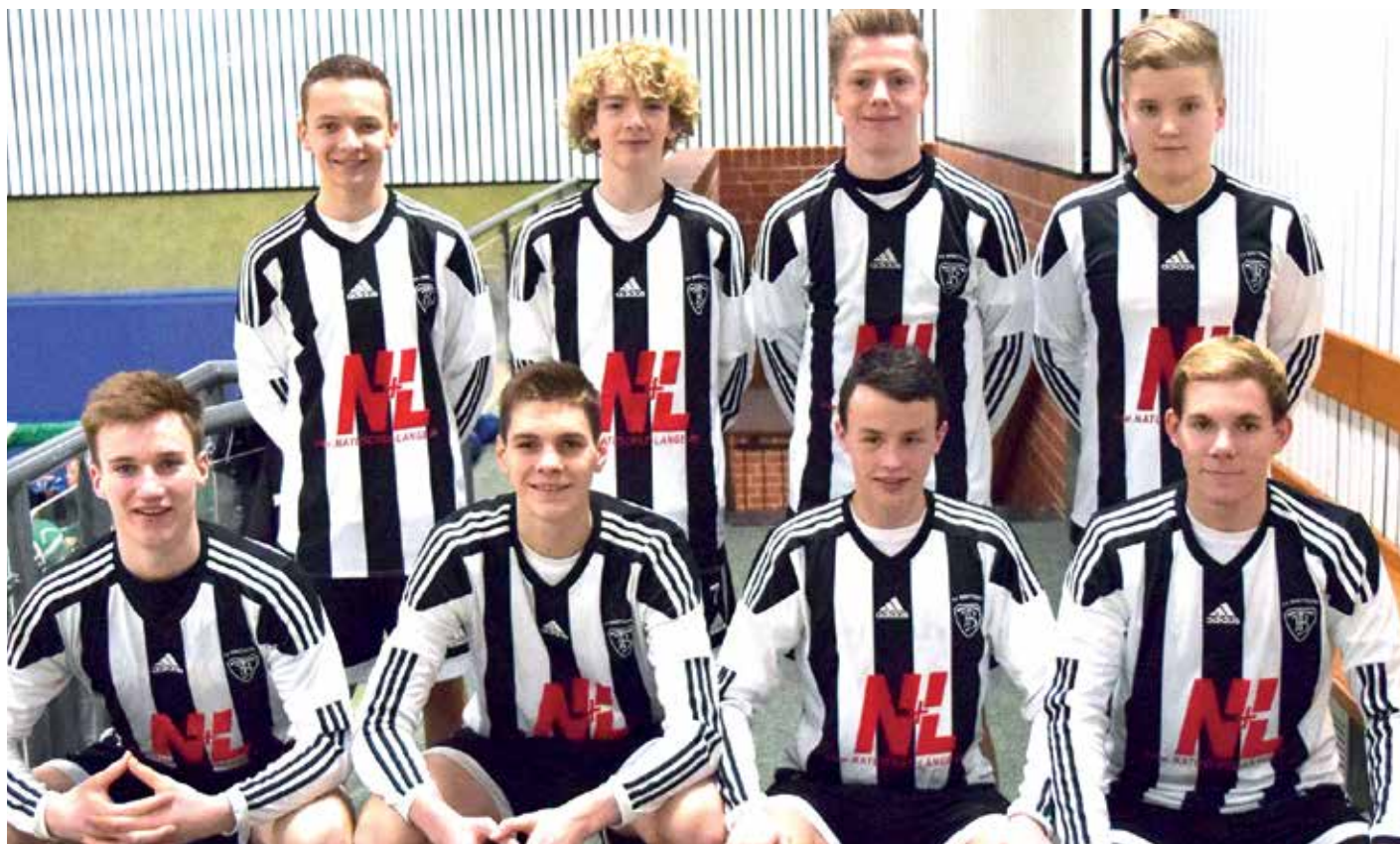
TV GH Brettorf - 1. Platz.