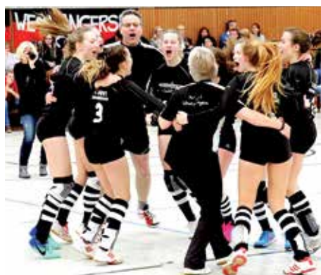
Finale gewonnen: Schneverdingen jubelt über den Titel gewinn.

Am Sonntag ging es im Halbfinale gegen den TSV Gärtringen, der zuvor sein Qualifikationsspiel gegen Herrnhahlthann sicher mit 2:0 gewann. Die Schwaben erwiesen sich als der erwartete starke Gegner. Im ersten Satz kamen die Jahnlerinnen nicht in Fahrt und muss-