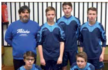
SV BE Steimbke - 5. Platz.