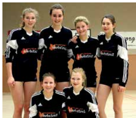
TSV Essel - 4. Platz.