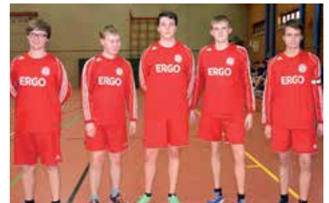
TuS Huntlosen - 7. Platz.