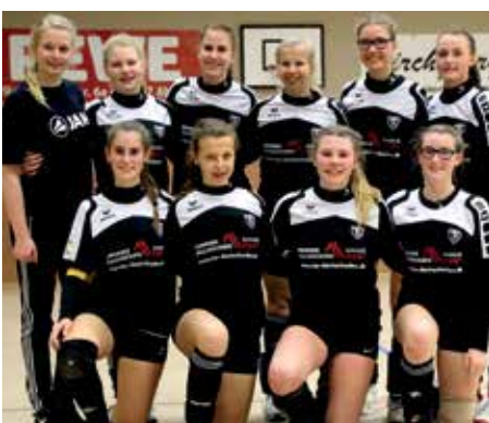
TV GH Brettorf - 3. Platz.