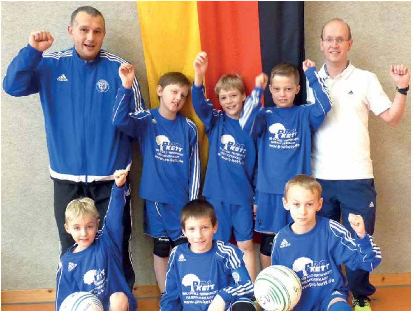
Ahlhorner SV - 1. Platz.