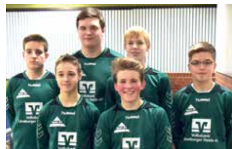
TSV Bardowick - 8. Platz.