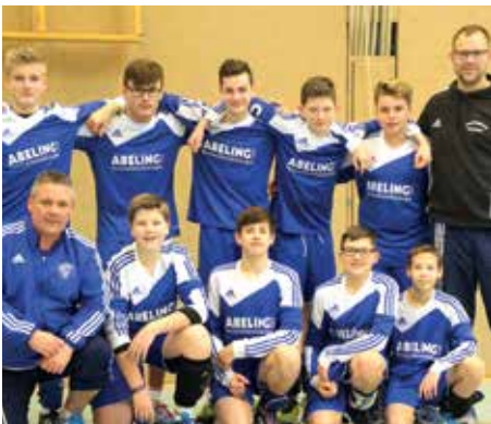
TuS Empelde - 2. Platz.