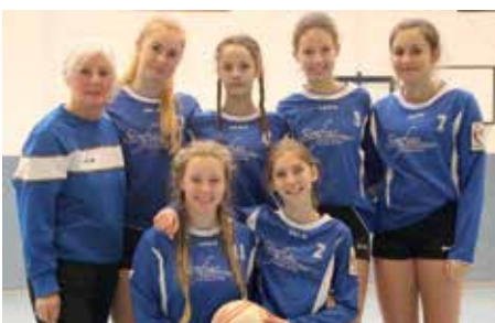
Ahlhorner SV - 4. Platz.