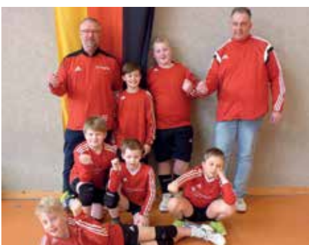
MTV Wangersen - 3. Platz.