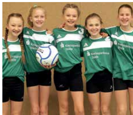
TSV Essel - 5. Platz.