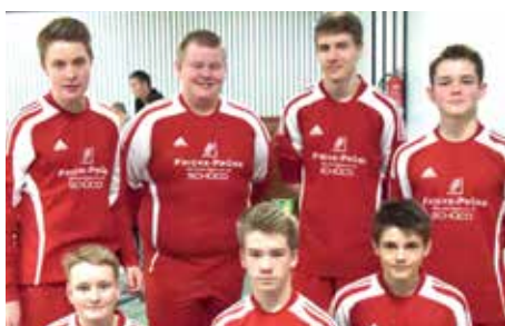
MTSV Selsingen - 3. Platz.