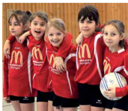
TVJ Schneverdingen - 6. Platz.