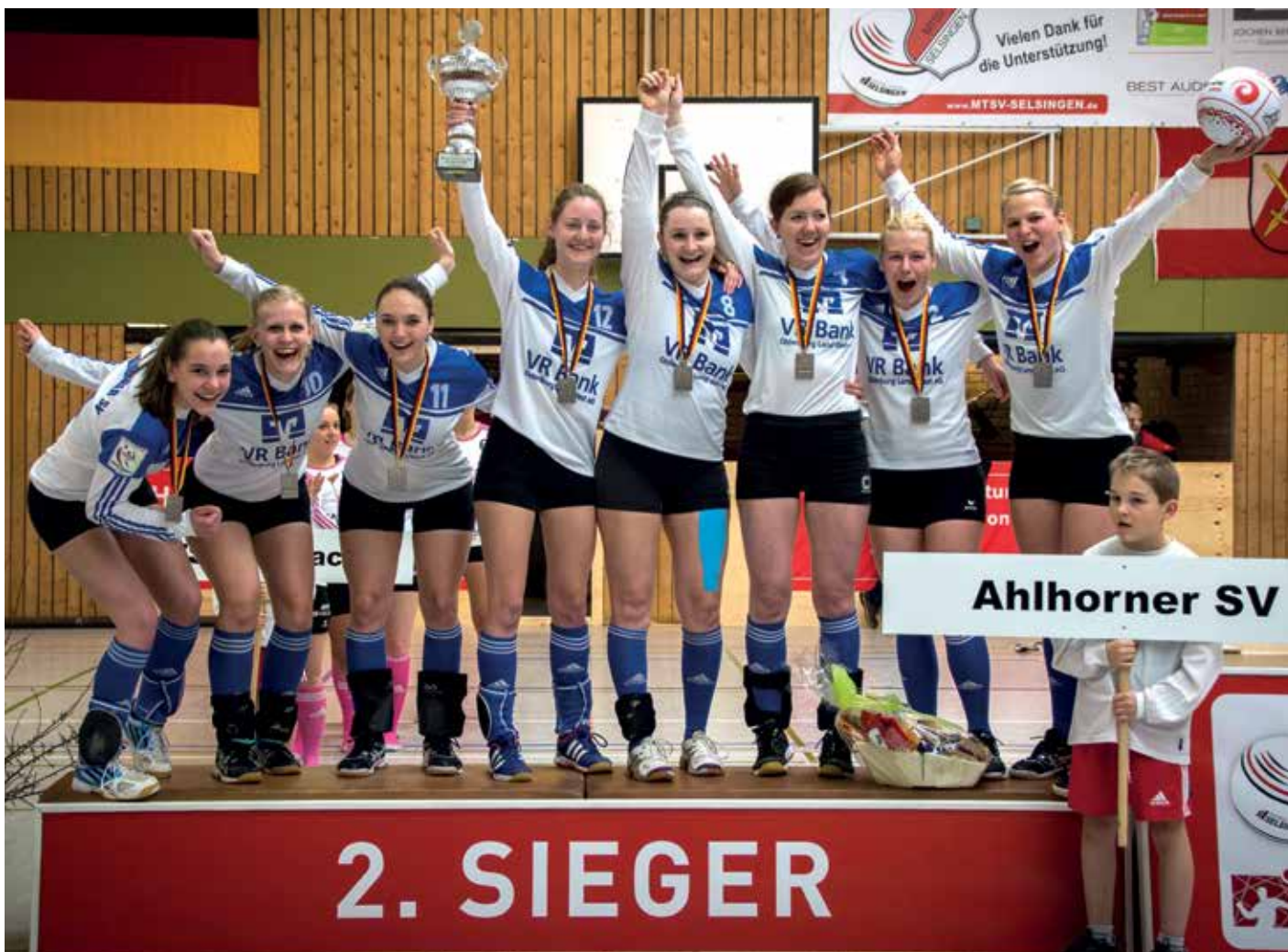
Ahlhorns Frauen haben überraschend die Silbermedaillen gewonnen.