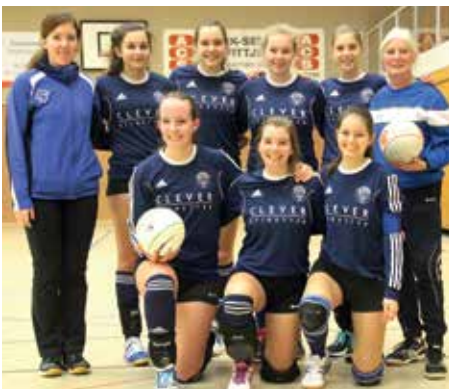
Ahlhorner SV - 2. Platz.