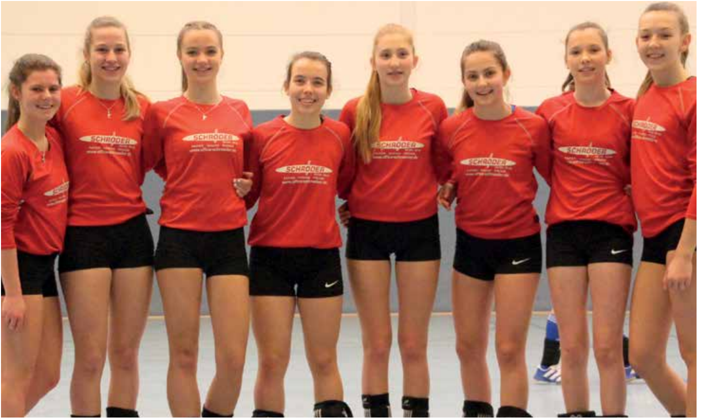
TV Jahn Schneverdingen - 1. Platz.