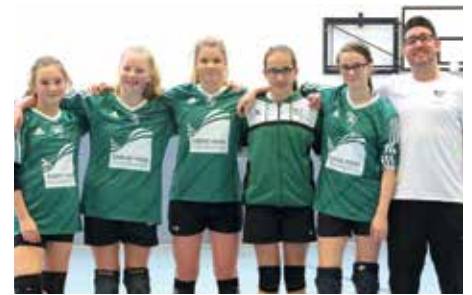
TSV Burgdorf - 7. Platz.