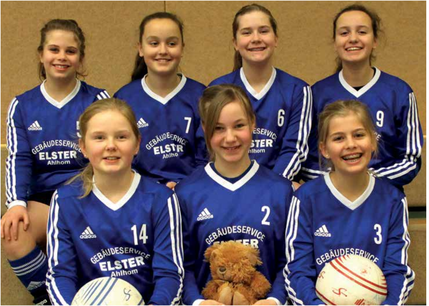
Ahlhorner SV - 1. Platz.