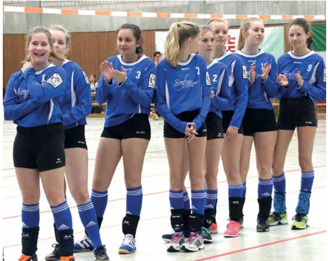
Das Ahlhorner Team überraschte mit einem guten vierten Platz.