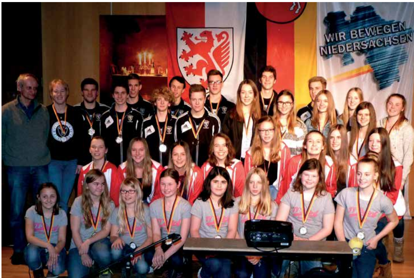
Die nomierten Spielerinnen und Spieler für den Titel Mannschaft des Jahres 2015 auf einem Blick.