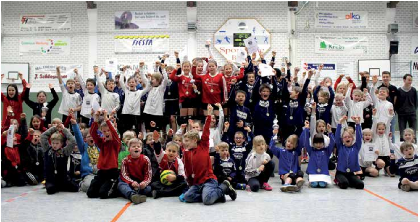
Große Siegerehrung für die Kleinen beim Brettorfer Mini-Masters.