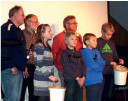
Die Ausrichter von der SCE Gliesmarode stellten sich dem Publikum vor.