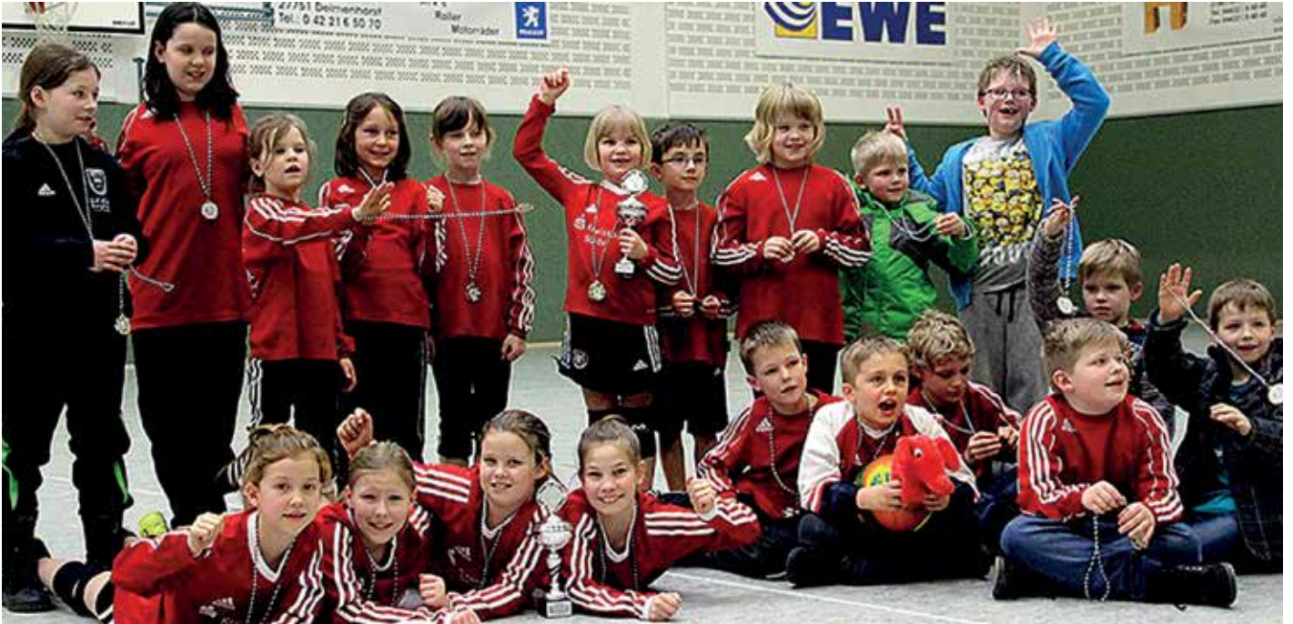
Wangersen war mit einem großen Aufgebot vertreten.