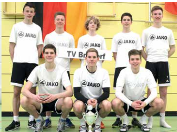
Die U18-Jungs aus Ahlhorn (links) und Brettorf wurden Vierter und Fünfter.