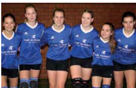
SV Düdenbüttel - 4. Platz.