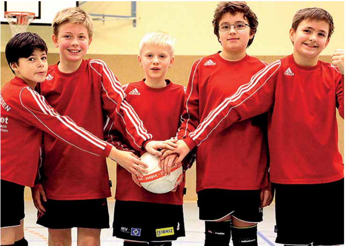
Die U12-Jungen sind in dieser Hallensaison ohne Punktverlust Bezirksmeister geworden.