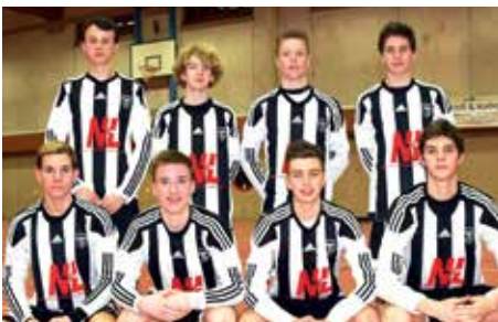
TV GH Brettorf - 2. Platz.