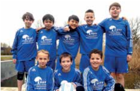
Ahlhorner SV - 2. Platz.