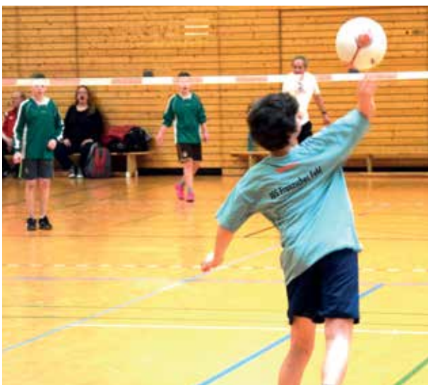
Mit vier Mannschaften war die Faustball-AG der IGS Franzsches Feld Gast in eigenen Halle.