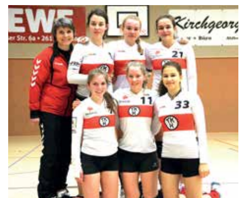
TK Hannover - 7. Platz.