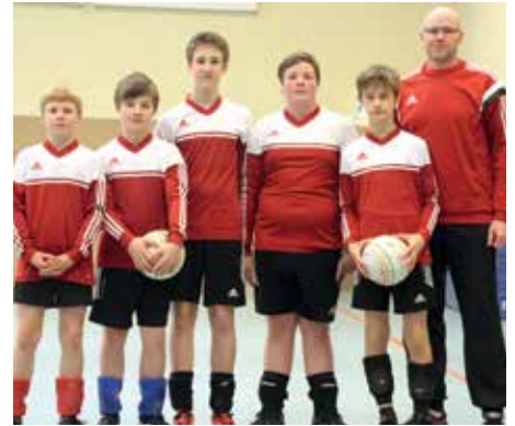
SV Moslesfehn - 6. Platz.