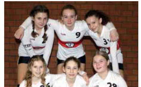
TK Hannover - 7. Platz.