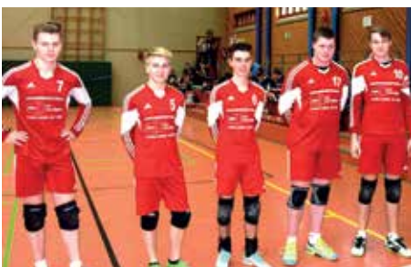
SV Moslesfehn - 3. Platz.