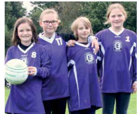
TuS Empelde - 7. Platz.