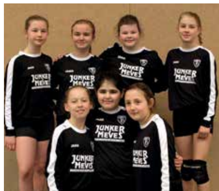
TV GH Brettorf - 4. Platz.