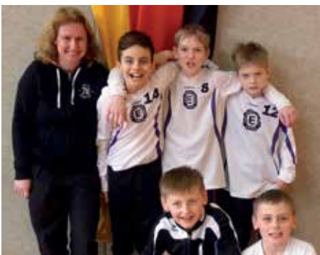
TuS Empelde - 2. Platz.