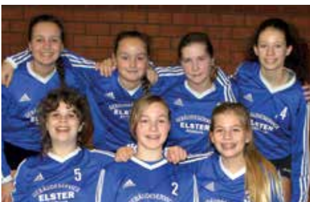
Ahlhorner SV - 3. Platz.