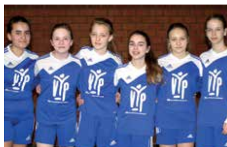
MTV Diepenau - 7. Platz.