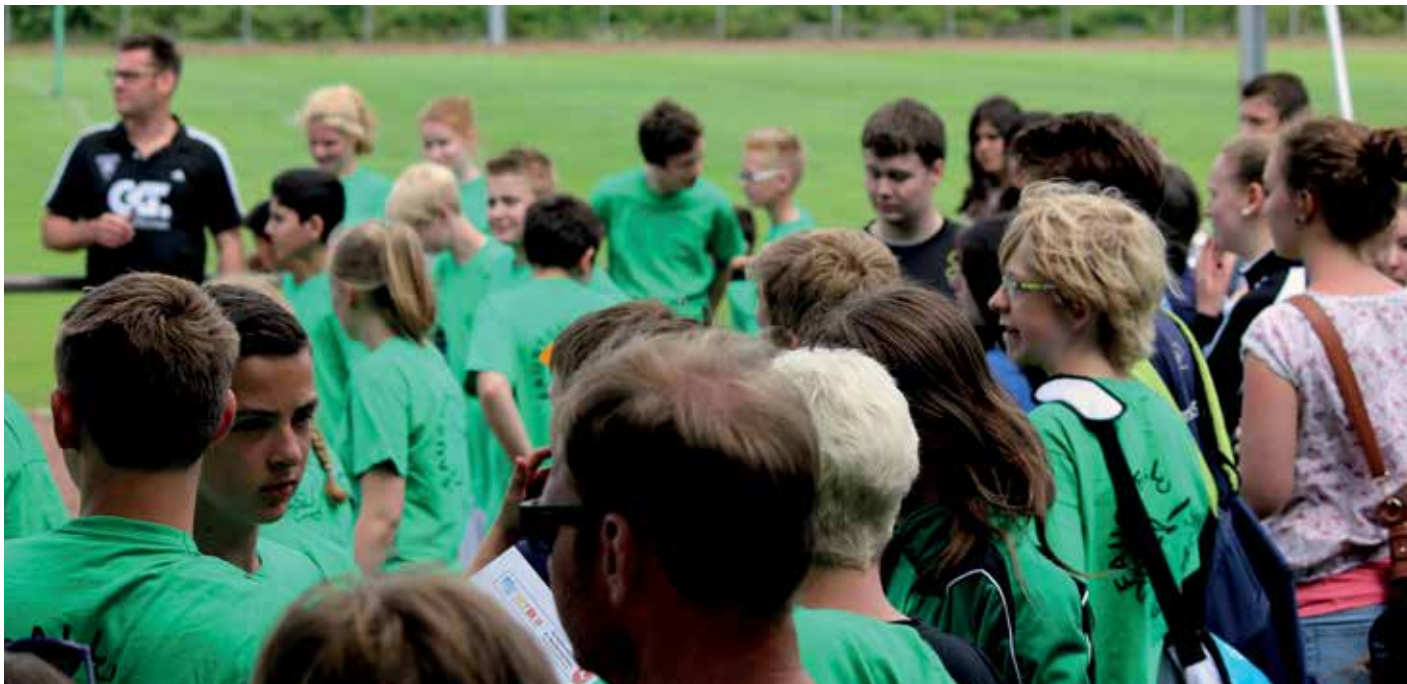
Die Schulfaustballturniere werden von Jahr zu Jahr immer beliebter.