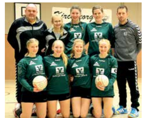
TSV Bardowick - 6. Platz.