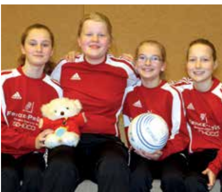
MTSV Selsingen - 3. Platz.