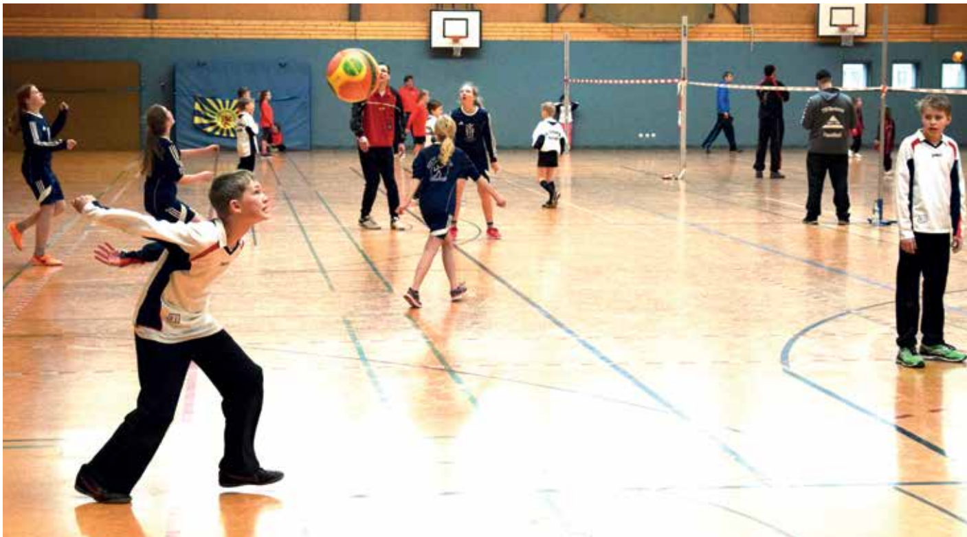
Auf vier Spielfeldern wurde gleichzeitig Faustball in der IGS-Sporthalle am Franzschen Feld gespielt.