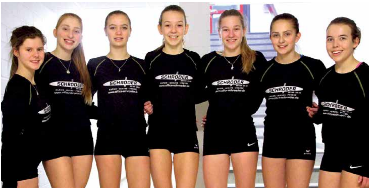
Für Schneverdingen reichte es diesmal nicht zu einem Platz auf dem Siebertreppchen.