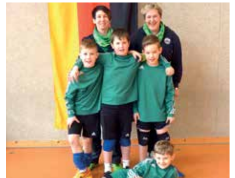
MTV Oldendorf - 5. Platz.