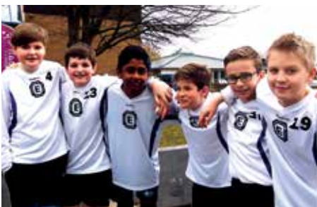
TuS Empelde - 3. Platz.