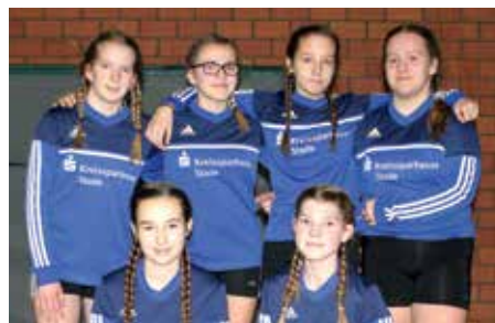
TSV Hagenah - 6. Platz.