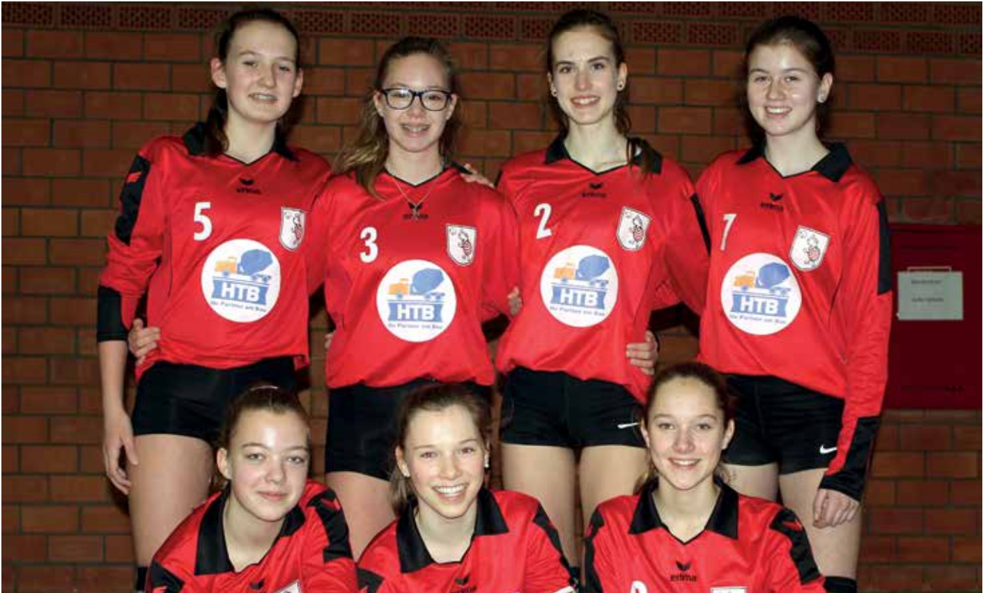
TV Jahn Schneverdingen - 1. Platz.