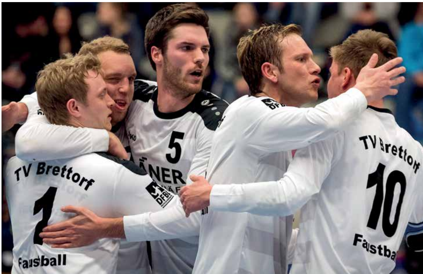
Brettorfer Jubel nach dem Gewinn der Bronzemedailien.