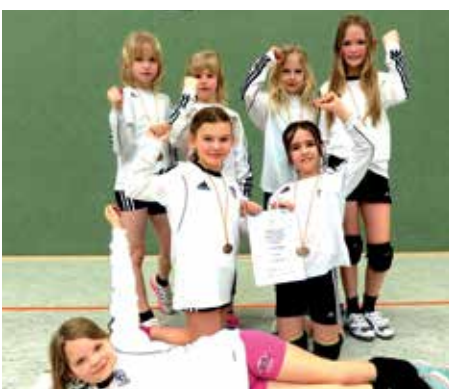
TV Brettorf - 3. Platz.