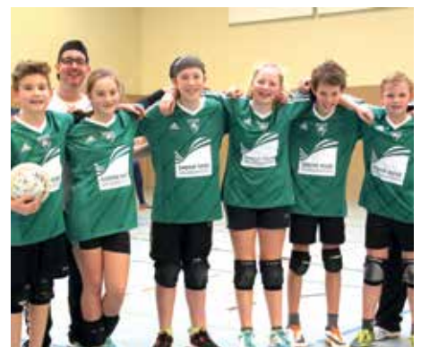
TSV Burgdorf - 7. Platz.