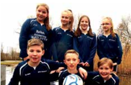
MTV Hammah - 4. Platz.