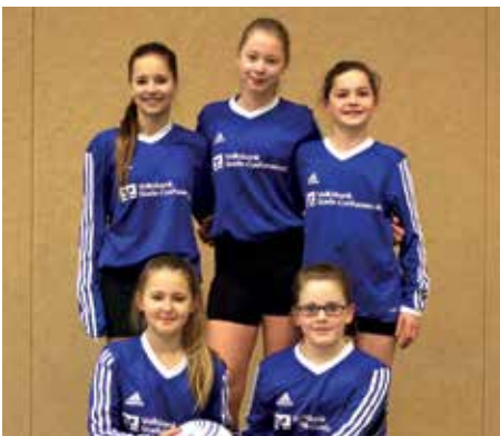
SV Düdenbüttel - 2. Platz.