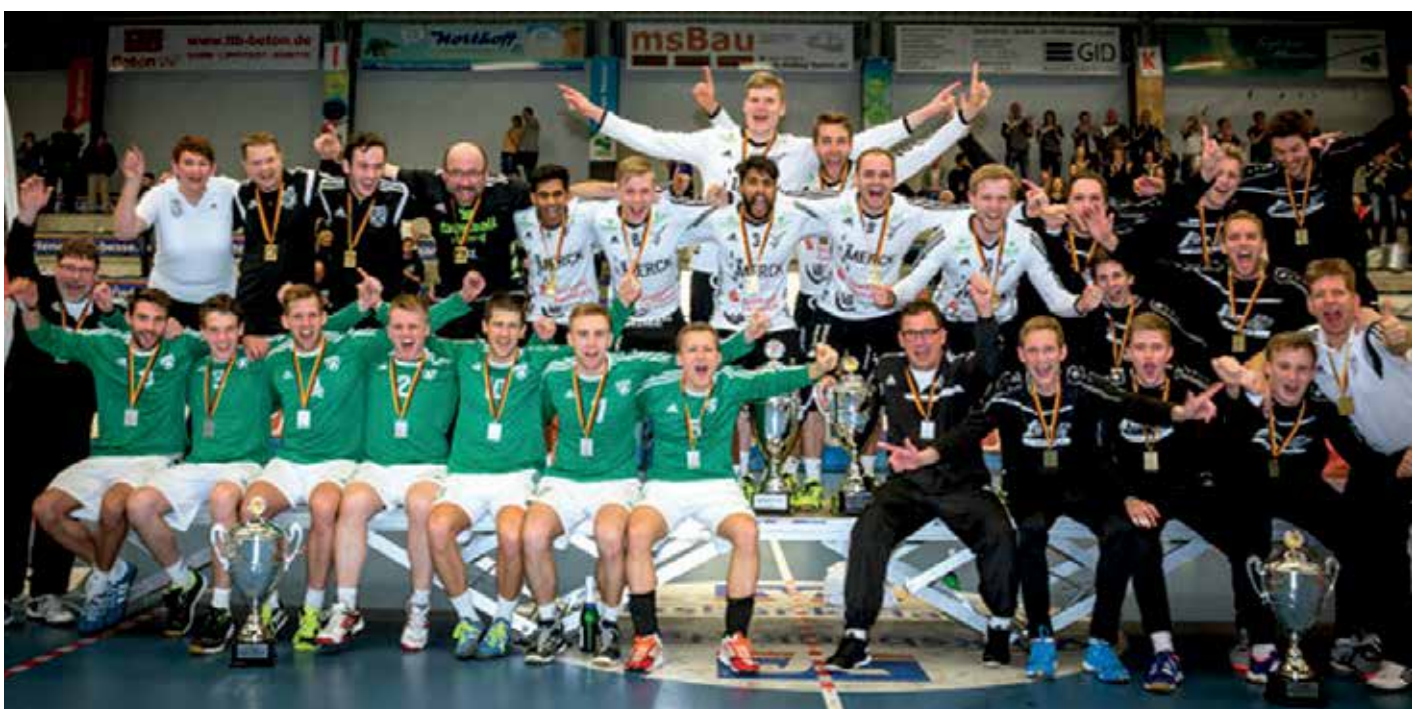
Gemeinsamer Jubel der Medaillengewinner.