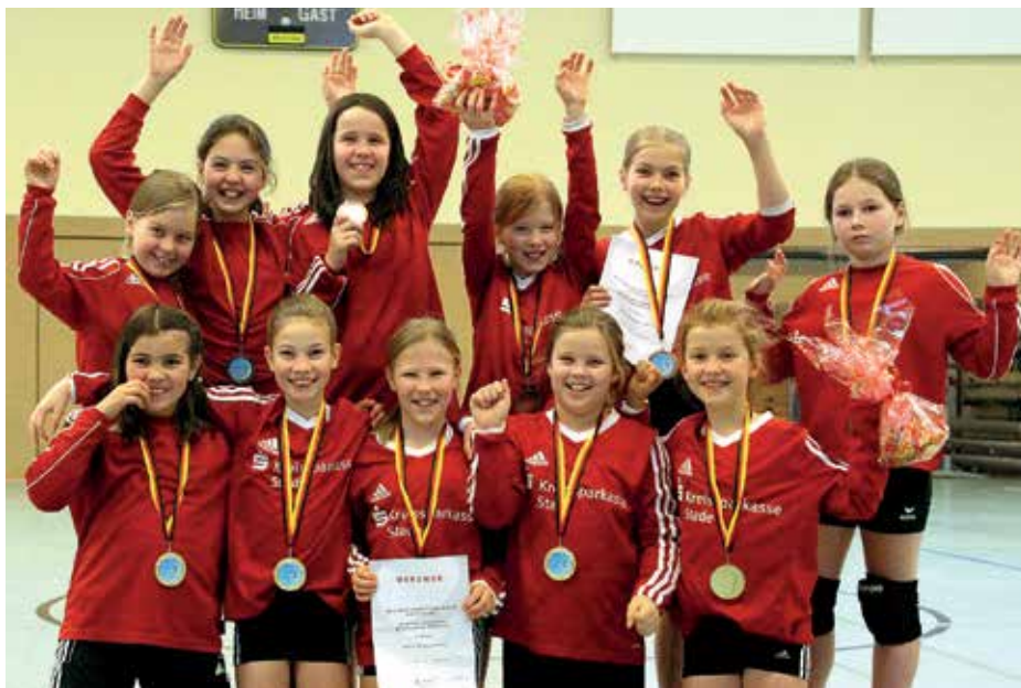
Neuer Faustball-Bezirksmeister der Mädchen U10 wurde der MTV Wangersen.