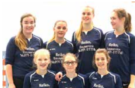
MTV Hammah - 6. Platz.