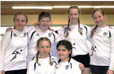
TV GH Brettorf - 2. Platz.