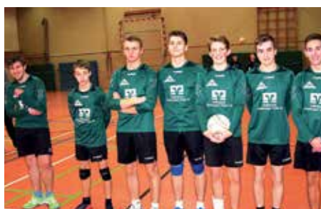
TSV Bardowick - 7. Platz.