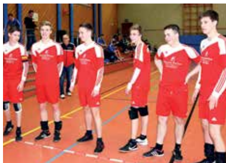
MTSV Selsingen - 6. Platz.