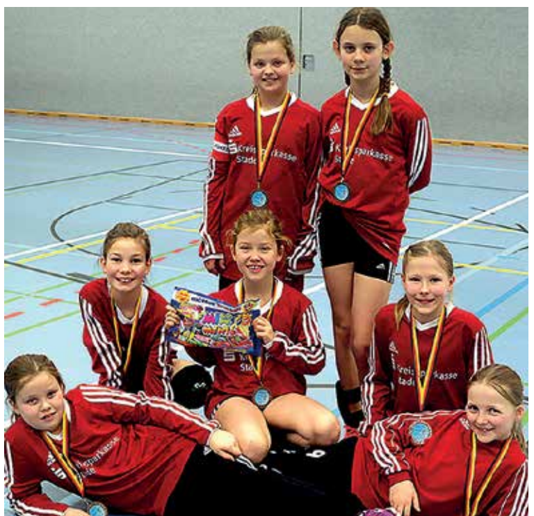
Die U12-Mädchen sind Vierter.

riten TV Jahn Schneverdingen spielen, unterlag hier aber 7:11 und 8:11. So kam es für die MTV Mädchen zum kleinen Endspiel um Bronze gegen Essel. Hier hatte Wangersen mit 12:10 und 11:3 die Nase klar vorne. Jetzt geht es zu den Landesmeisterschaften, die in Hammah stattfinden. (bs)