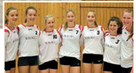
TV Jahn Schneverdingen - 6. Platz.