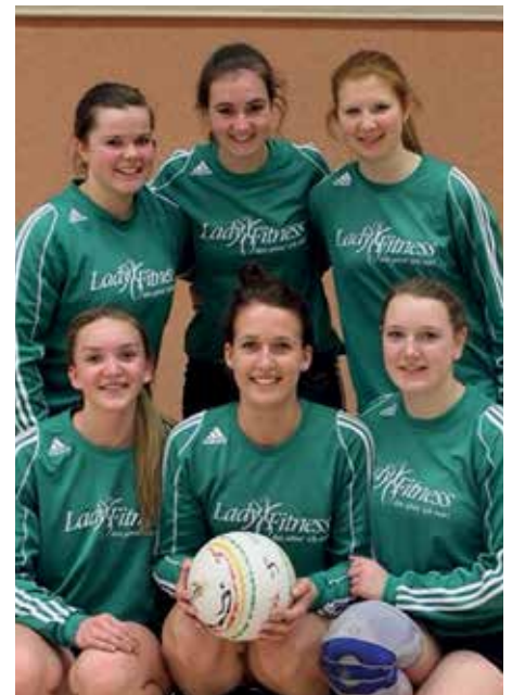
U18-Mädchen des TSV Essel.