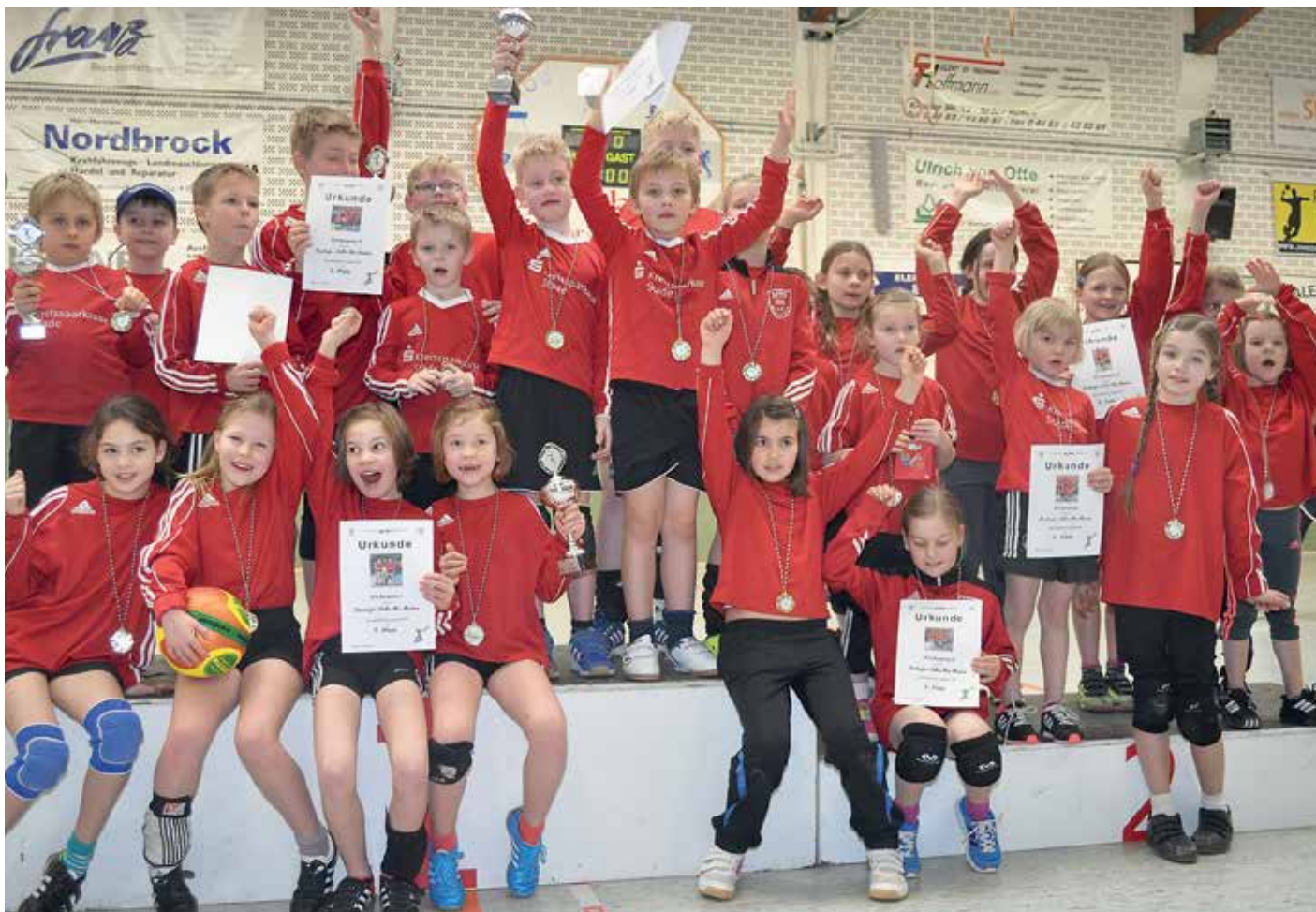
Wangersens Faustball-Nachwuchs war in Brettorf sehr erfolgreich.