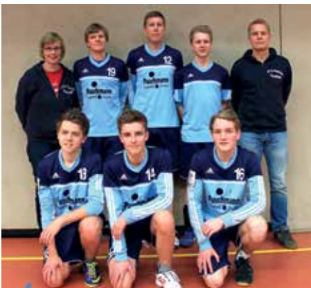
MTV Hammah - 3. Platz.