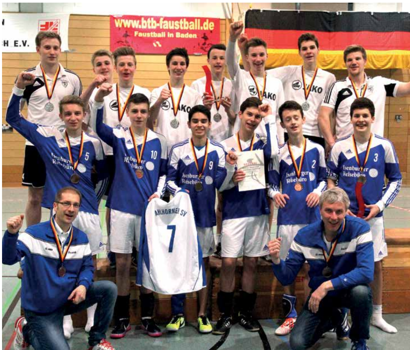
Starker Auftritt der beiden Teams aus Weser-Ems: Brettorf holt Silber, Ahlhorn Bronze.