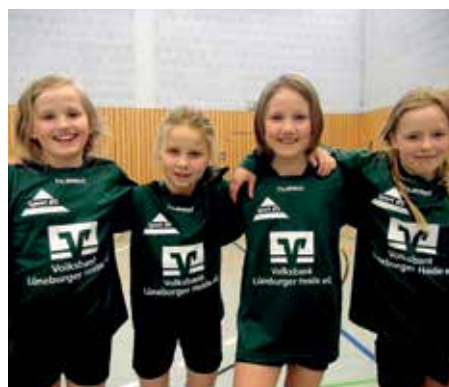
TSV Bardowick - 5. Platz.