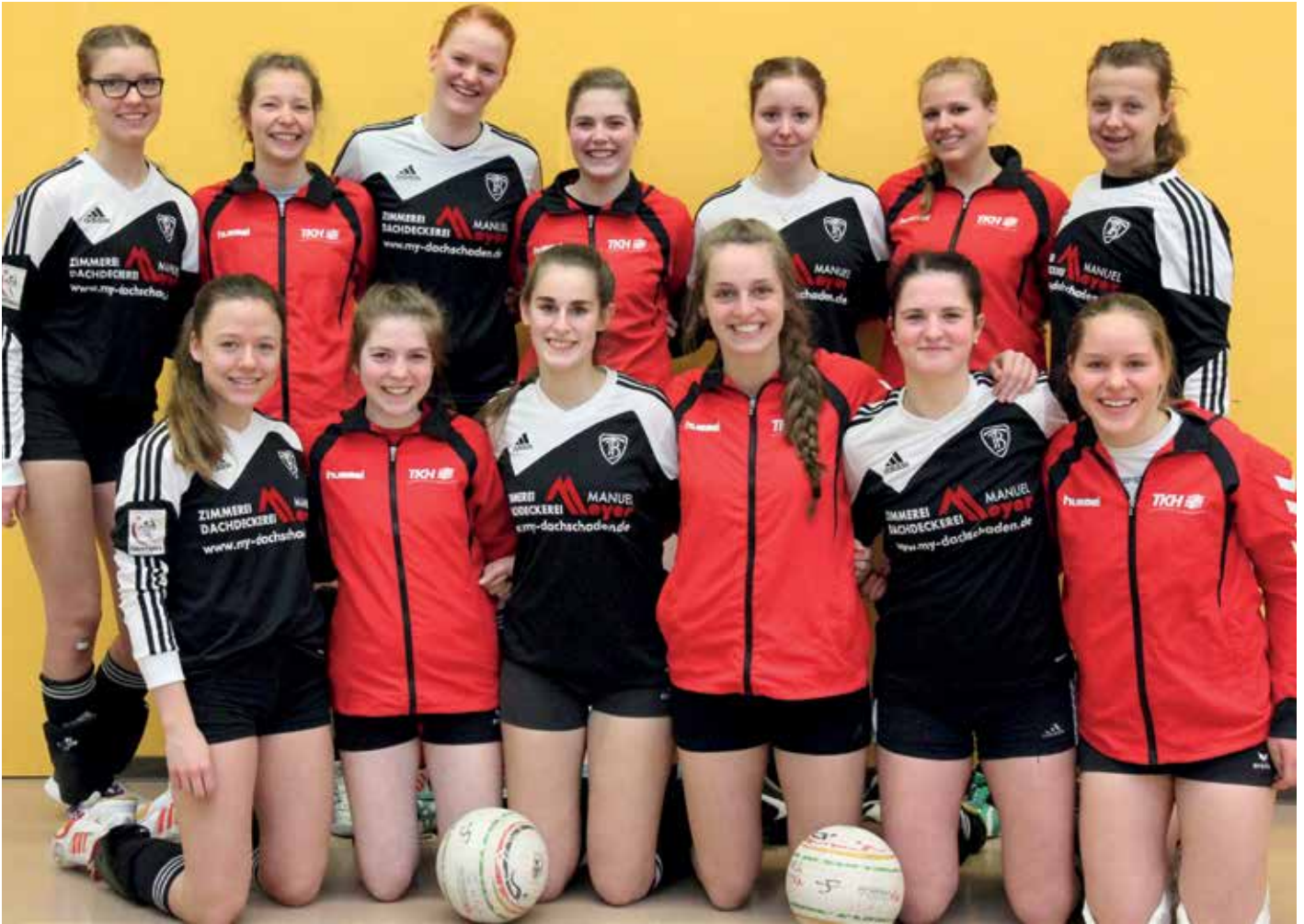
Gemeinsames Gruppenfoto: TK Hannover und TV Brettorf verpassten knapp den Sprung aufs Podest.