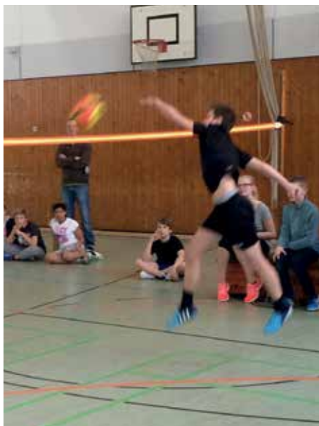
Auch der Rückschlag gelingt schon.

Neben diesen Events soll, in der nächsten Zeit in das Ganztagsangebot einiger Hamburger Schulen zu gelangt werden, um so den Faustballsport in Hamburg wieder ein wenig zu beleben. (cs)