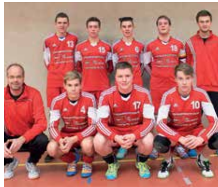
SV Moslesfehn - 4. Platz.