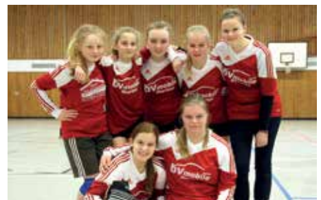
MTSV Selsingen - 7. Platz.