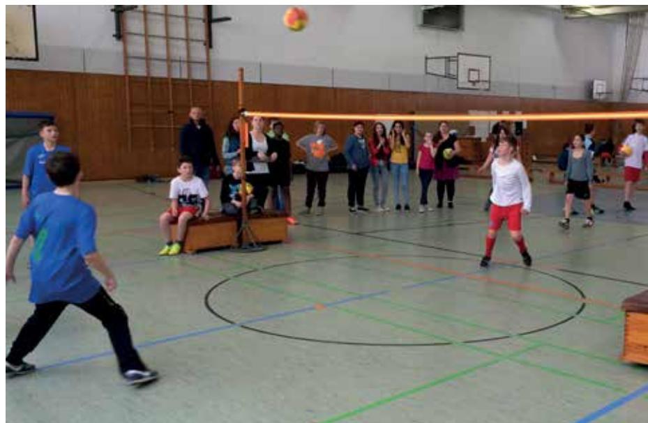
30 Mannschaften spielten auf fünf Spielfeldern.