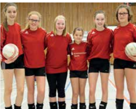
MTV Wangersen - 3. Platz.