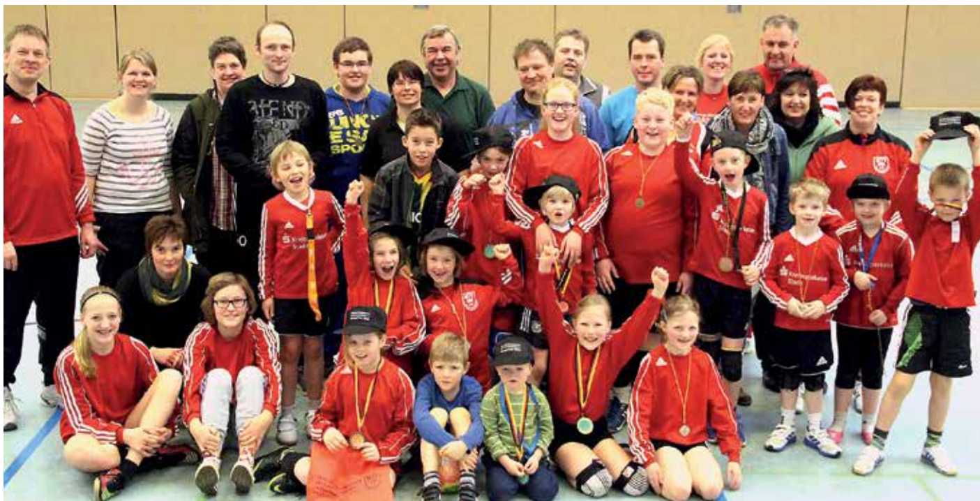
Acht Mannschaften des MTV Wangersen spielten beim Familien-Turnier auf Kleinfeldern einen ganzen Tag Faustball.