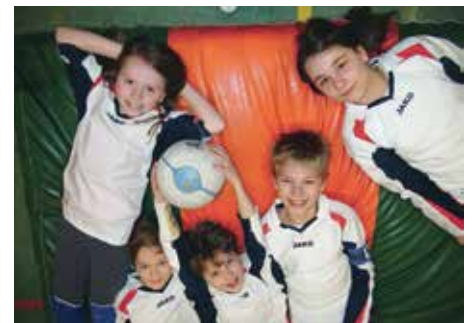
SCE Gliesmarode - 8. Platz.