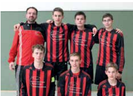
TuS Essenrode - 4. Platz.