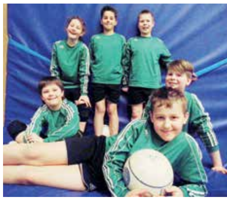
MTV Oldendorf - 4. Platz.