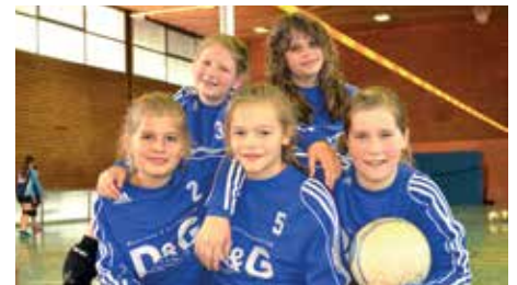
Ahlhorner SV - 4. Platz