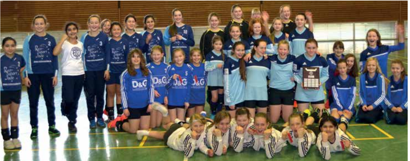
Siegerehrung bei der Bezirksmeisterschaft der Mädchen U12.