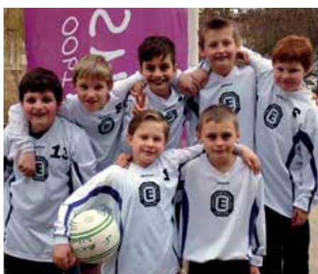
TuS Empelde - 4. Platz.