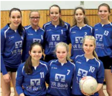
Ahlhorner SV - 2. Platz.