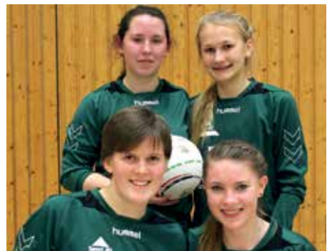
TSV Bardowick - 7. Platz.