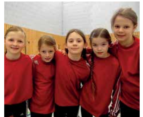
MTV Wangersen II - 6. Platz.