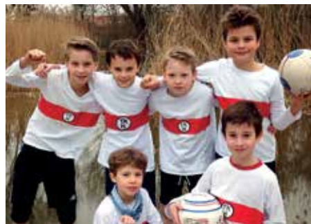
TK Hannover - 5. Platz.