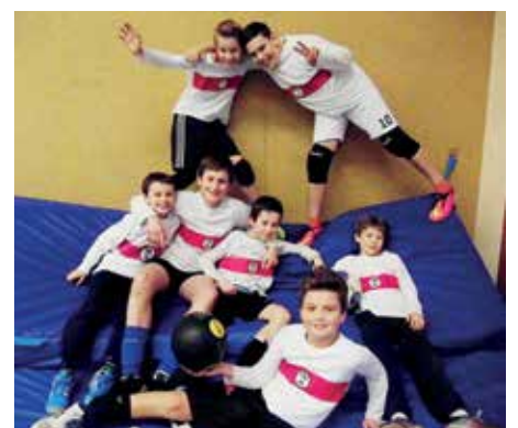
TK Hannover - 6. Platz.