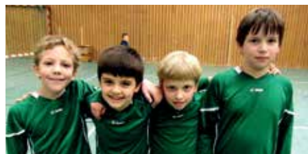
TuS Bothfeld - 6. Platz.