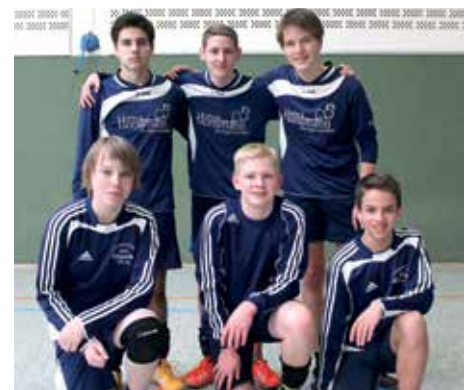
MTV Nordel - 7. Platz.