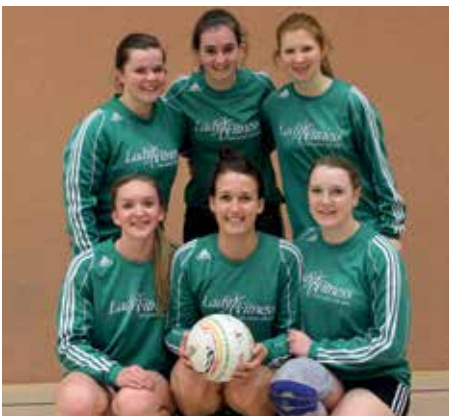
TSV Essel - 3. Platz.