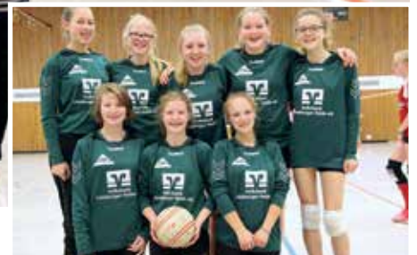
TSV Bardowick - 6. Platz.