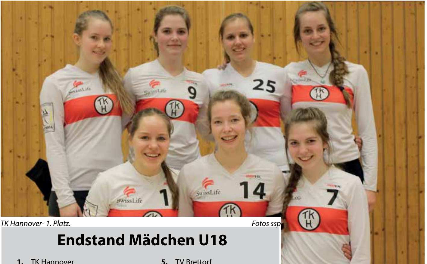
TK Hannover - 1. Platz.