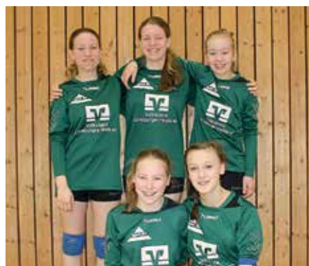
TSV Bardowick - 5. Platz.