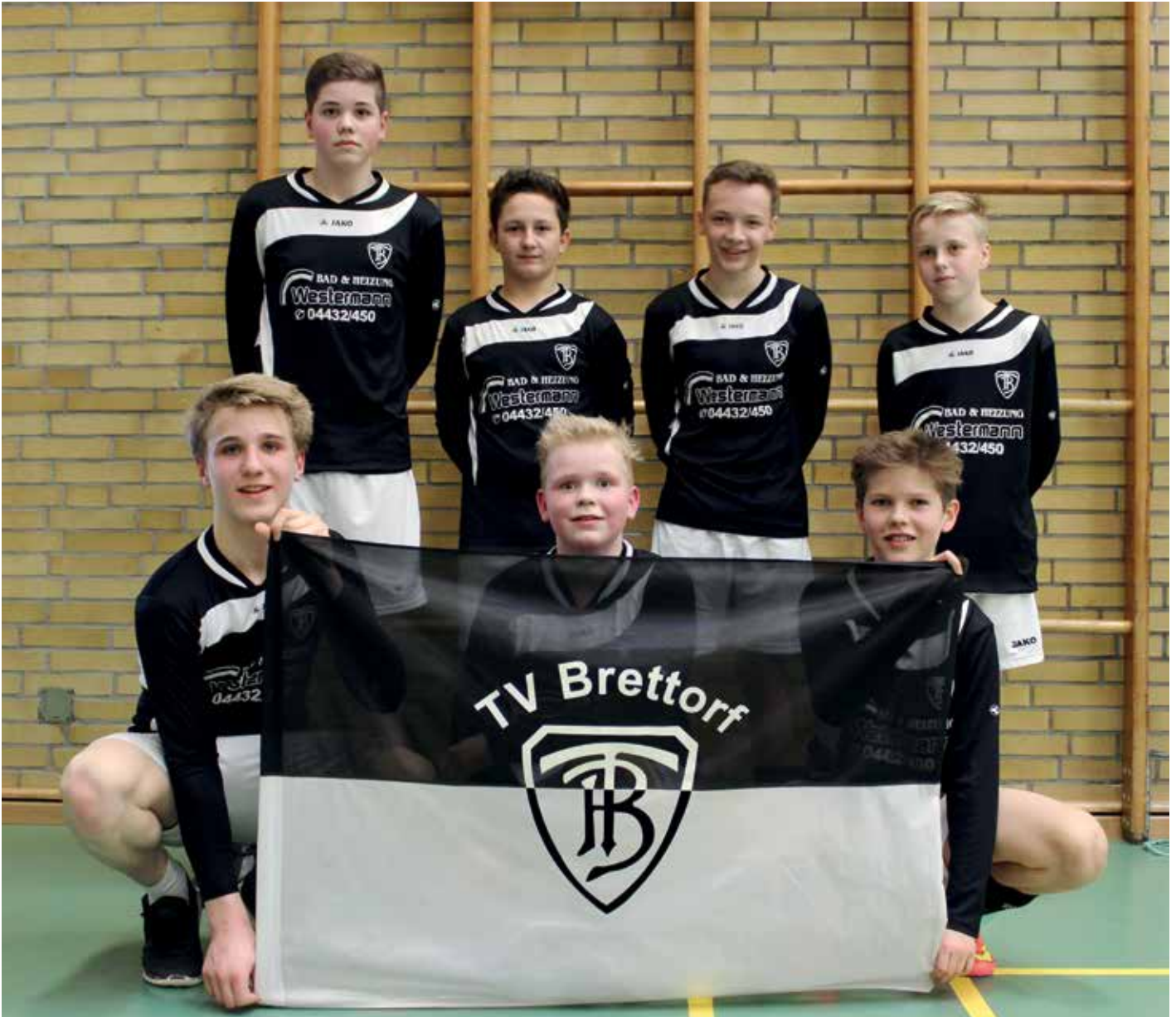
Brettorfs U14-Jungs sind fünfter bei der Deutschen Meisterschaft in Hohenlockstedt.