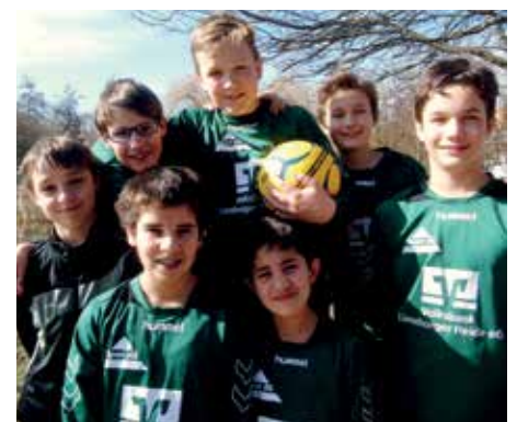
TSV Bardowick - 7. Platz.