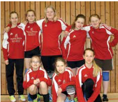
MTSV Selsingen - 2. Platz.