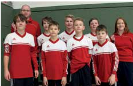
SV Moslesfehn - 2. Platz.