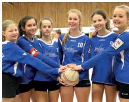
Ahlhorner SV - 5. Platz.