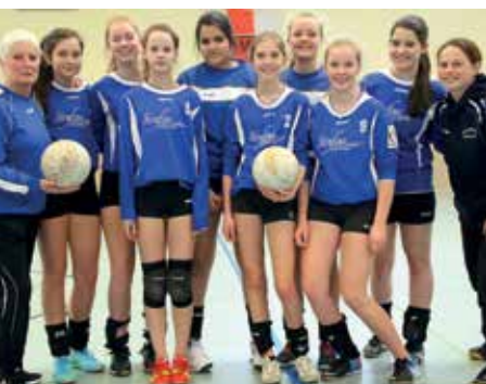
Ahlhorner SV - 4. Platz.