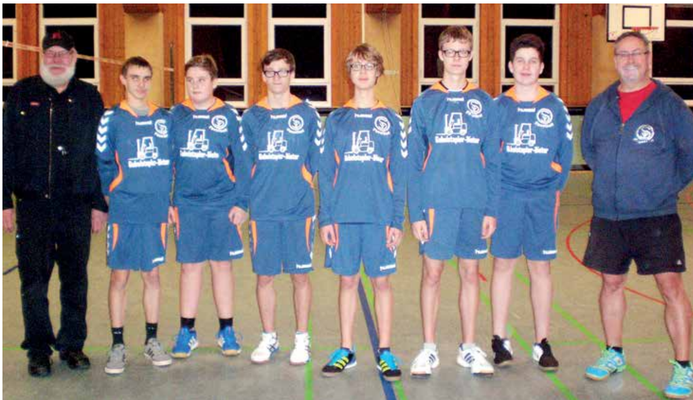
Der TSV Schwiegershausen hat auch wieder Jungen im Nachwuchsbereich.