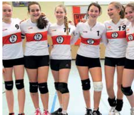
TK Hannover - 5. Platz.