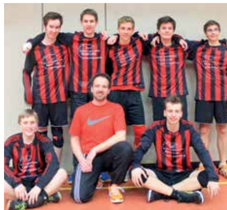
TuS Essenrode - 5. Platz.