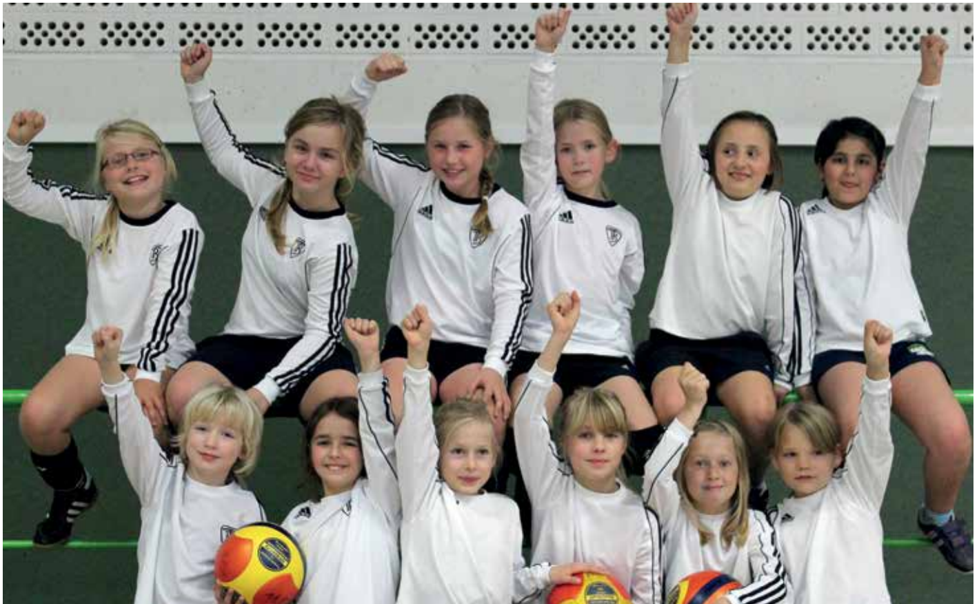
Sie jubeln über den Titelgewinn.