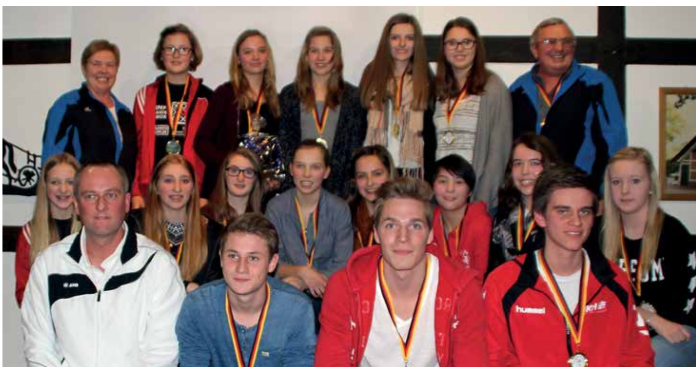
Gruppenfoto mit allen Geehrten und Bundestrainer Olaf Neuenfeld.