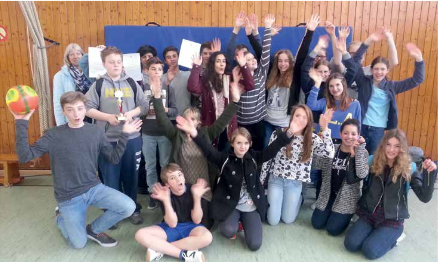
So freuen sich Hamburger Schülerinnen und Schüler über die Faustball-Aktion.