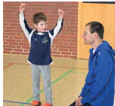
Der Spaß kam nicht zu kurz.: Die Kinder tobten in der Halle.