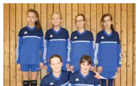
Wardenburger TV - 7. Platz.