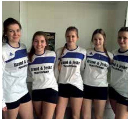
Wardenburger TV - 4. Platz.