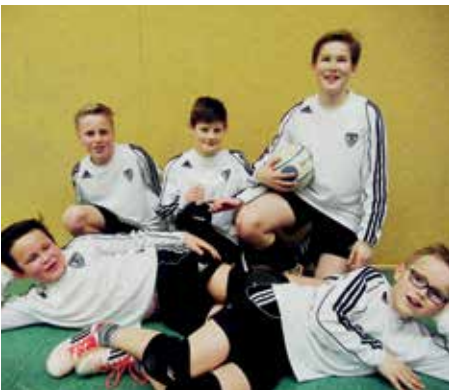
TV GH Brettorf - 2. Platz.