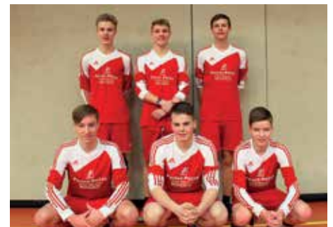
MTSV Selsingen - 7. Platz.