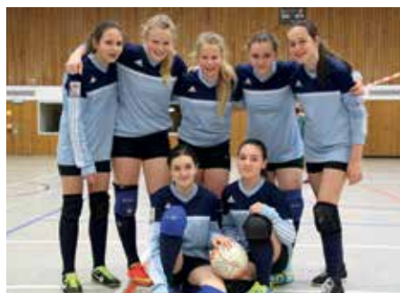
Elsflether TB - 4. Platz.