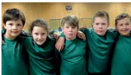
MTV Oldendorf - 3. Platz.