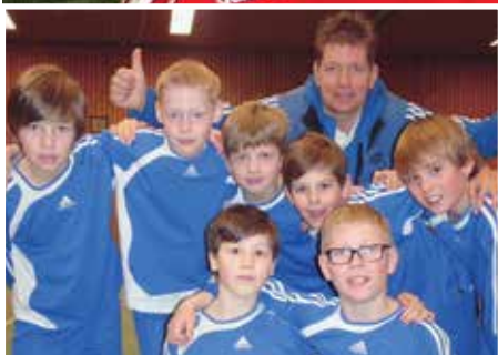
Wardenburger TV - 2. Platz.