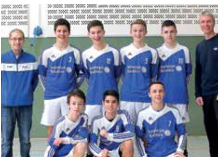
Ahlhorner SV - 3. Platz.