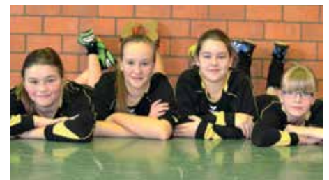
Lemwerder TV - 5. Platz