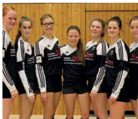
TV Brettorf - 5. Platz.