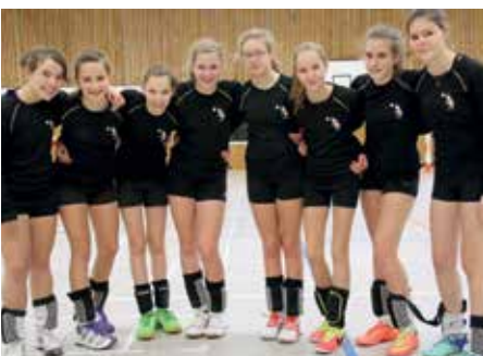
TV Jahn Schneverdingen - 2. Platz.