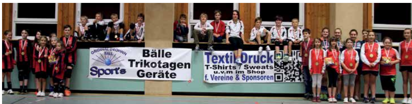
Bei der Siegerehrung bekamen alle Teilnehmer Medaillen und Präsente.