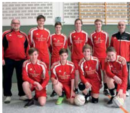
MTSV Selsingen - 5. Platz.