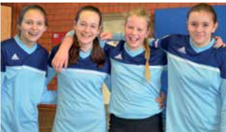
Elsflether TB - 1. Platz

Das war angesichts der Tatsache, dass gegen alle Erstmannschaften zu spielen war – gegen den direkten Konkurrenten Brettorf I sogar zweimal – eine harte Aufgabe für die Mädchen. Auch der Lemwerder TV kann mit einem siegreichen Spieltag noch zu den Landesmeisterschaften vorstoßen. Er ist ein ernstzunehmender Gegner und immer für eine Überraschung gut. Der Wardenburger TV hatte heute die leichteste Aufgabe, da nur zwei Spiele zu absolvieren waren, die aber beide gewonnen werden müssen. Ansonsten könnte der Punktverlust aus dem Spieltag in Elsfleth gegen den Ahlhorner SV II bei der Frage der Teilnahme an den Landesmeisterschaften zum Verhängnis werden.