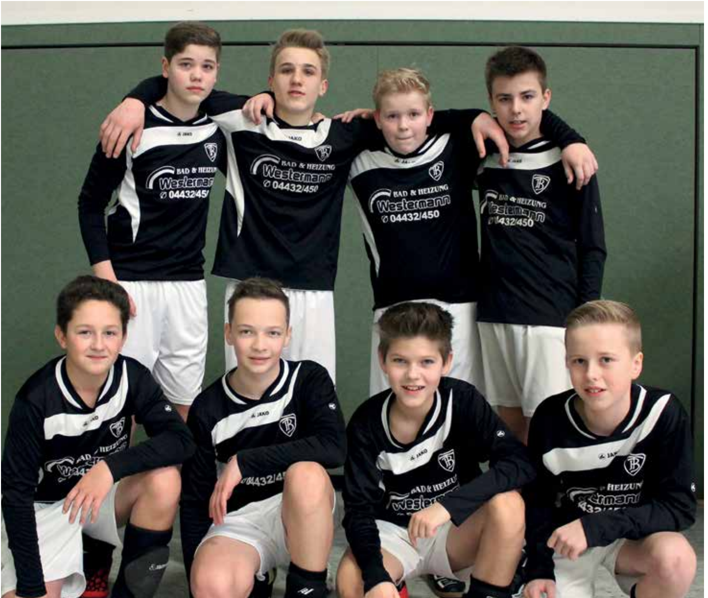
TV GH Brettorf - 1. Platz.