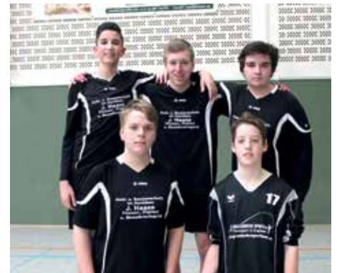
VfL Eintracht Hannover - 7. Platz.