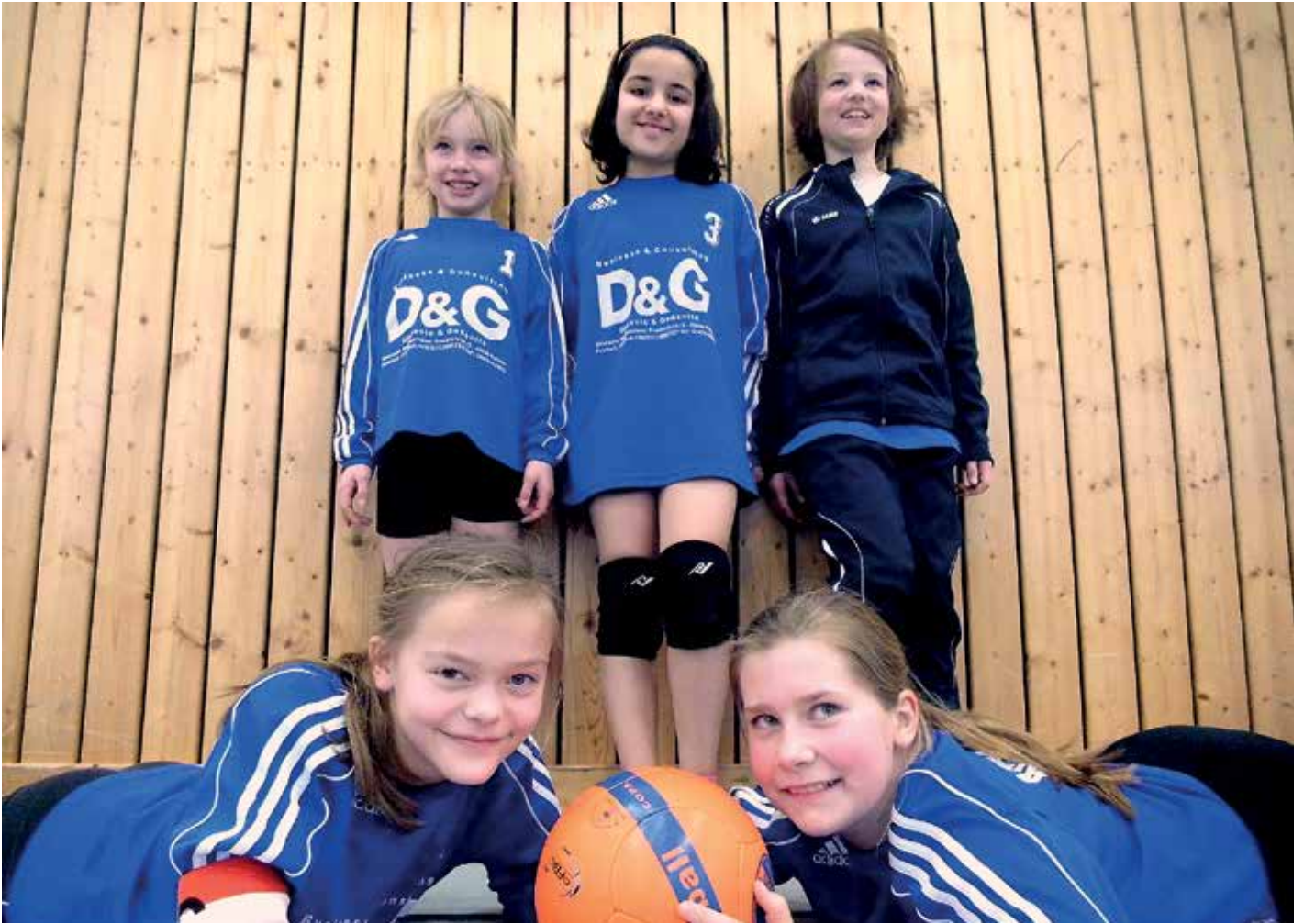
Ahlhorner SV - 1. Platz.