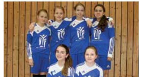
MTV Diepenau - 7. Platz.