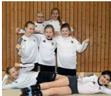
TV GH Brettorf - 4. Platz.