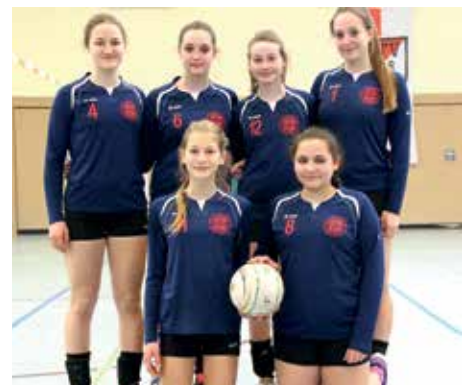
SCE Gliesmarode - 7. Platz.