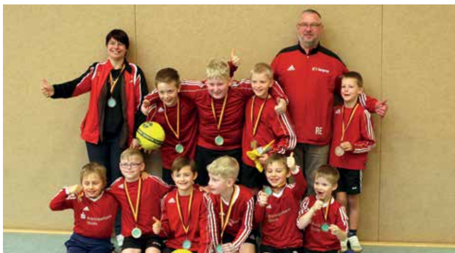
Auch die Jungen des MTV wurden Bezirksmeister.

tierten sich hier von Beginn an dominant und gewannen alle Spiele. Ohne Punktverlust wurde das Team Bezirksmeister, musste lediglich beim knappen 23:20-Sieg gegen Vizemeister MTV Oldendorf/Celle an die Leistungsgrenze gehen. (bs)