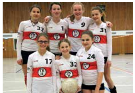
TK Hannover - 7. Platz.