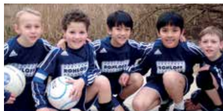
Ahlhorner SV - 7. Platz.