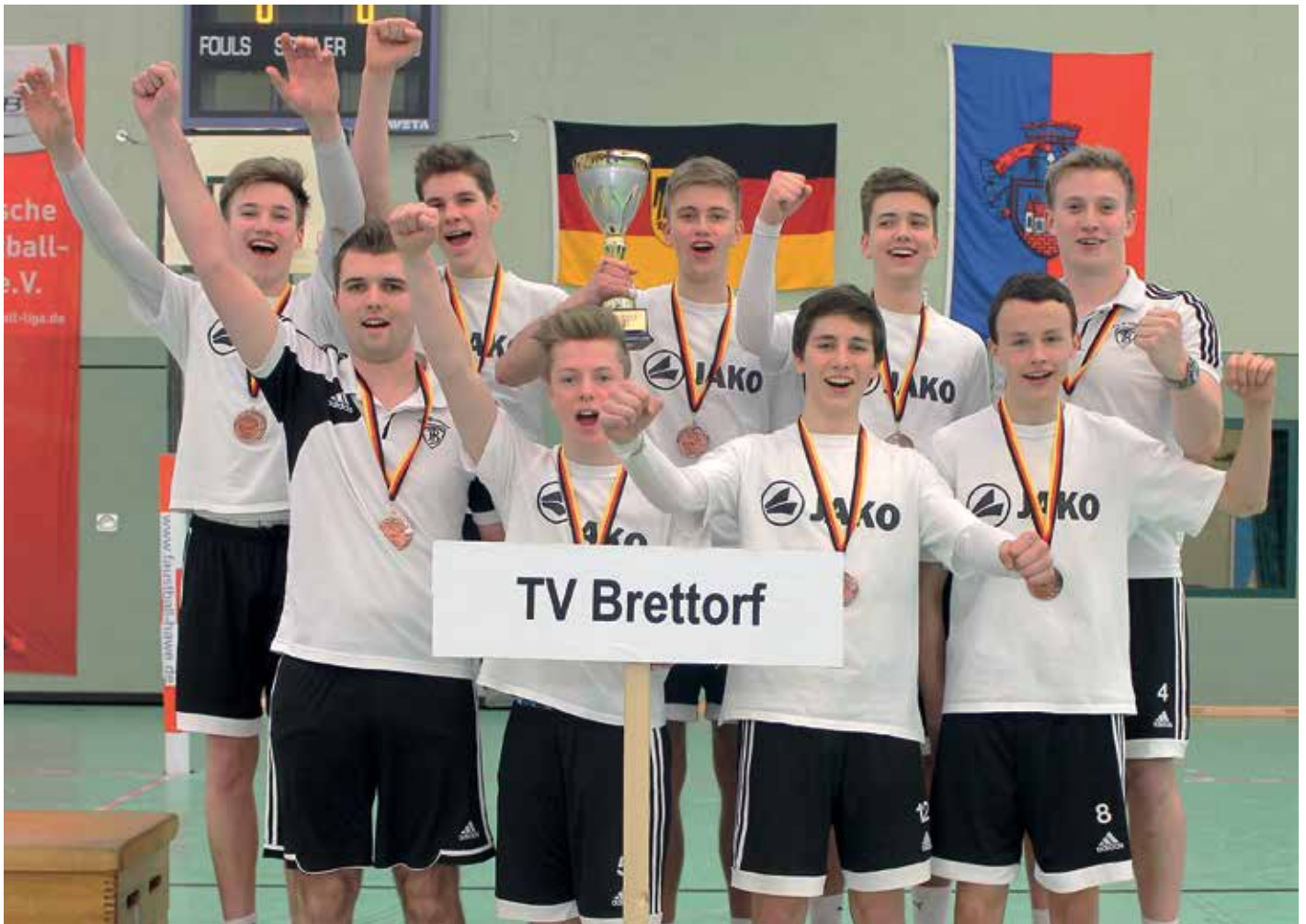
Die Freude der Brettorfer über den dritten Platz war riesengroß