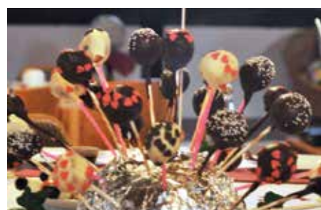
Blumenschmuck mal anders.