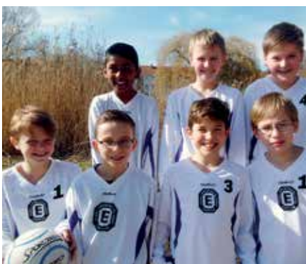
TuS Empelde - 5. Platz.