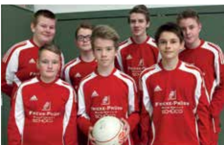
MTSV Selsingen - 3. Platz.