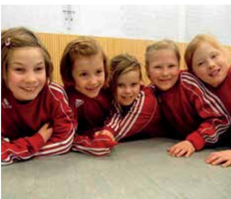
MTV Wangersen I - 3. Platz.