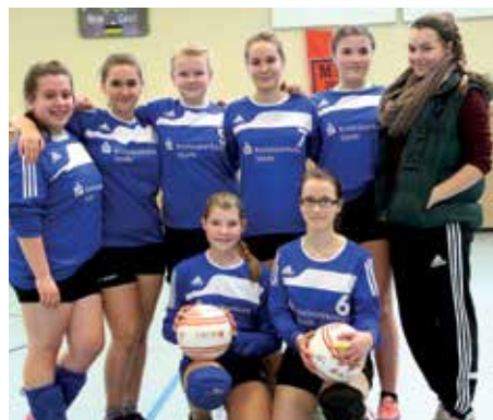
TSV Hagenah - 6. Platz.