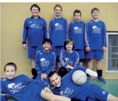
Ahlhorner SV - 3. Platz.