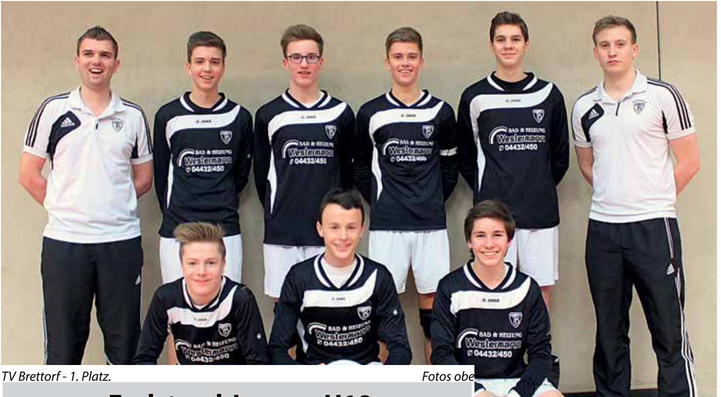
TV Brettorf - 1. Platz.