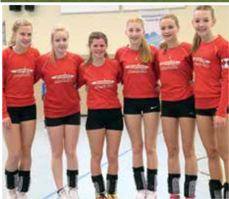
TV Jahn Schneverdingen - 2. Platz.