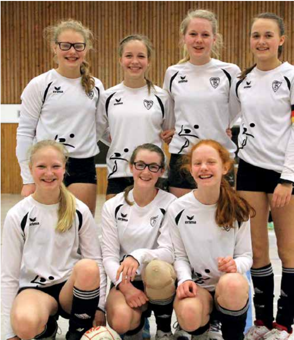
TV GH Brettorf - 1. Platz.