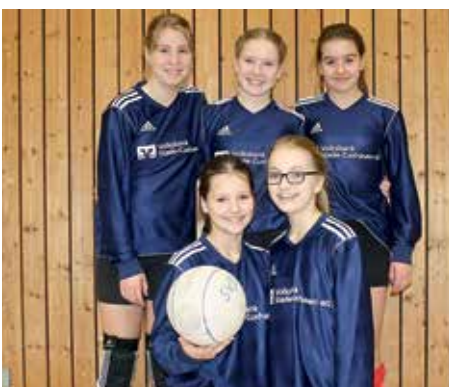
SV Düdenbüttel - 3. Platz.