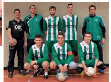
TSV Burgdorf - 6. Platz.