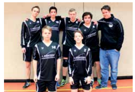
VfL Eintracht Hannover - 7. Platz.