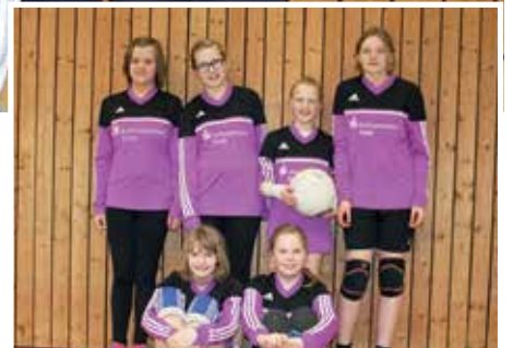
TuS Oldendorf - 6. Platz.