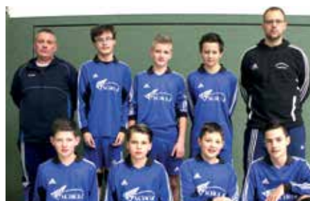
Ahlhorner SV - 5. Platz.