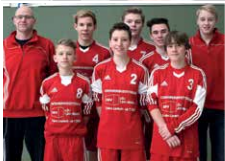
SV Moslesfehn - 2. Platz.