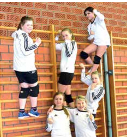
TV Brettorf - 2. Platz