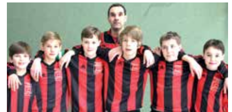
TuS Essenrode - 6. Platz.