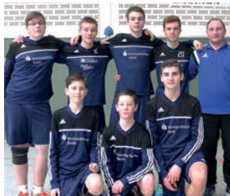
SV Düdenbüttel - 6. Platz.