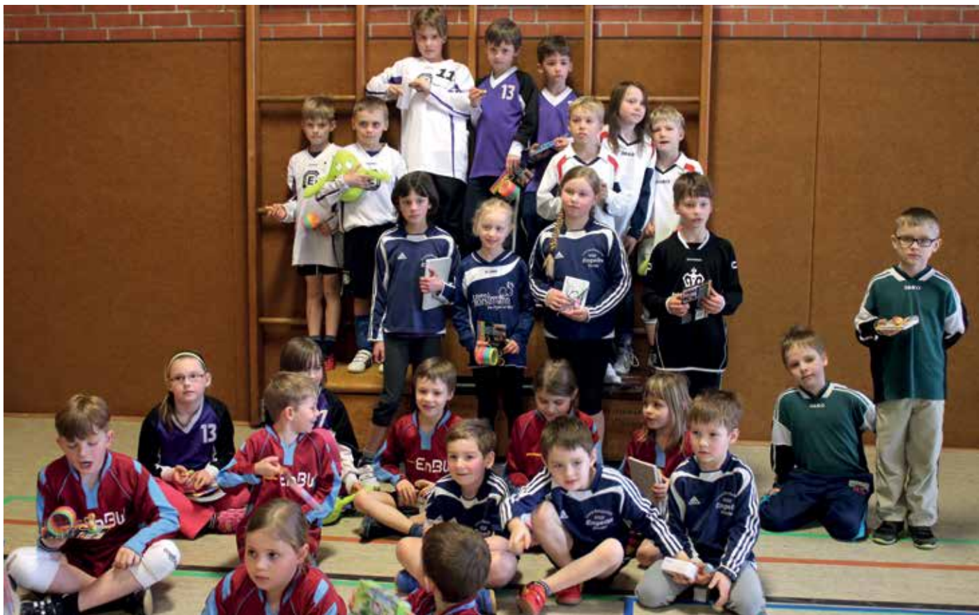
Siegerehrung bei der Mini-Meisterschaft.