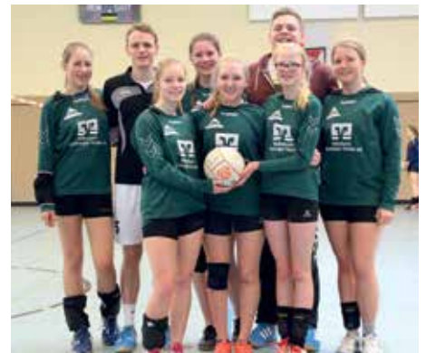
TSV Bardowick - 7. Platz.