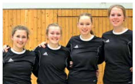
TuS Empelde - 7. Platz.