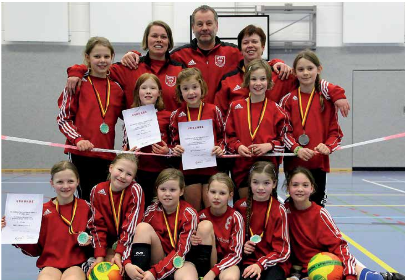
Bezirksmeister der Mädchen U10 wurde der MTV Wangersen.