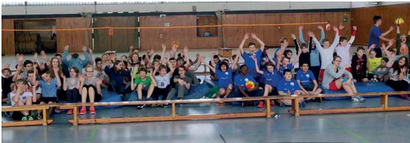
Großer Jubel bei der Siegerehrung.