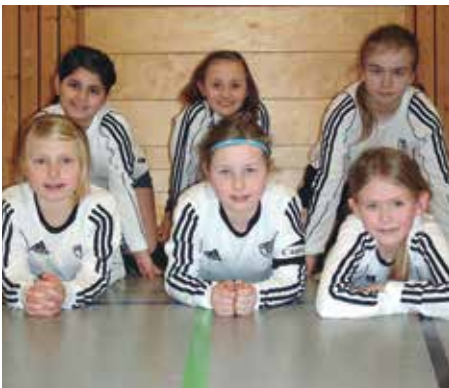
TV GH Brettorf - 2. Platz.