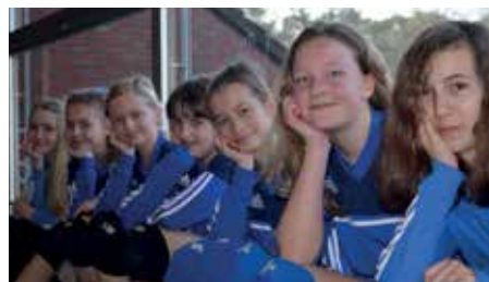
Wardenburger TV - 3. Platz