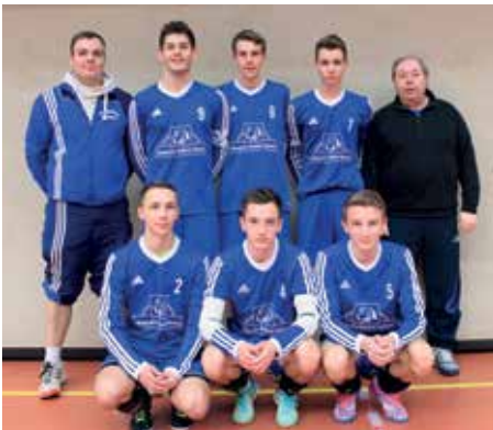
Ahlhorner SV - 2. Platz.