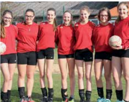
MTV Wangersen - 3. Platz.