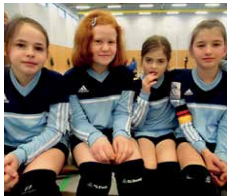
Elsflether TB - 4. Platz.