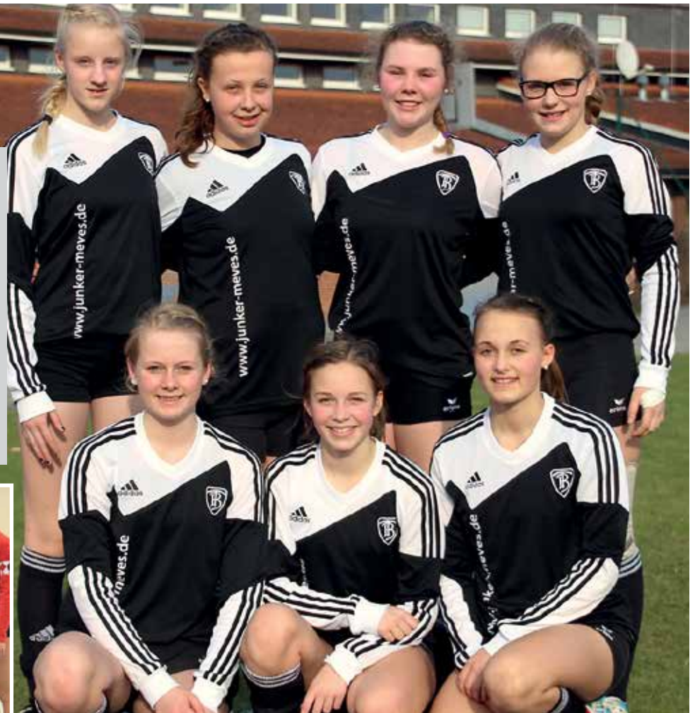
TV Brettorf - 1. Platz.