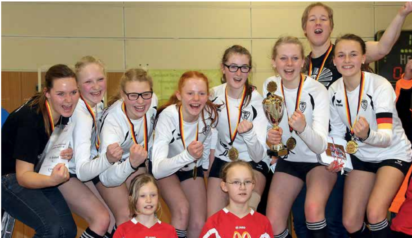
Brettorf hat nach 23 Jahren wieder einen Titel bei den Mädchen U14.