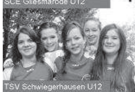
TSV Schwiegershausen U12