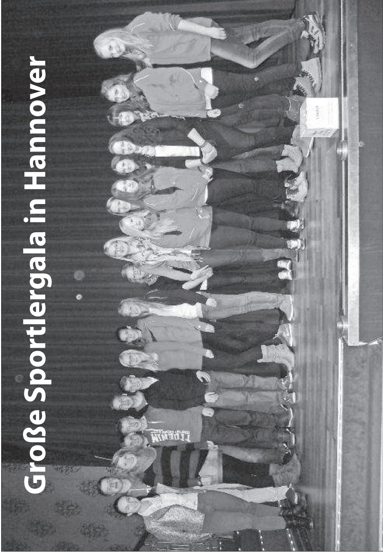
Viele strahlende Gesichter auf der Bühne bei der Sportlergala in Hannover. Der SV Moslesfehn, TVJ Schneverdingen, TV Brettorf und Auswahlspieler des NTB wurden feierlich geehrt für ihre hervorragenden Leistungen im zurückliegenden Jahr. Stolz nahmen die jungen Talente ihre Auszeichnungen entgegen.