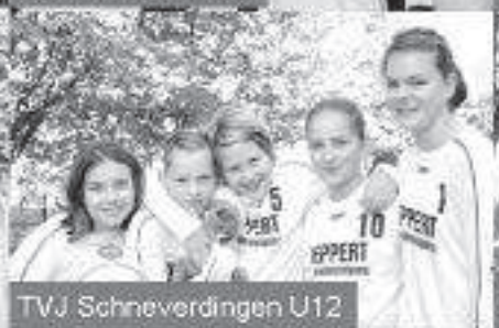
TVJ Schneverdingen U12