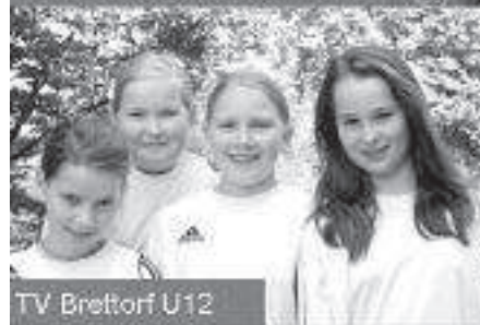
TV Brettorf U12