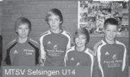
MTSV Selsingen U14