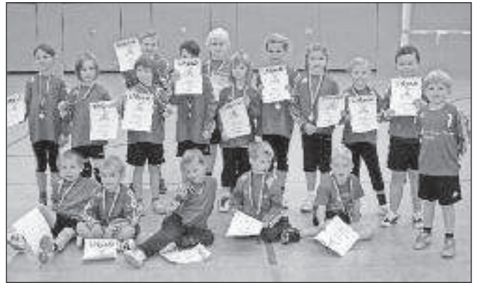
In der Spielklasse Mixed U8 war der ausrichtende MTV Wangersen mit drei Mannschaften dabei, die Mädchen erreichten den zweiten Platz.