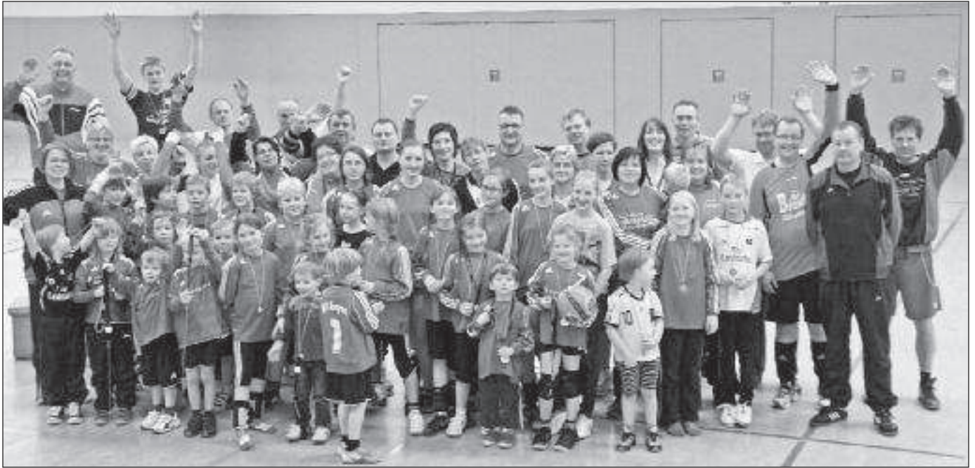
15 Mannschaften des MTV Wangersen spielten beim Familien-Turnier auf Kleinfeldern einen ganzen Tag Faustball.

ßenden Siegerehrung bekamen alle Kinder als Belohnung eine Medaille überreicht, obwohl es diesmal nicht darum ging, wer am Ende die meisten Spiele gewonnen hatte. Trotzdem war der Ehrgeiz bei allen Kindern, aber auch teilweise bei den Eltern, unverkennbar und das Erreichen des sportlichen Erfolges am Ende der jeweiligen Spiele bei den meisten doch von großer Wichtigkeit.