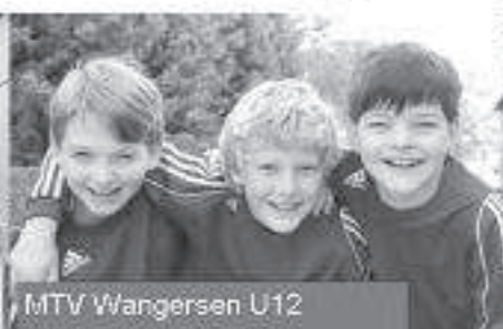
MTV Wangersen U12