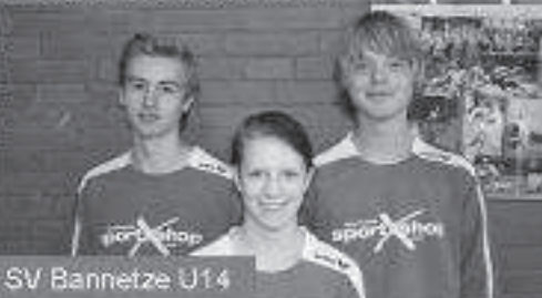
SV Bannetze U14