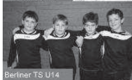
Berliner TS U14