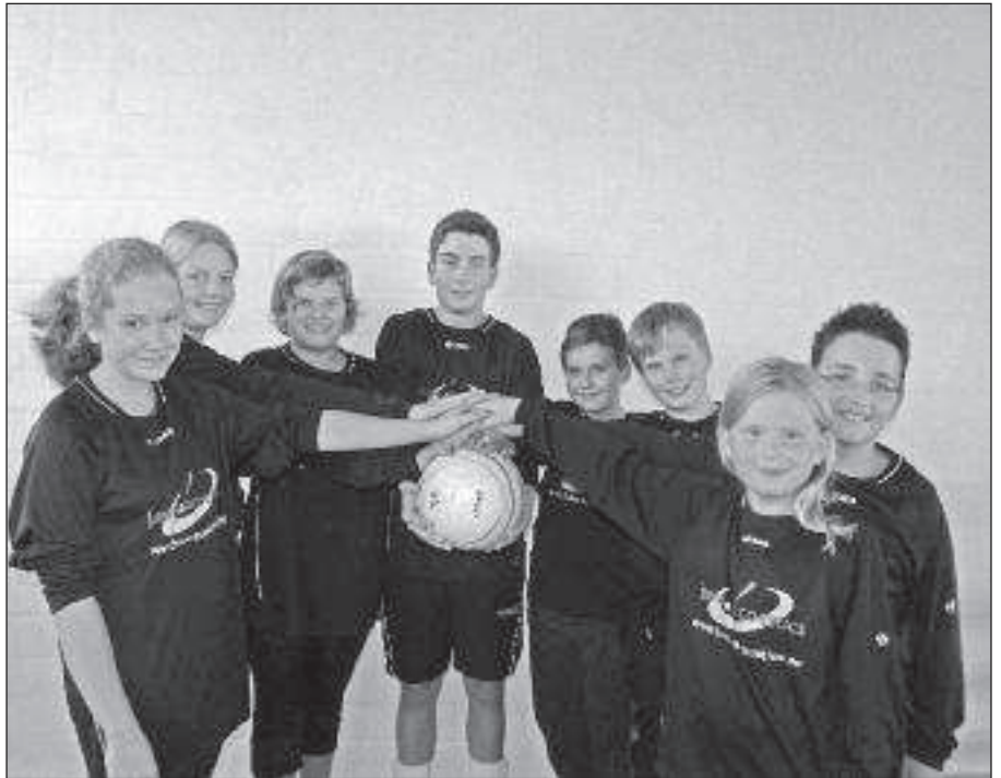
Oberger Faustballkids bewiesen ihr Können beim Turnier und zeigten allen Zuschauern beim 40. Spartenjubiläum des TSV Mehrum, dass man auch in jungen Jahren sehr gut Faustball spielen kann.