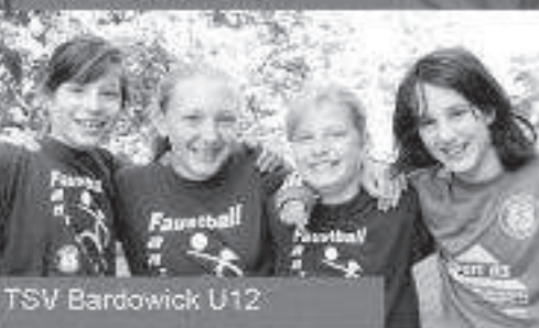
TSV Bardowick U12