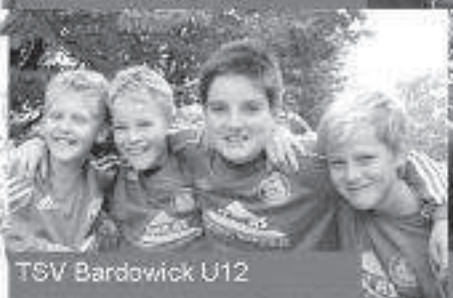
TSV Bardowick U12