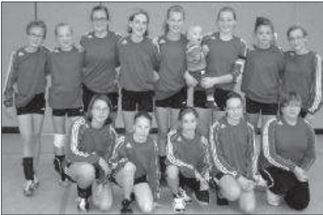
Auch bei der weiblichen U14 schickte Wangersen drei Teams ins Rennen. Die erste Mannschaft wurde Turniersieger.

Am erfolgreichsten war diesmal der Gastgeber selbst, der dreimal Gold und einmal Silber gewinnen konnte, allerdings mit zwölf Mannschaften auch die meisten Teilnehmer stellte. Sehr erfolgreich war auch der SV Düdenbüttel, der dreimal die Goldmedaillen gewann und der TSV Essel, der einmal Silber und zweimal Bronze holte.