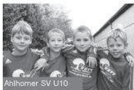
Anlommer SV U10