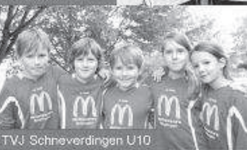
TVJ Schneverdingen U10