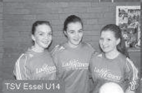
TSV Essel U14