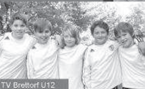
TV Brettorf U12