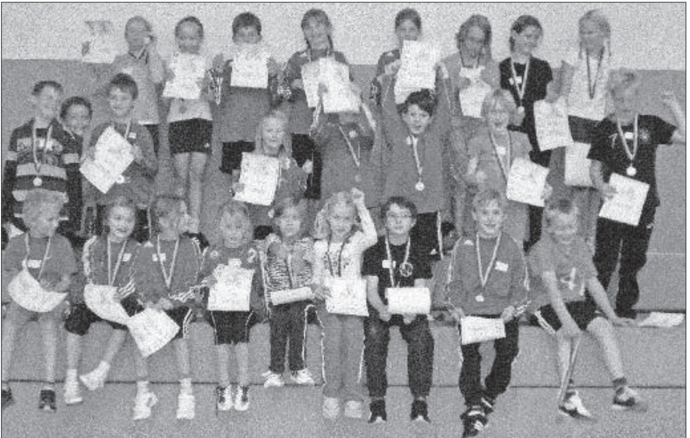
Bei der Siegerehrung gab es für alle Kinder Medaillen und Urkunden.

Wangersen/Ahlerstedt. (bs) Der MTV Wangersen führte in Zusammenarbeit mit der Grundschule Ahlerstedt für die Schülerinnen und Schüler der Klassen zwei bis vier ein Faustballturnier durch. 26 Kinder meldeten sich für die Spiele in der Ahlerstedter Sporthalle an.