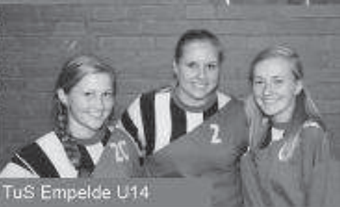
TuS Empelde U14