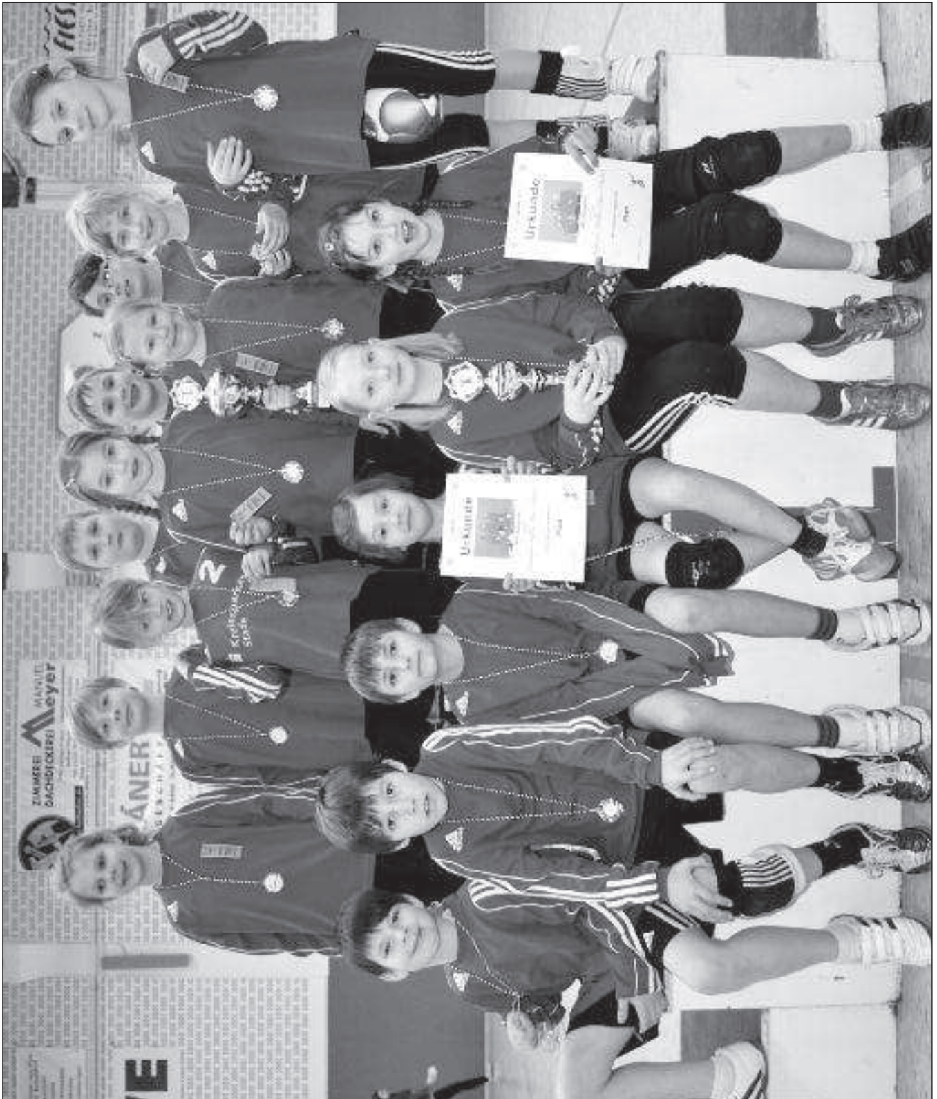
Wangersens Faustball-Nachwuchs war beim Mini-Masters in Brettorf in allen Klassen mit jeweils einer Mannschaft vertreten..

Wangersen. (bs) Immer zum Saisonabschluss in der Halle findet in Brettorf bei Wildeshausen das Faustball-Mini-Masters statt. Stammgäste sind hier seit einigen Jahren die Minis des MTV Wangersen. Und erfolgreich sind sie auch immer. Diesmal gehörten die Mädchen U8 und U10 zu den Pokalgewinnern, die U8 wurde Masters-Sieger und die U10 wurde Zweiter. Die MTV-Jungs schafften es nicht die Endrunde zu erreichen, wurden bei der abschließenden großen Siegerehrung aber wie alle anderen Mannschaften mit Medaillen für ihre guten Leistungen ausgezeichnet.