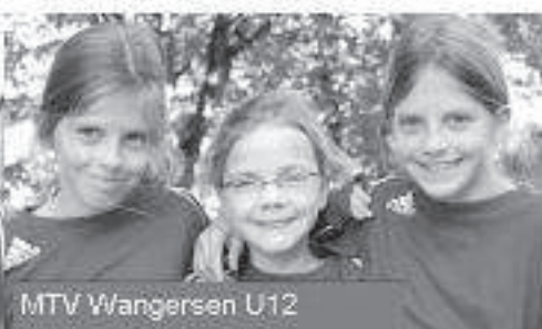
MTV Wangersen U12