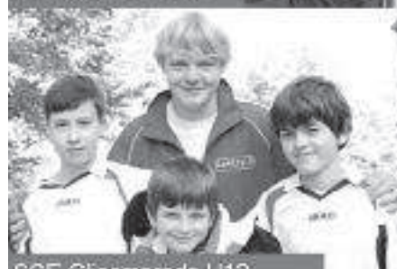
SCE Glesmarode U12