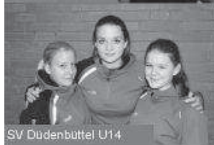
SV Dudenbüttel U14