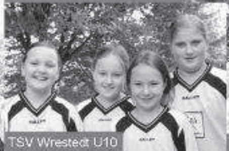
TSV Wrestedt U10